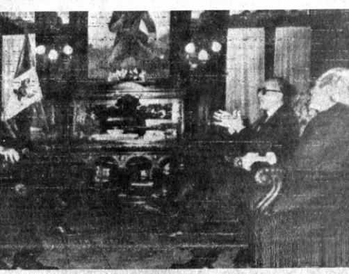
Terry conversa con Calvo Sotelo en la Casa de Gobierno. Se hallan también el embajador español en Lima, Pedro Pérez Llorca, y el Cancellier español José Pedro Pérez Llorca.