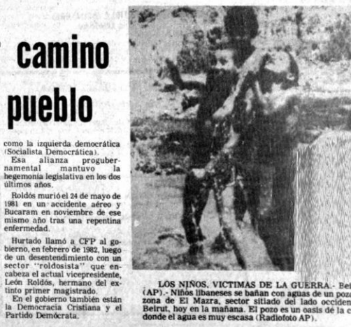
LOS NIÑOS VÍCTIMAS DE LA GUERRA. Niños libaneses se bañan con agua de un pozo en la zona de El Mazra, sector sitiado del lado occidental de Beirut, hoy en la mañana. El pozo es un oasis de la ciudad donde el agua es muy escasa.