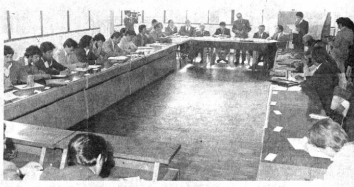
CONFERENCIA UNIVERSITARIA.- Rectores y dirigentes estudiantiles iniciaron ayer, en La Paz, una conferencia extraordinaria para analizar los problemas económicos del sistema universitario nacional. La reunión será clausurada hoy.

Se le consultó si el gobierno iba a imponer alguna clase de penalidades, ante la falta de cumplimiento imprescindible como el de los transportes. «Considero que la mayor sanción para ellos - dijo - es no cumplir su obligación y su deber de ciudadanos. Eso, para mí, es la mayor penalidad que tienen».