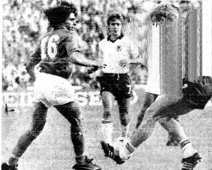
BRIEGL EN ACCION. Madrid, 11. (AP).- El peligroso jugador alemán Hans Peter Briegel disputa el balón con el italiano Bruno Conti ante la mirada de

las selecciones de Italia y Alemania jugaron hoy en el estadio "Santiago Bernabéu".