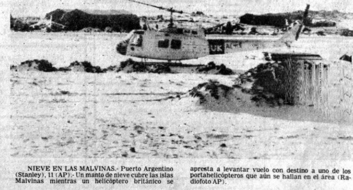
NIEVE EN LAS MALVINAS.- Puerto Argentino (Stanley), 11 (AP).- Un manto de nieve cubre las islas Malvinas mientras un helicóptero británico se apresta a levantar vuelo con destino a uno de los porta-helicópteros que aún se hallan en el área.

versaciones con Habib en Beirut. Varios ministros expresaron su preocupación por el fracaso de Habib en lograr resultados y agregó Radio Israel. Mientras tanto, el comando militar informó que israelíes y palestinos se disparaban con cohetes y cañones en el sudeste de Beirut. Un comunicado dijo que los guerrilleros dispararon bazucas y cohetes contra las posiciones de avanzada de Israel cerca de Rehan y Baabda, y que las fuerzas israelíes apuntaron su fuego hacia sitios guerrilleros en el sector de Burj El-Baranjeh y cerca del estado de Beirut. El comando informó que tres soldados israelíes resultaron heridos como consecuencia de esas acciones.