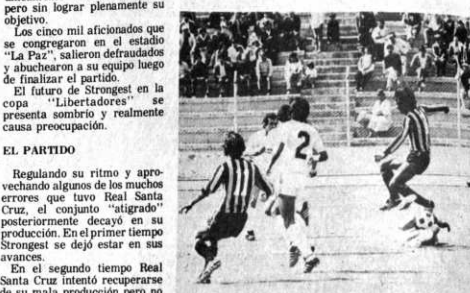
POCO FUTBOL: A un mes de la Copa Libertad de América, Strongest no encuentra la fórmula para dar un buen espectáculo. Jugó mal ayer y dejó gran duda en torno a su ofensiva.

LONDRES, JUL. (EFE).- El tenista norteamericano John McEnroe, considerado número uno mundial, y cuyos frecuentes altercados con los árbitros son característica general de sus encuentros, ocupará la silla de juez en un partido entre juveniles que se disputará aquí la próxima semana. McEnroe tendrá ocasión de experimentar el otro lado de la competencia, experiencia que puede serle útil cuando se considere perjudicado por las decisiones de los jueces. "Cometerá errores, sin ninguna duda", comentó un portavoz de una firma de equipamiento deportivo, organizadora del acontecimiento.