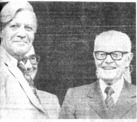
EL ENCUENTRO.- Madrid 11 (AP).- El partido final por el torneo mundial de fútbol fue ocasión para un encuentro informal entre el Cancellier alemán Helmut Schmidt (izquierda) y el Presidente italiano, Sandro Pertini (derecha), que ocuparon el palco oficial junto al rey Juan Carlos y la reina Sofía. El equipo italiano ganó el torneo mundial, imponiéndose al seleccionado alemán por 3 a 1.