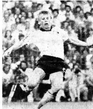
DESPEJE. Madrid, 11. (AP).- El mundialista alemán Bernd Forster aparece despejando uno de los muchos ataques del equipo italiano en el partido que

Alemania. Rossi se consagró máximo goleador del Mundial de Fútbol. Altobelli aparece a la izquierda. En el suelo el alemán Bernd Forster. (Radiofoto AP).