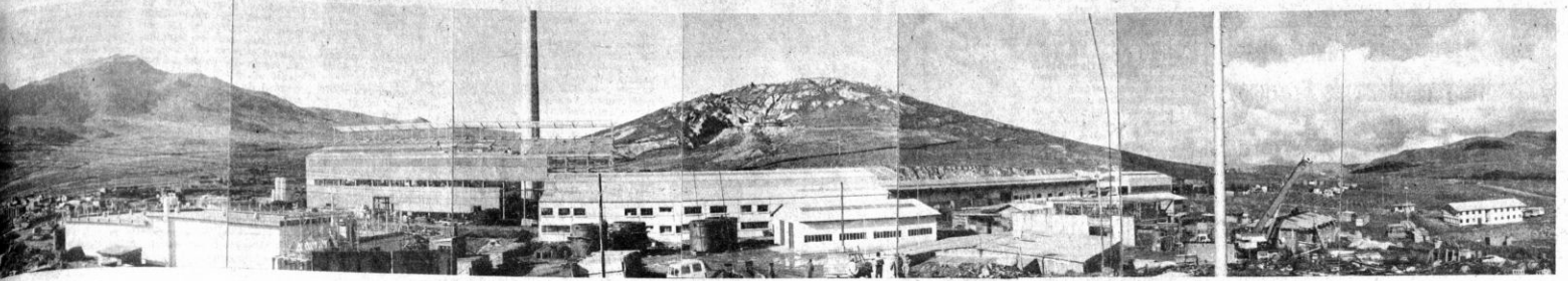
Busca de un acuerdo nacional