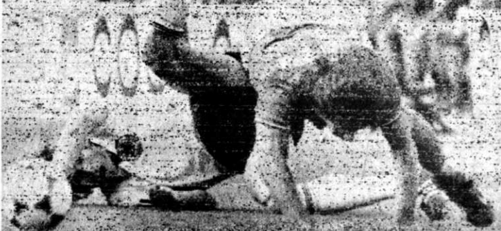
ROSSI EN EL SUELO. Madrid, 11. (AP).- El mundialista italiano Paolo Rossi cae al suelo, empujado por un jugador alemán luego de convertir el primer gol italiano frente a Alemania Federal. Rossi tuvo un

otros jugadores. Italia se coronó Campeón Mundial de Fútbol España-82 (Radiofoto AP).