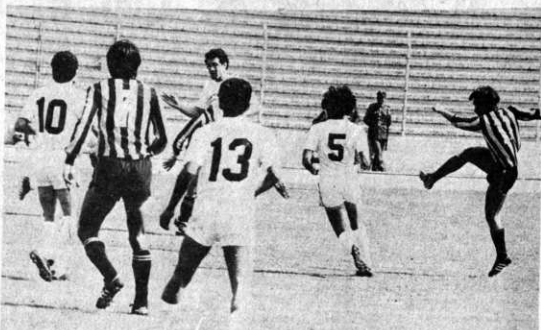
MAL PARTIDO: The Strongest ganó a Real Santa Cruz en un mal partido. Los cinco mil aficionados que se congregaron en el estadio "La Paz", salieron descontentos con la producción de su equipo.