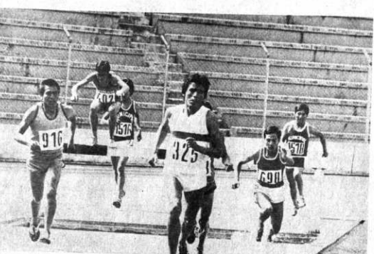
3.000 MIL METROS: La prueba de la jornada atlética con obstáculos alcanzó rotundo éxito. Se cumplió dentro el calendario de la Asociación Departamental.