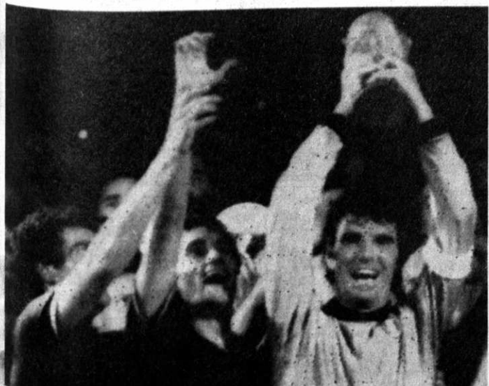
DINO ZOFF con la copa FIFA para Italia

El partido con Polonia depararía a los franceses otro resultado injustamente adverso como despedida de este Mundial. Tras dominar por momentos abrumadoramente a un equipo polaco reforzado con la reaparición de algunos de sus mejores valores pero obligado a jugar de contragolpe, la brillante selección gala pagó con otra derrota por 3-2 las fallas del arquero suplente Jean Castañeda.