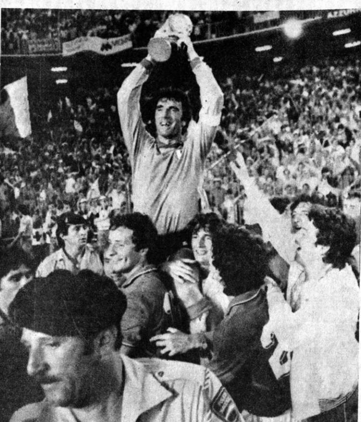
DINO ZOFF, capitán de Italia, con la copa del Mundo

Brasil perdió en básquetbol PANAMA, JUL. (EFE).- Guillermo Quiñones fue uno de los jugadores más destacados por el equipo caribeño. El torneo que finalizará el domingo próximo, se disputa en el "Gimnasio Nuevo Panamá", el que también participan a Panamá. Los puertorriqueños lleven la iniciativa en el primer juego, pero, en la segunda, el que jugarán los equipos de Brasil y Paama. La "Copa Latina" es la antecesa del Campeonato de baloncesto que se celebrará en Colombia, en el mes de agosto próximo, en el que jugarán los equipos de Brasil y Paama.