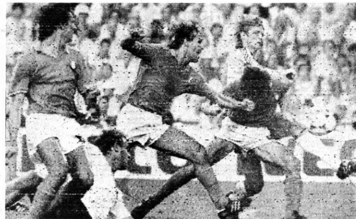
GOL DE ROSSI. Madrid, 11. (AP).- Paolo Rossi, derecha empalma certero, cabezazo a un balón logrando así el primer gol de Italia en su partido contra

Árbitro: Arnaldo César Coelho, Brasil, con Abraham Klein, Israel y Vojtech Christov, Checoslovaquia.