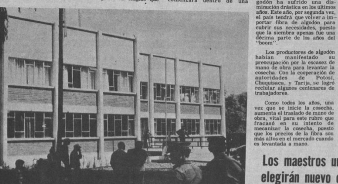
TRANSITO.- Vista del nuevo edificio para las dependencias del Servicio de Tránsito en Tarija. La inauguración dio lugar a un acto que contó con la presencia de los ministros de Aeronáutica y del Interior, y del comandante de la Policía Boliviana.

Recordó que existe una resolución expresa del 28 de agosto de 1981, que faculta aplicar medidas destinadas a erradicar la inmoralidad funcionaria.