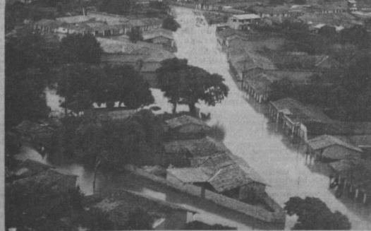
REBALSE DE RIOS.- Los ríos Yacuma, Rapulo y Bio, entre otros, que confluyen en la población de Santa Ana, rebalsaron, originando un enorme lago, que se extiende por miles de kilómetros cuadrados, en las