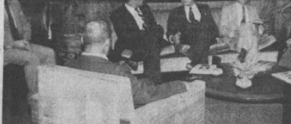
VISITA OFICIAL.- El embajador de Francia, acompañado de miembros de esa misión diplomática, realizó una visita oficial a Cochabamba, donde tomó contacto con las autoridades departamentales y de la Universidad de San Simón. La foto corresponde a su presencia en la Alcaldía.

POLICONSULTORIO ALAMEDA EDIFICIO ALAMEDA (PRADO)