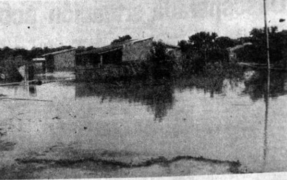
INUNDACIONES. - La crecida del caudal de los ríos en todo el departamento del Beni ha causado la inundación de muchas poblaciones; toda la provincia Moxos está cubierta por el agua y los informes de Yacuma son también alarmantes. La foto muestra el barrio de Pompeya, al sur del Trinidad, que se halla anegado.

El director distrital de esa repartición atribuyó el hecho a las recientes medidas de reordenamiento, dictadas por el gobierno, a las fiestas de carnaval y a que solamente fueron 18 días hábiles de actividad, durante el señalado mes.