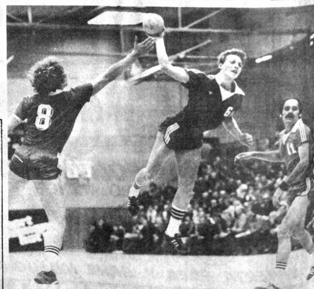
BAIJANMANO.- El balonmano es un deporte que está ganando cada vez más adeptos en la República Federal de Alemania. En la foto, un partido entre equipos de primera categoría, con lleno total del gimnasio INTER NATIONES.