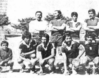
DE POTOSÍ.- Equipo de la Corporación de Desarrollo de Potosí, animador del torneo de fútbol auspiciado por el Servicio de Aguas Potables.

Es increíble como existe un tipo de siete jugadores nacionales en cancha, pero en realidad los clubes cuentan con sus plantones con quince o veinte jugadores extranjeros. Es decir, que también se preocupan de que los suplentes sean extranjeros. La política que ha ocasionado y seguirá ocasionando un plantonamiento para la promoción de jugadores juveniles nacionales, permite además crear una falsa aureola de éxitos en los clubes, conquistando títulos nacionales, pero que al cabo de uno o dos años, ven otra vez desmantelados sus equipos por el retiro de los extranjeros a sus lugares de origen.