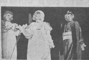
TITRERES.- El Taller de Titreres de la Casa Juvenil "Juanito Pinto" ofrecerá un programa especialmente diseñado al público infantil, a las horas 15.00 del miércoles 3 de marzo, en el Teatro Municipal. Tres obras serán representadas: Cuadro en pantomima, Sinfonía de la mar y monaje.