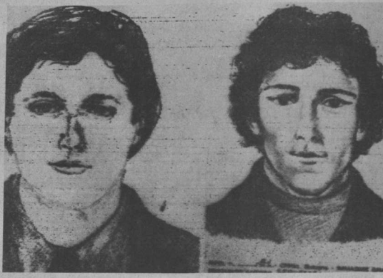
RETRATO COMPUESTO. - Verona, Italia, 8 (AP). - Retrato compuesto difundido por la policía de Verona, de los dos presuntos terroristas que aquirieron la vagoneta en el suceso del Gral. James Doxey, en diciembre pasado.