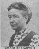
SIMONE DE BEAUVOIR

1973 - Rhodesia cierra sus fronteras en un esfuerzo por detener el ingreso de fuerzas nacionalistas negras. Israel y