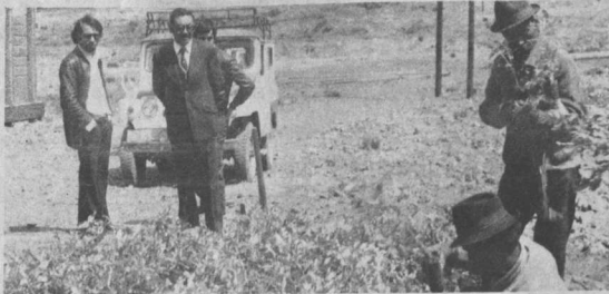
FORESTACION.- En las inmediaciones del cerro rico, la Corporación de Desarrollo de Potosí inició la plantación de 3.000 arbolitos e hizo un llamado a la ciudadanía para que se preocupe por el cuidado de estas plantas.

De La Paz, se anunció el envío de técnicos en sanidad animal del SENAR que vienen con cincuenta mil dosis de vacuna contra la aftosa. A nivel local, fue movilizado personal de la Corporación de Desarrollo de Potosí para la plantación de 3.000 arbolitos e hizo un llamado a la ciudadanía para que se preocupe por el cuidado de estas plantas.