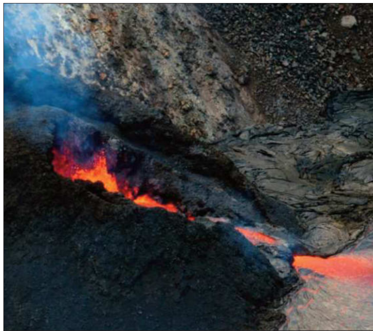
HAWÁI. El respiradero que alimenta la lava hacia la cima del Kilauea.

transmite videos en vivo en la red social YouTube desde tres cámaras alrededor del volcán.