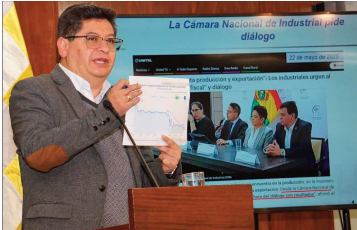
AUTORIDAD. El ministro de Economía, Marcelo Montenegro, brindó una conferencia de prensa.

Sin embargo, el titular de Economía consideró que ya se ven los primeros efectos, pues el dólar en