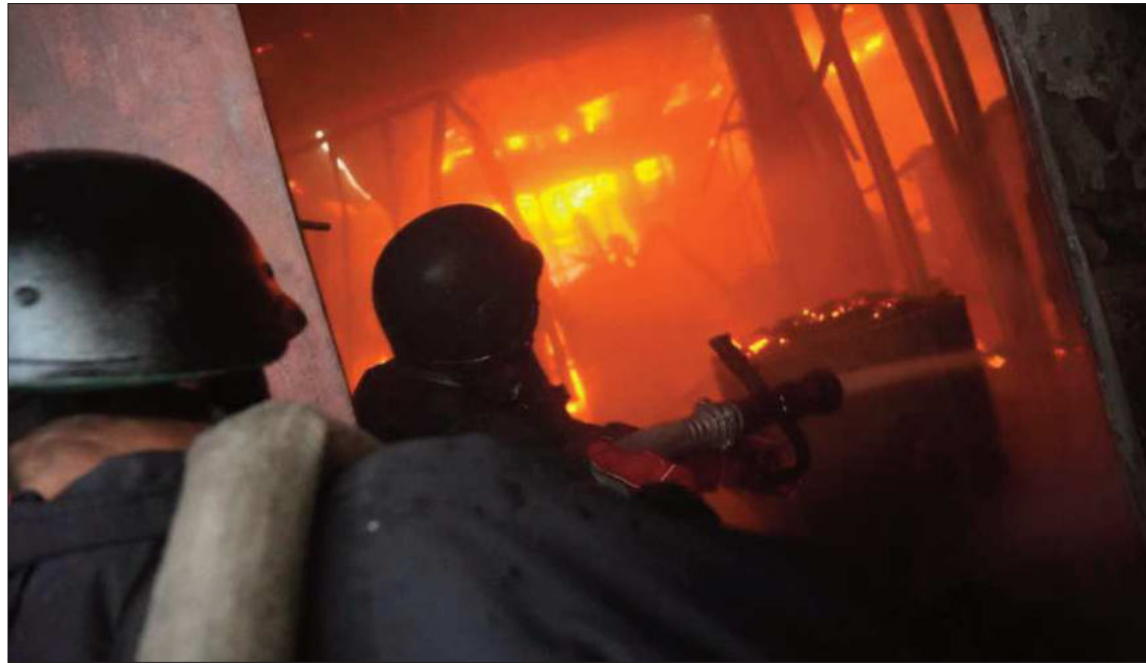
ESTRAGOS. Voraz incendio tras otra oleada de bombardeos de las fuerzas rusas sobre Ucrania.

Moscú restó importancia a las críticas de Trump y argumentó este lunes que Putin "está hacien-