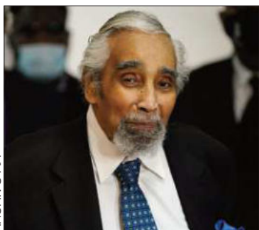
Charles Rangel en un acto.

Fue decano de la política contemporánea de EEUU, murió a los 94 años