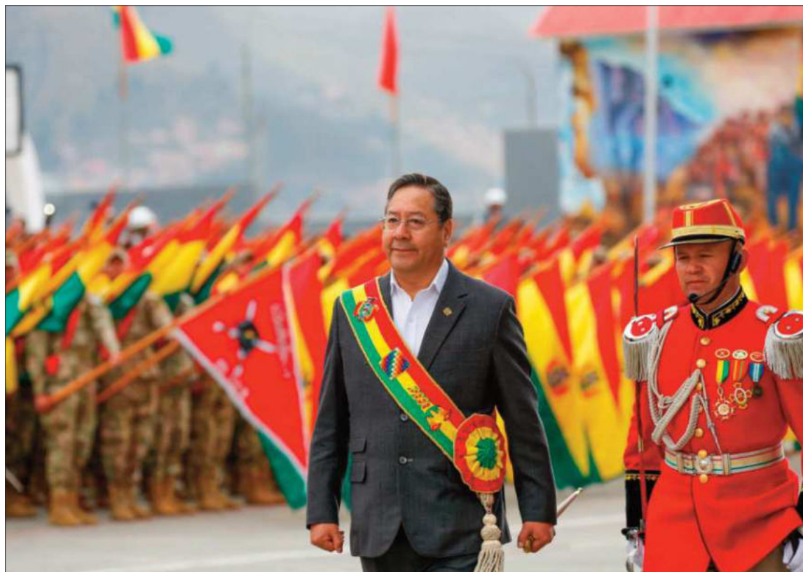
ANIVERSARIO. El presidente Luis Arce pasa revista a los efectivos de los Colorados de Bolivia, ayer.

Arce se refirió a la protesta en su discurso ante la comunidad castrense. “Buscan convulsionar el país y, finalmente, fracturar el territorio y enfrentarnos entre