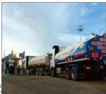
Cisternas en planta de Senkata.

Se prevé que las filas por carburantes se resuelvan durante esta semana