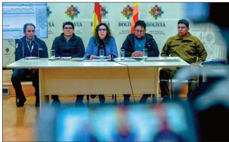
MINISTERIO DE SALUD

Educación. La decisión está en manos de las direcciones de Educación