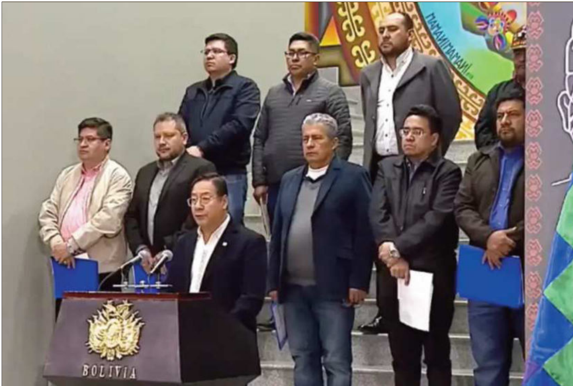
ECONOMÍA. Anuncio de 11 medidas y siete decretos por parte del presidente Arce y su gabinete.

Economía. Diferentes sectores se movilizaron ayer por la situación económica del país, también hubo bloqueos en carreteras