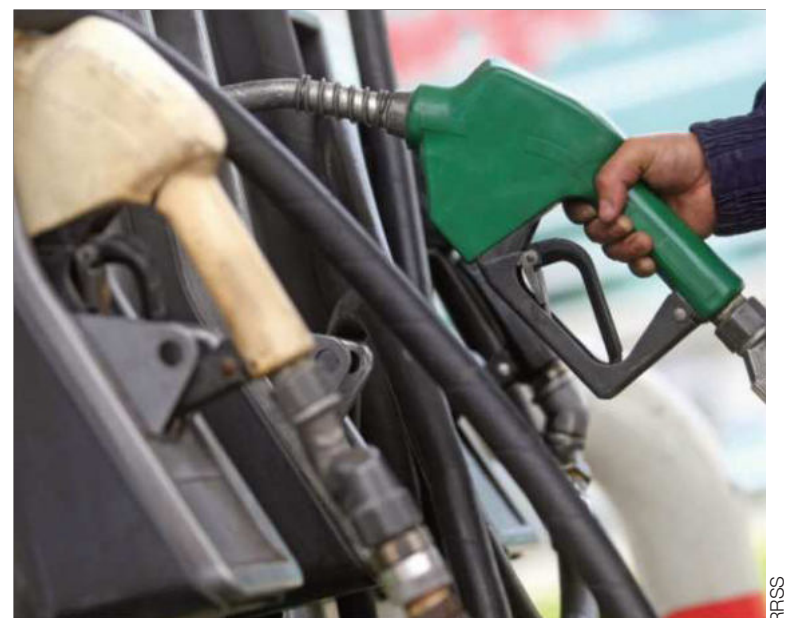
CRISIS. Venta de combustible subvencionado en una gasolinera.