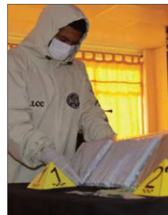
Muestran material decomisado.

“En prevención de la protesta pacífica, desde el 25 de mayo