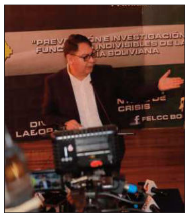
El viceministro Jhonny Aguilera.

El Gobierno atribuye al evismo el uso de dinamita y detonadores