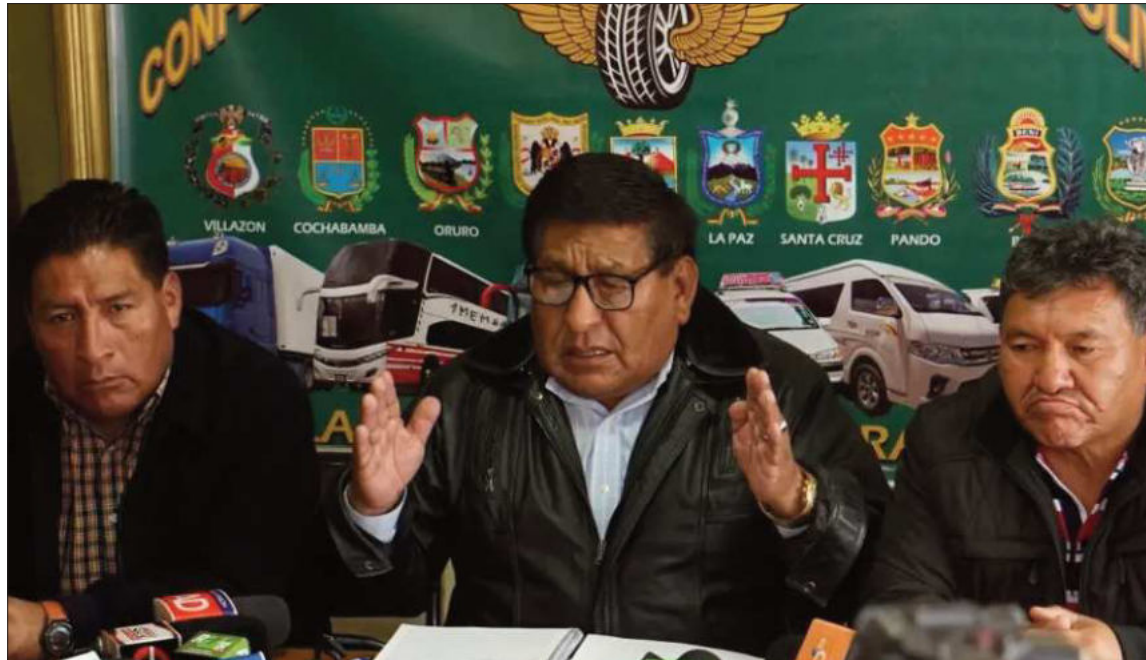
CONFERENCIA. Dirigentes de la Confederación de Choferes de Bolivia en rueda de prensa.