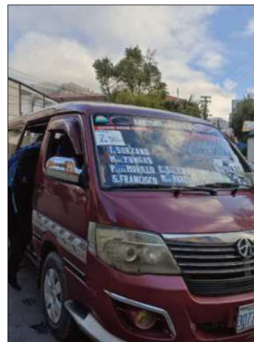
Un minibus de transporte público.

discapacidad, el 38% realiza el pago de la tarifa diferenciada, mientras que al 62% no se beneficia con el cobro.