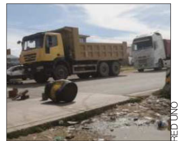
Bloqueo de transportistas.

Asimismo, advirtieron con radicalizar sus medidas de presión si en las siguientes horas.