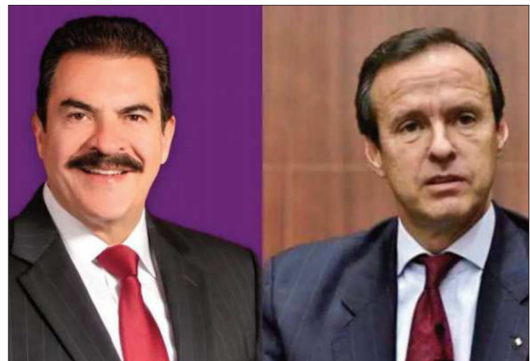
POLÍTICOS. Los candidatos Manfred Reyes Villa y Jorge Tuto Quiroga.