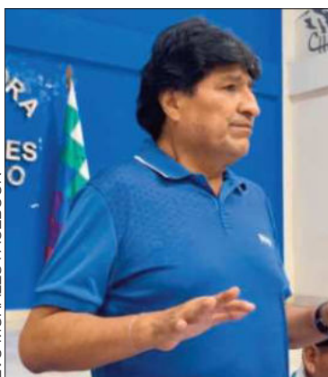
El expresidente Evo Morales.

El expresidente afirmó que llevará a magistrados a esas instancias