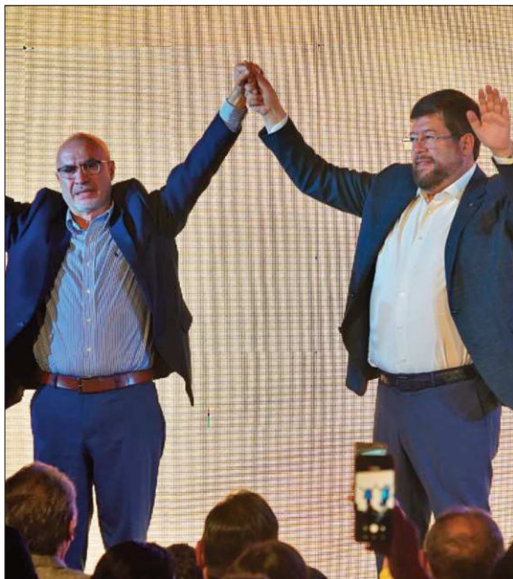
ALIANZA. La fórmula de Unidad fue presentada en una convención.

José Luis Lupo, economista de profesión, fue ministro de Hacienda, Desarrollo Económico, Informaciones, Gobierno y Presidencia durante los mandatos de Jaime Paz Zamora, Hugo