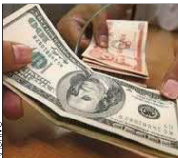
Sube el tipo de cambio del dólar.

Se observa el mismo comportamiento en el mercado del criptodólar