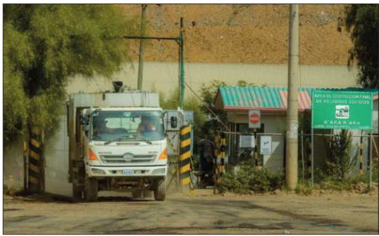
INGRESO. Un vehículo recolector de basura ingresa a K'ara K'ara.