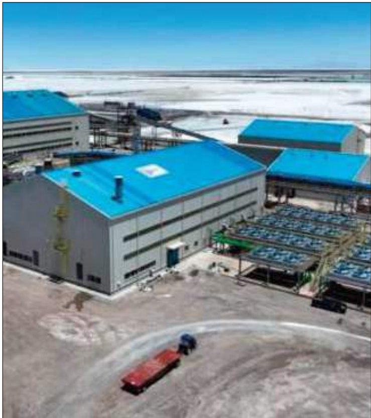
COMPLEJO. La planta industrial de litio, en Potosí.

bas empresas, que se presentaron a convocatorias internacionales y ofrecieron a Bolivia tecnologías óptimas y amigables con el medioambiente.