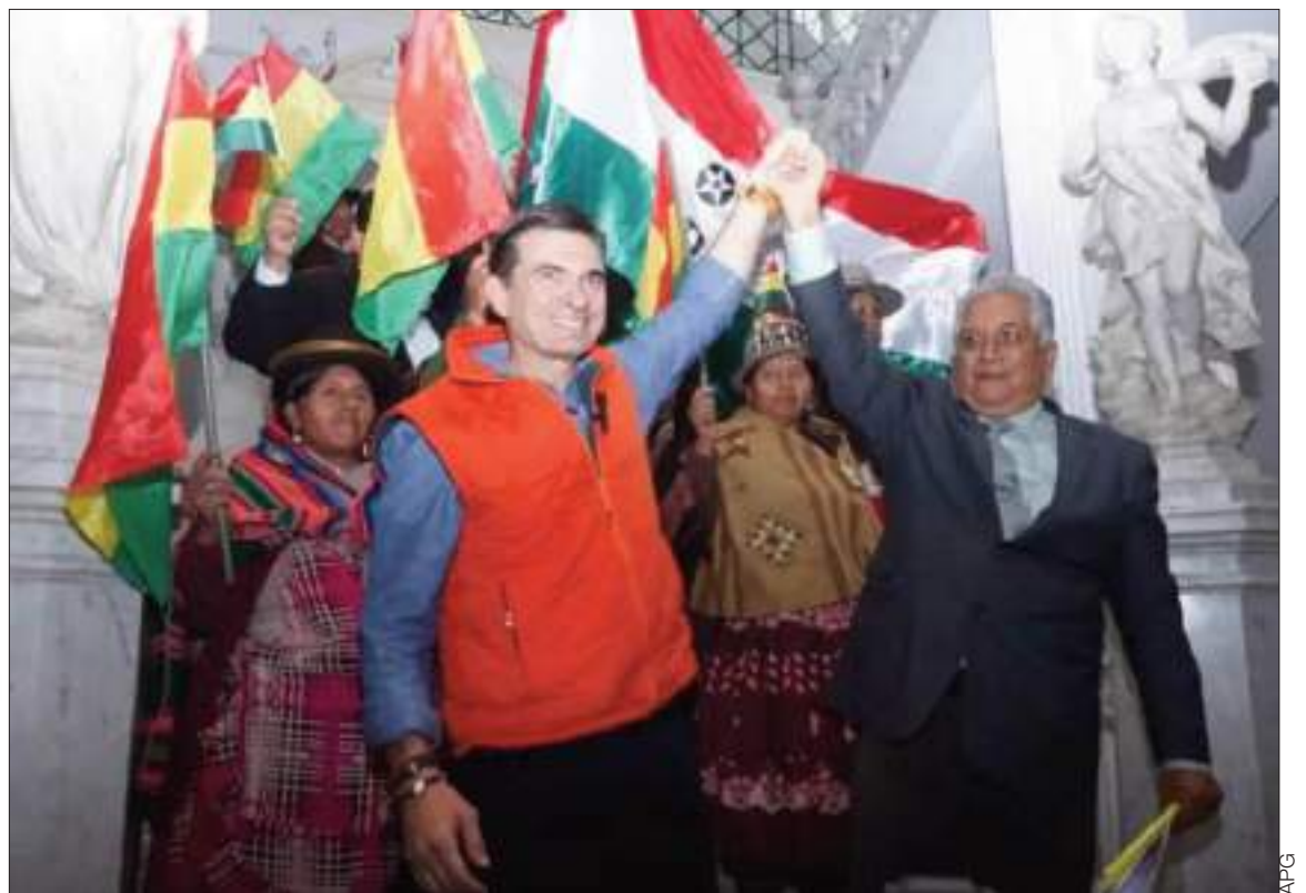
CANDIDATO. Presentación del acuerdo con el senador Rodrigo Paz para participar de las elecciones.