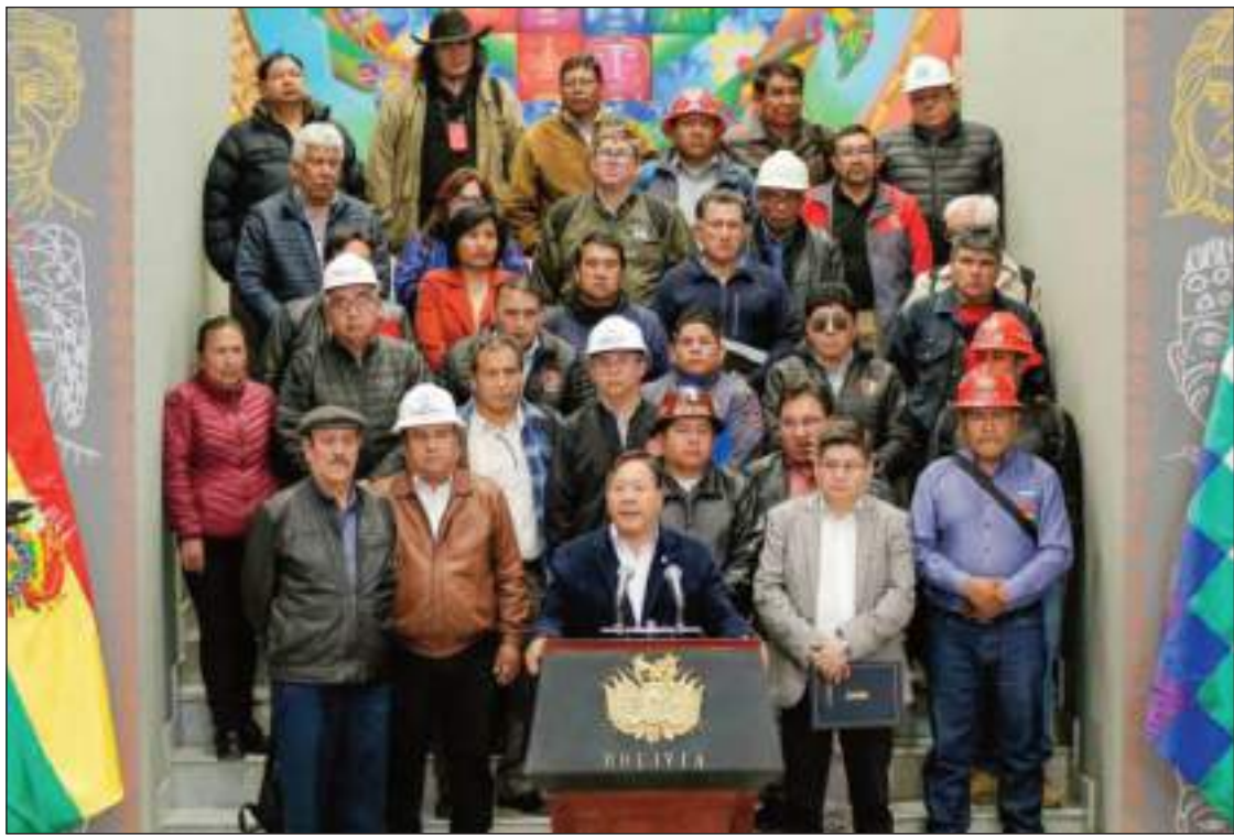
ANUNCIO. El presidente Luis Arce y dirigentes de la COB anuncian el incremento salarial 2025.