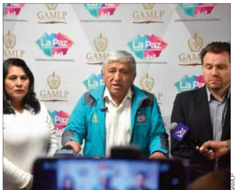
CONFERENCIA. El alcalde Iván Arias en rueda de prensa.

“El primer objetivo es sacar al alcalde municipal de La Paz de la