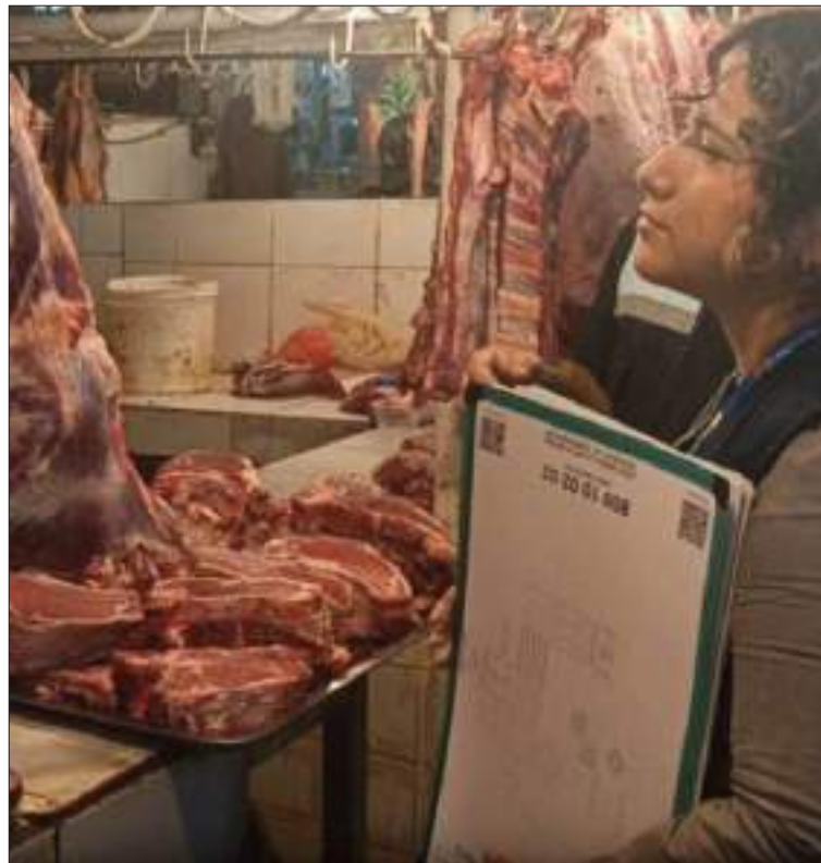
VETO. La exportación de la carne de res aún está vetada.

El 5 de febrero, el Gobierno activó un veto a la exportación de carne con el objetivo de obli-