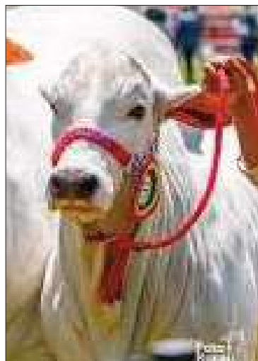
La vaca fue vendida a Brasil.

La vaca, de origen boliviano, fue vendida a Brasil y es un logro para la genética