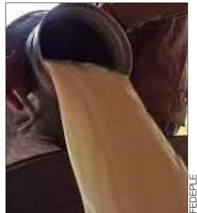
Producción de leche.

El representante enfatizó que su demanda es técnica y legítima, no responde a intereses políticos.