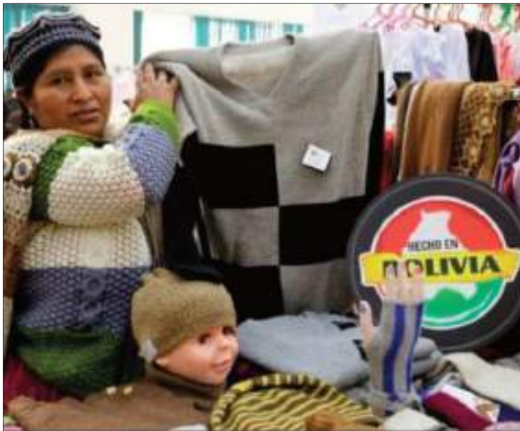
MICROEMPRESARIA. Mujer ofrece productos con sello boliviano.

Bolaños finalizó anunciando una reunión del sector para asumir medidas de presión. “Tocarnos en las calles para ver si el pueblo tiene que pagar las consecuencias de las malas acciones del gobierno”, concluyó.