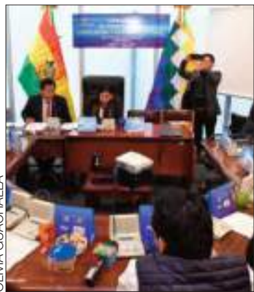
La Comisión de Constitución.

La comisión convocó a una sesión ordinaria para abordar las normas