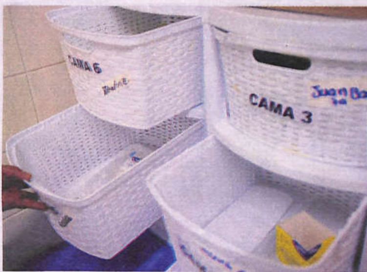
Las bandejas de medicamentos permanecen vacías