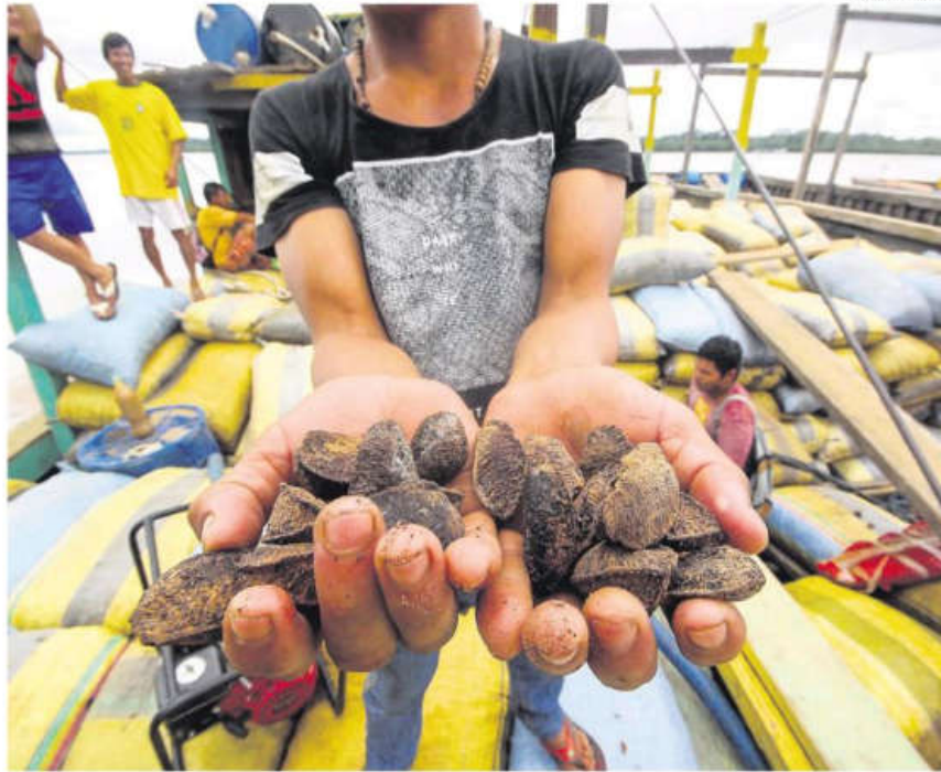
Los principales departamentos exportadores de castaña son Santa Cruz, Beni, Pando y Cochabamba

Agregó que todos los contratos firmados con los compradores en el país del norte, hasta antes de las medidas arancelarias, están ase-