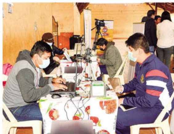
Los ciudadanos acuden a los centros de empadronamiento biométrico

"Según los últimos datos de la elección pasada, el padrón electoral consta de 7,8 millones de ciu-