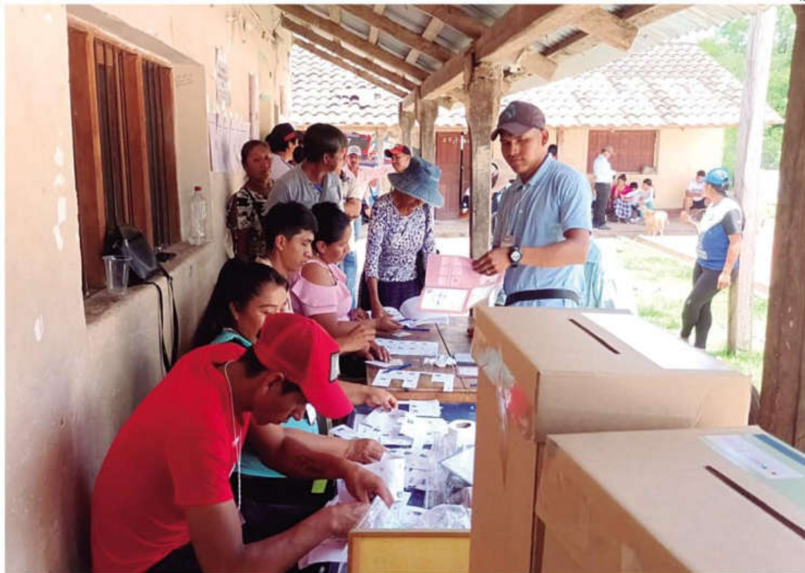
En las últimas elecciones judiciales de 2024, los benianos participaron en la jornada electoral para elegir nuevas autoridades

Bolivia ingresó en un silencio preelectoral. Comienza el control a organizaciones políticas, actores, medios de comunicación y entidades de la sociedad civil que vulneren el calendario y las normas que rigen las elecciones generales