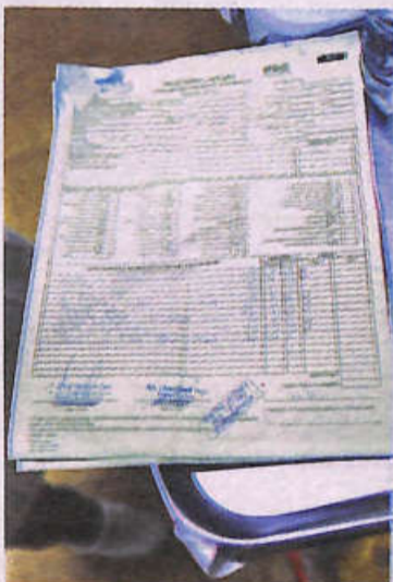
La gente muestra sus recetarios marcados con lo que falta