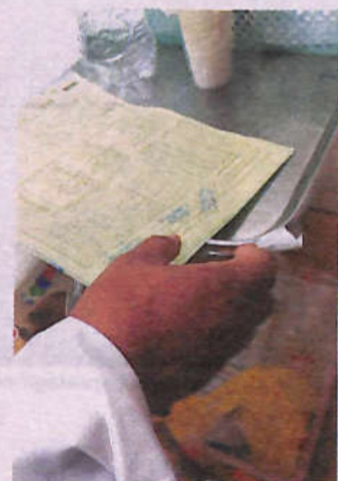
Profesionales se quejan porque faltan los medicamentos

Bs 40, mañana veremos qué dice Dios", manifestó.