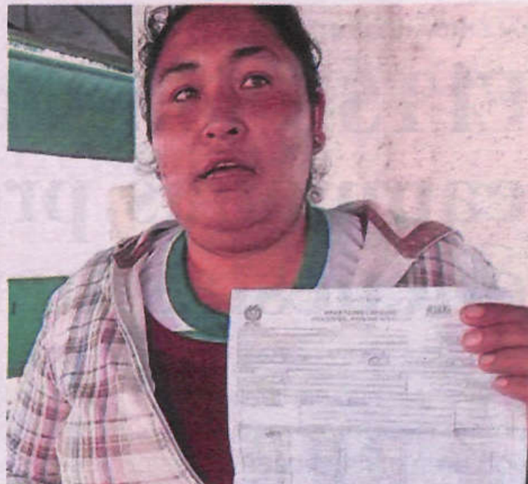
familiares ya no saben qué hacer para cubrir los remedios