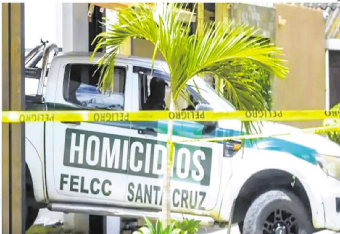
Sicarios asesinaron el 19 de febrero a un capitán de la Policía mientras salía de su domicilio en Santa Cruz. Este hecho está siendo investigado

También hay ajustes de cuentas vinculados a préstamos "gota a gota" en diferentes zonas del país.