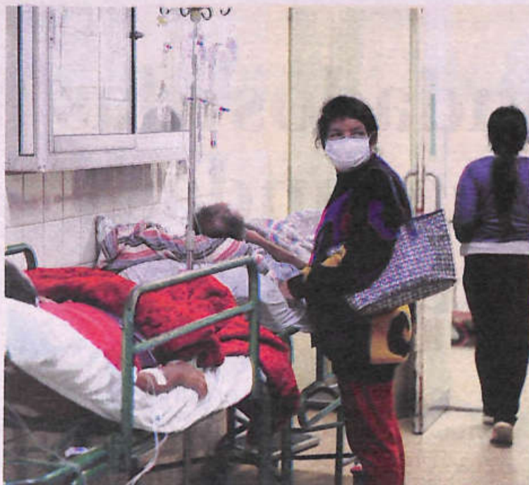
Los pasillos de emergencia también son copados por pacientes

"Pregúntele a Dios cómo le hago cada día, porque es él quien me ayuda, es el que ve para que yo pueda conseguir los medicamentos que piden para mi hijo. Ni yo sé cómo puedo seguir, porque ni comer puedo. Por ejemplo, ahora gasté Bs 1.015 y en el bolsillo tengo