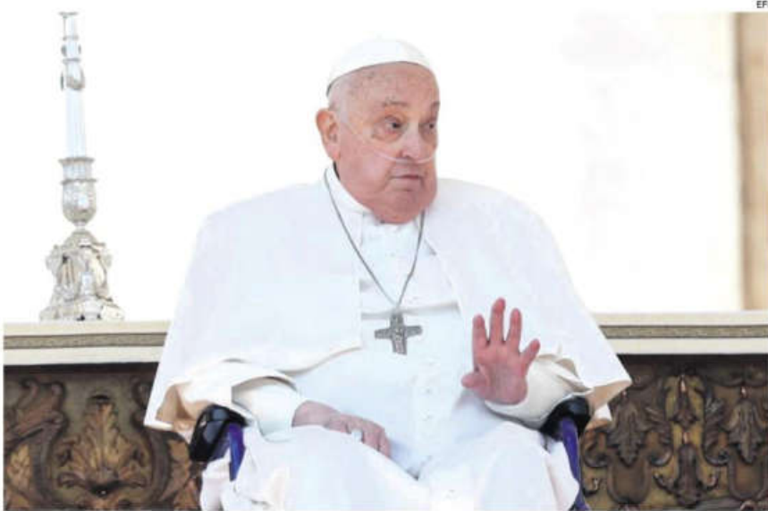
El papa Francisco reapareció en público. Con dificultad, agradeció a los feligreses presentes en la plaza