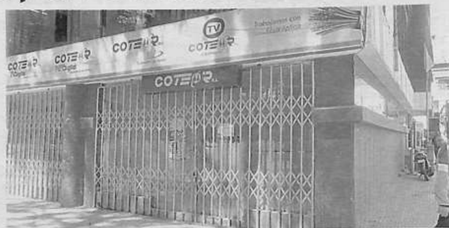
Por la movilización de los trabajadores, las puertas de Coteor se cerraron

“Estamos en un estado de emergencia, debido a que nos encontramos con un sinnúmero de problemas económicos, hemos pedido un plan de contingencia para salir de la crisis y de los problemas económicos, el Consejo de Administración hasta la fecha no lo ha puesto en mesas de trabajo, sumado a eso, se tiene el problema de contratación en los cargos de staff que tienen