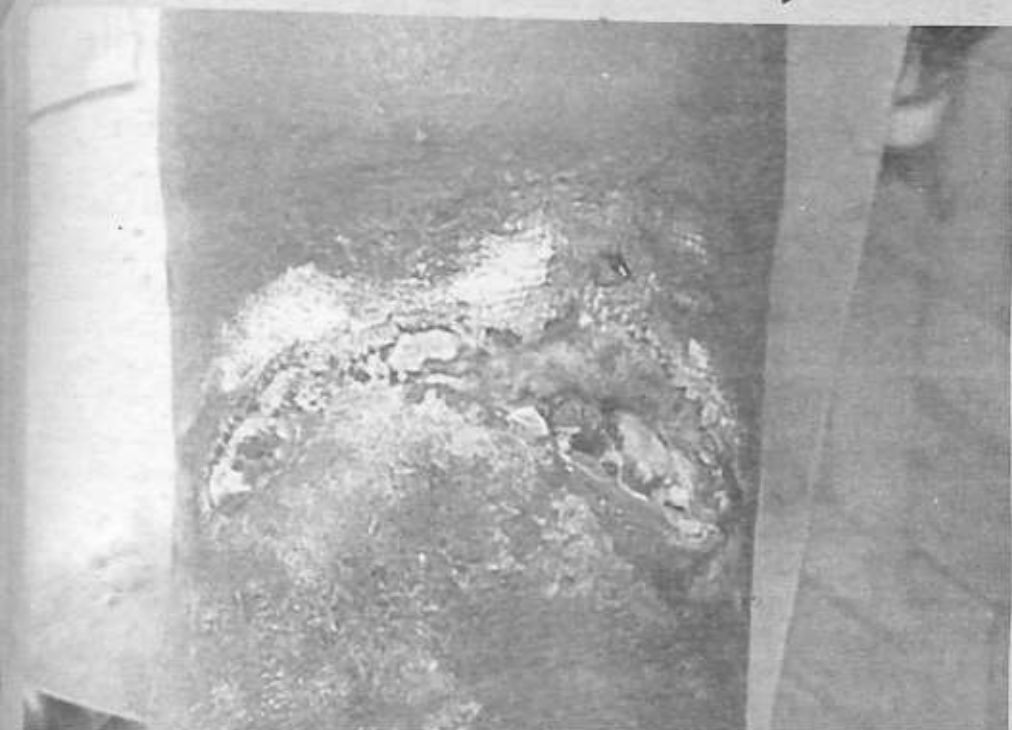
Paciente que sufre de leishmaniasis cutánea en el pie izquierdo recibe el medicamento