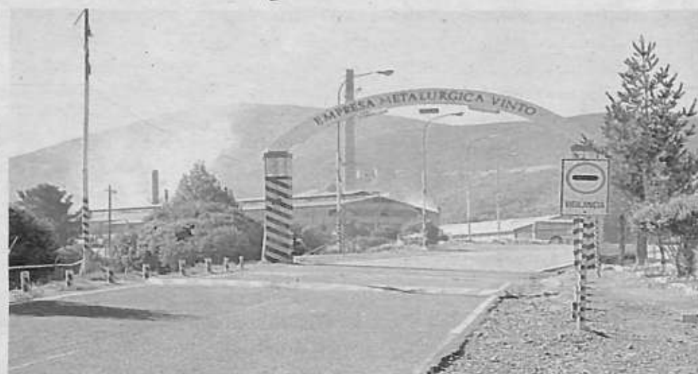
El complejo de la Empresa Metalúrgica Vinto /REFERENCIAL

Hasta el mediodía se confirmó la entrega de los $us 4 millones y ahora se espera el siguiente pago. Con esto se cumplirían