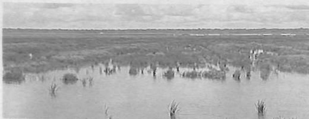
Cultivos de arroz bajo el agua

El riesgo de una pérdida sustancial de plantaciones de arroz es latente en el Beni y al menos 300 mil quintales no podrán ser distribuidos al mercado nacional, si es que no se puede recuperar más de 5.000 hectáreas de arroz que quedaron bajo el agua debido a las persistentes lluvias que se registraron en las últimas semanas.