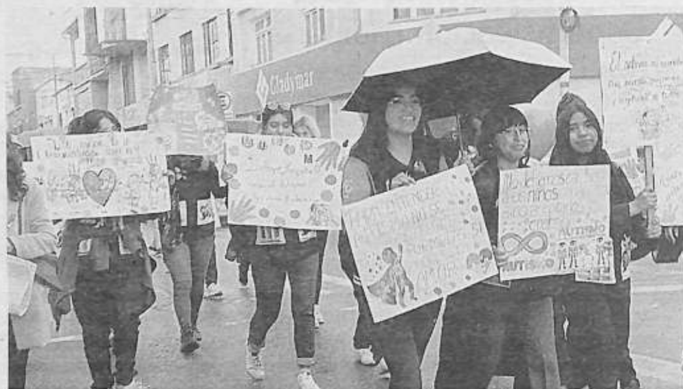
Varias personas participaron de la marcha, pese a la lluvia

Actualmente, solo 14 familias están recibiendo terapia en este centro, aunque en Acofpame hay más de 100 personas asociadas. La directora encargada de