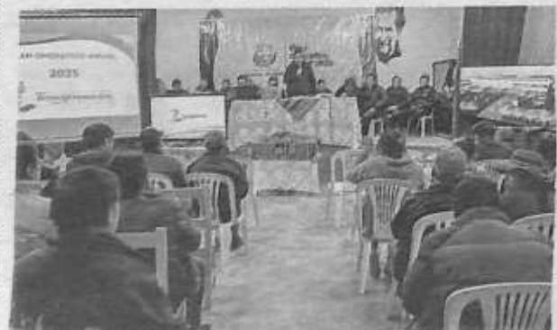
Alcaldía inicia hoy las reuniones distritales

La situación actual plantea desafíos significativos para el GAMO en cuanto a su capacidad para financiar proyectos esenciales. La reducción en los ingresos podría impactar negativamente en servicios públicos fundamentales como educación y salud, así como en infraestructura básica, como el alcantarillado.