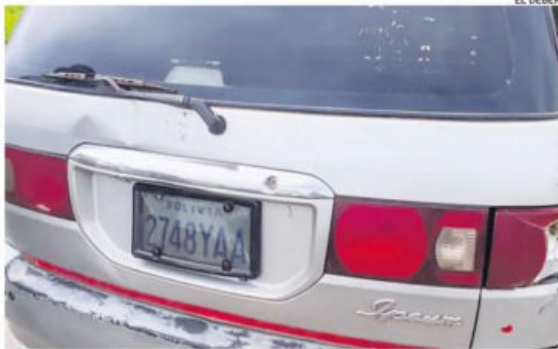
El vehículo descubierto transportando casi mil litros de gasolina

Fue en Yapacaní donde se descubrió casi mil litros de gasolina. Una turba atacó y emboscó a los policías.