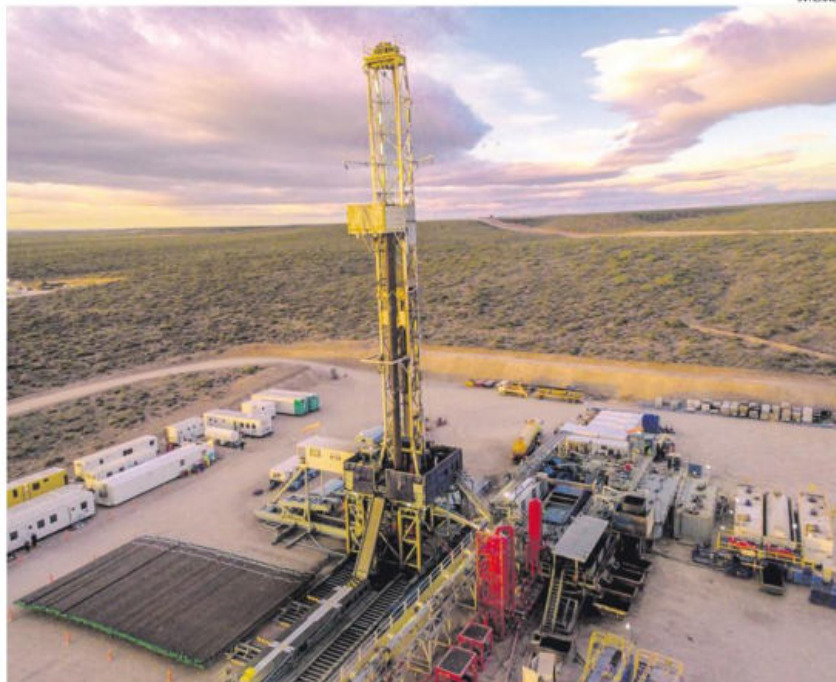
Vaca Muerta es uno de los principales yacimientos de gas natural, ubicado en el sur argentino