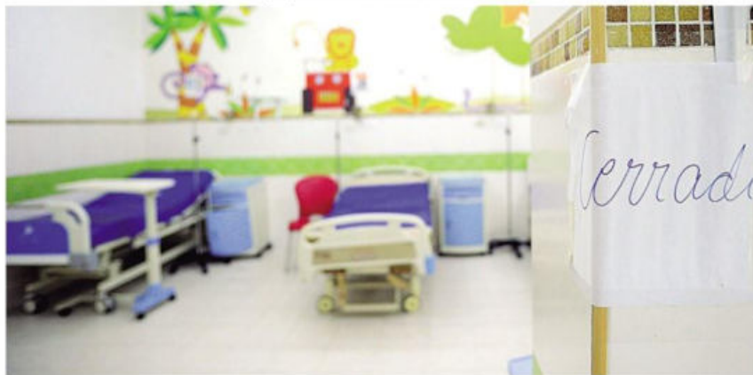
Uno de los servicios que fueron cerrados en el hospital de niños por la finalización de contratos