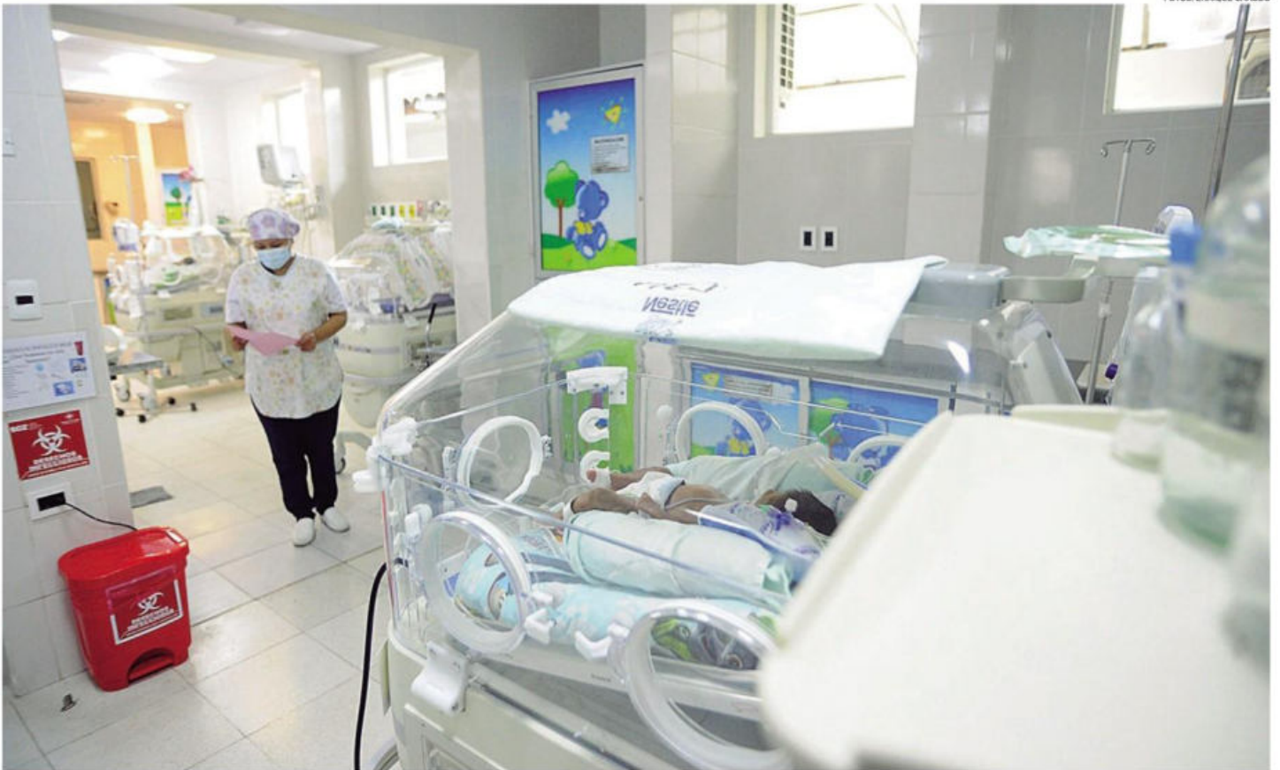
Las salas de cuidados intermedios e intensivos neonatal del hospital Mario Ortiz pueden dejar de funcionar por falta de personal