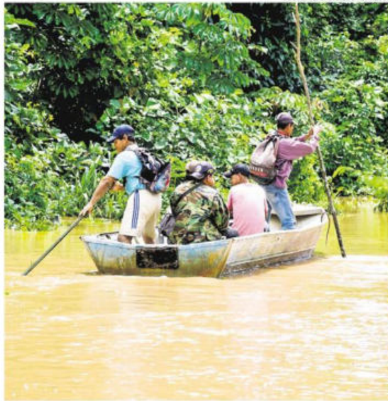
Hay comunidades que se encuentran inundadas desde hace semanas

"Hay afectados en 8 de 9 departamentos, 121 de los 340 municipios están afectados por las lluvias, es decir el 35%. Son 182.308