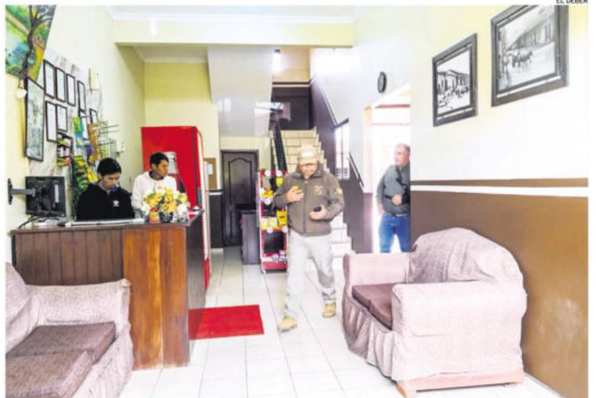
La mañana de ayer la Policía y la Fiscalía rescataron a una adolescente en un alojamiento de la capital

En las acciones participan personal de la Defensoría de la Niñez, así como fiscales especializados y efectivos policiales.