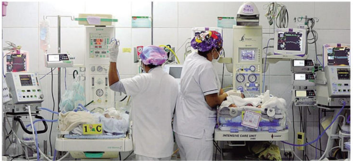
Las enfermeras deben hacer el trabajo que hacían las 12 licenciadas, cuyos contratos ya fenecieron en la maternidad

Todo el requerimiento se lo han hecho llegar al Ministerio de Sa-