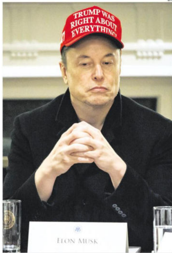
El excéntrico Elon Musk encabeza la lista Forbes de los más ricos

Por su parte, el presidente de EE.UU., Donald Trump, ha duplicado su patrimonio neto, estimado en 5.100 millones de dólares, gracias a sus criptomonedas.