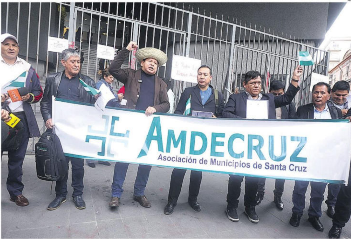
Representantes de los municipios también exigieron la aprobación de créditos internacionales a la Asamblea Legislativa Plurinacional