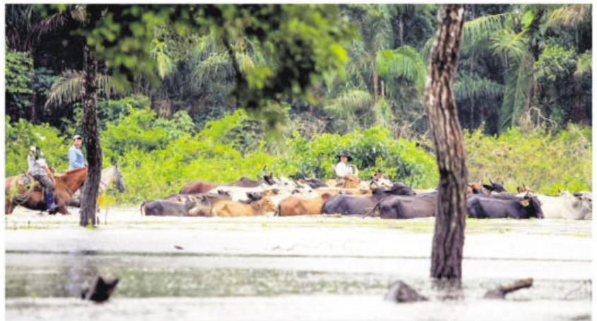
El agua no da respiro a los ganaderos que deben buscar zonas altas para salvar a sus animales