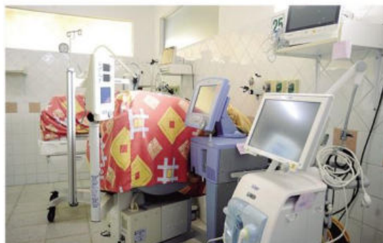
Algunos equipos en desuso en la maternidad Percy Boland

La jefa del servicio señala que antes el sector privado amortiguaba un porcentaje de los pacientes, porque había personas que pagaban un seguro, pero ahora buscan atención a un hospital público debido a la crisis. En Emergencias