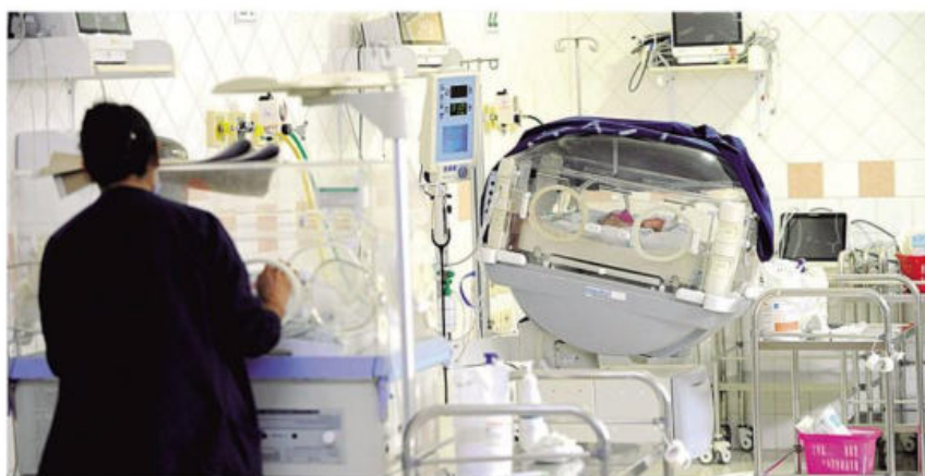
En la Percy Boland tiene que lidiar con la saturación porque están imposibilitados de derivar pacientes