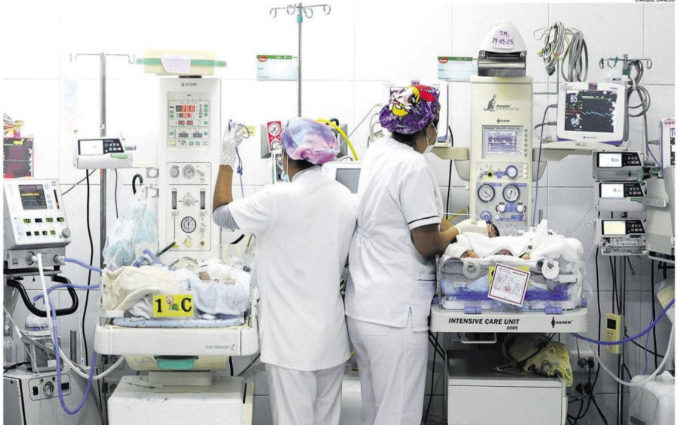
HACINAMIENTO. En la Maternidad Percy Boland falta espacio en las incubadoras. Cada una alberga a más de un bebé. El sistema está colapsado