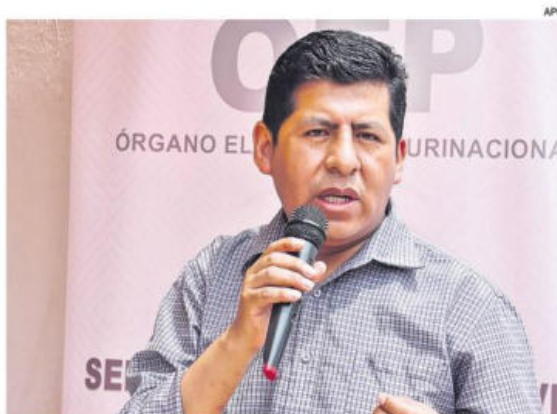
Tahuichi dijo que se iba a postergar el inicio del proceso electoral.

Las observaciones estaban dirigidas principalmente a las circunscripciones 53 (San Ig-