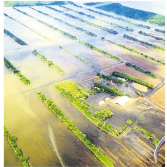
En Santa Cruz, el desborde de los ríos afecta las zonas de cultivo