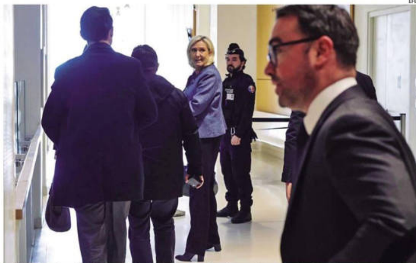
La líder ultraderechista francesa Marine Le Pen abandona la corte tras escuchar la sentencia condenatoria

LA SENTENCIA DISPONE 4 AÑOS DE CÁRCEL E INHABILITACIÓN