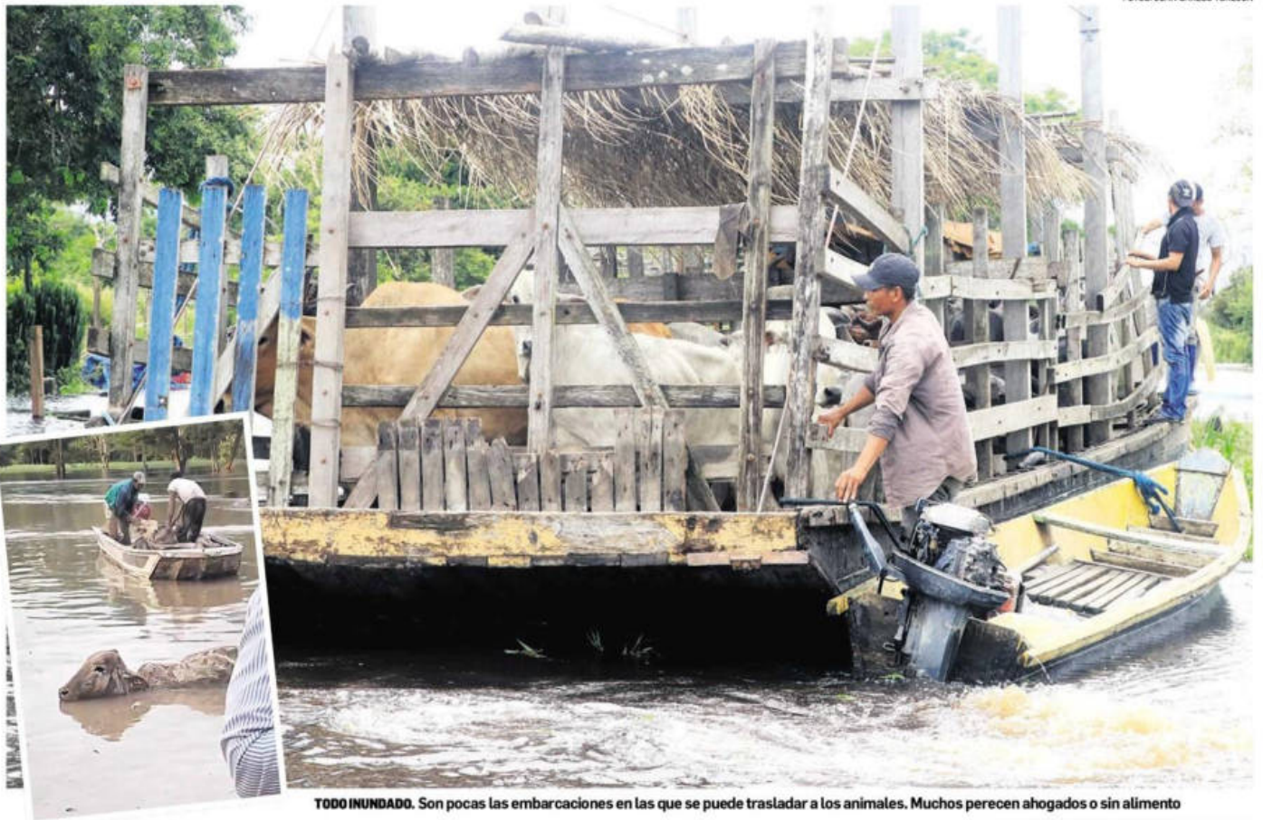
TODOS INUNDADO. Son pocas las embarcaciones en las que se puede trasladar a los animales. Muchos perecen ahogados o sin alimento