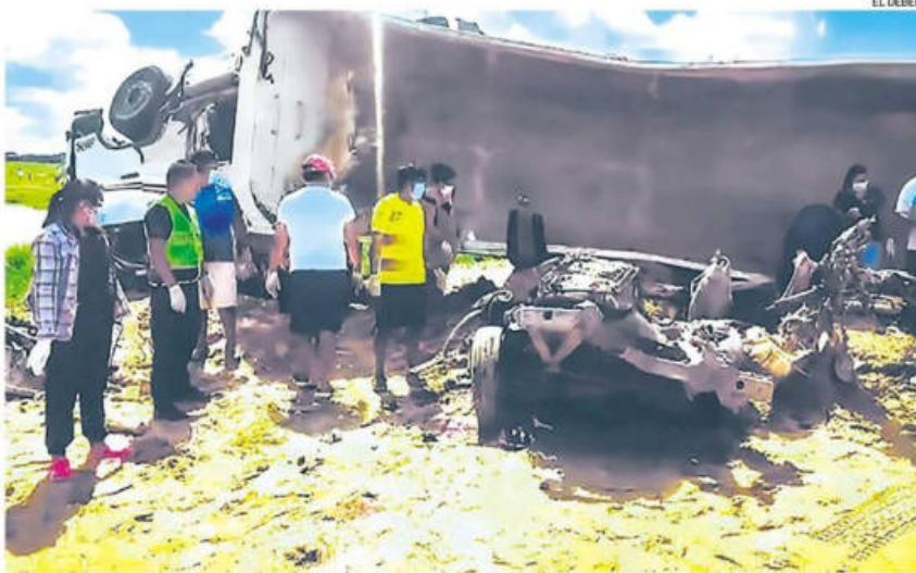
Así quedaron los vehículos después de la fatal colisión que se registró la tarde de ayer en San Julián