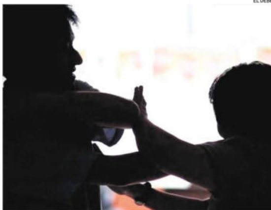
Un hombre fue enviado a la cárcel por tratar de incendiar su casa

botella con aceite, roció la casa, la motocicleta del visitante y estaba a punto de prender fuego para provocar un incendio. Al final fue reducido con ayuda de vecinos y sometido a golpes para ser entregado a la Policía.