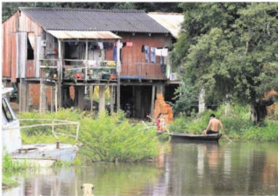
Comunidades afectadas por las inundaciones, en Beni