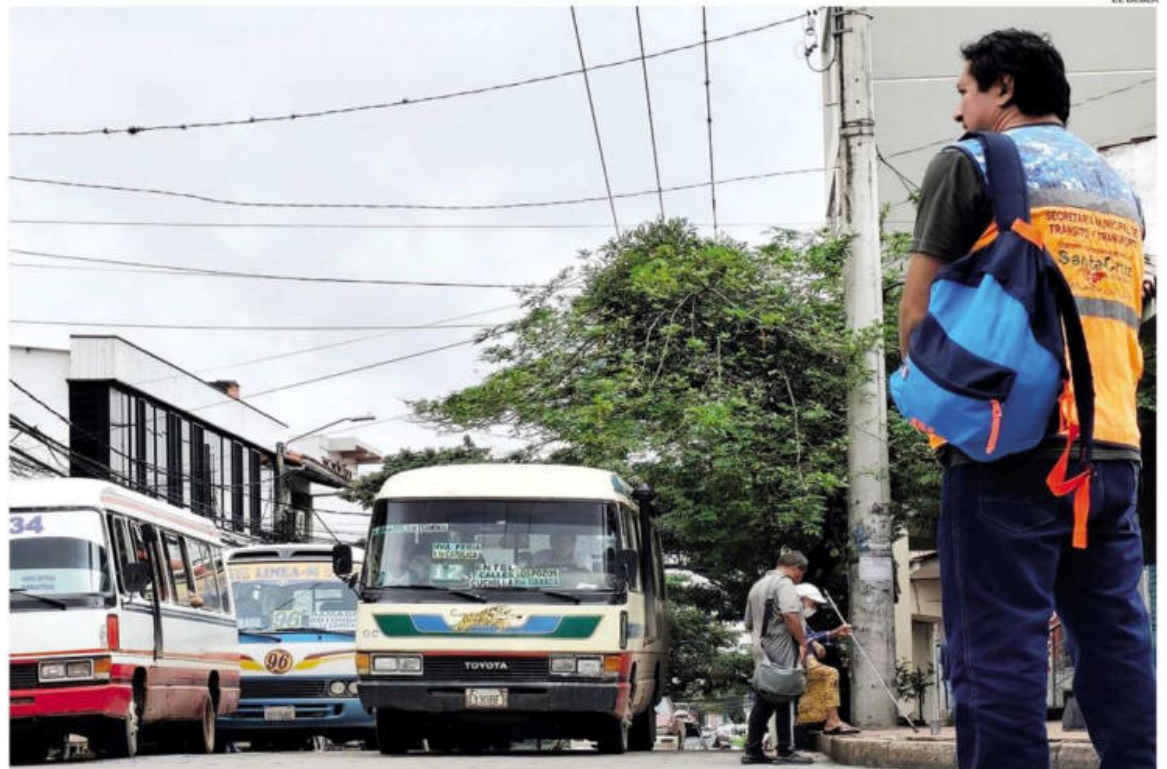
La Alcaldía estableció rutas para el transporte público urbano en el centro de la ciudad, pero algunos vecinos creen que no hubo consenso

El alcalde señala que desde este mes se ampliará el horario de los micros hasta la medianoche. Asegura que se harán cumplir los compromisos asumidos. Los vecinos se quejan porque se aplicó un incremento y se sigue con los micros viejos