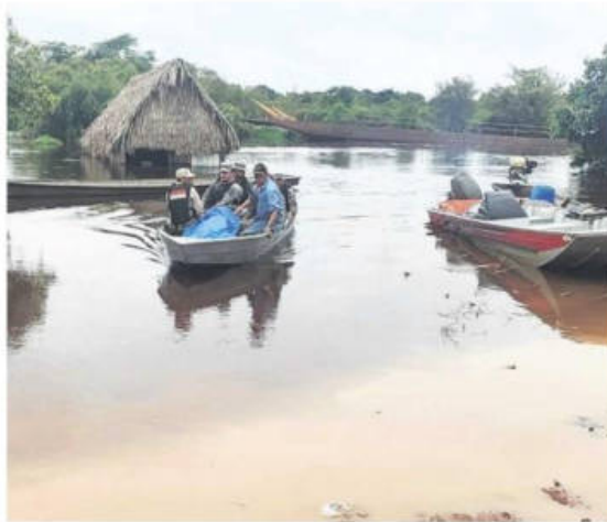
Un operativo de búsqueda y rescate de una persona en el río Rapulo

Hasta el momento se reportan 52 personas fallecidas por las lluvias