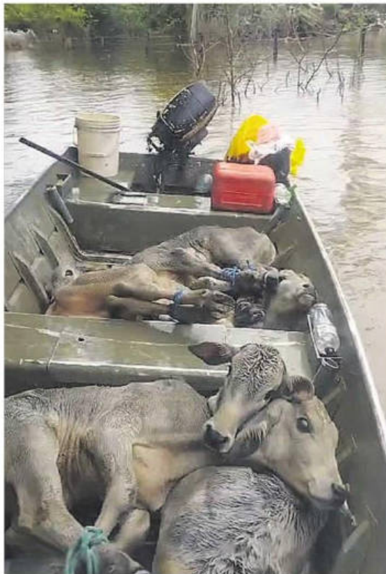
Reses rescatadas en la provincia cruceña de Guarayos

mal estado de las carreteras han encarecido no solo el arroz, sino también la carne.