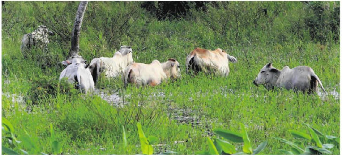
El desborde de los ríos anega zonas que antes eran caminos de tierra, habituales para el hato ganadero del departamento del Beni

Otro problema derivado de la emergencia es el alza en los precios de productos esenciales. La interrupción del transporte y el