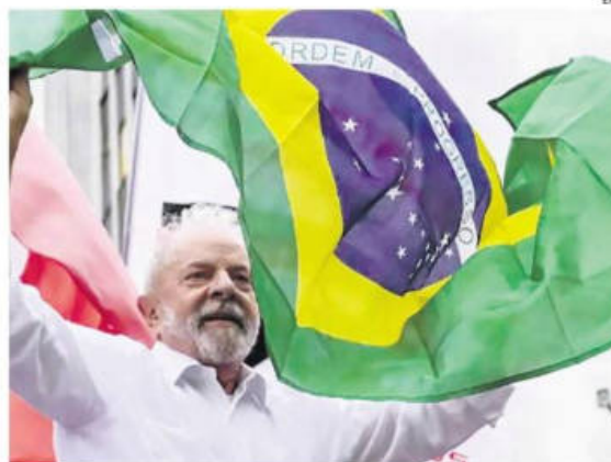
El presidente de Brasil, 'Lula' da Silva, ondea la bandera de su país

El 31 de marzo de 1964, los militares iniciaron un golpe contra el entonces presidente João Goulart y tomaron el poder bajo un régimen que se extendió hasta 1985.