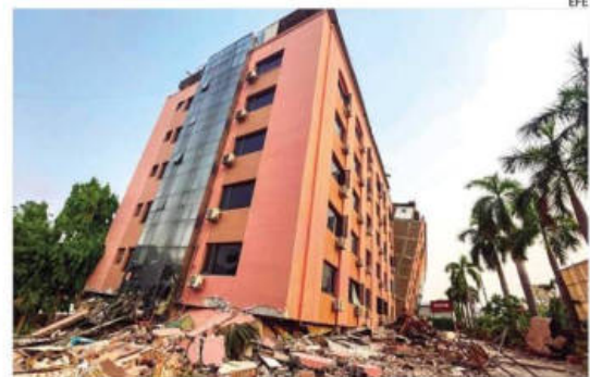
El devastador terremoto dañó numerosos edificios en Birmania

Entre los equipos que han llegado a Birmania se encuentran rescatistas de China y Rusia, ambos países con los que la junta mantiene relaciones y con más facilidad por tanto para el acceso.