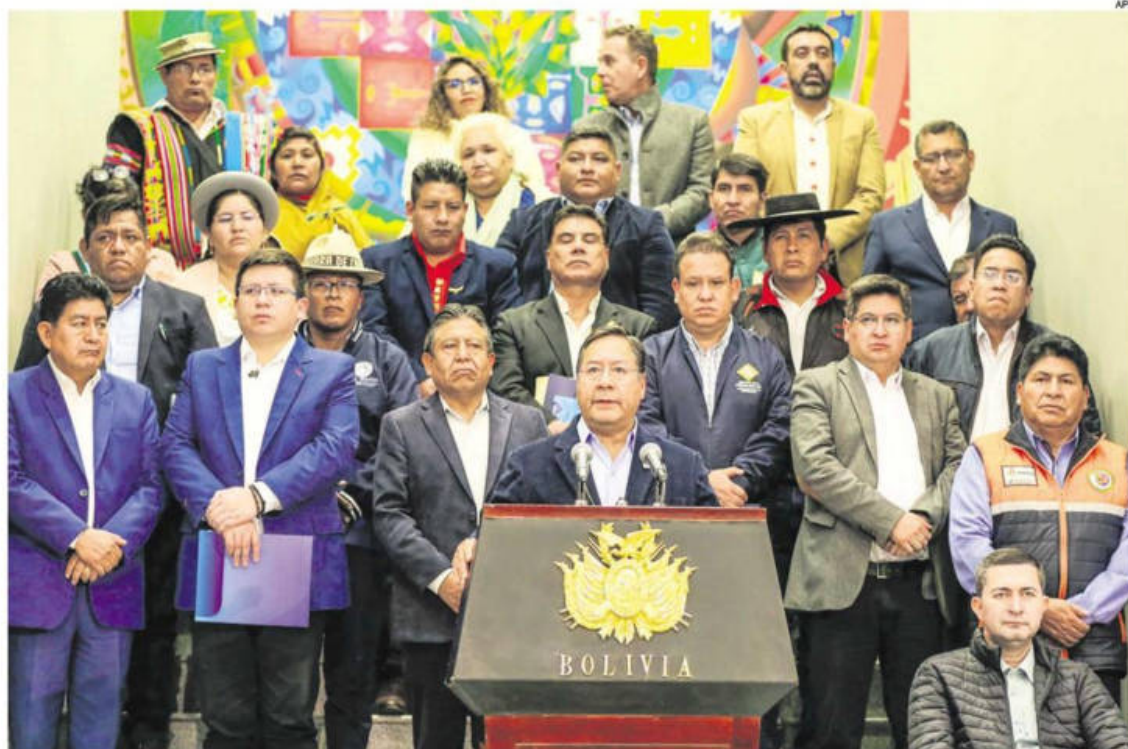
El presidente Luis Arce junto con ministros y miembros del Consejo Nacional de Autonomías que se reunió este lunes en la Casa Grande

(BID) por $us 250 millones, que será destinado a la atención de las contingencias por desastres naturales. Y el segundo, un crédito externo con la Agencia de Cooperación Internacional del Japón (JICA) por $us 100 millones, de apoyo para la respuesta a la pandemia del coronavirus, pero prevén que parte de este monto sea destinado para la atención de las afectaciones por lluvias.