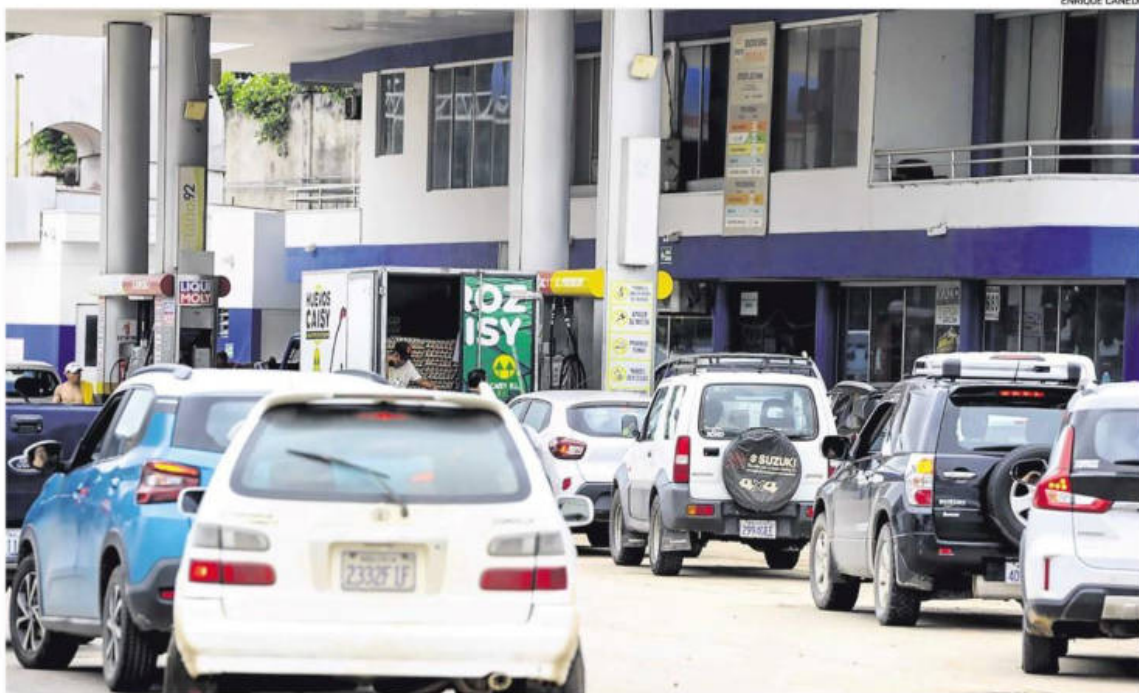
Las filas por combustible han bajado en los surtidores de la capital cruceña, autoridades esperan que las mismas sigan disminuyendo