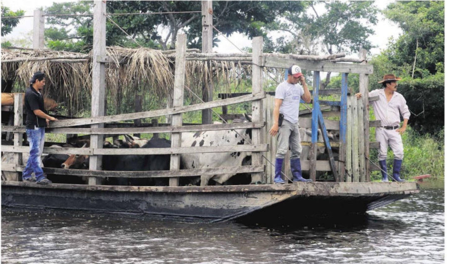
Los ganaderos esperan salvar a sus bovinos llevándolos a zonas más elevadas. El trabajo es constante, pues se busca evitar que nuevos desbordos de los ríos demoren la labor