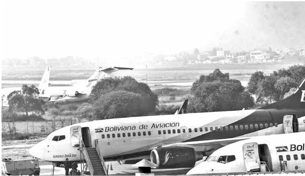
La pista del aeropuerto Jorge Wilstermann con bastante niebla, ayer. CARLOS LÓPEZ