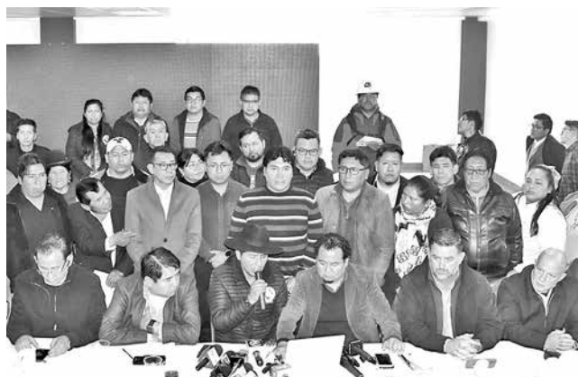
Miembros del Comité Multisectorial, ayer.

El Comité presentó un pliego petitorio con diez demandas: