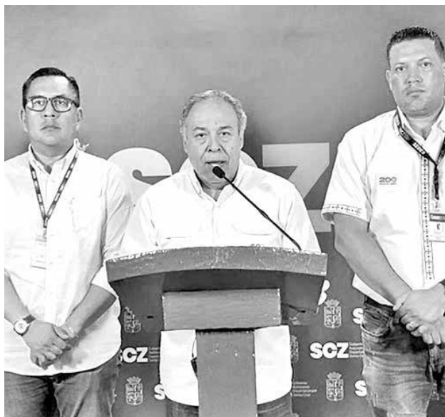
Médicos explican caso del niño intubado en Santa Cruz.

Bilbao aclaró que el traslado no fue informado en primera instancia ni coordinado con el Sedes de Santa Cruz, ni el Centro de Coordinación de Emer-