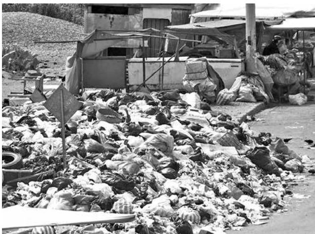
La basura en la calle por el bloqueo del botadero.