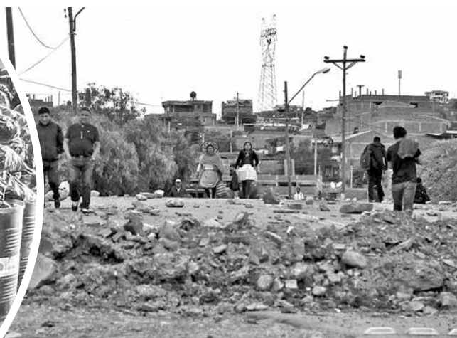
El bloqueo en el ingreso a K'ara K'ara. DANIEL JAMES