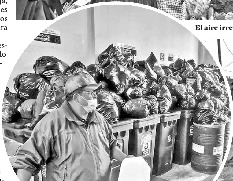
Los residuos infecciosos de los hospitales. DANIEL JAMES