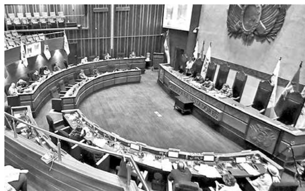
Debate de legisladores en la Cámara de Senadores.

Ayer, el TSE instaló Sala Plena con el objetivo de afinar algunos detalles del calendario electoral. Ávila informó que se está analizando el documento del calendario y la aprobación de dos reglamentos.