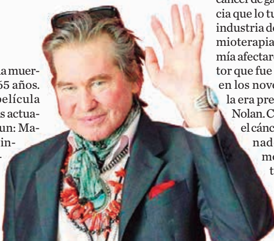
El actor Val Kilmer.

El actor Val Kilmer ha muerto este martes a los 65 años. Hizo de su última película una de sus más sólidas actuaciones. Fue en Top Gun: Maverick (2022) donde interpretó nuevamente al piloto Iceman Kazansky, el rival de Tom Cruise, como en la popular primera entrega, de 1986. En esta secuela, su personaje, ya retira-