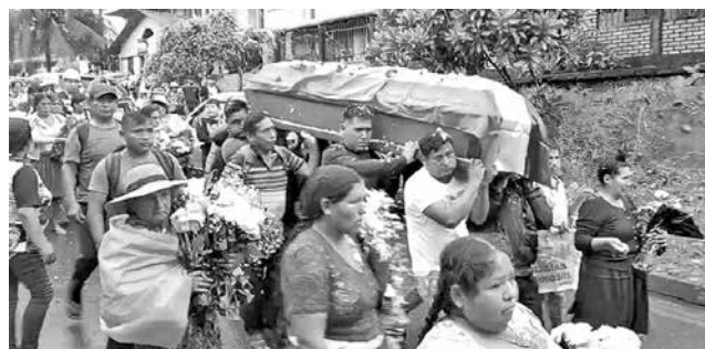
El entierro del dirigente Cruz. RADIO SOBERANIA

El caso del dirigente Cruz dio un giro después de que el expresidente Evo Morales denunció el domingo que falleció y lo relacionó como un destacado dirigente de las juventudes del sector campesino.