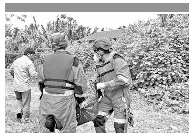
El rescate de los restos del niño, ayer.