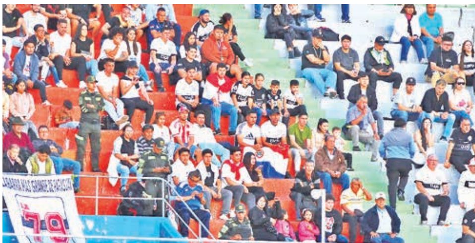
El aficionado de Olimpia, en el estadio Félix Capriles.

ba. Olimpia había ganado 0-3 a Litoral (1969) y 0-2 a Wilstermann (1979).