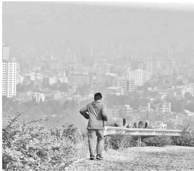
La ciudad cubierta por neblina, ayer. JOSÉ ROCHA