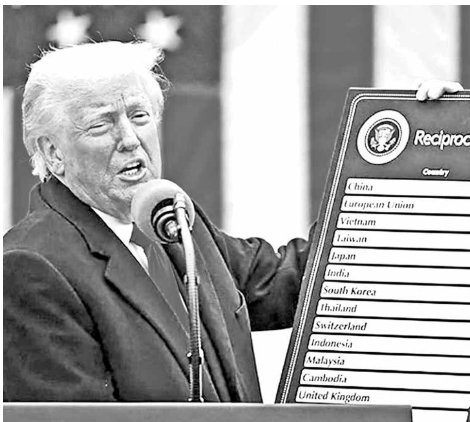
Donald Trump, cartel en mano, exhibe los aranceles que va a imponer a cada país.

Economía. Castiga con "medidas recíprocas" a la carta a cada país, aproximadamente la mitad de lo que calcula que cada socio o bloque le cobra a EEUU entre aranceles, subsidios o trabas burocráticas e impositivas