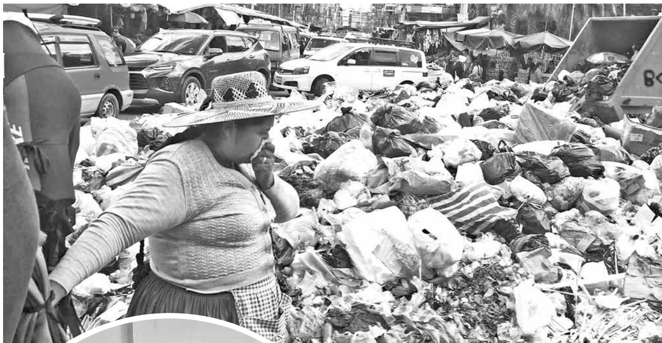
El aire irrespirable por el olor nauseabundo de la basura.