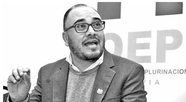
El vocal del TSE, Gustavo Ávila.

A tiempo. El vocal del Tribunal Supremo Electoral desmintió que exista retraso o postergación en la presentación de la norma.