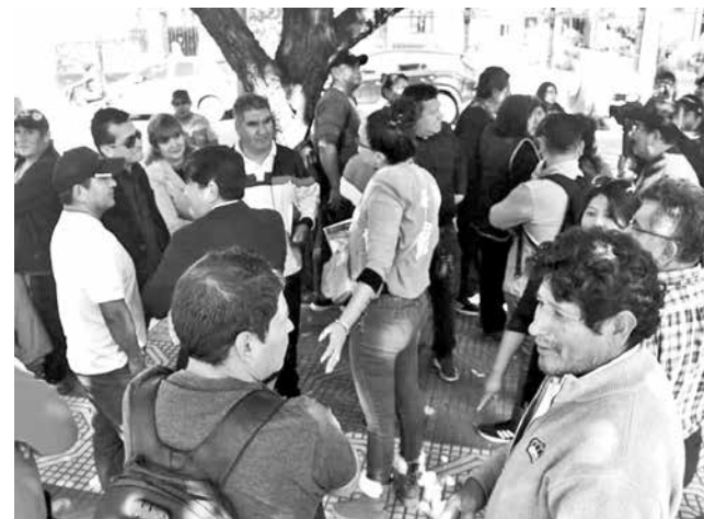
Comerciantes y otros sectores reunidos, ayer. JOSÉ ROCHA