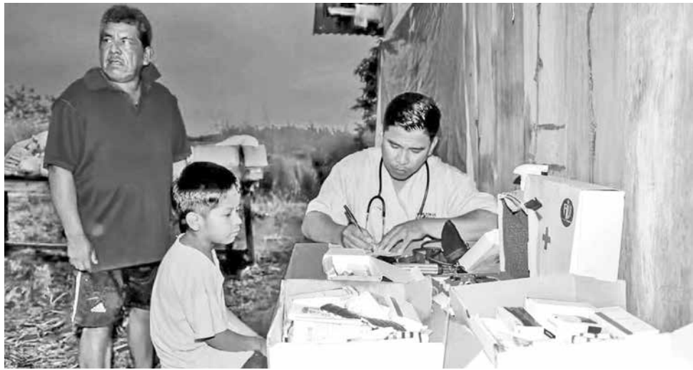
Médicos atienden a damnificados por las inundaciones, en Beni.

Según el reporte oficial de la Unidad de Gestión de Riesgo y Desastres del Ministerio de Salud, las atenciones se llevaron a cabo en 59 comunidades de 28 municipios, pertenecientes a seis departamentos afectados por inundaciones, riadas, deslizamientos y mazamoras. En Beni reportaron más de 300 casos de dengue en lo que va este año, por la prolongada época de lluvias que genera condiciones para la reproducción del mosquito transmisor, de acuerdo con datos del Servicio Departamental de Salud.