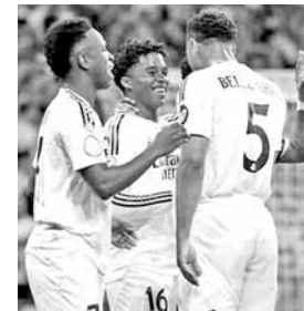
Festejo de los jugadores de Real Madrid, ayer.

Real Madrid evita el susto y va a la final de Copa del Rey