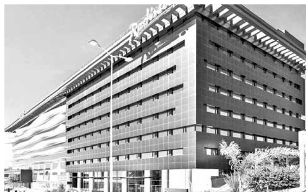
Ambientes del hotel Radisson en Santa Cruz.

En otro tema, Del Castillo dijo que está enfocado en la gestión, después de que fuera consultado acerca de los actos de proclamaciones que se realizaron por su candidatura.