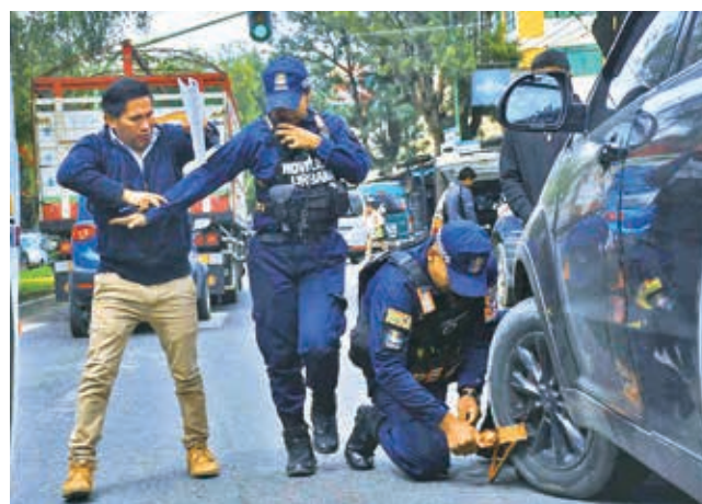
El control de parqueo en la av. Siles.

En menos de 30 minutos de control, más de cinco vehículos fueron sancionados con la multa correspondiente y la inmovilización de sus unidades. “Los conductores deben entender que el estacionamiento en doble fila está prohibido en todo momento