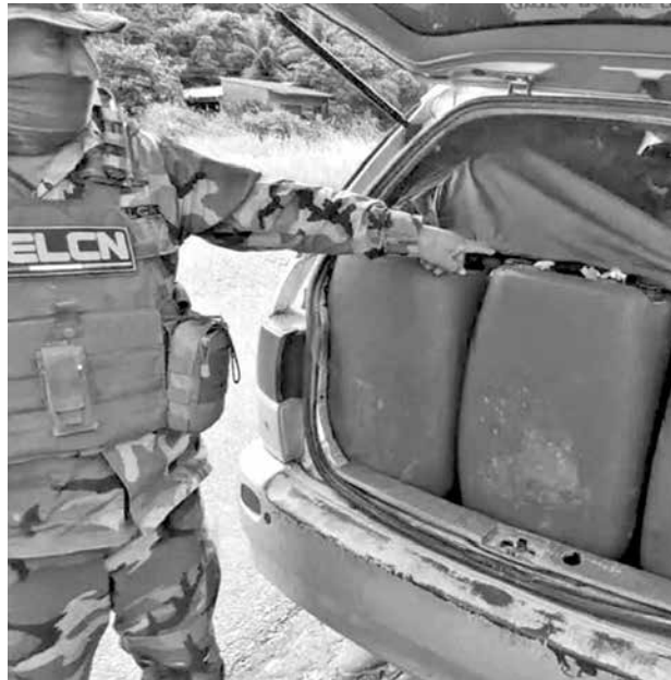
Gasolina decomisada en el operativo de Umopar.

Al menos dos personas quedaron aprehendidas tras