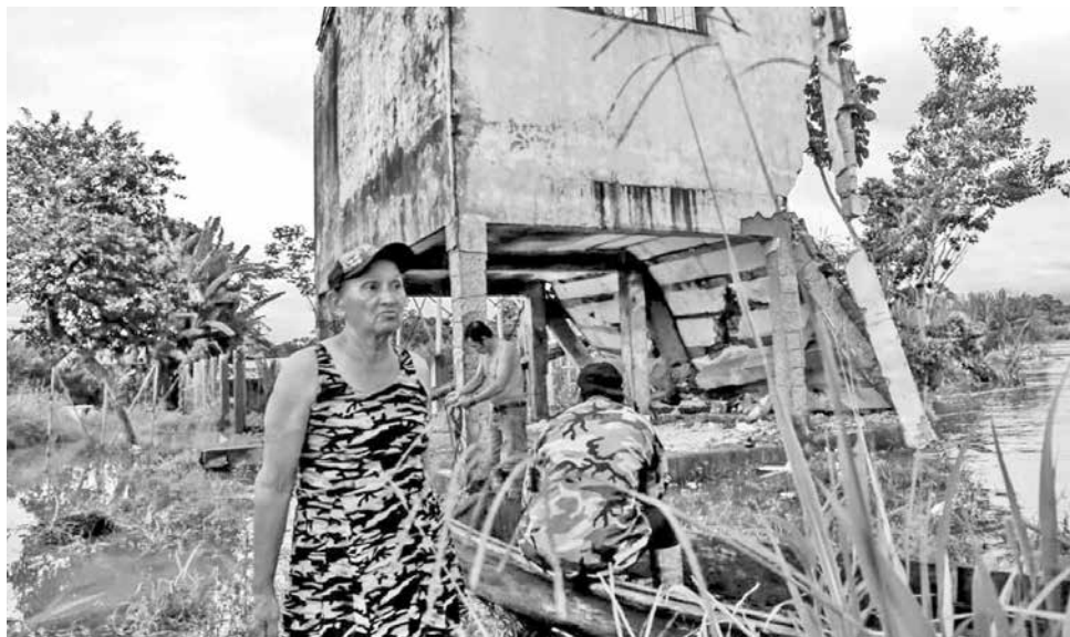
Pobladores de Beni afectados por las lluvias e inundaciones.

Según los datos oficiales, en La Paz 60 municipios están con inundaciones y 52 declarados en emergencia y/o desastre; en Cochabamba hay 33 municipios con inundaciones y 17 en emergencia y/o desastre; y en Oruro se tiene 17 municipios con inundaciones y 11 declarados en emergencia y/o desastre. En Potosí, en 36 municipios hay inundaciones y 17 están con declaratorias de emergencia y/o desastre; en Pando 3 municipios están con inundaciones. En Santa Cruz 22 municipios tienen inundaciones.