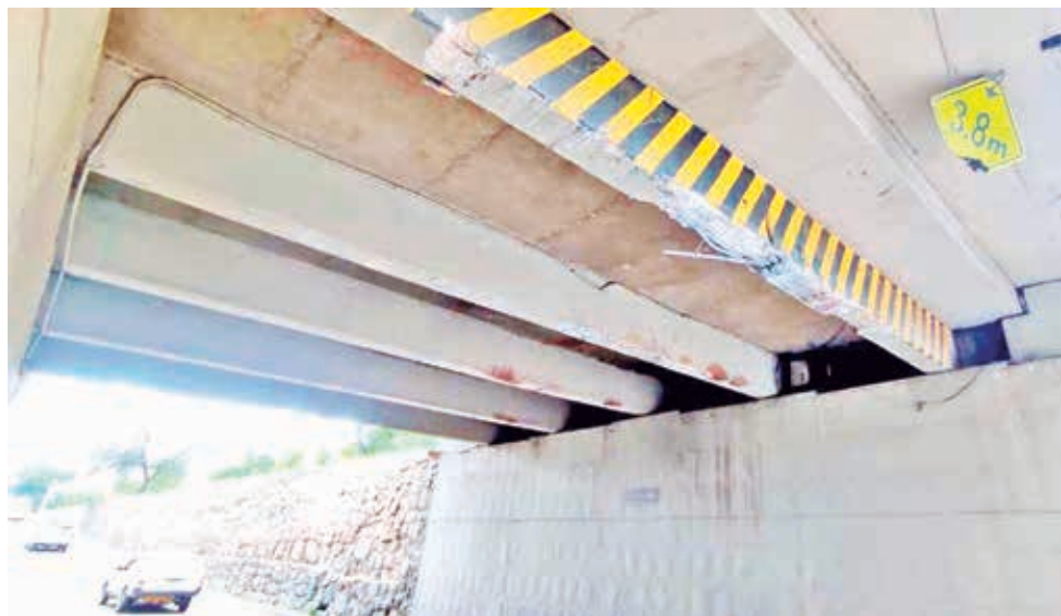
Las vigas del puente Antezana dañadas por la colisión del tráiler, el lunes.