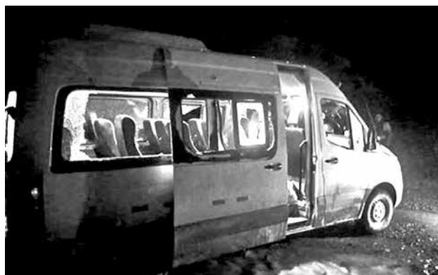
El vehículo que fue atacado en Pataz, Perú.

Cabe mencionar también que este martes un sismo de magnitud 5,0 golpeó cerca de la ciudad de Mandalay, donde viven alrededor de 1,5 millones de habitantes.