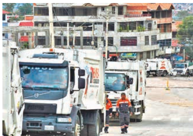
Camiones de EMSA que no ingresan a K'ara K'ara. D. JAMES