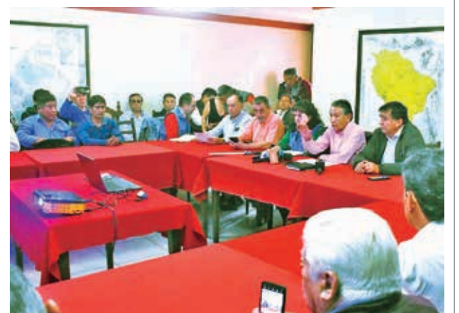
La reunión de sectores y la Defensoría. JOSÉ ROCHA