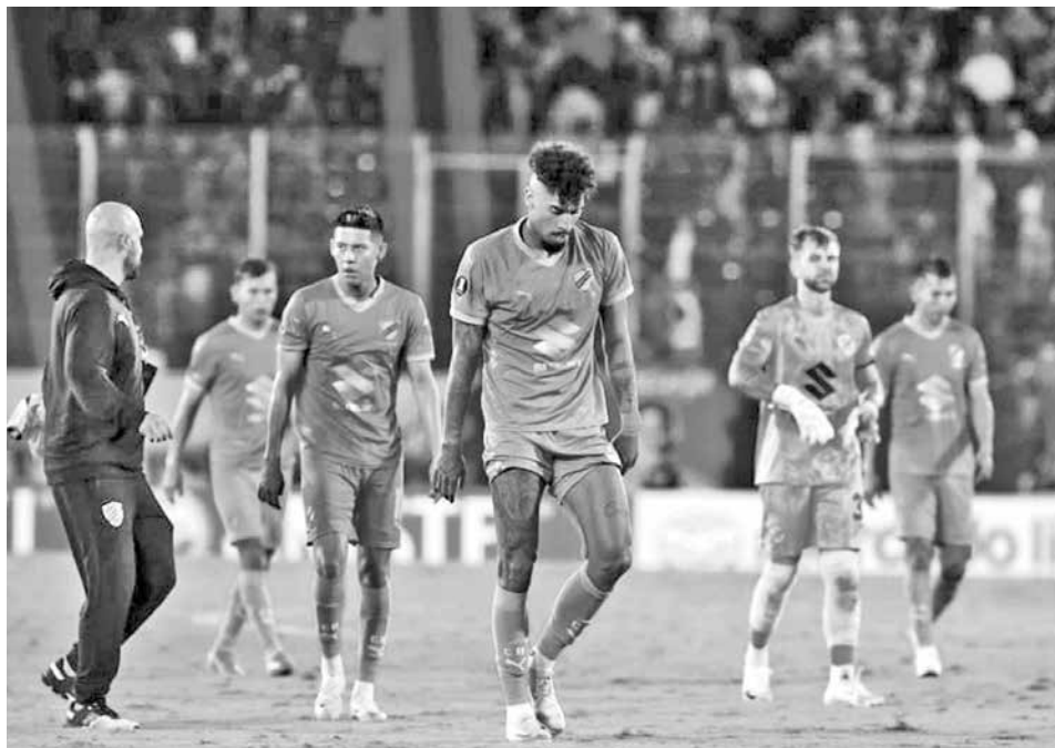
Jugadores de Bolívar salen cabizbajos tras la derrota ante Cerro Porteño, anoche.

ÁRBITRO: Alexis Herrera (Venezuela) ESTADIO: La Nueva Olla SEDE: Asunción PÚBLICO: 30.000 aproximadamente *Partido correspondiente a la fecha 1 del grupo G de Copa Libertadores 2025