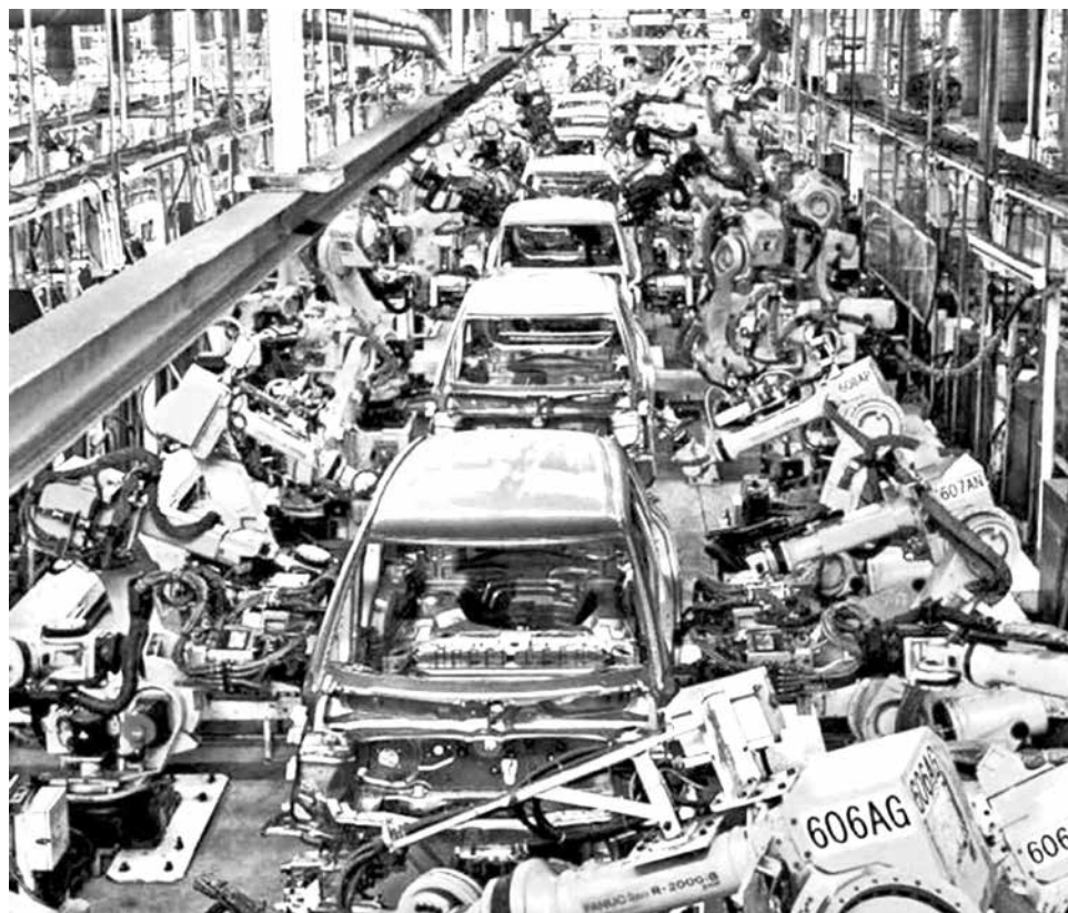
EEUU subirán los aranceles de los autos. WALTERPACK.COM