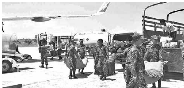
Equipos de rescate y ayuda médica llega a Birmania.

Rescate. También hay 4.521 heridos por el terremoto de magnitud 7,7 que golpeó al país del sudeste asiático el pasado viernes