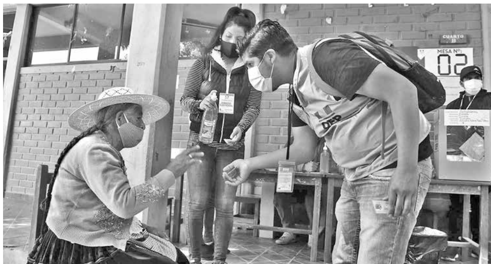
Funcionarios del Órgano Electoral durante las elecciones de 2020 en Cochabamba.