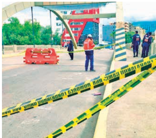
El cierre del carril de subida del puente Antezana.

hormigón y fierros. El personal de la Secretaría de Infraestructura del Gobierno Autónomo Municipal de Cochabamba (GAMC) realiza una evaluación técnica a la estructura del puente Antezana tras el accidente de tránsito.