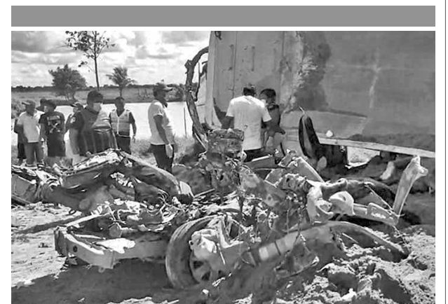
El accidente ocurrido en San Julián, el lunes. RRSS

bustibles, que ahora tienen gran demanda en el mercado negro por las filas que se realizan para acceder a la gasolina y el diésel en las estaciones de servicio.