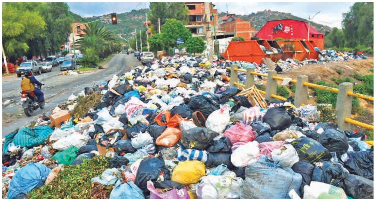
Una calle cubierta de basura en Santa Bárbara por el bloqueo en K'ara K'ara. DANIEL JAMES

Por su parte, los pobladores señalaron que el bloqueo no es político y reiteraron que debe ser el alcalde Manfred Reyes Villa quien debe hacer presente.