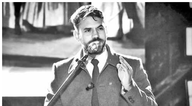
El ministro de Gobierno, Eduardo del Castillo.

Control. El titular de Gobierno asegura que la fuerza antidroga ejerce control permanente en la zona de operaciones en el Chapare.