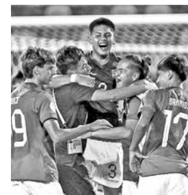
Celebración boliviana en torneo sub-17. CONMEBOL

Bolivia sub-17 vence a Uruguay y sueña con ir al Mundial