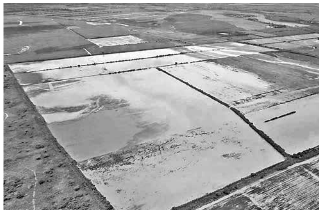
Cultivos de soya afectados por las inundaciones.

gión productiva del país, es una de las zonas más golpeadas. Según Frerking, 50.000 hectáreas de soya han quedado completamente anegadas, mientras que otras 500.000 hectáreas de diversos cultivos están en riesgo por el exceso de agua, lo que comprometerá su rendimiento. “En Santa Cruz se siembran 1,2 millones de hectáreas de soya y, si sumamos otros cultivos, alcanzamos 1,6 millones. Estas lluvias están golpeando directamente la producción”, afirmó el empresario a Unitel.