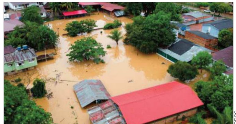
INUNDACIONES. Las lluvias anegaron colegios en varias regiones.

El Gobierno ya piensa en un plan posinundaciones para reconstruir las viviendas destruidas y evitar futuros eventos catastróficos a causa de las inclemencias del clima.