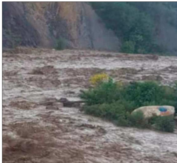
LLUVIAS. Las intensas lluvias provocan la crecida de ríos.

Por las precipitaciones pluviales y sus consecuencias, el presidente Luis Arce declaró emergencia nacional el pasado miércoles. Afirmó que con esa medida se podrán agilizar los