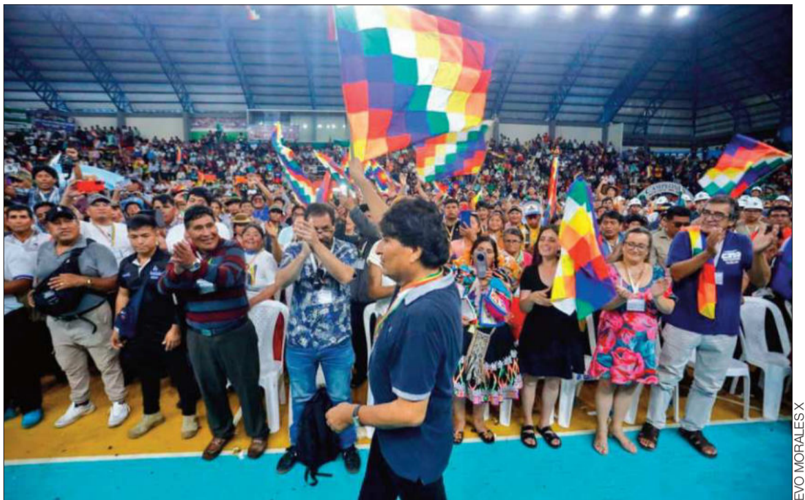
PROCLAMACIÓN. Evo Morales fue proclamado otra vez candidato presidencial para las elecciones.

Nacional. Evo Morales juró a la presidencia de su nueva organización política