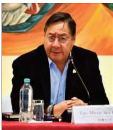
El presidente Luis Arce.

El presidente Luis Arce informó del problema para brindar atención