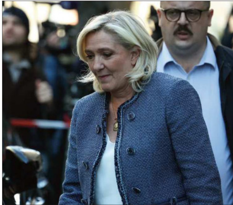
POLÍTICA. Marine Le Pen abandona la sede de su partido en París.

dencia, el tribunal tuvo en cuenta la amenaza para el orden público, en este caso que una persona condenada en primera instancia sea candidata a la elección presidencial", justificó la presidenta del tribunal, Bénédicte de Perthuis.