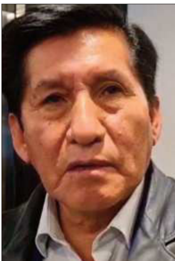
El senador masista Félix Ajpi.