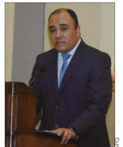
Vocal del TSE Gustavo Ávila.

"Esperemos que en estas horas que resta lo puedan realizar". Si no "vamos a convocar al proceso electoral, que se va a desarrollar el 17 de agosto, con toda la normativa que nosotros tengamos, con toda la logística y la organización que hemos planificado", concluyó Ávila.