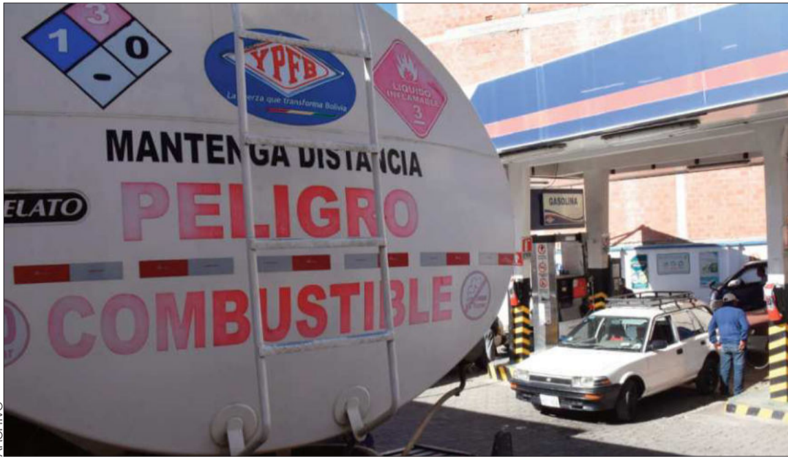
ABASTECIMIENTO. Un camión cisterna descarga combustible en una estación de servicio de La Paz.