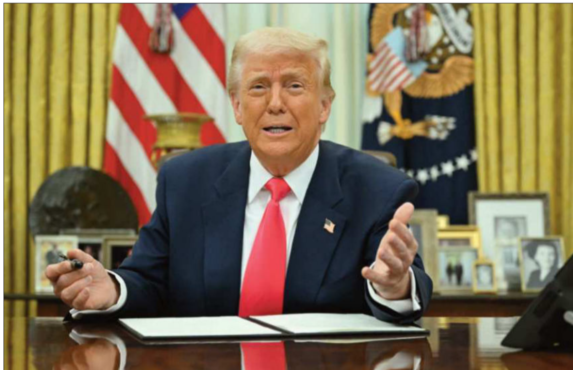
WASHINGTON. El presidente estadounidense, Donald Trump, en el despacho oval de la Casa Blanca.

"Cualquier país que se haya comportado de forma injusta con los estadounidenses debe esperarse a recibir un arancel a cambio el miércoles", añadió.