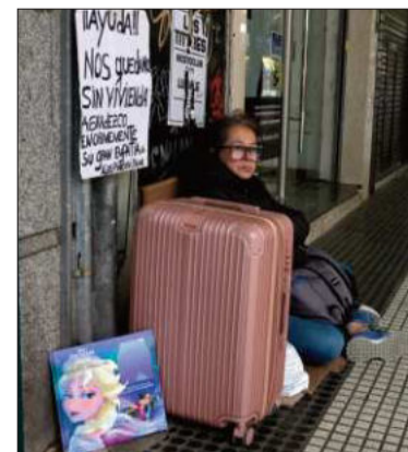
Una mujer pide ayuda en Argentina.

La contracción de la economía argentina tuvo su correlato en el consumo, porque lleva ya 15 meses consecutivos de caída.