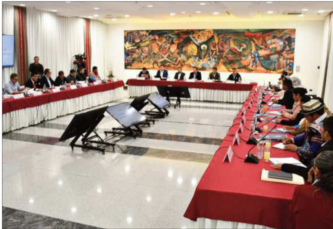
ENCUENTRO. El Consejo Nacional de Autonomías se reunió en instalaciones de Casa Grande del Pueblo.