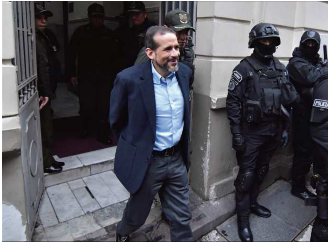
DETENIDO. Luis Fernando Camacho está recluido en el penal de Chonchocoro desde diciembre de 2022.

El Ministerio de Justicia anunció el fin de semana que las recomendaciones de la Organización