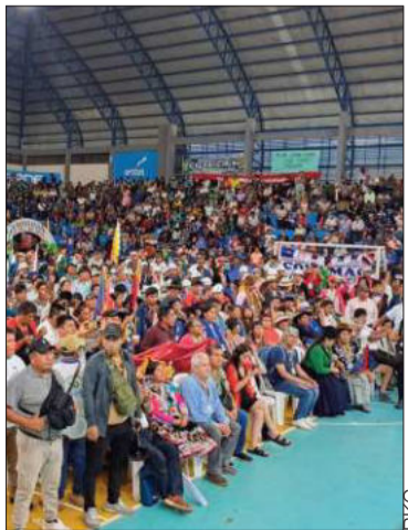
Encuentro del evismo en Lauca Ñ.

La facción considera que el titular del Senado ya decidió su futuro político