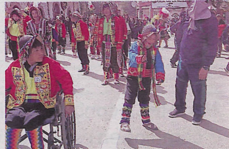
Estudiantes deslumbraron con su destreza y habilidad al bailar

lo tanto, llegamos a la conciencia y reflexión de la sociedad de que esta sociedad también necesita el apoyo correspondiente por parte de sus instituciones y de sus autoridades", manifestó.