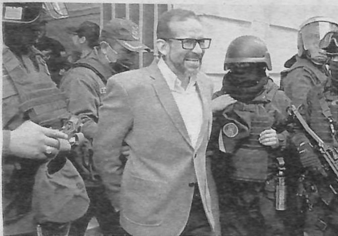
El Gobierno boliviano rechaza un informe de la ONU sobre Luis Fernando Camacho, alegando que es sesgado y desactualizado

Consideró que el gobernador debe ser liberado inmediatamente y concederle el derecho a obtener una indemnización y otros tipos de reparación conforme al derecho internacional.