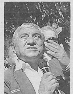
La Alianza Libre ha desmentido los rumores sobre un supuesto pacto con el alcalde Iván Arias Durán

fatiza que las versiones difundidas en redes sociales carecen de veracidad y reitera su postura ante cualquier rumor que pueda afectar su imagen. En este contexto, se destaca la importancia de mantener un diálogo claro y directo con la población para evitar confusiones.