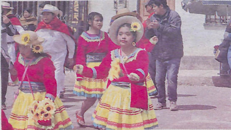
Segunda versión de la Entrada Folklórica "Por una Bolivia Inclusiva" se realizó con éxito

De acuerdo al rol de ingreso, la entrada fue encabezada por la Dirección Departamental de Educación (DDEO) Oruro, que participó en la actividad cultu-