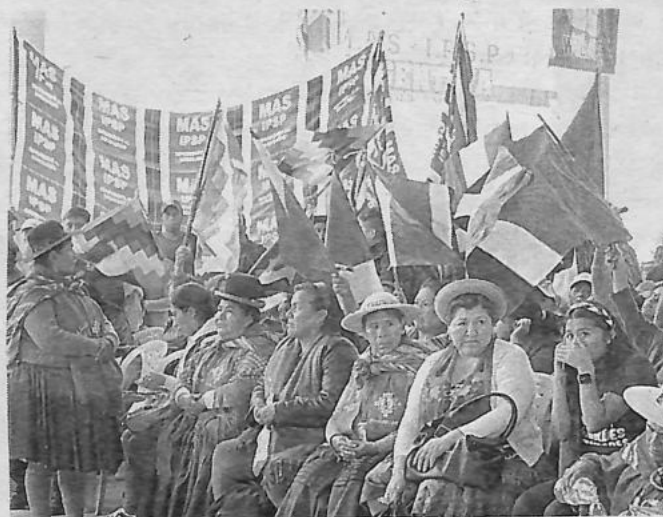
El MAS desarrolló su congreso el fin de semana