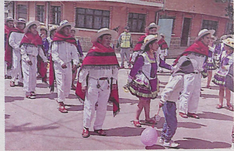
Estudiantes brillaron en la entrada folklórica y se apoderaron de las calles

"Si bien tenemos una sociedad con diferentes discapacidades, eso no es limitante, más al contrario, ellos también tienen diferentes potencialidades, habilidades y destrezas. Hoy evidenciamos esas potencialidades que tienen, por