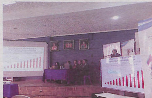
Acto de rendición de cuentas final 2024 del SeLA Oruro /SELA