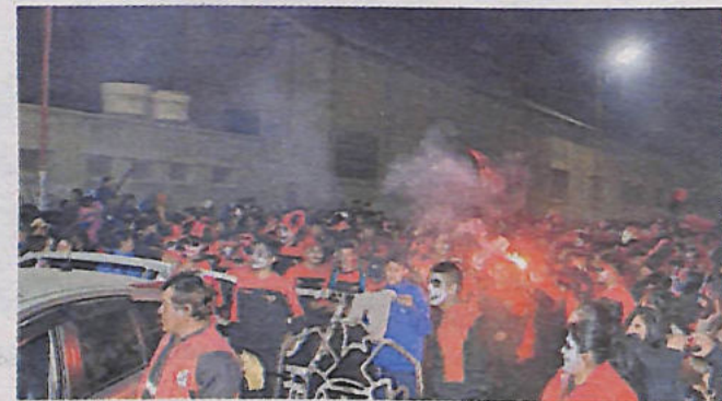
Unidades educativas deben evitar los excesos al retornar de la excursión

"Si las excursiones son parte del POA, pues nomás tendrán que asu-