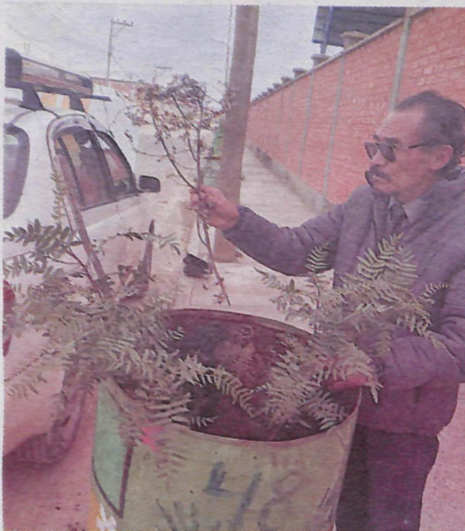
Las ramas de los arbolitos exteriores de la unidad educativa fueron “partidos”

“Compartir este hecho ocurrido en la UE Avelino Siñani, por el sector de