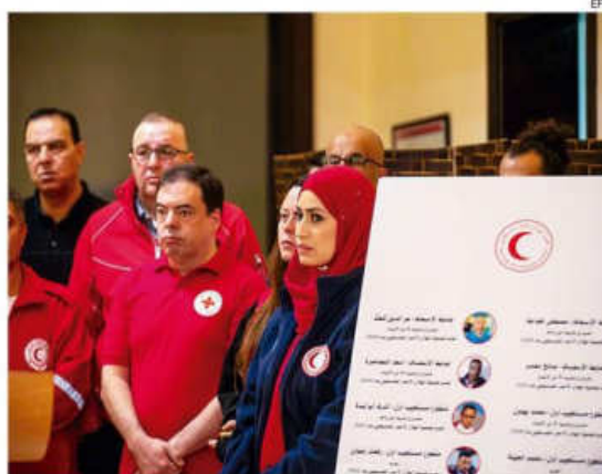
La Media Luna Roja denuncia la muerte y desaparición de voluntarios

"Estos dedicados trabajadores de ambulancia estaban respondiendo a personas heridas. Eran humanitarios. Llevaban emblemas que deberían haberlos protegido; sus ambulancias estaban claramente identificadas", asegu-