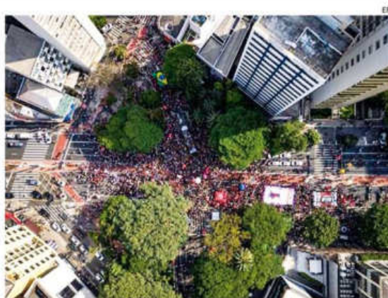
Manifestación en la Avenida Paulista, en San Pablo, Brasil

El líder ultraderechista y otros siete estrechos aliados, entre ellos antiguos ministros y militares de