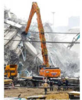
Las labores de rescate en Bangkok (Tailandia) no se detienen

Los equipos de rescate están utilizando perros, drones, una cámara termográfica para detectar el calor corporal, y escaneos 3D de la estructura, con el objetivo de localizar a personas entre la montaña de escombros en la que se trabaja día y noche.