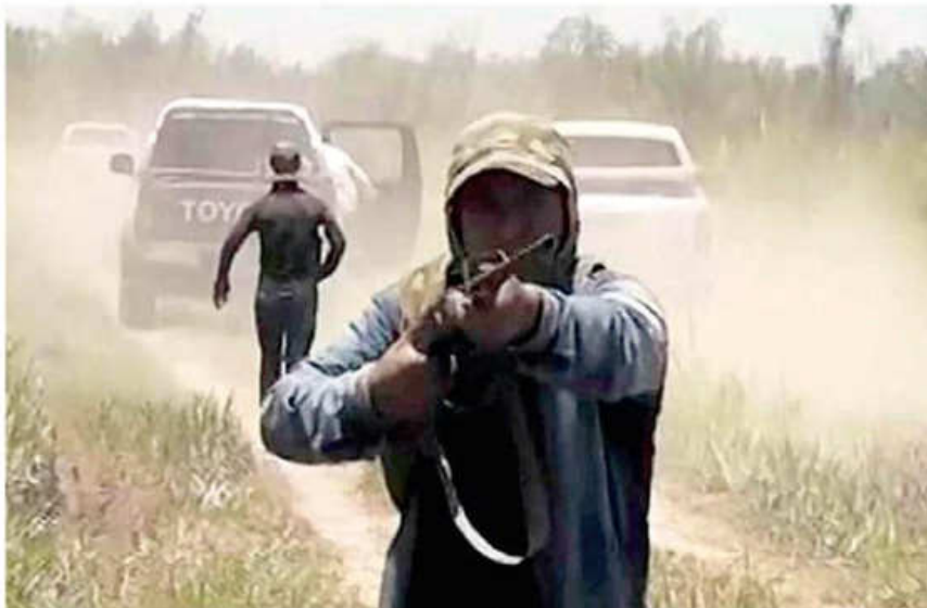
La violencia contra periodistas en Las Londras sigue en la impunidad, casi cuatro años después

lidad, a las Autorizaciones Transitorias Especiales (ATE), como la de Marabol y Vasber.