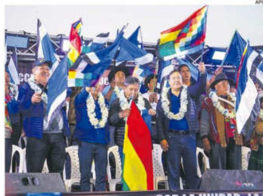
El presidente Luis Arce estuvo un tiempo en el congreso del MAS.

Una comisión del Sífde llegó al evento del MAS arcista. Esta comitiva presentará a Sala Plena un informe.