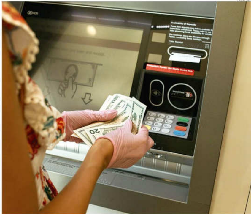
Los retiros en cajeros en bancos del exterior también son pasibles de pagar la comisión al cambio paralelo

En el banco "D", la resolución de la ASFI surtió efecto, pero solo