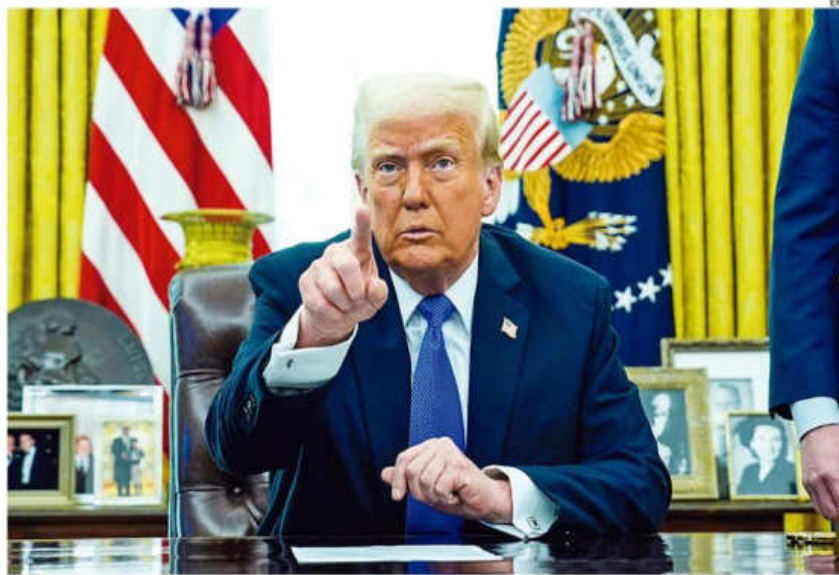
El presidente de EE.UU. dice que "hay métodos" y que "no está bromeando" sobre un tercer mandato

Sin concretar qué otras fórmulas más barajaría llegado el caso, Trump concluyó que "también existen otras" maneras de lograr postularse por tercera vez.