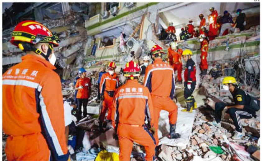
Grupos de rescate trabajan en Mandalay (Nyanmar), en la búsqueda de sobrevivientes al terremoto

Naciones Unidas y grupos humanitarios advirtieron una grave escasez de suministros médicos y alimentos, mientras atienden en hospitales de campaña.