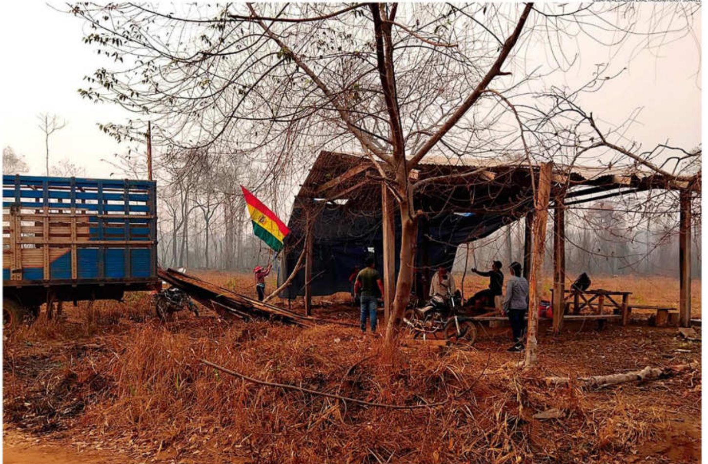
El año pasado, un grupo armado se instaló en el camino a Piso Firme, a la altura de la reserva Bajo Paraguá, impidiendo el paso a viajeros y también a bomberos