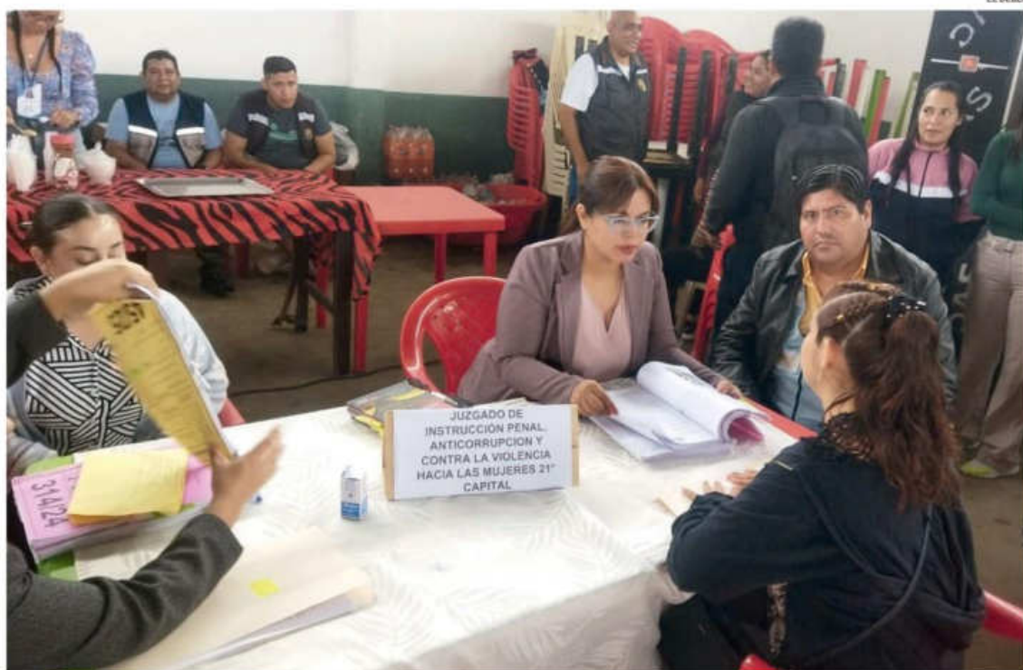
La jueza anticorrupción Vivian Balcázar escuchó en Palmasola a la educadora de la guardería municipal, única detenida por mal trato a niños

Las víctimas consideran que con una sola persona detenida el caso quedó estancado y no hay señales claras para su esclarecimiento total. “No detienen a las dos prófugas, peor identifican a otros responsables de mayor jerarquía que permitieron estos abusos con niños inocentes y que no pueden defenderse. Esto va camino a la impunidad”, dijo una mamá.