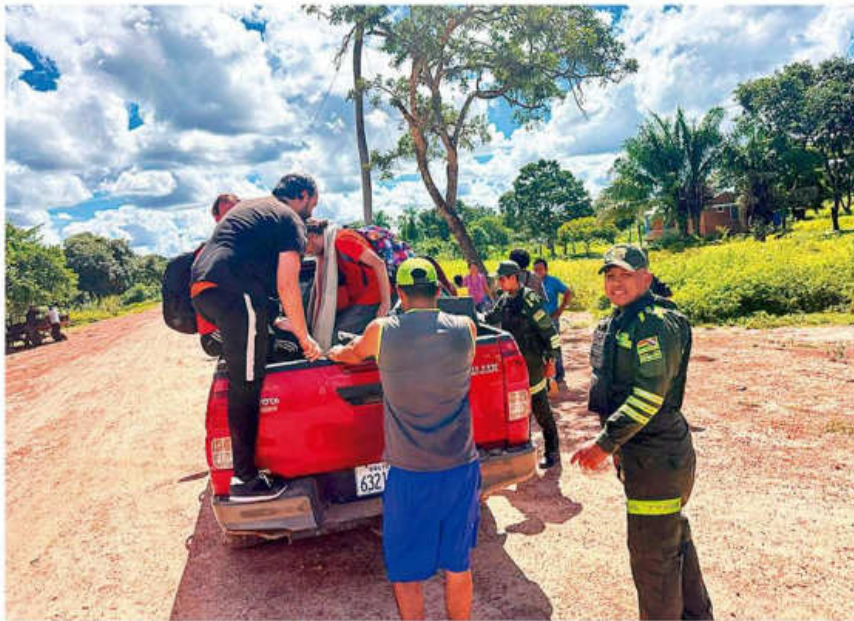
En Exaltación, territorio cayubaba, tres voluntarios irlandeses de Kailasa ya estaban instalados

Se consolida. El tráfico, en muchos casos, como ya ocurrió en Choré, ante la inacción de autoridades