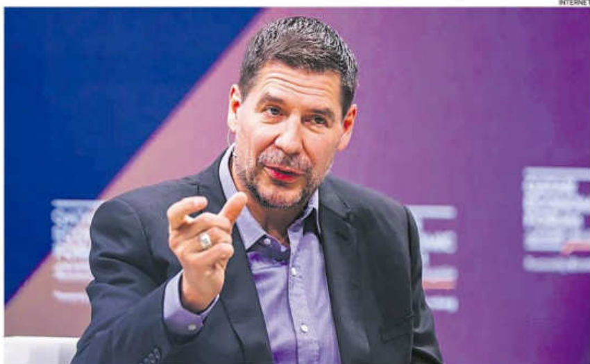
El empresario Marcelo Claure presentó ayer su última encuesta de cara a las elecciones del 17 de agosto.