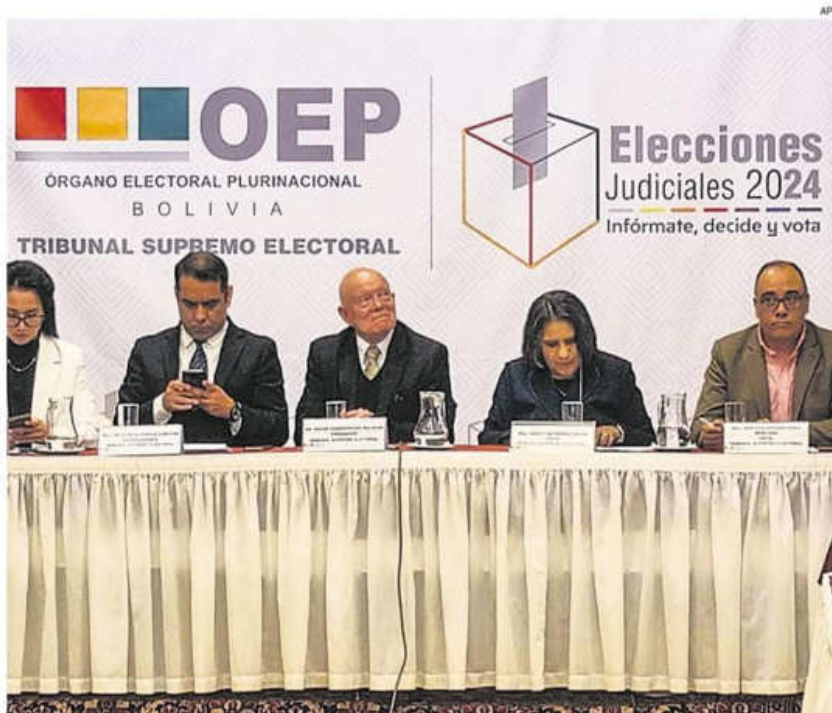
Los vocales electorales presentarán el calendario electoral. Este proceso tiene más de 60 actividades.

"Si un joven va a cumplir 18 años, por ejemplo, el 16 de agosto, tiene que empadronarse en este