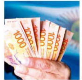
Billetes de pesos argentinos

En la Cámara de Representantes, el representante Andy Ogles, republicano de Tennessee, ha presentado una legislación para iniciar el largo proceso de modificar el texto de la Enmienda 22 y permitir que un presidente que cumple mandatos no consecutivos pueda cumplir un tercer mandato de cuatro años.