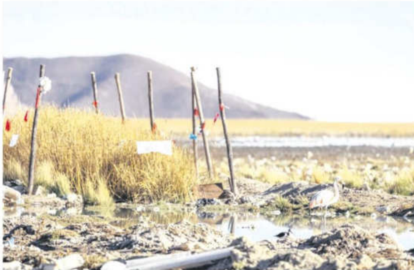
Todavía quedan algunos flamencos que permanecen en el lago, pese a la contaminación

solo para las comunidades, sino para el mundo, porque esto ayuda con el tema del equilibrio de las aguas, evitar inundaciones y catástrofes. Si una parte es interrumpida, como en este caso, la función del lago, puestodo el ecosistema va a funcionar mal.