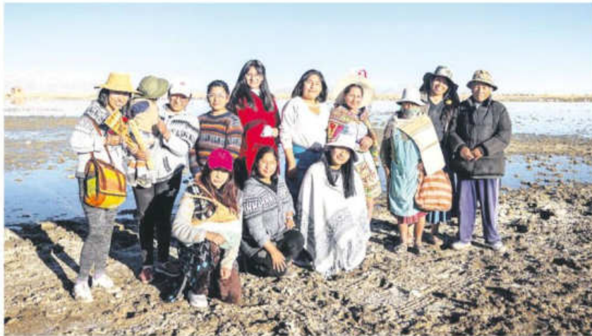
Parte de los comunarios que apoyan la iniciativa de restauración del lago Uru Uru

No nos olvidemos de que este lago es un sitio Ramsar (humedal que ha sido reconocido como de importancia internacional para la conservación de la biodiversidad y el sustento humano), y eso significa mucho, no