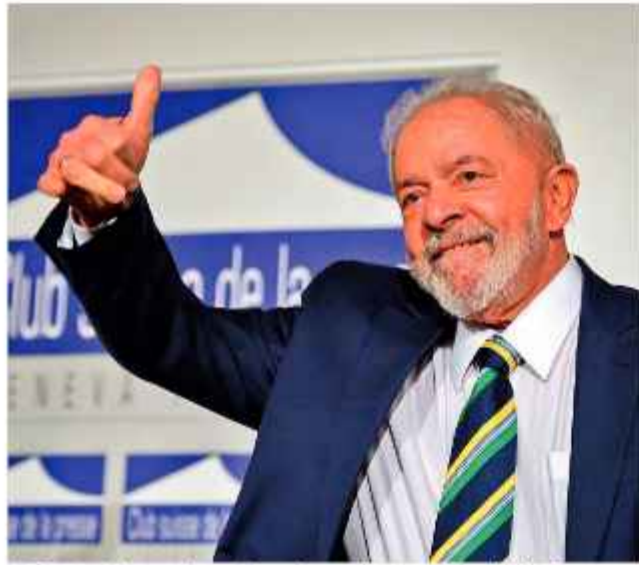
CRÍTICO. El presidente brasileño, Luiz Inácio Lula da Silva.

El presidente de Brasil, Luiz Inácio Lula da Silva, criticó ayer las recientes medidas arancelarias anunciadas por su homólogo estadounidense, Donald Trump, de quien dijo "no es el sheriff del mundo", y alertó que la nación sudamericana podría adoptar represalias comerciales contra Estados Unidos, divulgaron los medios brasileños.