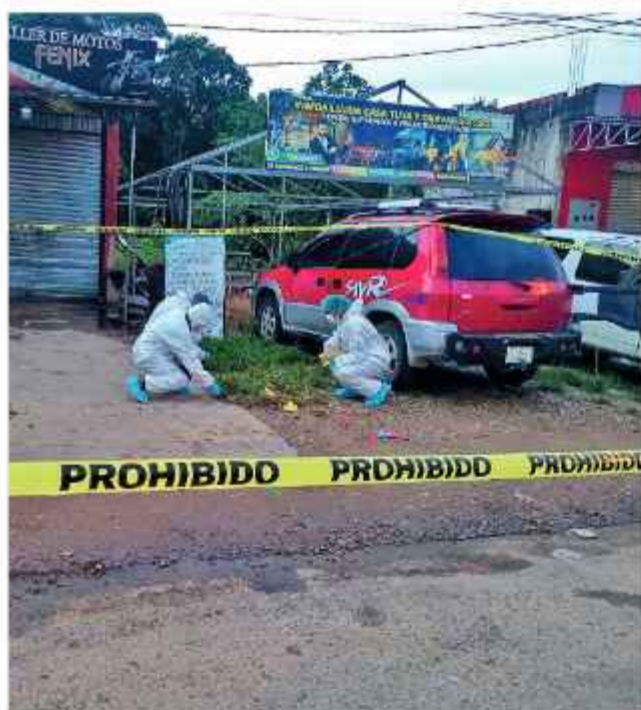
INVESTIGACIÓN. Policías realizan la inspección en la escena del hecho.