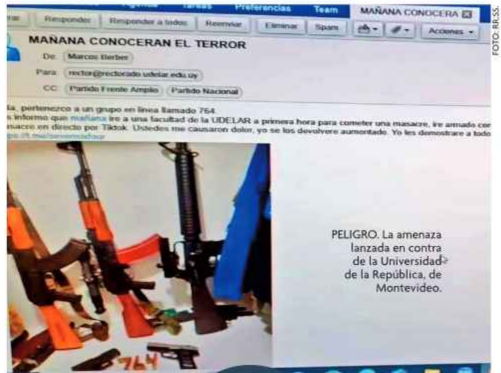
PELIGRO. La amenaza lanzada en contra de la Universidad de la República, de Montevideo.

"Hola, pertenezco a un grupo en línea llamado 764. Les informo que mañana iré a una facultad de la Udelar