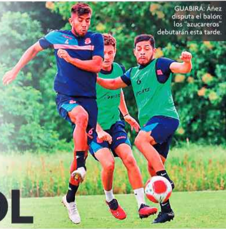
GUABIRÁ: Añez disputa el balón; los "azucareros" debutarán esta tarde.

Se jugarán dos torneos este año; el campeón y subcampeón del "todos contra todos" se clasificarán como Bolivia 1 y 2 a la Copa Libertadores de América.