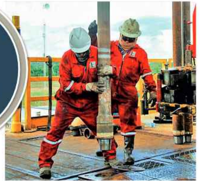
OBREROS: Trabajadores de YPF operan un pozo petrolero.

dos en nuestro país", dijo a tiempo de reiterar que la economía de los proyectos exploratorios es crítica.