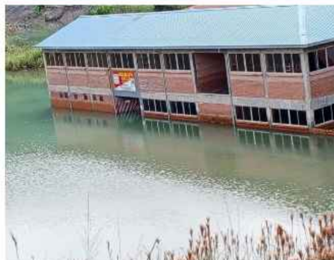
INFRAESTRUCTURA: Unidad Educativa 16 de Julio, de Tipuani.

Tras la inundación en Puerto Pailas, del municipio de Cotocha, en Santa Cruz, una unidad educativa fue habilitada como albergue para las familias afectadas por inundaciones. “Por la emergencia en Puerto Pailas, hemos suspendido las clases, hemos establecido el centro de emergencia, tenemos como unas 10 familias evacuadas. Las clases, a partir de hoy, son virtuales, mientras se tenga la emergencia”, dijo un vecino de la zona.