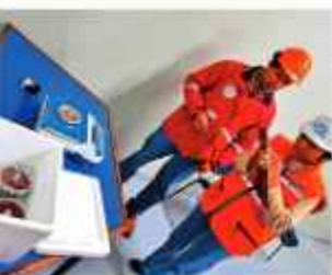
TÉCNICOS: Funcionarios controlan la irradiación.

"En un hecho importante para el país, hoy en nuestro Centro Multipropósito de Irradiación de El Alto realizamos la primera irradiación de pupas de mosca de la fruta, conocida como la Técnica del Insecto Estéril (TIE), un método revolucionario y ecológico para el control de la mosca de la fruta en beneficio de nuestra agricultura", escribió el Jefe del Estado. La técnica consiste en esterilizar a los insectos macho en estadio de pupa, con radiaciones ionizantes para dañar su esperma, haciéndolos incapaces de reproducirse y, una vez llegados a la adultez, liberarlos en el medioambiente. Esta innovadora técnica del insecto estéril tiene como objetivo controlar la población de la mosca y, en consecuencia, reducir las enfermedades que transmiten y que afectan la producción frutícola.