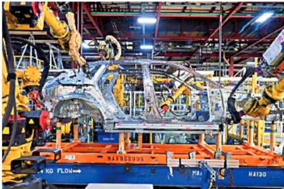
PRODUCCIÓN. Una fábrica en la que se fabrican automóviles en México.

La administración dará esa respuesta integral a las tarifas anunciadas por Washington en el caso del acero y el aluminio, las correspondientes al sector automotriz y las decisiones del territorio norteamericano el 2 de abril, cuando prevé aplicar aranceles recíprocos a muchas naciones.