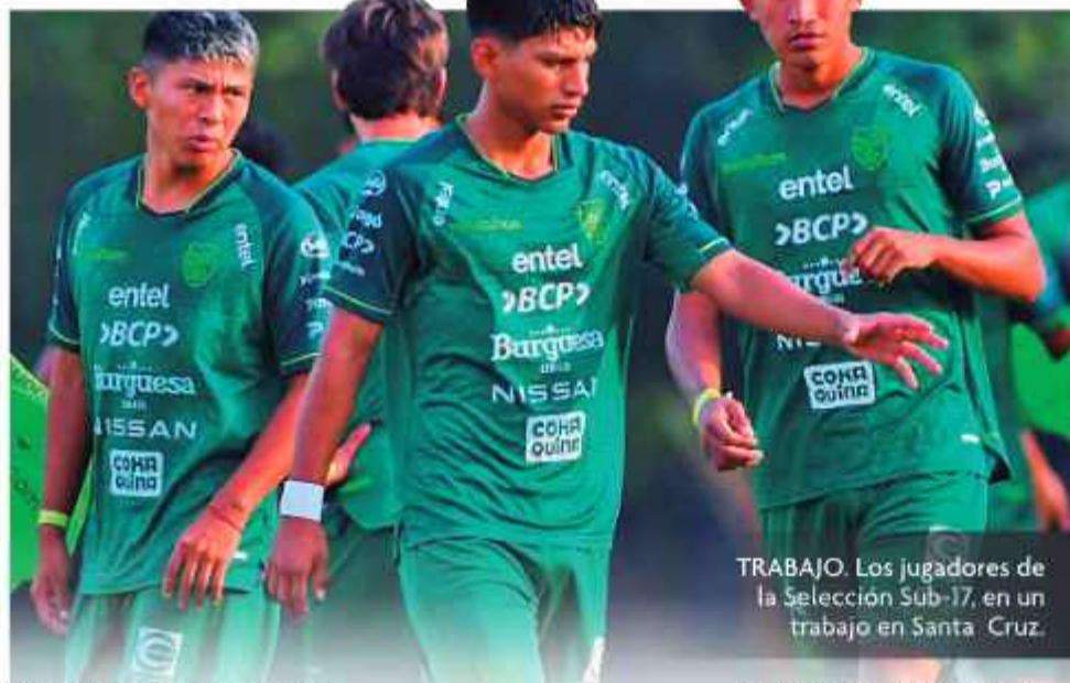
TRABAJO. Los jugadores de la Selección Sub-17, en un trabajo en Santa Cruz.