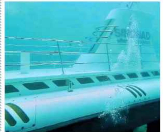
SINBAD. El submarino ruso hundido en el Mar Rojo.

Seis personas de nacionalidad rusa murieron y 39 extranjeros fueron rescatados ayer tras el hundimiento de un submarino turístico en la Gobernación del Mar Rojo egipcia durante un recorrido por la ciudad turística de Hurghada, dijo un comunicado de la Gobernación en su página oficial de la red social Facebook.