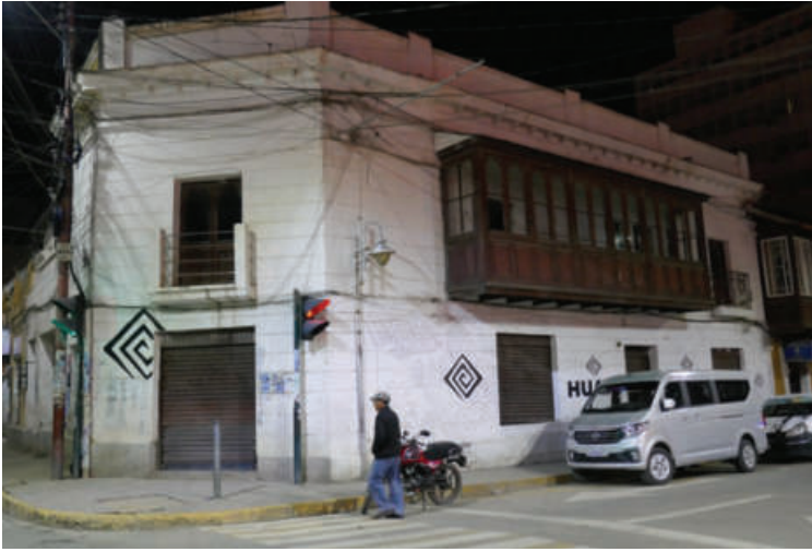
Fachada de la Casa Center