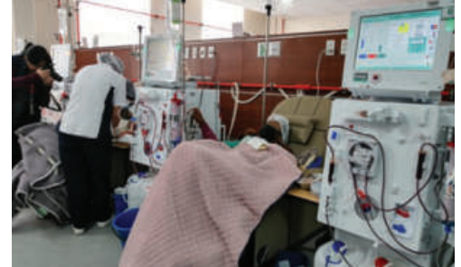
En Oruro, existen 298 pacientes con enfermedad renal que dializan

Actualmente, en el sistema sanitario departamental se tienen aproximadamente 298 pacientes con enfermedad renal crónica