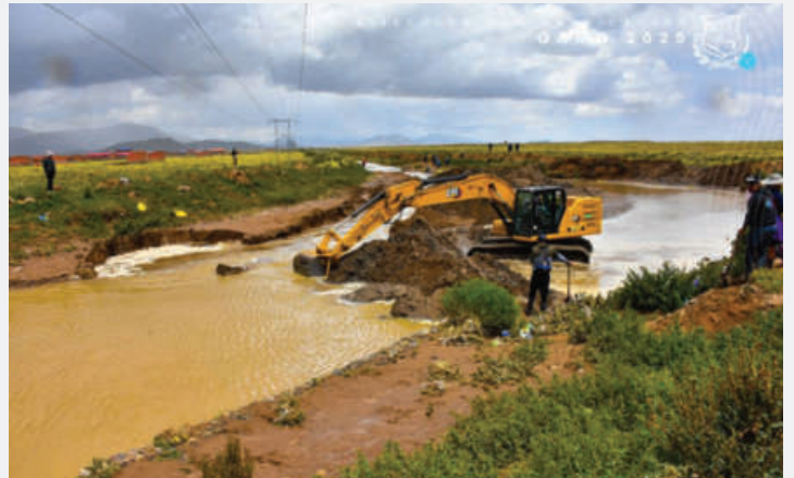
Concejo busca conocer informe sobre la atención a zonas afectadas por las inundaciones

Esta normativa responde a eventos adversos como lluvia fuerte e intensa, llovizna persistente, nieve, granizo y aguacero.