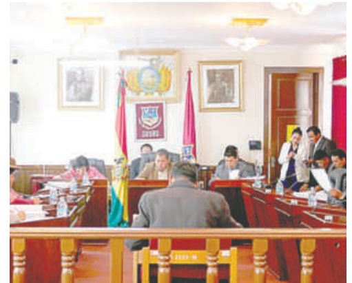
Concejo otorgó el voto de censura a la autoridad edil

Tras concluir el proceso de interpelación y analizar las respuestas proporcionadas, los concejales decidieron, mediante una votación de dos tercios