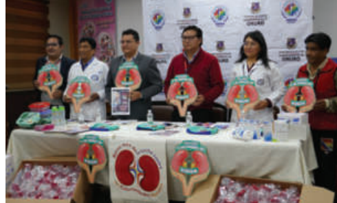
Presentación de la Campaña departamental Gratuita de Diagnóstico de Enfermedades Renales

Según Guibarra, situaciones como la hipertensión arterial, la diabetes, el abuso de drogas, el abuso de medicamentos e incluso enfermedades crónicas o autoinmunes como el lupus y el cáncer, sobre todo el cáncer cervicouterino, son enfermedades que propician el daño renal, el cual no tiene síntomas y avanza día a día.