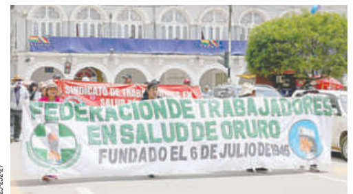
Trabajadores en salud pública salieron a las calles en marcha y cumplieron un paro de 24 horas