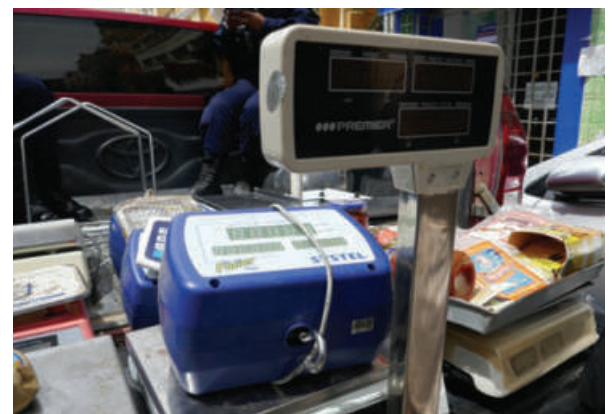
Productos vencidos eran comercializados a la población

La Unidad de Defensa al Consumidor tiene entre sus