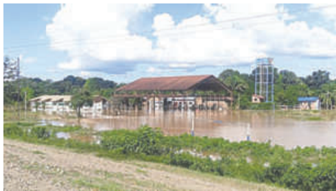
Las lluvias continúan generando desastres en el departamento del Beni /LA PALABRA DEL BENI

Las persistentes lluvias en el Beni han provocado el desborde de ríos e inundaciones que han afectado sembradíos y dejado a cientos de familias en crisis. En el municipio de Reyes, provincia Ballivián, los productores han visto cómo el agua arrasó con sus cultivos de arroz, maíz, plátano y yuca, afectando gravemente su fuente de sustento.