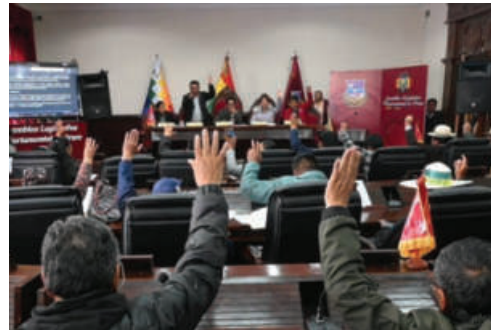
Se aprueba Ley Departamental 267 para Desastre Departamental /ALDO

Por su parte, el jefe de la Unidad de gestión de Riesgo (UGR) de la Gobernación, Jai-