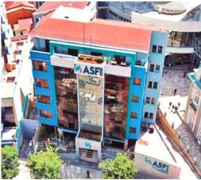
SEDE: El edificio principal de la entidad reguladora, ASFI.

La Autoridad de Supervisión del Sistema Financiero aprobó la Resolución ASFI/216/2025 el 14 de marzo para modificar el Reglamento de Tasas de Interés, Comisiones y Tarifas que deben cobrar las entidades de intermediación financiera para transacciones mediante el uso de tarjetas de crédito o débito, así como de los servicios y operaciones en el exterior. Dicha norma dispone que para las transacciones con el exterior de hasta 100 dólares no se debe aplicar el cobro de comisión, "mismo que se efectuará sólo sobre el monto que supere dicha