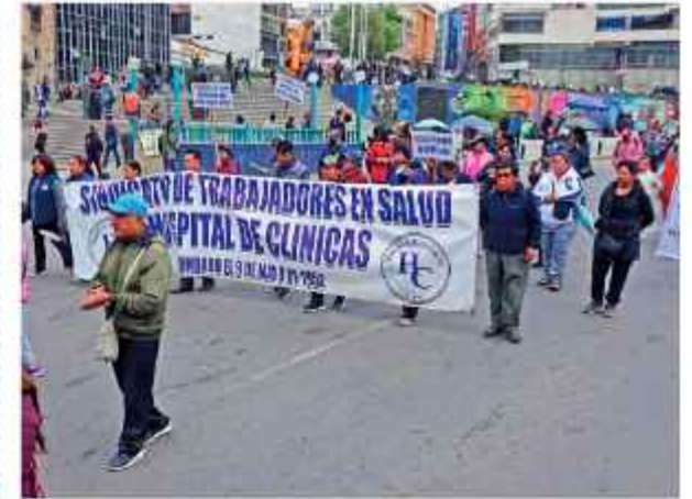
PROTESTA. Trabajadores se movilizaron, ayer, en La Paz.