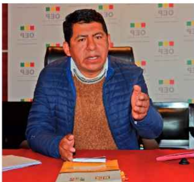
FIGURA. Tahuichi pide a los legisladores cumplir compromisos.

El dirigente “androniquista”, Darwin Choque, informó ayer a medios cruceños que “hay una comisión para que el compañero Andrónico sea habilitado como candidato y como tres o cuatro partidos políticos le ofrecieron su apoyo”. Entre las agrupaciones políticas mencionó al Movimiento Tercer Sistema; el Partido de Acción Nacional Boliviano (PAN-BOL), el Frente Para la Victoria (FPV), que impulsa la candidatura de Evo Morales; y hasta Unidad Cívica Solidaridad (UCS). Ayer, el senador Hilarión Mamani pidió a Morales recapacitar y aceptar la posible candidatura de Rodríguez, mientras el diputado Freddy López publicó en Facebook un tema alusivo a Andrónico y su “postulación”. Días atrás, su colega Héctor Arce Rodríguez recordó a Andrónico su calidad de “orgánico” y dijo que será inútil cualquier intento de promover esa candidatura.