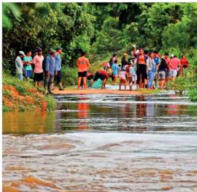
DESASTRE.: Beni, una de las regiones afectadas por riadas.

Las intensas lluvias dejaron a su paso, 95 municipios declarados en desastre y 18 en emergencia; 209 municipios afectados; 4.553 comunidades; 378.885 familias afectadas y damnifi-