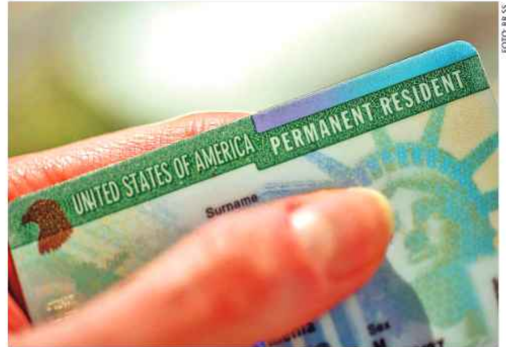
DOCUMENTO. Green Card, el documento que permite a los extranjeros residir en EEUU.

El Departamento de Seguridad Nacional (DHS) confirmó la medida en un comunicado en el que explicó que se ha impuesto una "pausa temporal" para concluir ciertas solicitudes de ajuste de estatus, nombre oficial del trámite mediante el cual se otorga la residencia permanente. Según la declaración oficial, esta pausa permitirá realizar controles adicionales para detectar posibles riesgos relacionados con fraude, seguridad