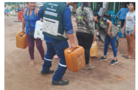
Piden mayores controles en zonas productivas

La exgerente teme que si no hay diésel, no se puedan garantizar los precios para este año y que continúe el periodo de especulación. Además, advierte sobre un posible aumento en los costos de producción, lo cual es una preocupación general en la cadena arroceras. "Sabemos que falta este control y la gente, de muy mala fe, empieza a actuar de esta forma, abusando de la desesperación que tienen muchos productores", lamentó la ejecutiva.