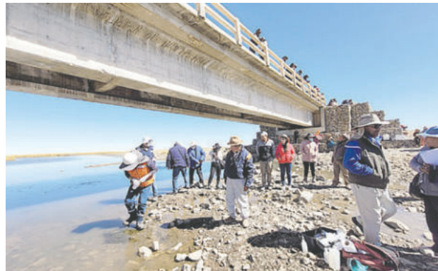
Los pobladores fueron afectados en su salud por la contaminación

Además, insistieron ante el Órgano Legislativo y a la Comisión de Pueblos Indígenas a dar seguimiento y cumplimiento a las sentencias constitucionales. Para ello, pidieron contar con la participación de organizaciones indígenas y fiscalizar al Tribunal Constitucional Plurinacional (TCP) para que resuelva en plazos establecidos acciones relacionadas con