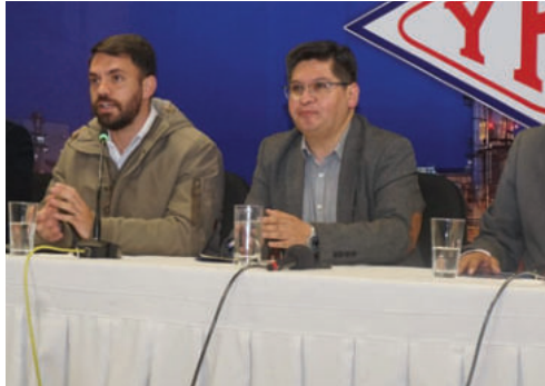
El Gobierno y el Comité Multisectorial /APG

Los artículos 2 y 3 ya están previstos en la normativa vigente, por tanto, se ratifica la vigencia de la exención del IVA a las importaciones y del gravamen arancelario a 0% a la importación de diésel y gasolina. El Gobierno y el Comité Multisectorial coinciden en que son necesarios los controles de sustancias controladas por normativa internacional. Bolivia es signatario de esas medidas y