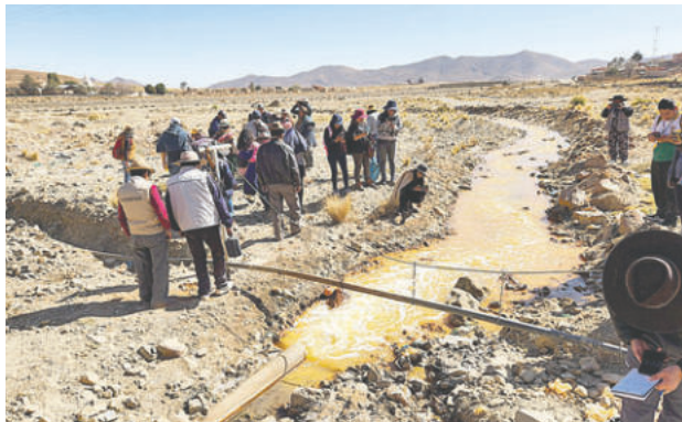
Pobladores del Ayllu San Agustín de Puñaca piden desde hace tiempo atención contra contaminación

Ante la Comisión de Naciones y Pueblos Indí-