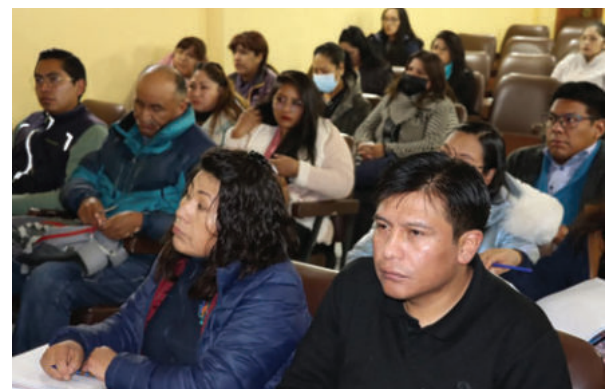
Personal de salud fue capacitado en un taller sobre el Plan Integral de Salud para la Vida

"Es importante que se entere con estos temas para bajar los