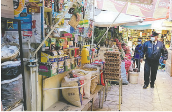
Unidad de Defensa al Consumidor, aclara que no tiene competencia para regular precios de productos