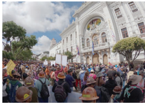
Los cooperativistas mineros se movilizaron en la plaza 25 de Mayo de Sucre

Los manifestantes recorrieron varias calles de la ciudad y llegaron hasta la plaza 25 de Mayo,