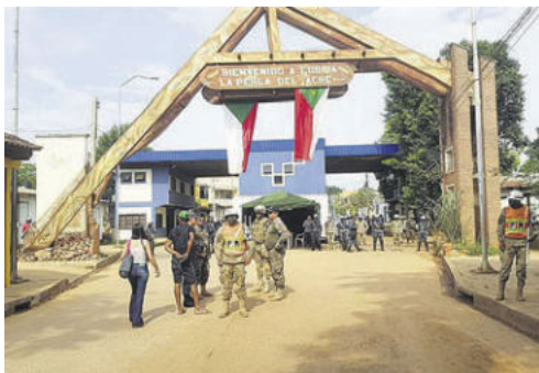
La zona fronteriza con Brasil será reforzada para mejor control

El proyecto permitirá a las entidades de control migratorio, sanitario y aduanero coordinar sus