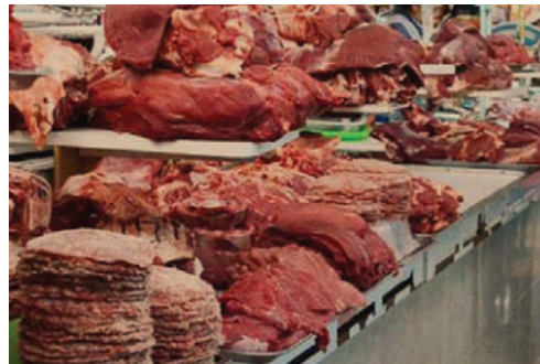
Según el Gobierno, el kilo de carne en La Paz y El Alto está a Bs. 34,50 /REFERENCIAL

Anteriormente, el ministro de Desarrollo Rural