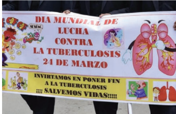
En dos meses, Oruro registro 41 casos de tuberculosis

El Día Mundial de la Tuberculosis es un día para sensibilizar sobre las consecuencias de esta enfermedad y redoblar esfuerzos para erradicarla. Su objetivo es concienciar a la población sobre las consecuencias sanitarias, sociales y económicas de esta patología y fortalecer los esfuerzos para acabar con la epidemia mundial.