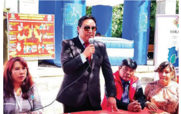
Con una feria de salud, Oruro conmemoró el Día Mundial de la Tuberculosis

En cuanto a los datos estadísticos, se detalló que en la gestión 2024, el departamento