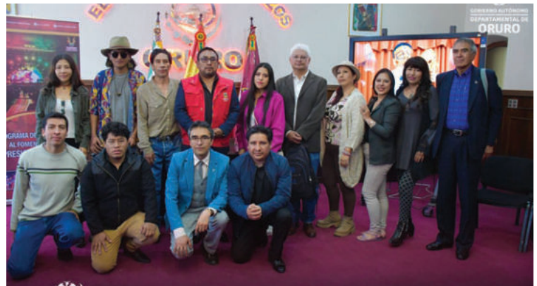
Presentación del II Festival de Teatro "Oruro de pie siempre de pie"

"Primero fue una cuestión de prueba y ahora lo consolidamos y cada