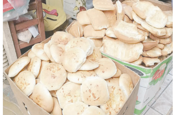
El único producto cuyo costo está regulado es el pan

En caso de generarse alguna figura de agio, tipificada como un delito en el Código Penal, se coordinará con la Policía, la Fuerza Especial de Lucha Contra el Crimen (Felcc) y el