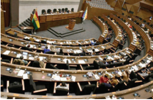
El pleno de la Cámara de Diputados en sesión

El caso Botrading surge en un contexto de crisis energética en Bolivia, caracterizado por la escasez de combustibles y largas filas en estaciones de servicio.