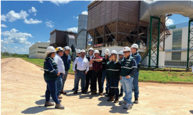
Ingenieros verifican avance del Complejo Siderúrgico del Mutún /ESM