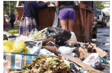
Tercer día de bloqueo en Cochabamba por conflicto por el relleno sanitario

Se espera conocer qué determinaciones se asumirán en las próximas horas y si las autoridades logran entablar un diálogo con las personas movilizadas.