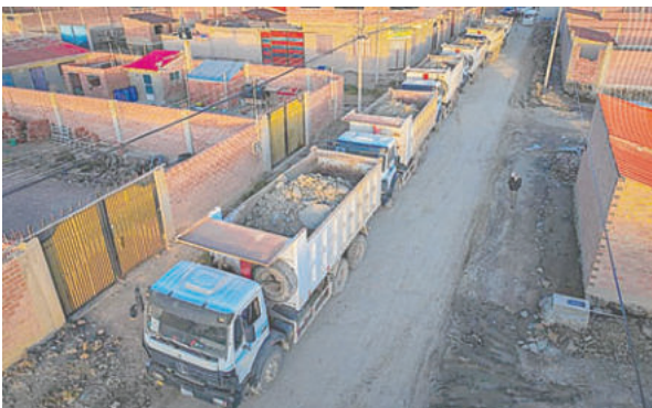
Con estas obras, líneas de transporte podrán ofrecer un mejor servicio a la población

Esa longitud es exactamente la ruta de la línea de transporte de los minibuses “9”; sin embargo, Ramírez destacó que