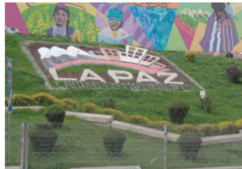
Mural alusivo a los derechos de las niñas, en La Paz (Bolivia)

Los detractores del proyecto justificaron que algunas familias casan a sus hijas menores con hombres mayores porque son pobres, que el matrimonio entre adolescentes es una supuesta conquista social, como lo son el trabajo a los 14 años, o el voto a los 16, e incluso una legisladora defendió que ella misma se casó siendo adolescente