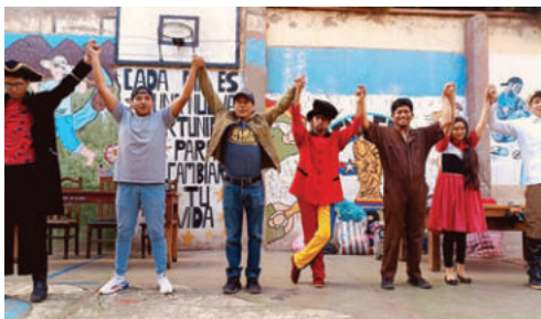
El año pasado se realizó la actividad por primera vez