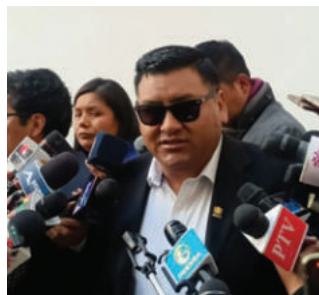
El Senador Santos Ramos

El senador Ramos indicó: "No hay ningún privilegio, se debe afrontar cualquier tipo de denuncias que se están realizando, peor si se trata de una menor, de una mujer. Yo creo que debemos ser respetuosos con las mujeres del estado, abusar de su poder y hacer lo que se les dé la gana, yo estoy totalmente en contra, porque tenemos una madre y una hija y me duele escuchar cualquier tipo de estas acusaciones".