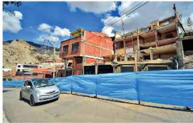
TRÁNSITO. Un vehículo recorre por la avenida Bedregal.

Los vecinos del lugar hicieron conocer la inseguridad de las viviendas cercanas a la obra, por lo que Tortato indicó que “aparen-