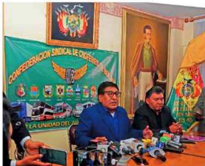
CONFERENCIA. Hablan los dirigentes del transporte público.

Las intensas lluvias que cayeron desde la madrugada de ayer sobre Santa Cruz, ocasionaron una serie de problemas sobre todo para el transporte público puesto que avenidas y calles terminaron inundadas: los más afectados fueron el Parque Industrial y los mercados. La Unidad de Emergencia Municipal de Santa de la Sierra dio a conocer que se atendió cuatro casos de caída de árboles y se esperaba que pase el fuerte aguacero para llegar a las zonas para atender otros tres casos reportados. Las autoridades recomendaron a las personas no salir de sus casas y no estacionar sus vehículos cerca de los árboles de calles y plazas.