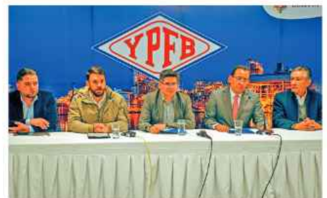
INFORME: Autoridades de Gobierno y empresarios reunidos.