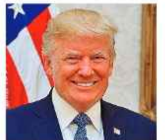
PRESIDENTE. Donald Trump, de Estados Unidos.

El Presidente estadounidense incluso asegura que muchas de personas serían miembros de la extinta organización criminal Tren de Aragua. RUSSIA TODAY