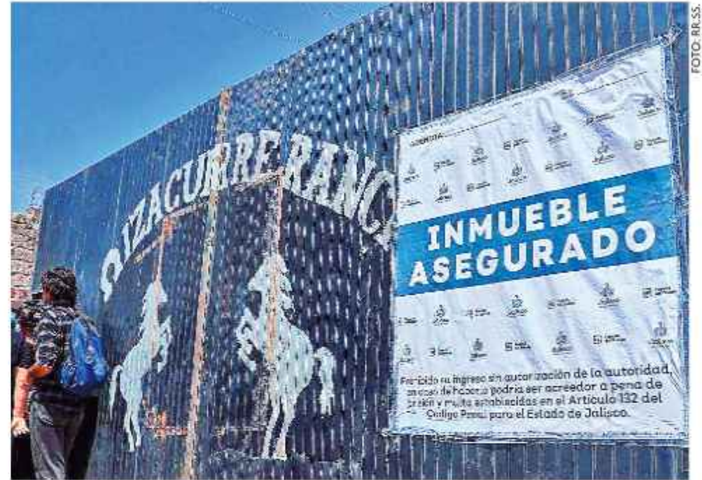
CUSTODIA. El rancho Izaguirre, presunto centro de exterminio de víctimas del narcotráfico.

También denunciaron que son objeto de "una campaña de difamación y des-