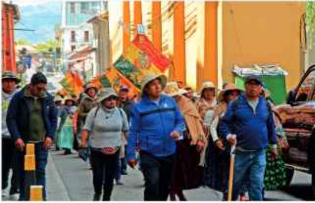
PROTESTA. La movilización de los vecinos alteños, en La Paz.