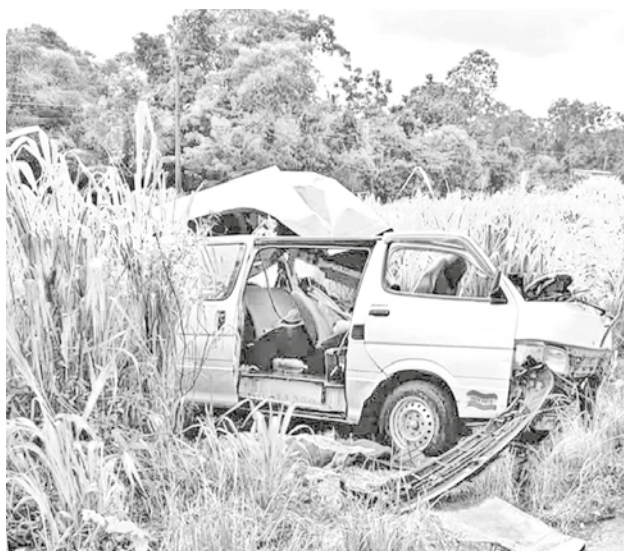
Uno de los accidentes de tránsito.

Otro de los accidentes de tránsito ocurrió el sábado 22 de marzo a las 21:30 en la carretera antigua Cochabamba-Santa Cruz, en la localidad de Chullchungani, y el protagonista fue un bus del