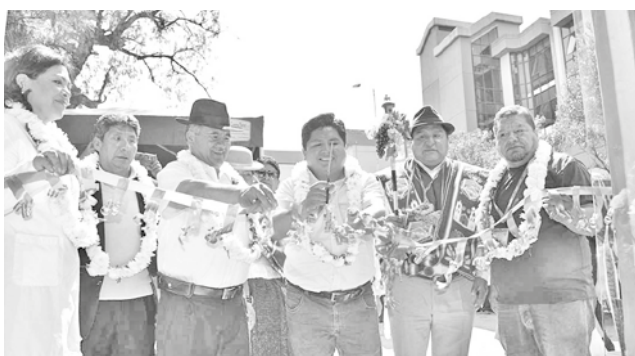
La nueva sala de consulta externa del Viedma.