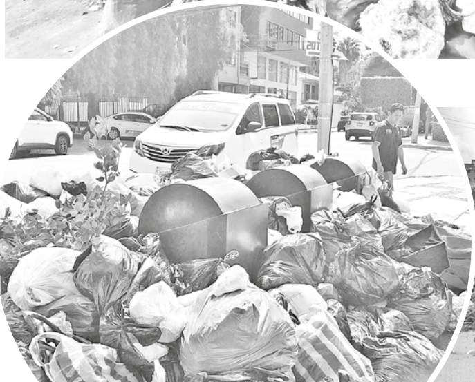
Los focos de contaminación por la basura.