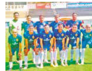
El equipo de CDT Real Oruro, ayer.

CDT Real Oruro se impuso ayer 0-2 en su visita a The Strongest en el estadio Rafael Mendoza Castellón, en duelo amistoso a días del arranque de la Liga de la División Profesional.