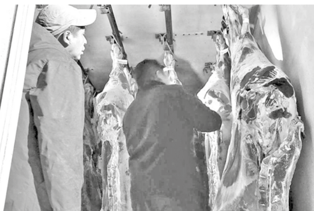
Descargan carne en un frigorífico de La Paz.

Hasta la semana pasada, el costo se mantenía en Bs 40. Sin embargo, en los con-