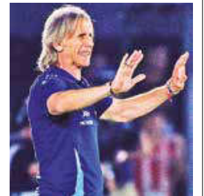
Ricardo Gareca, técnico de Chile.