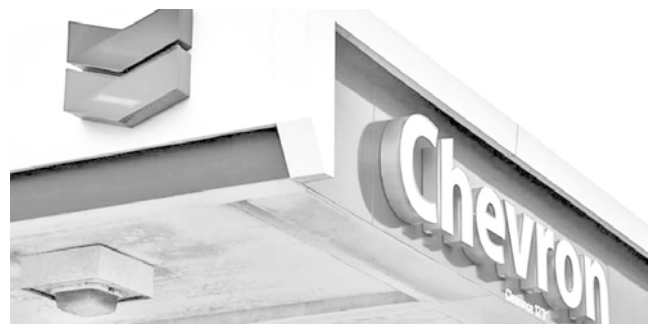
Logotipo de la compañía petrolera Chevron.

Determinación. La licencia 41B, creada por el Departamento del Tesoro, entra en vigor este lunes y se extiende hasta el 27 de mayo