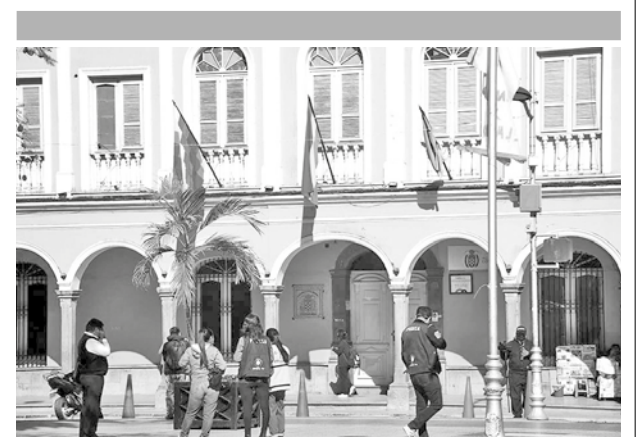
La sede de la Alcaldía de Cochabamba. CARLOS LÓPEZ

Las medidas van desde el decomiso de la placa de los motorizados con deudas de impuesto hasta el congelamiento de las cuentas bancarias del contribuyente.