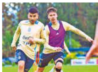
Entrenamiento de la selección argentina.

La Albiceleste llega a este encuentro con los ánimos ele-