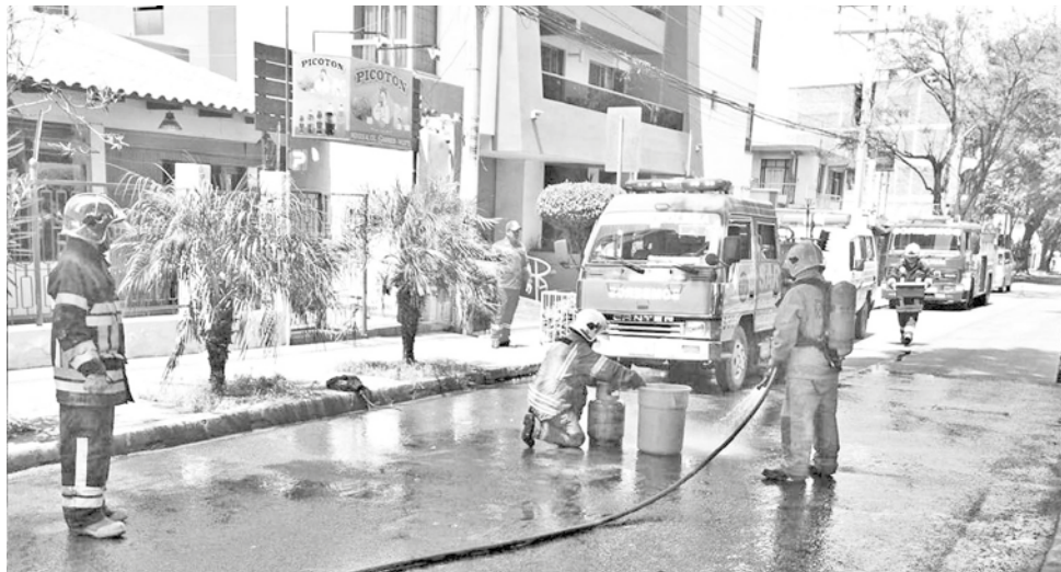
El personal de la Dirección de Bomberos en la avenida Aniceto Arce. BOMBEROSATACAMA

Además, instó a los padres de familia vigilar a sus hijos, incluso, llamó a las familias hablar en el hogar de los riesgos que representa la manipulación del fuego. Mientras el SAR Bolivia dio a conocer dos números de emergencia: 123 y EL WhatsApp 626-29999.