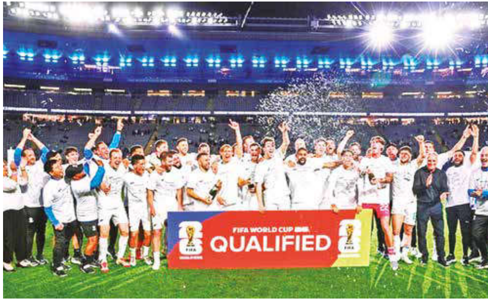
Celebración de Nueva Zelanda, tras ganar la clasificatoria de Oceanía, ayer.

Su mejor actuación fue llegar a octavos de final en cuatro ediciones: Corea-Japón 2002, Sudáfrica 2010, Rusia 2018 y Catar 2022. Se fue en fase de grupos en Francia 1998, Alemania 2006 y Brasil 2014.