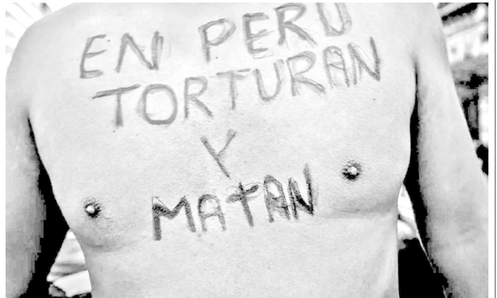
Manifestantes participan en una protesta cerca al Congreso de la República en Lima, Perú.

Este hecho motivó una serie de medidas como la inmovilización social obligatoria, el toque de queda, entre otras. Incluso, en las primeras