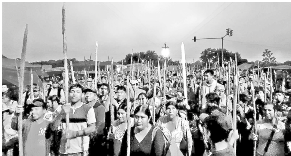
Custodian el ingreso a Lauca Ñ, en el trópico de Cochabamba.

Sobre el líder cocalero pesa una orden de aprehensión emitida por la justicia, así como la anotación de sus bienes y su arraigo. Dirigentes evistas han afirmado que alrededor de 10.000 personas están resguardando la integridad de Evo, atrincherado en Lauca Ñ.