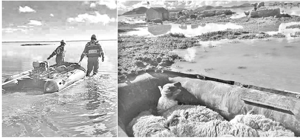
Rescatan ganado en botes, en Pumphulaya, en Oruro. GADOR