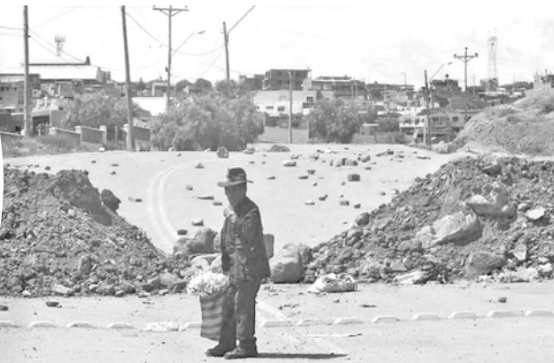
El bloqueo en el ingreso al botadero.