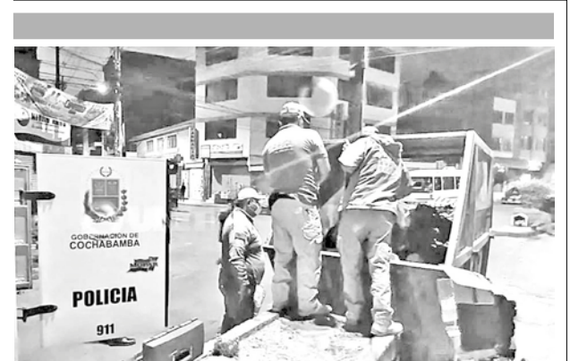
La Policía investiga el hallazgo del cadáver.

Finalmente, el quinto accidente es una colisión frontal por invasión de carril, y sucedió el domingo 23 de marzo en la vía Cochabamba-Santa Cruz. Según la Policía, un tracto camión chocó contra un minibús en el que se trasladaban dos personas, ambas fallecieron.