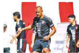
Jugadores de Venezuela en práctica de la Vinotinto. @selevinotinto

Venezuela y Perú se verán las caras hoy (20:00 HB) en el estadio Monumental de Monagas, en el partido por la fecha 14 de las eliminatorias, a la que ambos llegan con la urgencia de sumar las tres unidades si quieren continuar con chances de luchar por el repechaje hasta las últimas jornadas de las clasificatorias.