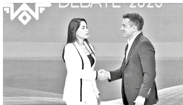
El apretón de manos entre los candidatos dio inicio al debate.

Washington también estaba sopesando un plan para imponer aranceles u otras sanciones financieras a los países que compran petróleo a Venezuela, según el artículo, información que se confirmó ayer.