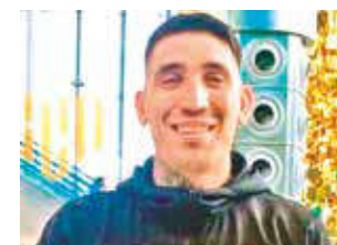
El futbolista argentino Ricardo Centurión.

El extremo argentino Ricardo Centurión (32 años) firmó ayer contrato con Oriente Petrolero, luego de dos años sin jugar al fútbol, con la duda que se cierne sobre los cupos extranjeros