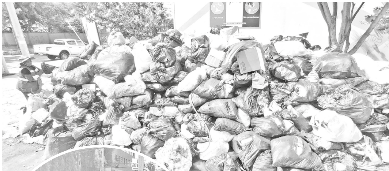
La gran cantidad de basura que se acumula en la ciudad.

Contaminación. La gran cantidad de bolsas con basura que los ciudadanos dejan en los contenedores y esquinas por la suspensión del servicio de recojo de EMSA está provocando focos de infección