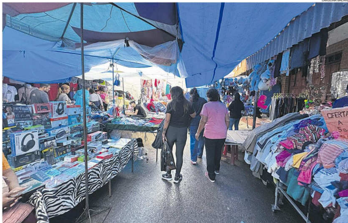
Cientos de personas adquieren productos en las diferentes ferias que se realizan en la zona fronteriza ubicada entre Bolivia y Argentina