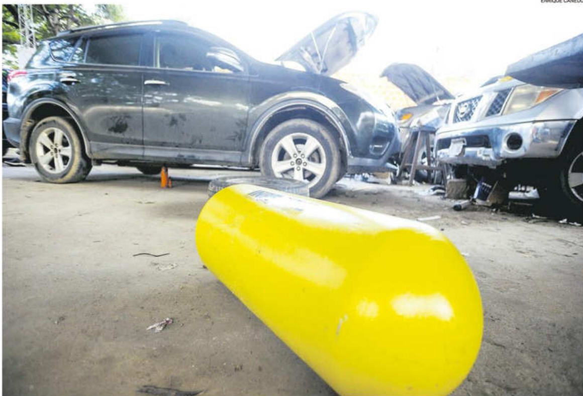
Santa Cruz y Cochabamba son las principales plazas que tienen una mayor cantidad de vehículos a GNV

“Las cifras indican el éxito de pasar a energías más limpias en donde esta conversión a GNV es gratuita para las personas que solicitan el servicio, a través de