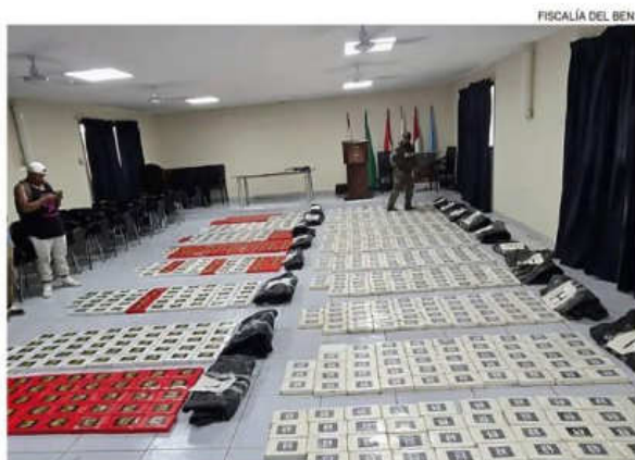
La tonelada de droga estaba escondida en bolsas de yute en el Beni

En tanto que Föhrlig destacó el intercambio de información, no solo para incautar drogas, sino que "servirá para desmantelar organizaciones criminales que operan a ambos lados de la frontera".