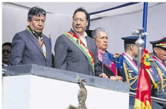
El presidente Arce participó de los actos oficiales en La Paz

En resumen, Bolivia erogó algo más de $us 14 millones para la demanda marítima durante la era Evo y unos $us 18 entre 2019, el año que esa dirección más recursos para el pleito del Silala, y 2025.