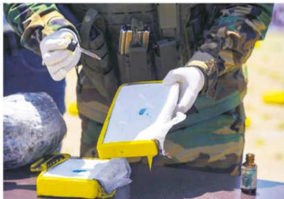
Cerca de media tonelada de clorhidrato de cocaína fue secuestrado