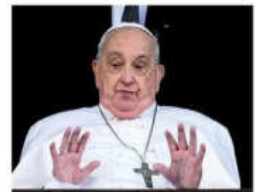
El pontífice fue dado de alta

salir a las calles en el resto del país, aplazaron sus acciones y aceptaron dialogar con autoridades gubernamentales A2-3