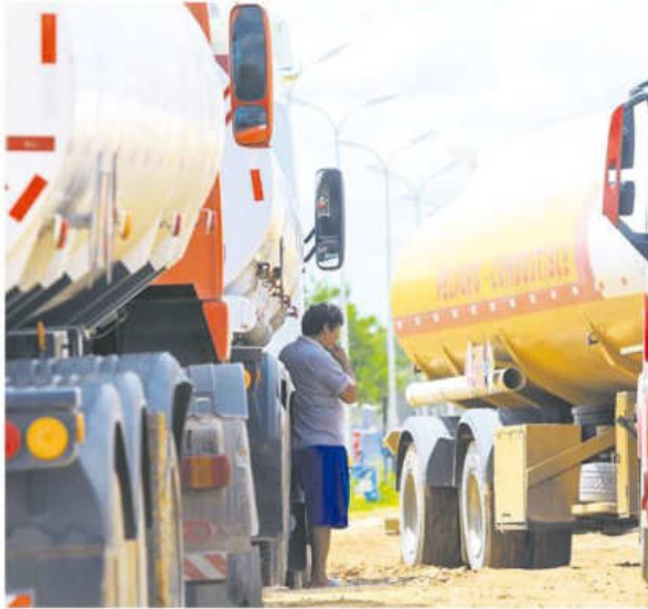
Las cisternas también esperan varios días para poder descargar

no 'hambreador' para que dé soluciones", dijo Toledo al adelantar que después de la marcha se vendrán nuevas medidas de hecho.