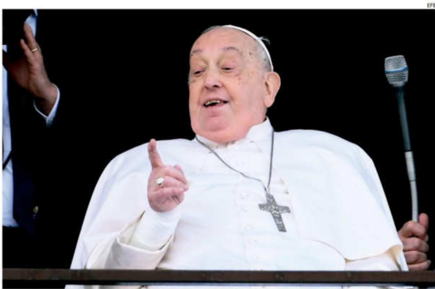
El papa Francisco abandonó el hospital tras 38 días de internación por una infección respiratoria