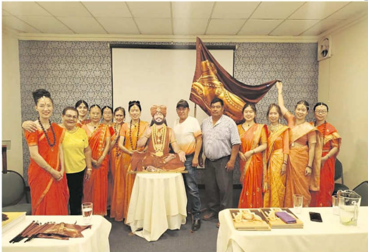
Los dirigentes guaraníes con miembros de Kailasa. Este último buscaba el arrendamiento perpetuo de tierras bolivianas