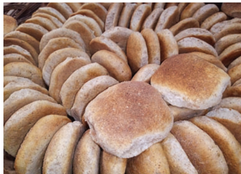
Pan escasea en algunas provincias de Oruro

Según informó, el acuerdo mensual, no cubre el requerimiento de consumo del departamento, ya que de los 15.695 quintales que se necesita, sólo se comprometió la entrega de 14.285 en el techo mensual, lo que ya afecta el abastecimiento de pan.