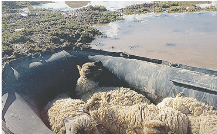
El ganado fue evacuado en lanchas

Para este trabajo, se tuvo que hacer varios viajes en lanchas, ya que, por el peso de los animales, se debía garantizar la seguridad con el fin de que se sobreleve la situación, ya en las últimas horas, se tuvo también el apoyo de personal de la Dirección