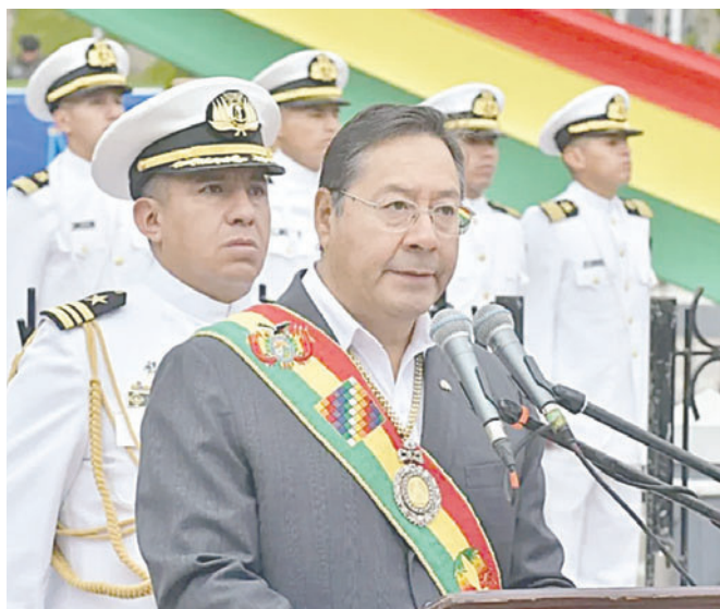
El Presidente Luis Arce durante su discurso, este domingo

"Bolivia tiene que conocer los detalles más importantes de estos juicios, para comprender sus resultados. Con estas decisiones ingresaremos a una nueva etapa en la relación