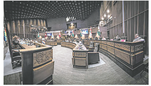
La propuesta será analizada para su aprobación o rechazo /REFERENCIAL CÁMARA DE SENADORES

Organizaciones de salud y especialistas en nutrición han instado al gobierno a implementar