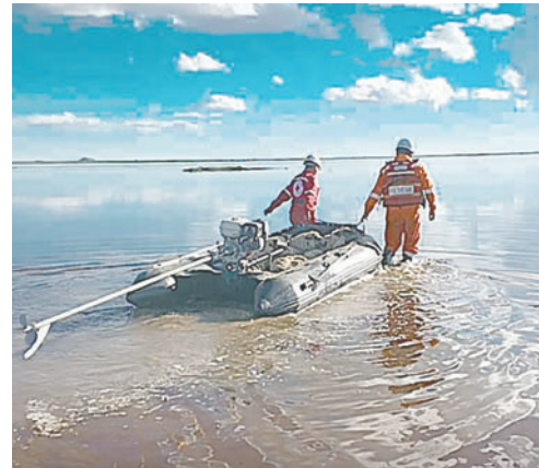
Las lluvias pusieron en riesgo al ganado de la zona

Desde la Gobernación de Oruro, aseguraron que en otros municipios se realizan otros trabajos para contrarrestar el tema de las inundaciones causadas por las intensas lluvias, como el prestamos de motobombas, maquinaria pesada y otros dependiendo de la situación.