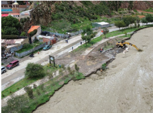
Lluvias afectan gran parte de Bolivia

Mientras tanto, el Servicio Nacional de Meteorología e Hidrología (Senamhi) mantiene vigente una alerta roja por posibles desbordes de ríos en Tarija, Chuquisaca, Potosí, Cochabamba, Beni, La Paz y Pando.