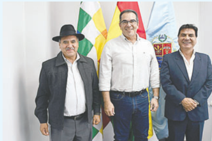
Los gobernadores tras el encuentro

La primera autoridad departamental, destacó el papel central del