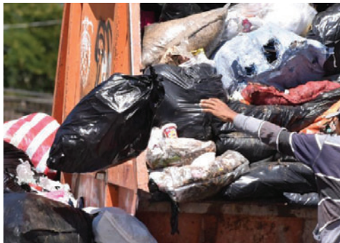
Alcaldía pide dialogo a los manifestantes

Imágenes difundidas por medios locales muestran contenedores rebalsando de desechos mientras los vecinos continúan dejando sus residuos en distintos puntos de la ciudad.