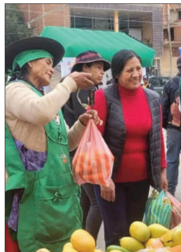
Una de las ferias populares.

Las ferias ‘Del campo a la olla’ se realizarán cada semana en todo el país