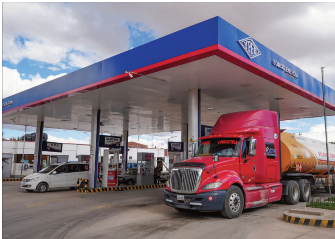
CONTRATACIÓN. Un camión cisterna traslada combustible de importación para Bolivia.

Respecto a la denuncia de que YPYB anuló en septiembre de 2024 la adjudicación que había otorgado a Petroperú para el suministro de combustibles para dársela a Botrading pese a que el