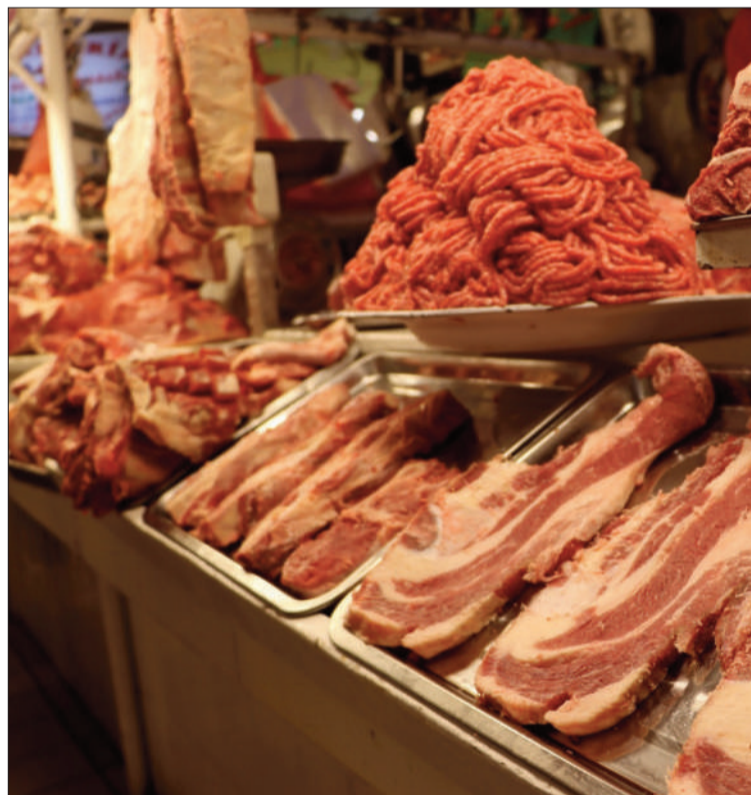
MERCADOS. El precio de la carne aún se mantiene elevado.

El funcionario explicó, además, que el sector ganadero se comprometió a entregar mayor volumen de carne a los mercados de