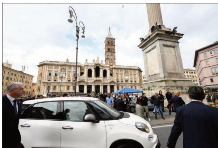
RETORNO. Recorrió varias calles y saludó a las personas.

de los interrogantes sobre su capacidad para reanudar sus actividades. Su equipo médico anunció el sábado su alta del hospital Gemelli de Roma, pero detalló que deberá cumplir 'una larga convalecencia' de 'al menos dos meses'.