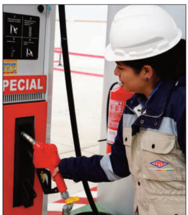
Venta de gasolina se normaliza.

El presidente de YPFB dijo que aún persisten algunas filas por diésel