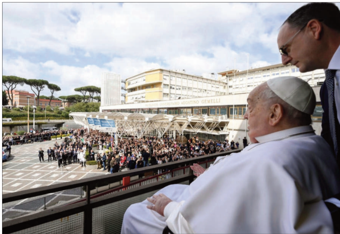
SALUDO. El Papa salió al balcón del Hospital Gemelli para saludar a quienes querían verlo.

En su oración dominical del Ángelus, el papa escribió estar "entristecido por la reanudación del intenso bombardeo israelí de la Franja de Gaza" y exigió su fin "inmediato". Francisco no preside la oración del Ángelus desde el 9 de febrero. Desde entonces, ha faltado a la cita cinco semanas consecutivas, algo inédito desde su elección. El alta del pontífice, cuyo estado mejoró paulatinamente en las últimas semanas, se esperaba con impaciencia ante el aumento