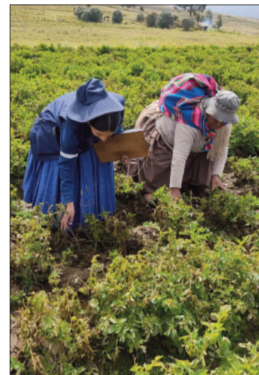
Los cultivos están afectados.

La semana pasada, el presidente de la Federación de Asociaciones Municipales de Bolivia, Flavio Merlo, informó que se contabilizan 130 gobiernos municipales afectados, en mayor o menor medida, por las lluvias y granizo, que provocaron inundaciones que ponen en riesgo la seguridad alimentaria debido a la pérdida de más de 60 hectáreas de cultivos.