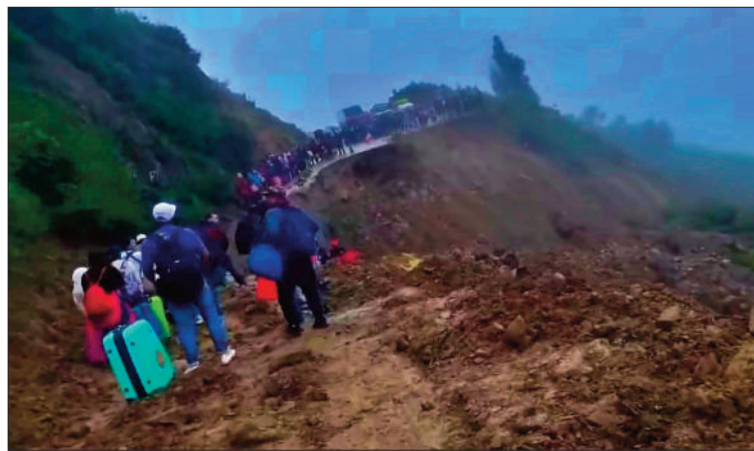
PROBLEMA. Las lluvias causan desastres en las carreteras del país.

Aunque las lluvias persisten, el viceministro reportó ayer que las carreteras de la RVF se encuentran expeditas, pero aclaró que los equipos siguen en apronte. “Al momento, tenemos toda la Red Vial Fundamental transitable”.