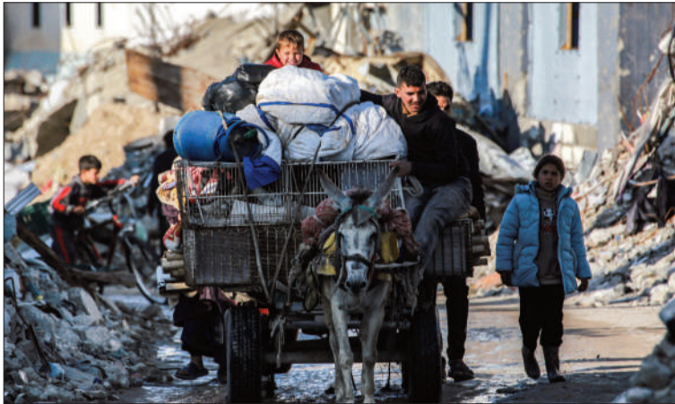
OPCIÓN. Los palestinos podrán optar por migrar a otros países.

El Gabinete de Seguridad creará una agencia que gestione las salidas.