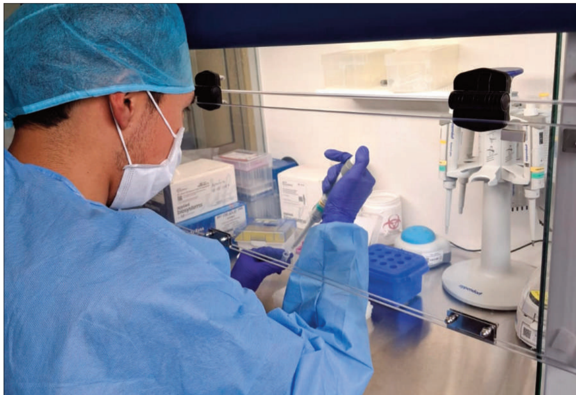
TRABAJO. Salud aseguró que se trabaja en la actualización de la red de laboratorios de tuberculosis.

“Una de las principales innovaciones es la implementación del diagnóstico rápido utilizando la tecnología GeneXpert para tuberculosis infantil, a través del proce-