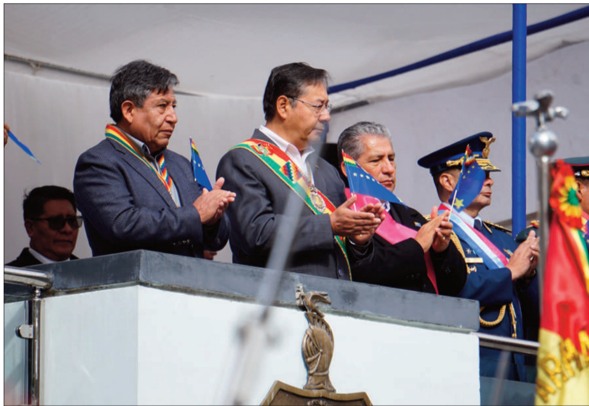
HOMENAJE. Luis Arce presidió los actos en la plaza Abaroa, entre ellos la ofrenda floral y el desfile.

Así, el 23 de marzo 2013, el gobierno de Morales anunció un juicio penal contra Chile en la CIJ con el fin de recuperar la salida soberana al océano Pacífico. “He decidido que en los próximos días una comisión viaje a La Haya a presentar una demanda para retornar al mar con soberanía”, dijo Morales en el mismo acto de ayer de ese año.