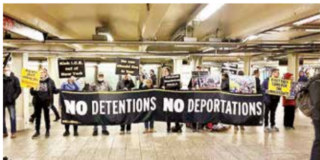
Venezolanos son repatriados desde Estados Unidos.

Dato. Según cifras oficiales, desde febrero de 2025, un total de 919 venezolanos han regresado al país en cinco vuelos organizados