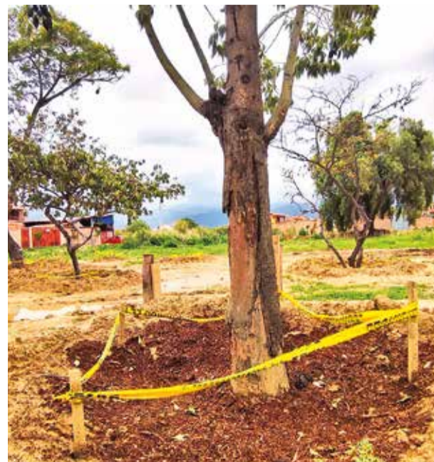
El árbol en su nuevo hogar, en la av. final Beijing. D.J.