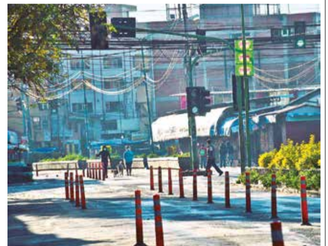
Ciudadanos durante la cuarentena. FOTOS: CARLOS LÓPEZ

FUENTE: Ministerio de Salud INFOGRAFÍA: Los Tiempos, Wilson Calhaya