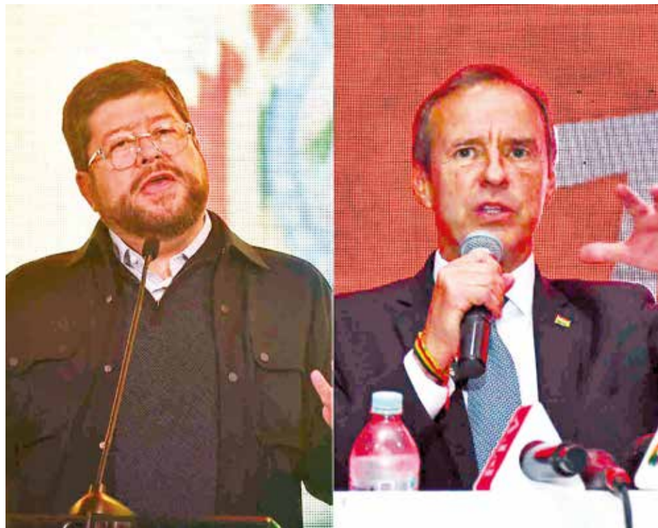
Samuel Doria Medina y Jorge "Tuto" Quiroga, precandidatos opositores.

El viernes se conoció que tres empresas: las bolivianas Ipsos y Captura Consulting; además de la argentina Interactiv, se harán cargo de las encuestas. Según el expeditado Monasterio, la empresa Captura Consulting estará a cargo de la encuesta definitiva.