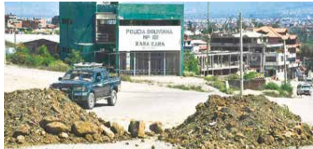
Uno de los puntos de bloqueo en K'ara K'ara. DANIEL JAMES

finitivamente el botadero la hemos tomado como bases y no como dirigentes. Recordemos que existe un acta que fue firmada hace seis meses, y es el plazo que pidió la alcaldía. Desde hoy (ayer), las bases no permitirán el ingreso al botadero”, dijo.