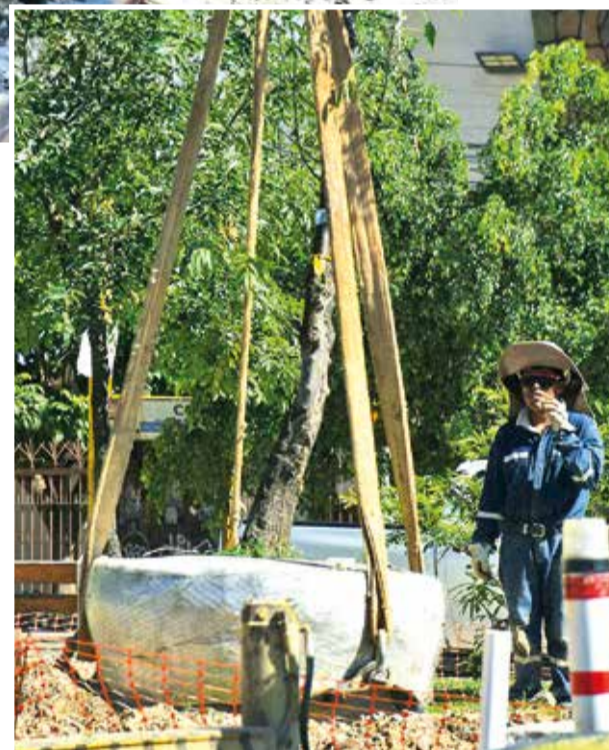
La extracción de la planta con una grúa. JOSE ROCHA

ver un árbol de un lado a otro, por una obra en construcción. Para la construcción del corredor vehicular en 2021, se trasplantaron 36 árboles de la avenida Uyuni, entre ellos principalmente fresnos, molles y un jacarandá, a los parques del Arquitecto y Jorge Trigo Andía.