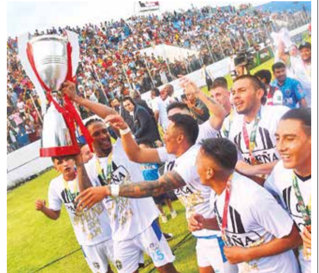
San Antonio de Bulu Bulu, campeón del Torneo Apertura 2024 de la División Profesional. DANIEL JAMES