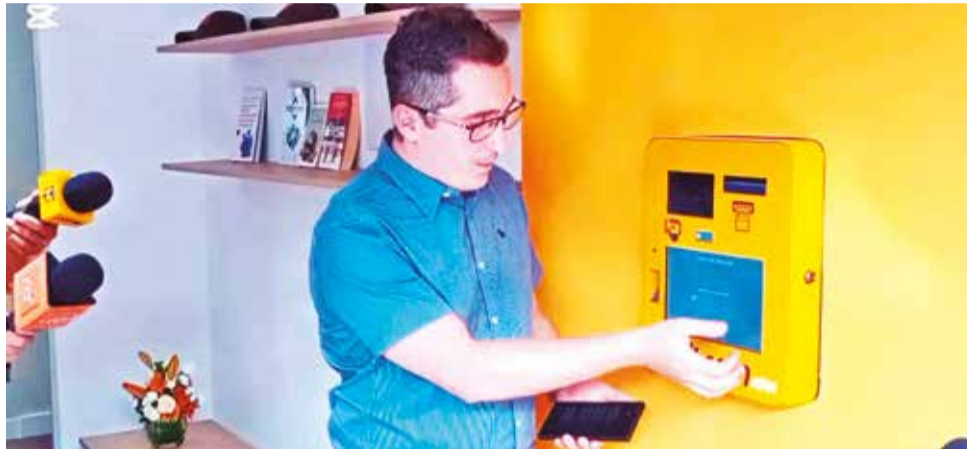
El primer cajero de criptomonedas que se inauguró en Santa Cruz. BITBASE

“El dólar es la moneda oficial para intercambios, pero el Bitcoin está facilitando el intercambio comercial no sola-