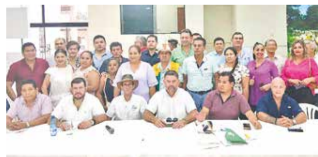
Integrantes del Comité Multisectorial. APG

Ampliado. El Comité Multisectorial convocó a un ampliado el 2 de abril en El Alto para evaluar el curso de las movilizaciones