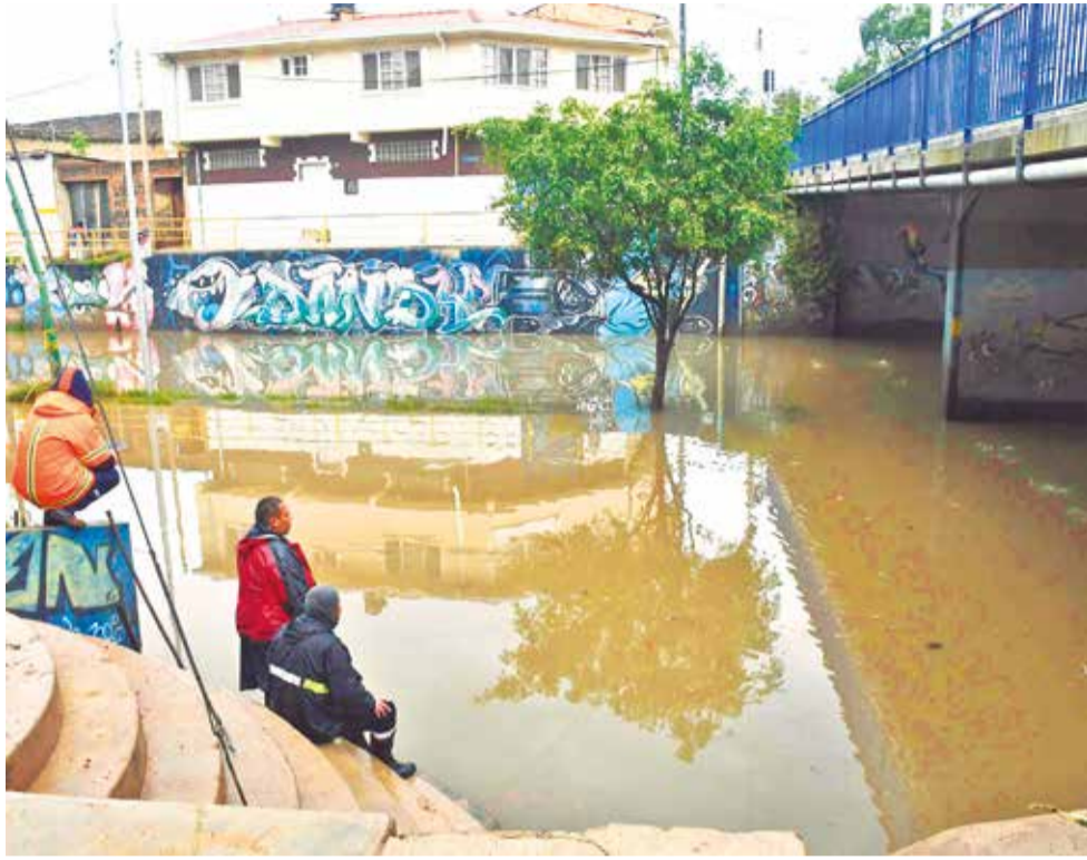
El puente de la final Ayacucho anegado tras las intensas lluvias en la ciudad. CARLOS LÓPEZ