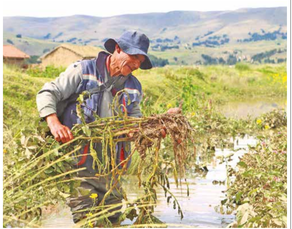
Un productor muestra sus cultivos afectados por una inundación, en Vacas. ALD