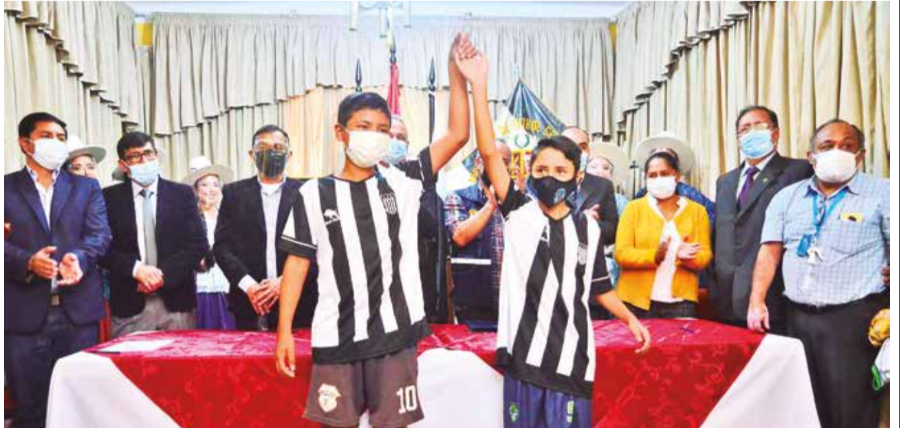
Acto de la reunificación de la AFC, el pasado 16 de febrero de 2022, en el salón de honor de la sede de la calle Ecuador. HERNÁN ANDÍA

Al momento, hay tres temas para resolver y materializar el inicio de obras: el tema dólares, para compra del predio; trámites para adquisición y otros que implican el proceso; además, la FBF pueda dar el desembolso inicial.