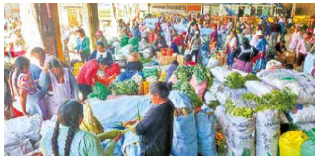
El nuevo mercado de la avenida Petrolera. DANIEL JAMES

Sociedad. Según la Intendencia Municipal, lo que se busca es brindar mayor comodidad y seguridad los compradores que van al lugar