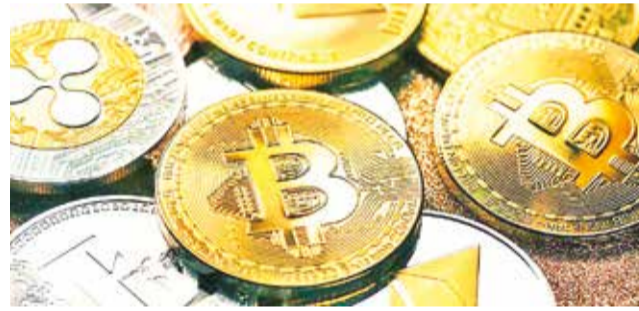
Las criptomonedas para intercambio comercial.