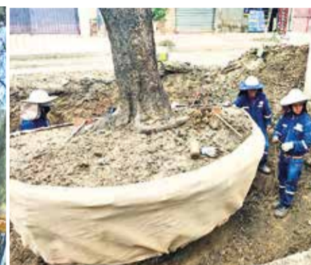
Separan las raíces en una porción de tierra para el trasplante.