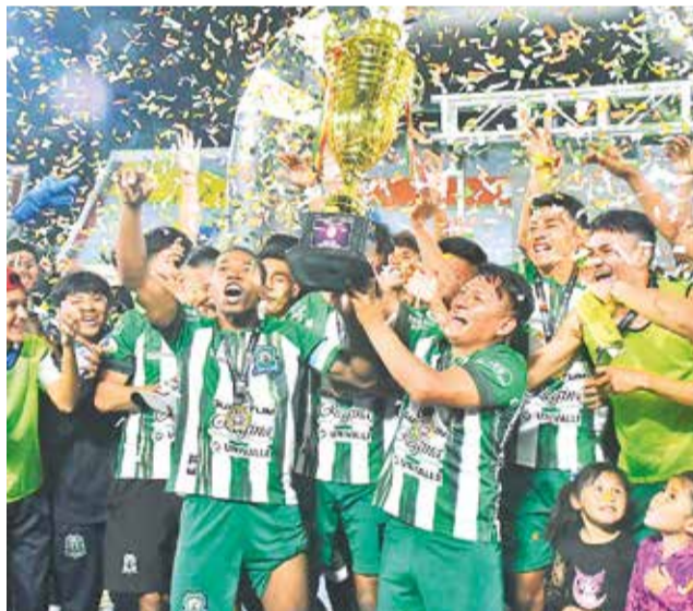
Celebración de Municipal Tiquipaya, campeón 2024 de la División Primera "A" de la AFC. DANIEL JAMES