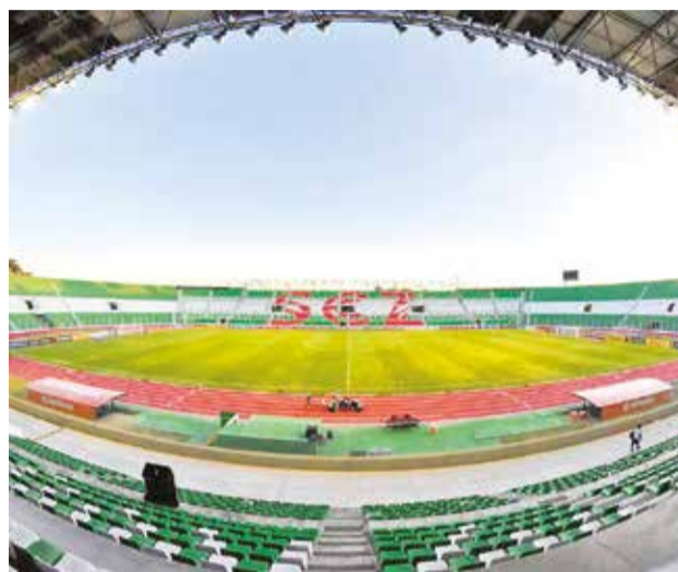
Vista panorámica del estadio Tahuichi Aguileira de Santa Cruz.

La Gobernación y Alcaldía de Santa Cruz ya hicieron