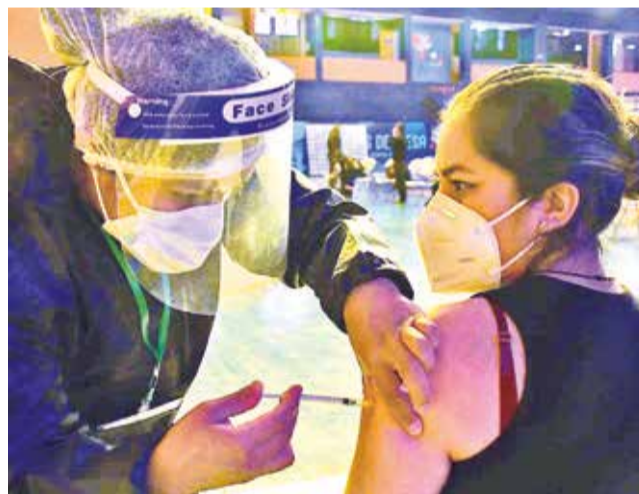
Vacunan a pacientes contra el coronavirus.

Las primeras vacunas arriban al país a inicios del 2021.