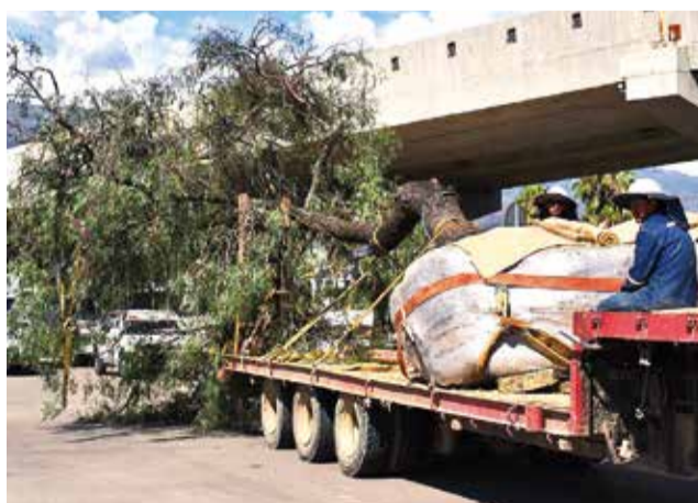
El traslado de uno de los árboles de la Perú. JOSE ROCHA

El proceso incluye cortes, preparación del cepellón y la plantación en los hoyos adecuados. Después del trasplante se hará un seguimiento durante un año para monitorear su adaptación al nuevo espacio y garantizar su supervivencia. Sin embargo, el pro-