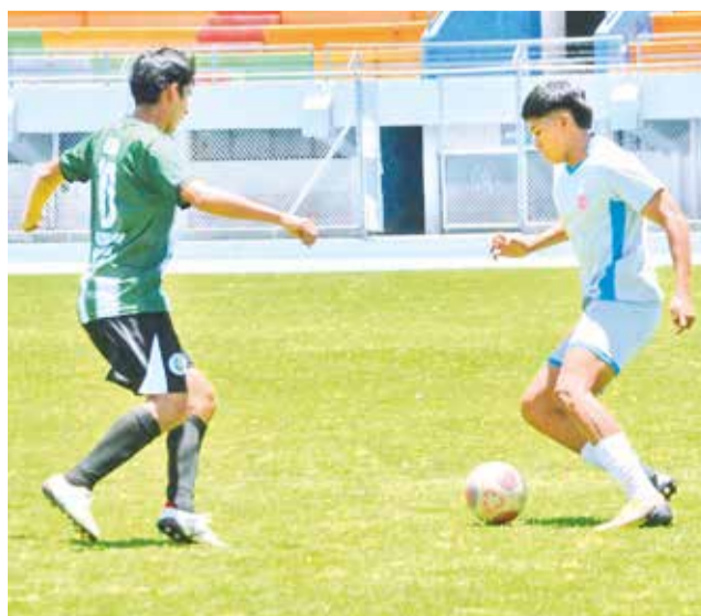
Duelo de la fecha final de la División Primera "B" entre Oruro Royal y Chacacollo. HERNÁN ANDÍA