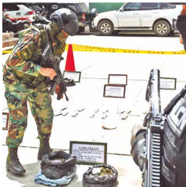
El microtráfico que la Felcn decomisó de las calles de la ciudad de Cochabamba. CARLOS LÓPEZ

de este año, la Felcn aprehendió a siete personas dedicadas al microtráfico, entre ellas, a una mujer embarazada, a una trabajadora sexual y a un menor de edad.