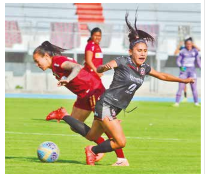
Partido final de la Liga Femenina Fútbol 2024 entre Astor FC y Always Ready. DANIEL JAMES