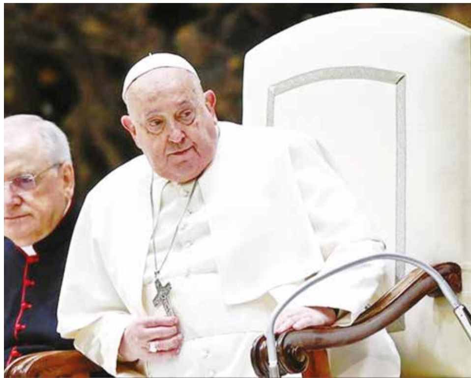
El papa Francisco en una de sus últimas apariciones en público.

“He sentido profundamente vuestra cercanía, especialmente a través de las oraciones con las que me habéis acompañado”, afirmó, reiterando su llamado a la unidad entre los creyentes y su habitual petición: “Rezo por voso-