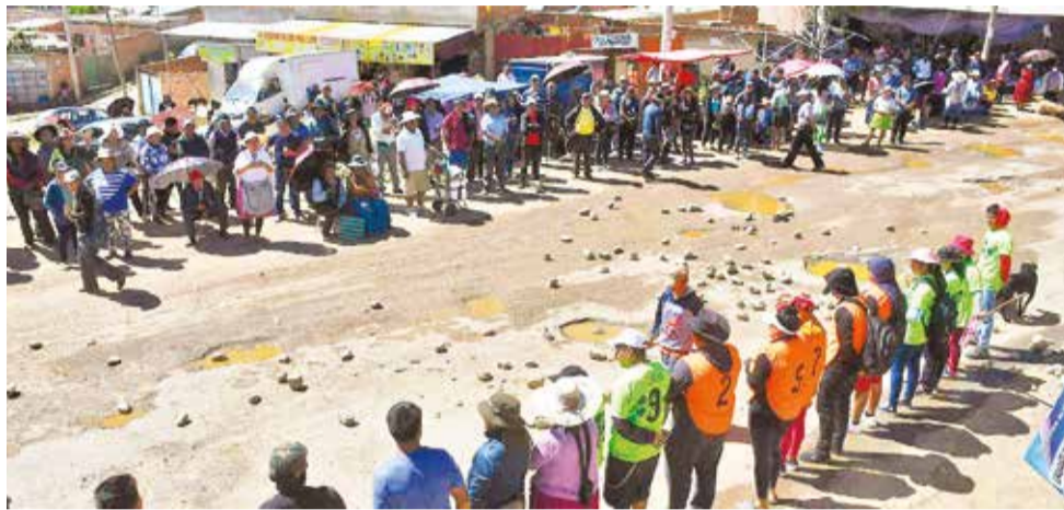
El cabildo que realizaron ayer los pobladores de K'ara K'ara, en el ingreso al botadero. D.J.

“Muy pronto se le va a dar una solución definitiva, nunca más va a haber relleno sanitario, ni botadero, lo que debe haber es una planta de industrialización, se va a dialogar con los vecinos, existen tres grupos en el lugar, unos quieren que siga ahí la basura y otros quieren que se vaya”, sostuvo Reyes Villa.