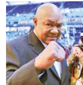
El exboxeador George Foreman.