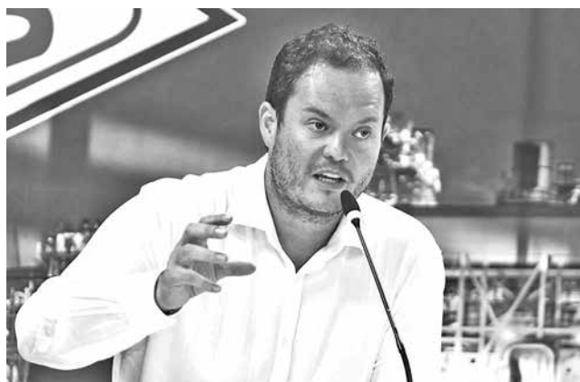
El presidente de YPFB, Armin Dorgathen.

El presidente de la estatal petrolera, Armin Dorgathen, desvirtuó las denuncias y dijo: “Botrading es una empresa constituida por YPFB Refi-