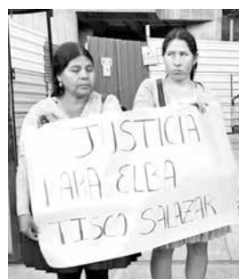
Protestan contra conductor. CADENA A