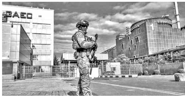
Imagen de la central nuclear de Zaporíyia, en Ucrania.

Acuerdo. El mandatario dio detalles de la conversación sostenida con Trump en medio de las negociaciones para acabar con la guerra