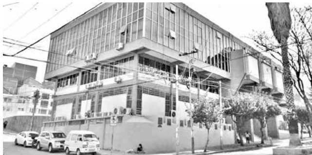
Tribunal Constitucional Plurinacional. CORREO DEL SUR

Determinación. Los magistrados también dieron por válida la aprobación del decreto presidencial de amnistía e indulto