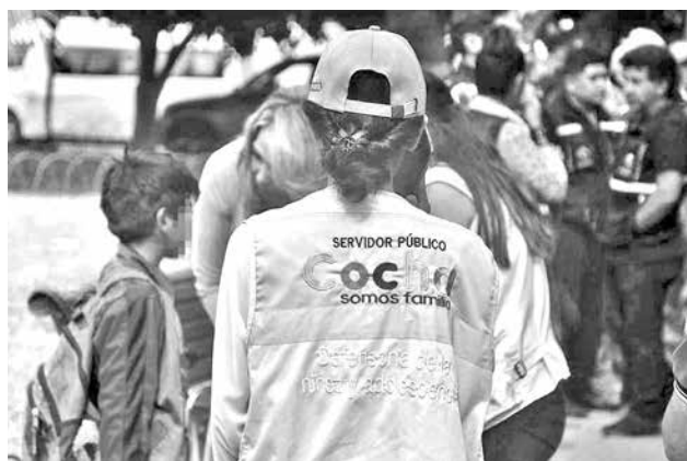
Un operativo de la Defensoría de la Niñez. HERNÁN ANDÍA

Según el informe de la DNA, de enero a febrero se registraron: 35 casos de extravío de menores, 28 casos de violencia física y psicológica, 24 casos de violación sexual y estupro, 20 casos por falta de provisión adecuada y oportuna, 5 casos de responsabilidad penal, 5 casos de corrupción