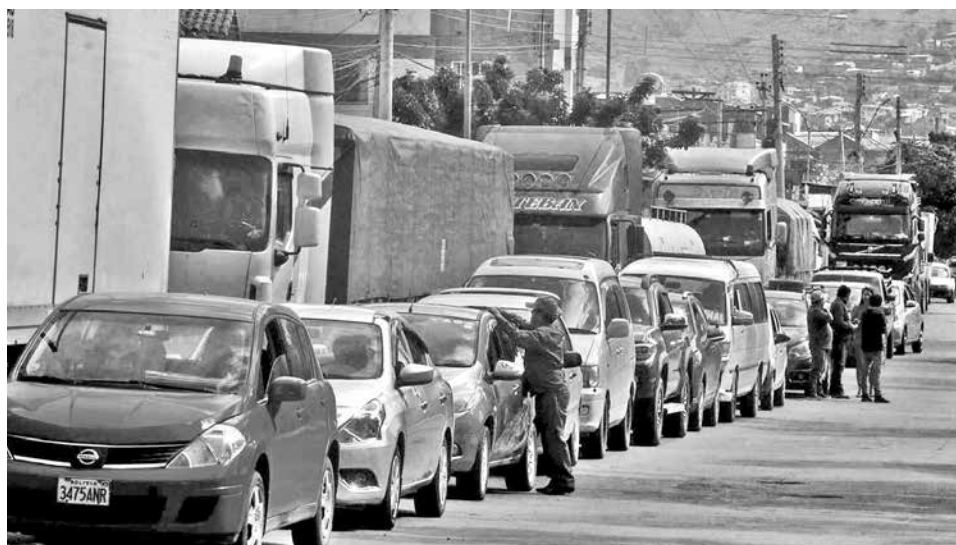
Las filas para la compra de combustible en los surtidores. DANIEL JAMES

Tumiri especificó que a La Paz se destinó 1.900 metros cúbicos de gasolina y 1.700