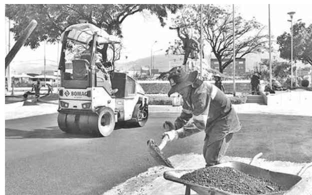
El bacheado de vías en la zona norte de la ciudad. C. LÓPEZ