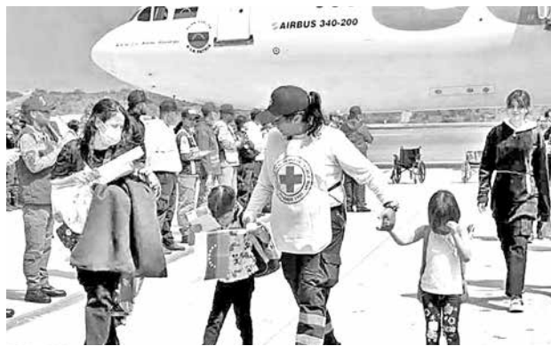
Algunos niños que volvieron a Venezuela.

Zelenski también reveló que Trump le preguntó si aceptaría la idea de que Estados Unidos gestione la central nuclear. “Le contesté que sí si existe la oportunidad de que se modernice, se invierta en ella y demás”, afirmó.