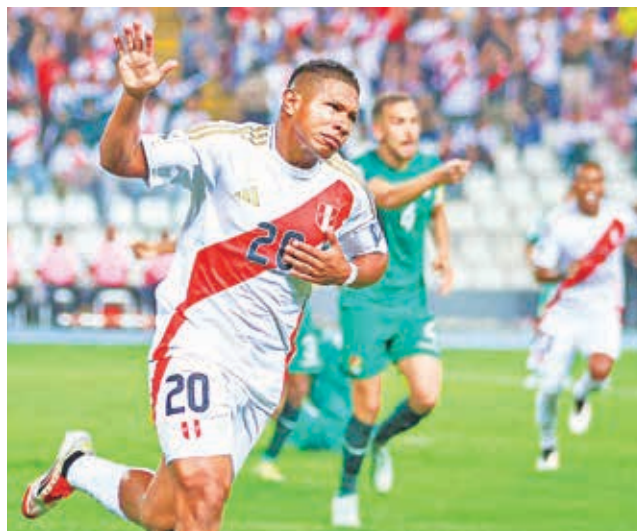
Edison Flores festeja el gol de la victoria de Perú.