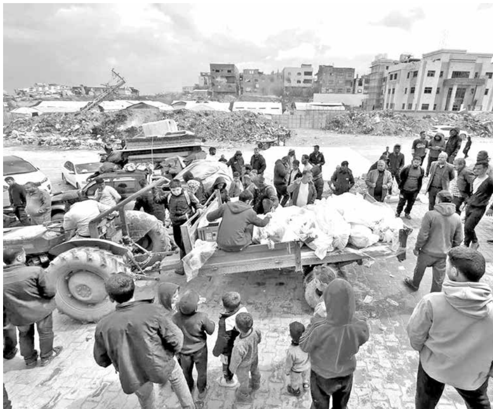
Varios gazatíes rodean un vehículo que retira los cadáveres de varias víctimas tras una ofensiva en la localidad de Beit Lahia, en el extremo norte de la Franja de Gaza.