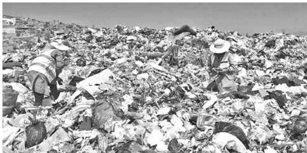
El relleno sanitario de K'ara K'ara en la zona sur. C. LÓPEZ

Acuerdo. Los vecinos de K'ara K'ara piden que se cumpla con el cierre del botadero. La Alcaldía dice que el diálogo está abierto