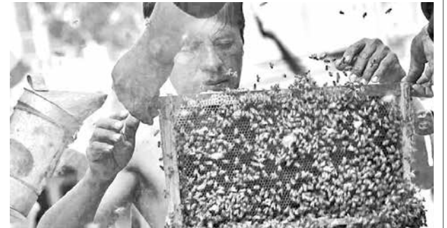
El “Hombre Abeja” hace una demostración. JOSÉ ROCHA