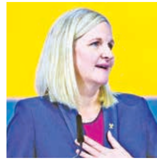
Kirsty Coventry, la nueva presidenta del COI. COI

La zimbabuense, de 41 años, ocupará el cargo por