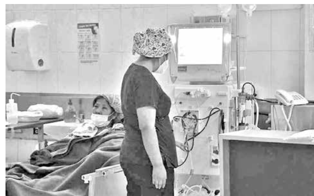
Pacientes renales son atendidos. CARLOS LÓPEZ

También emitieron una resolución para dar continuidad al proceso de preselección de candidatos a las judiciales y aprobar un crédito externo y el decreto presidencial de indulto.