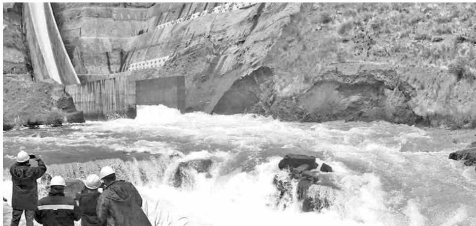
El deslizamiento tras el rebalse de la presa de Misicuni el 12 de marzo.

Sin embargo, el presidente de la Empresa Misicuni enfa-