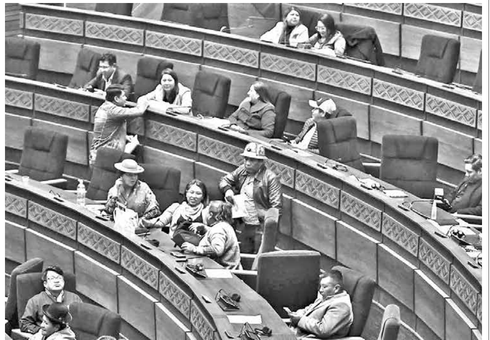
Legisladores en en pleno de la Asamblea, ayer.

El pleno de la Cámara de Diputados aprobó en sus dos sesiones el proyecto de ley de Sistema de Transmisión y Publicación de Resultados