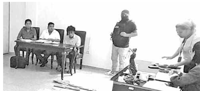
Autor de asesinato de una adolescente.

“Ha concluido la audiencia cautelar del último caso de fe-