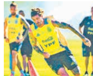
Jugadores de la Albiceleste en entrenamiento.

Uruguay y Argentina se volverán a encontrar hoy (19:30 HB) en un nuevo episodio de uno de los clásicos más antiguos del mundo, en duelo por la fecha 13 de las eliminatorias, que se jugará en