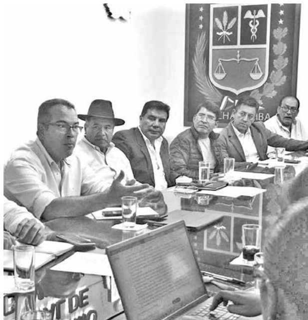
La reunión de siete gobernadores del país, ayer. D. JAMES

Remarcó que no se paga viáticos, se trabaja en horario continuo y la cantidad de recursos humanos se limitó al mínimo que de seguir haciendo más ajustes se terminaría