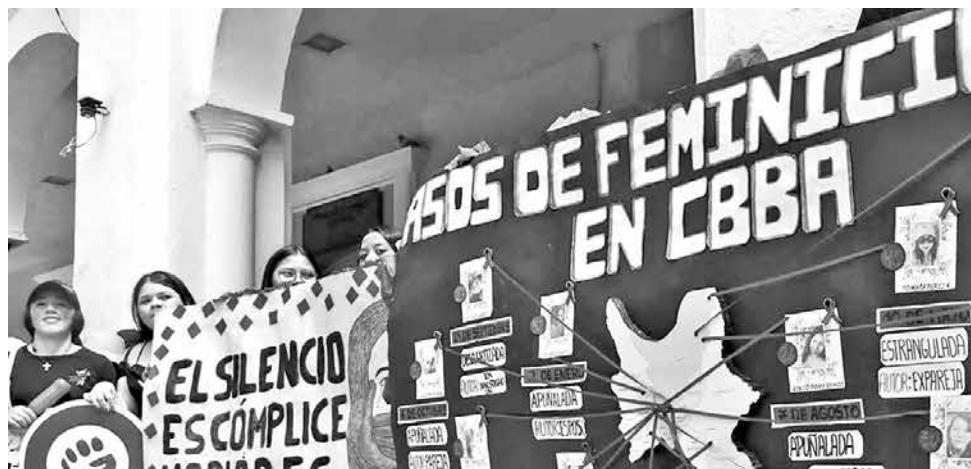
Una marcha en contra de los feminicidios en Bolivia. AXCVXCV

“Se presentaron todos los elementos de convicción, como el registro del lugar, declaraciones testimoniales, informe de autopsia, entre otros, que demuestran de manera irrefutable que el sujeto es el autor del delito”, explicó.