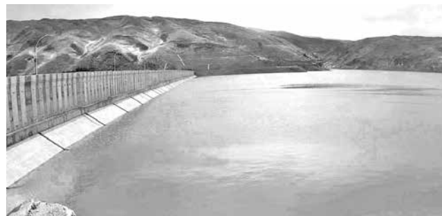
El embalse en su capacidad máxima por las lluvias.

“En anteriores gestiones no hemos tenido este problema porque no hubo mucha lluvia, no es significativo porque en ese sector hay roca madre, pero en el marco de la precaución vamos a hacer trabajos, justamente estamos subiendo para ver ese detalle