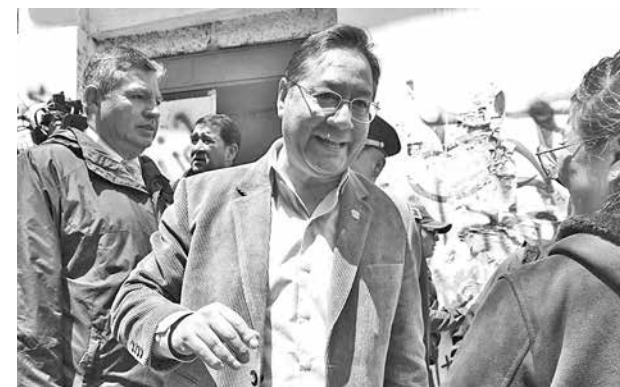
El presidente Luis Arce, ayer.

“Producto de la nacionalización llegaban los dólares, pero lamentablemente no se cuidó la nacionalización”, lamentó Arce y recalzó que en 14 años no se encontraron nuevos pozos para reemplazar los que decayeron.