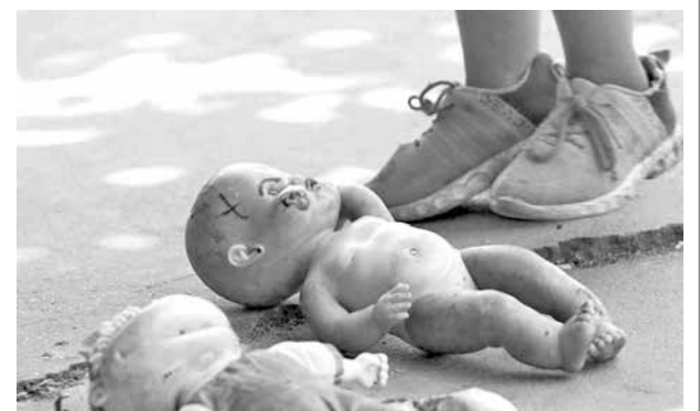
La violencia contra niños (Imagen ilustrativa).

En tanto, los familiares y compañeros protestaron por la determinación judicial. Además, manifestaron que el conductor aún no brindó ningún tipo de ayuda a los tres hijos de la víctima.