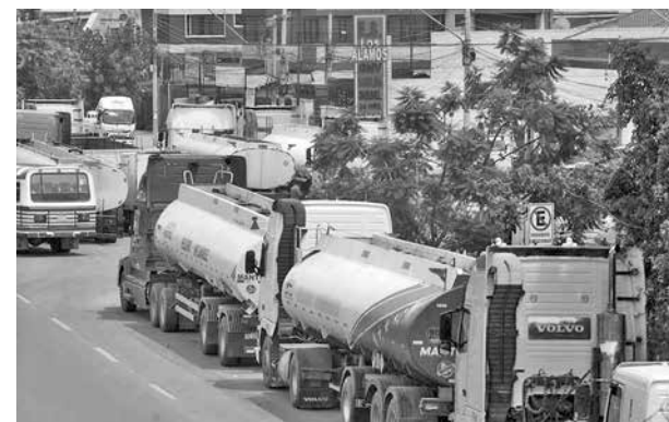
Vehículos hacen fila en un surtidor en Cochabamba. DJ

Además, informó que millones de litros de combustible están ingresando al país a través de puntos de importación como Arica (Chile), Callao, Pisco y Mollendo (Perú), Argentina y Asunción (Paraguay).