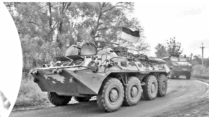
Un tanque ucraniano en plena guerra en Rusia.

el Kremlin confirmó que Putin ha dado instrucciones para cumplir con el alto el fuego en infraestructuras energéticas durante los próximos 30 días. Además, la declaración oficial rusa indicó que el mandatario "respondió constructivamente" a la propuesta de un cese de hostilidades en el mar Negro, aunque las negociaciones sobre este punto aún están en curso.