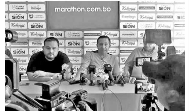
Conferencia de prensa de Royal Pari, ayer.