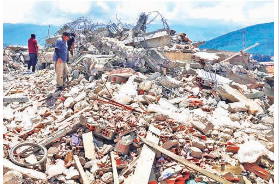
Una de las casas afectadas por el deslizamiento en la OTB Nuevo Amanecer.