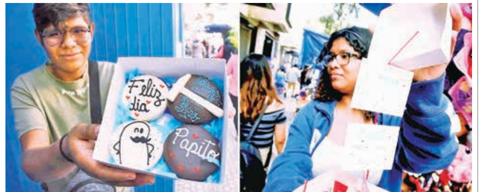
Algunos regalos que se ofertan en inmediaciones del Correo, ayer.

Este año se prevé que reforzar la vacunación en los municipios.