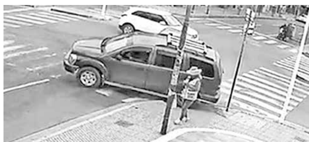
El momento del fatal accidente.