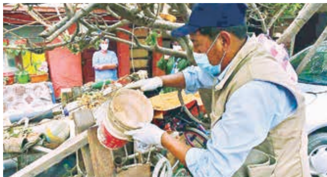
La destrucción de criaderos de Aedes aegypti.