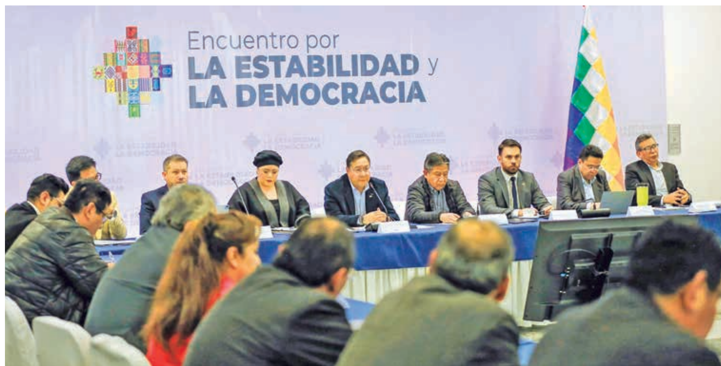
El presidente Luis Arce junto a los ministros y asistentes al "Encuentro por la estabilidad y la democracia", en La Paz, ayer.

MAS. Andrónico Rodríguez no acudió a la convocatoria. Pág. 4