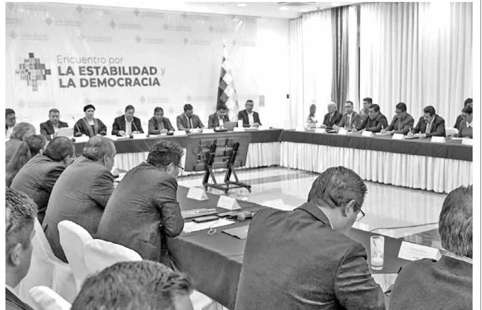
Asistentes al Encuentro por la Democracia, ayer.

Coincidieron en que el Gobierno nacional debe concentrar sus esfuerzos en la gestión y tomar las medidas necesarias en función de los intereses del pueblo boliviano.