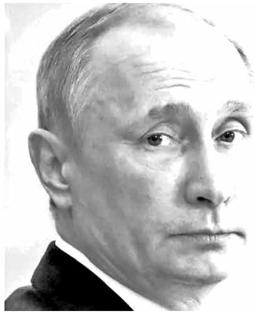
Donald Trump (izq.), presidente de Estados Unidos, y Vladimir Putin, presidente de Rusia.