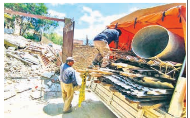
La inspección al área verde de la junta vecinal. DANIEL JAMES

Mientras tanto, Semapa realiza ajustes al sistema de alcantarillado y de agua potable. Hasta el momento, 13 inmuebles tienen fallas irreversibles.