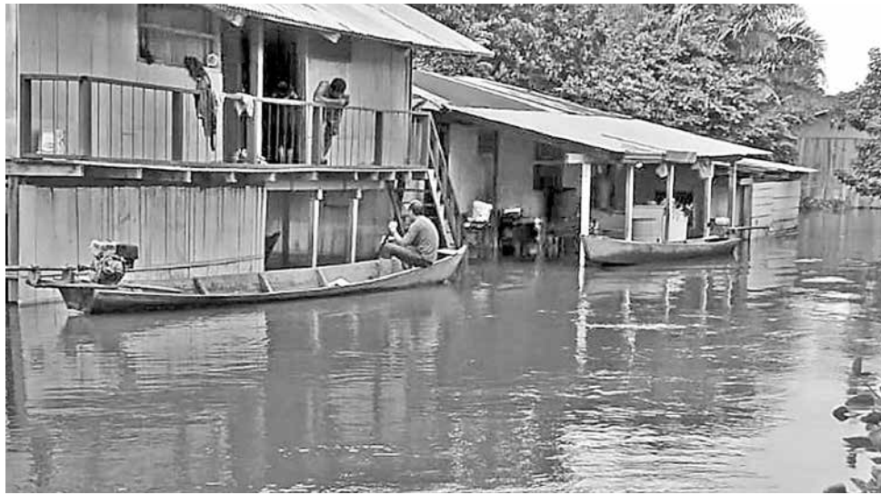
El municipio de Reyes, en el Beni, sigue afectado por las inundaciones.

La Paz es el departamento más golpeado por las lluvias y deslizamientos, incluso, un cementerio sufrió destroz de consideración.