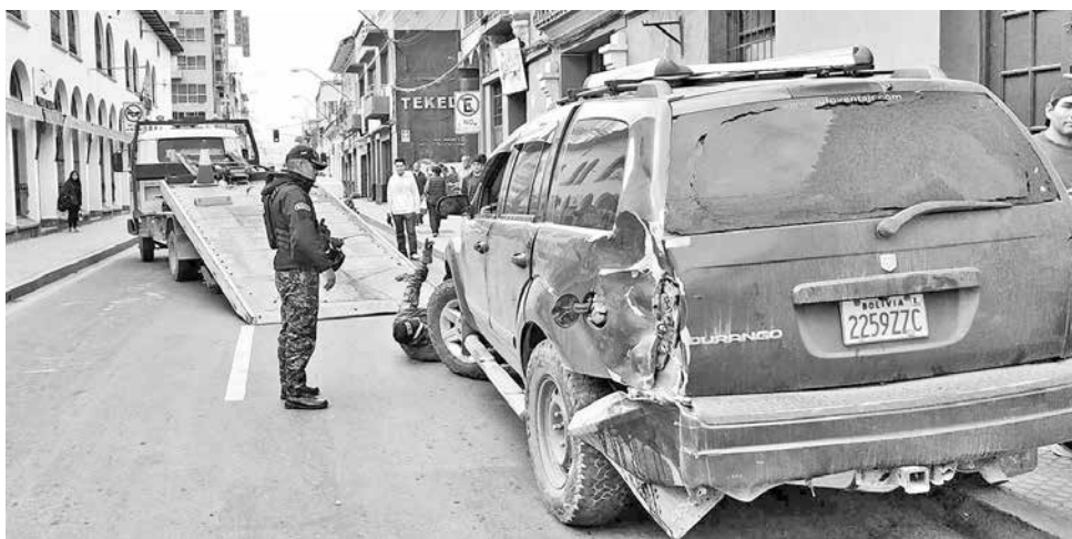
El motorizado que embistió a la funcionaria es retirado por una grúa.