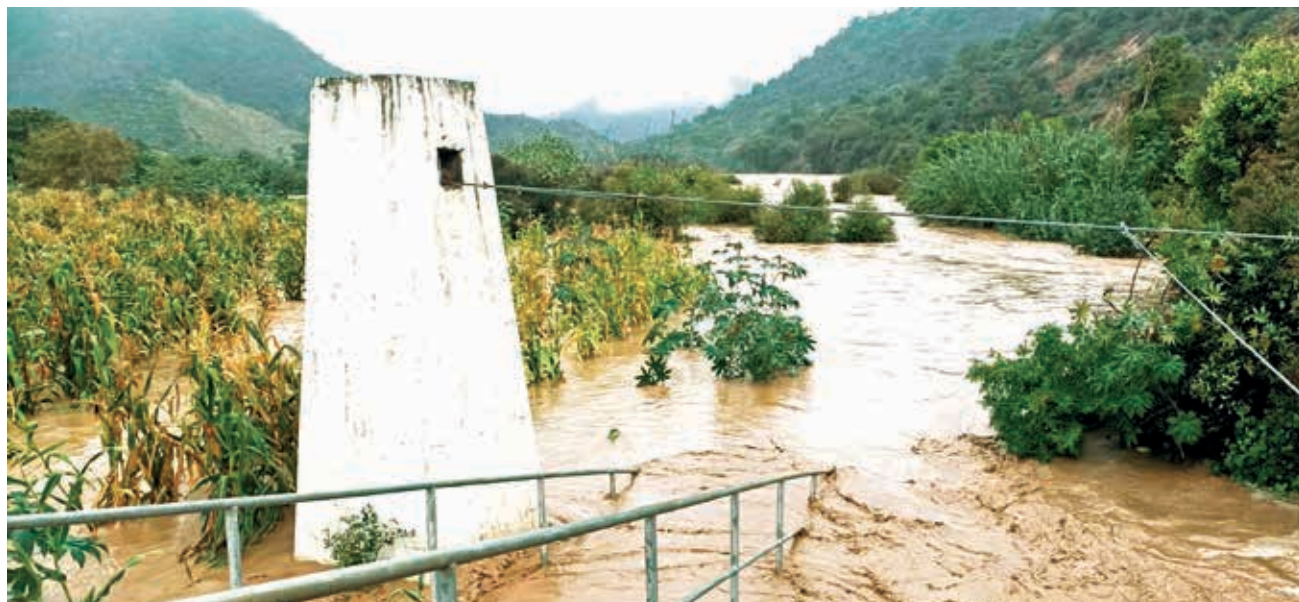
El desborde del río Mizque anegó 200 hectáreas de cultivos en Omereque, que se declaró en desastre.