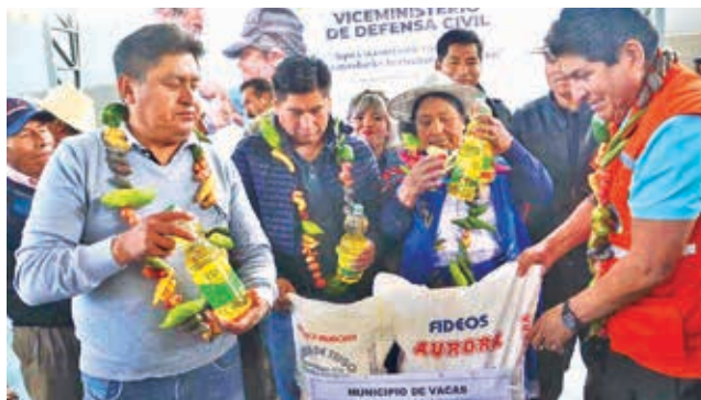
La entrega de ayuda a algunos municipios afectados. H. ANDIA