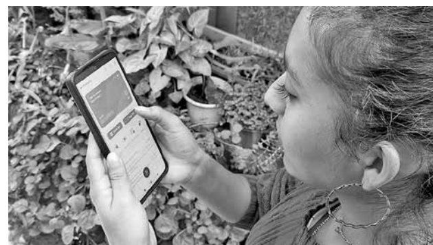
Delincuentes usan teléfonos móviles para estafar. C. LÓPEZ

Entre las ciudades más afectadas están: La Paz con el 32,50% de los casos, Santa Cruz 26,84% y Cochabamba 20,20%.