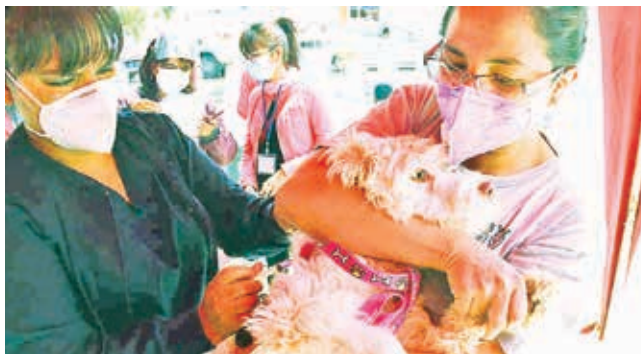
La vacunación contra la rabia canina en la ciudad. C. LÓPEZ

Recomendación. El Sedes pide a los dueños acudir a los centros de salud para evitar casos de rabia humana como el reportado en 2024