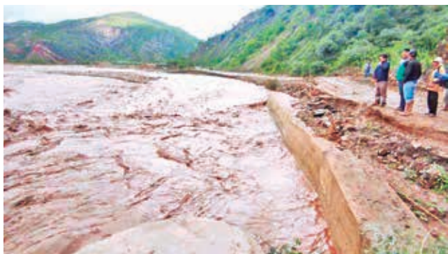
La crecida extraordinaria del río Arque. RRSS

Datos. Cochabamba suma 17 fallecidos y tres desaparecidos por riadas y deslizamientos. A la fecha, se tiene 28 municipios afectados y Defensa Civil comienza a entregar ayuda humanitaria a los damnificados