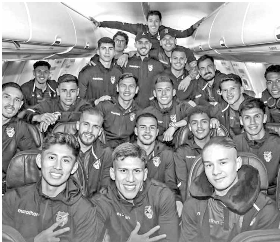
Jugadores de la Selección nacional durante viaje rumbo a Perú, ayer.