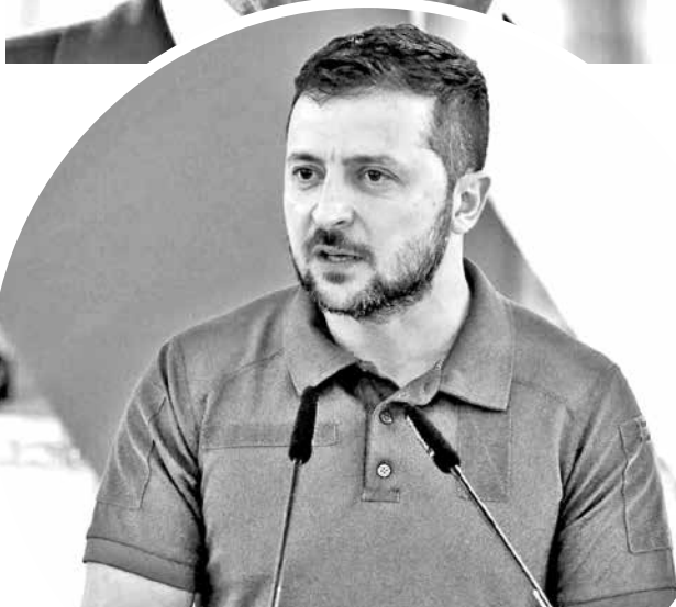
Volodymyr Zelensky, mandatario de Ucrania.