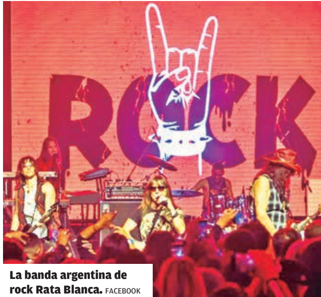
La banda argentina de rock Rata Blanca.

Formada en 1985 en el barrio de Bajo Flores, Buenos Aires, Rata Blanca comenzó como un proyecto independiente del guitarrista Walter Giardino, quien buscaba plasmar sus composiciones influenciadas por la música clásica y el heavy metal. La búsqueda de una formación estable fue un pro-