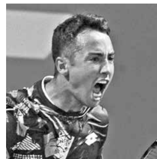
El tenista nacional Hugo Dellien.

El 18 de febrero pasado, Dellien se retiró en la primera fase del Río Open por