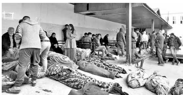
Heridos en el hospital Alahli en Ciudad de Gaza, al norte de la Franja.

"Hamás ya ha sentido nuestra fuerza y me gusta