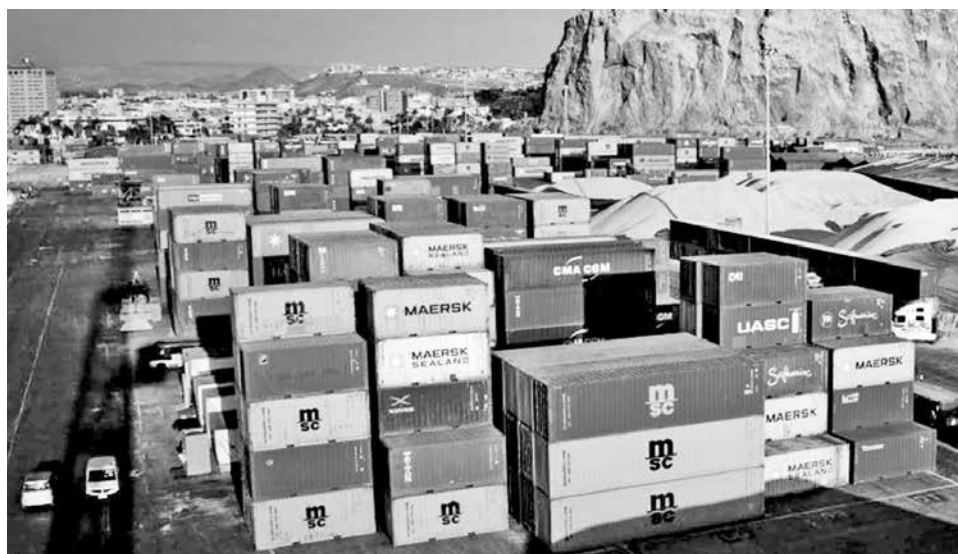
Contenedores que transportan los productos bolivianos al mercado externo.

El complejo sojero, pilar de las exportaciones agroindustriales, también experimentó