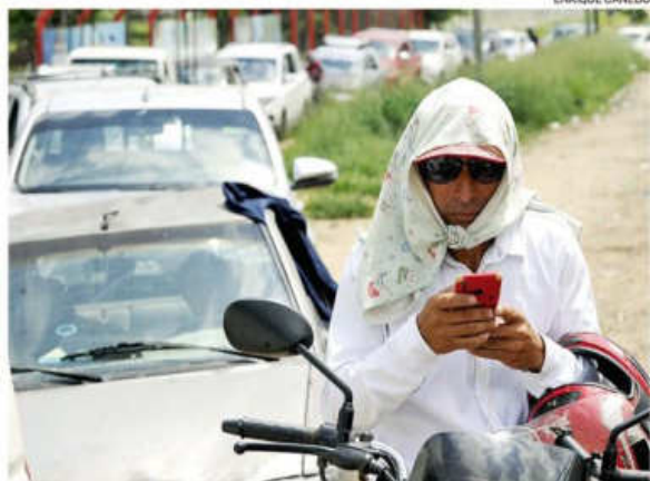
La falta de diésel sigue generando largas filas en la capital cruceña