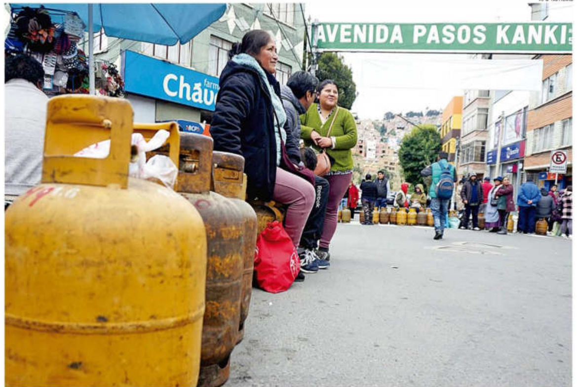
La oferta irregular de GLP se hace sentir en la ciudad de La Paz. En Santa Cruz algunos restaurantes optan por atender menos días

El titular de la CAO recordó que las filas en los surtidores continúan, mientras los productores siguen preocupados para poder