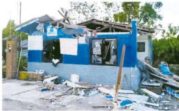
El Gobierno cuestionó los daños en el puesto de peaje de Cochabamba

En Cochabamba solo un 50% presta servicio, el resto busca combustible.