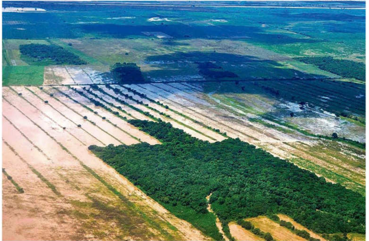
VICEMINISTERIO DE DEFENSA CIVIL

Ayer, el sistema de alerta temprana del Searpi reportó una crecida grande en el Río Grande y en el Parapetí, mientras que el Piráí mostró niveles elevados en su cuenca media y alta. Los ríos Ichilo y Yapacaní mantienen sus niveles dentro de parámetros normales.