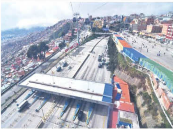
Transportistas alteños paralizaron actividades por 8 horas.

anunció que no pagarán peajes en los puntos de cobro en carreteras debido al mal estado en que se encuentran las vías. Además, también protestan por la falta de carburantes. El pasado martes, un grupo de 500 choferes destruyó con maquinaria pesada un puesto de cobro de peajes de Vías Bolivia en Ivrigarzáma, Cochabamba, en medio de protestas vinculadas a la escasez de combustibles.