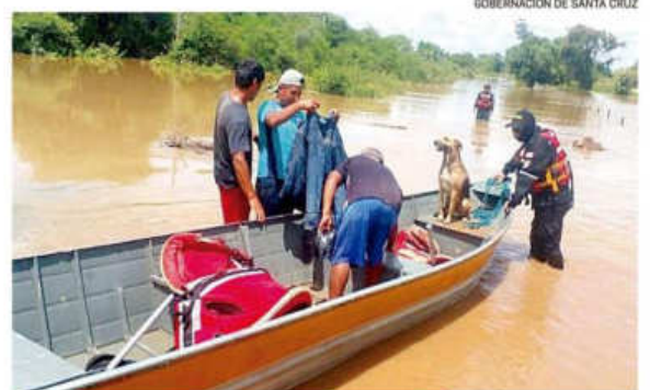
GOBERNACIÓN DE SANTA CRUZ