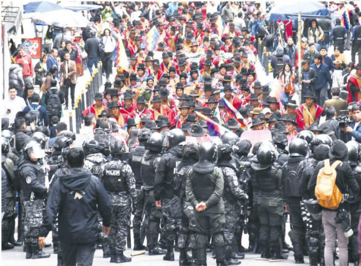
Los campesinos de La Paz, conocidos como Ponchos Rojos, marcharon ayer hasta Plaza Murillo.