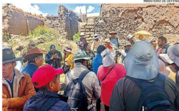
MINISTERIO DE DEFENSA