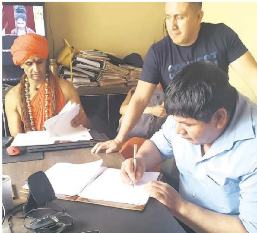
Momento de firma de contrato con indígena baure

ese territorio. "Acá somos serios, orgánicos, el TIM es de tres naciones, no solamente de los esse ejja, así que ya les dimos su sanción y ellos se retractaron, pero les dije que tienen que hacerlo público", remarcó.