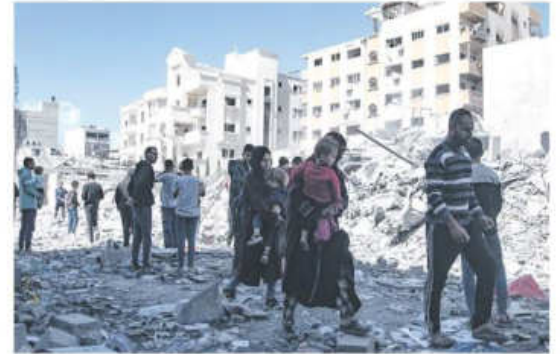
Palestinos caminan sobre escombros luego de un ataque israelí

Al menos 436 palestinos murieron ayer en un bombardeo en Gaza tras la reanudación de los bombardeos