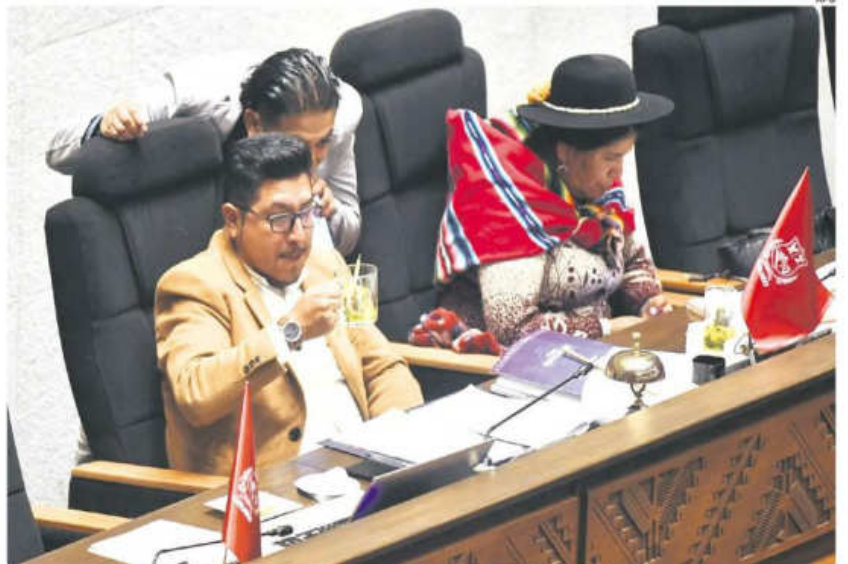
La Cámara de Diputados sesionará hoy desde las 08.30. Se prevé que aborden dos leyes electorales.

Por la tarde, la Asamblea Legislativa Plurinacional abordará un préstamo de 100 millones de dólares de parte del Gobierno de Japón.