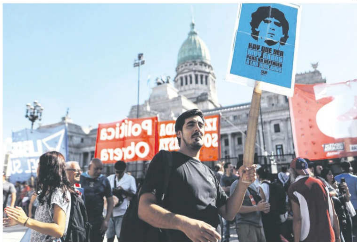
Una multitudinaria marcha de sindicatos en apoyo a los jubilados que protestan todos los miércoles tuvo lugar ayer en Buenos Aires

Según indicó la firma SBS en un informe, el comportamiento de las cotizaciones evidencia "la incertidumbre del mercado respecto a qué esquema cambiario podrá tener lugar en el futuro cercano, especialmente tras el acuerdo con el FMI, sobre el que aún no se conocen detalles".