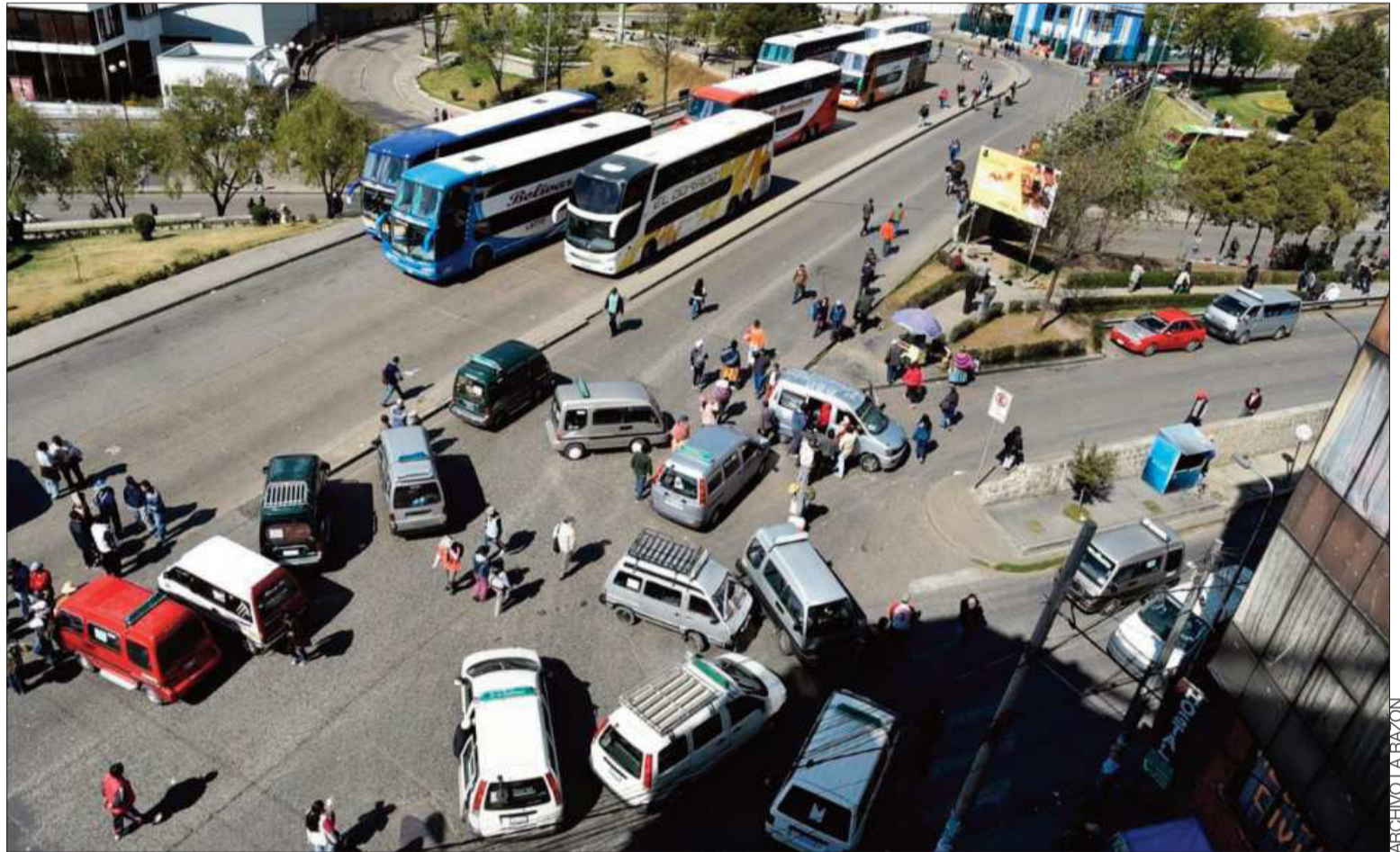
PARO. La Federación Andina de Choferes Primero de Mayo de El Alto cumple un paro por la escasez de combustibles y otros.

El lunes se realizó en Sucre un ampliado nacional donde el sector del transporte dio un ultimátum de 72 horas al Gobier-