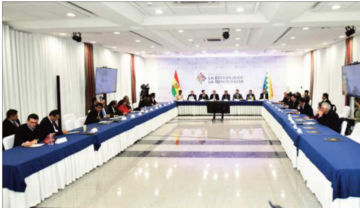
PRESENCIA. Autoridades y representantes de fuerzas políticas acudieron a la cita, en Casa Grande.

En el documento al respecto de las conclusiones se reafirmó que “el diálogo y la democracia es el mejor camino para la convivencia pacífica de los pueblos, para el debate de ideas, para la resolución de las tensiones y conflictos, y para lograr el desarrollo económico y social de un país”.