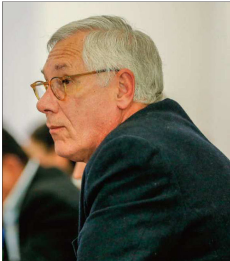
PRESENCIA. El expresidente Eduardo Rodríguez Veltzé, ayer.

Tampoco fue parte de la cumbre el presidente de la Cámara de Senadores, Andrónico Rodríguez, quien había desahuciado el encuentro por la convocatoria a los “autoprorrogados”, en referencia a los magistrados de los tribunales Constitucional y de Justicia.