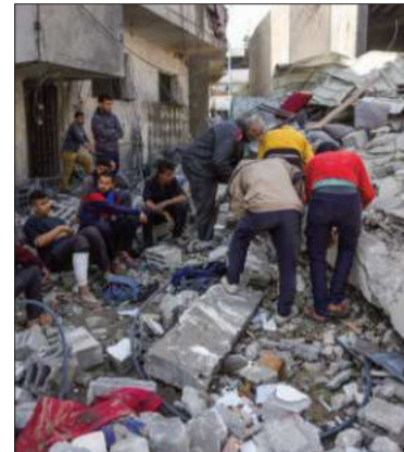
Desastre en Gaza por ataques.

Los bombardeos, que dejaron más de 400 muertos según Hamás, son los primeros de esta escala desde la entrada en vigor de un acuerdo de alto el fuego.