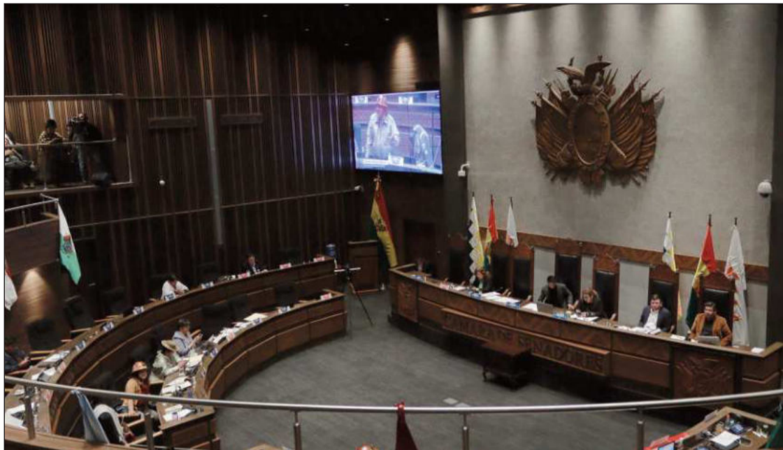
DECISIÓN. En la sesión se dejó sancionado el proyecto de ley, con fines de su promulgación.