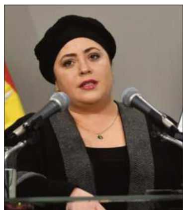
La ministra de la Presidencia.

La autoridad pidió ‘aunar’ esfuerzos para precautelarse la democracia