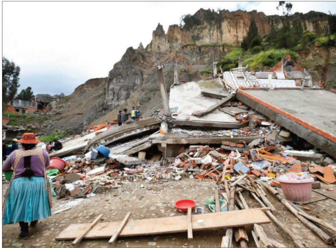
CLIMA. Uno de los departamentos más afectados por las inundaciones es La Paz (imagen de archivo).

“En este momento ya son nueve los departamentos afectados, tenemos tres departamentos que se han declarado en emergencia departamental están La Paz, Beni y Chuquisaca, 69 municipios en desastre municipal, 14 municipios en emergencia municipal, ya son 114 los municipios que han sido afectados. Tenemos 2.550 comu-