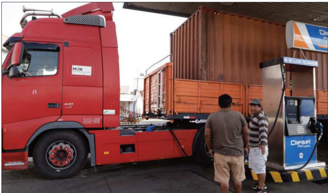
ECONOMÍA. Transporte pesado carga diésel en una estación de servicio.