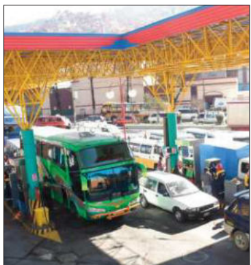
Vehículos en estación de servicio.

El titular del Senado dice que el Gobierno cuenta con $us 2.000 millones