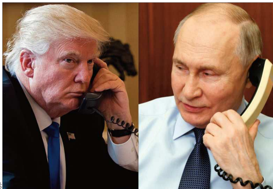
NEGOCIACIONES. Los presidentes Donald Trump (izq.) y Vladimir Putin conversaron por teléfono el martes.