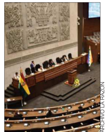
La Asamblea Legislativa.

El Gobierno propuso usar esos recursos para la implementación del sistema de Transmisión de Resultados Electorales Preliminares (TREP) para las elecciones generales del 17 de agosto y para garantizar el voto en el exterior.