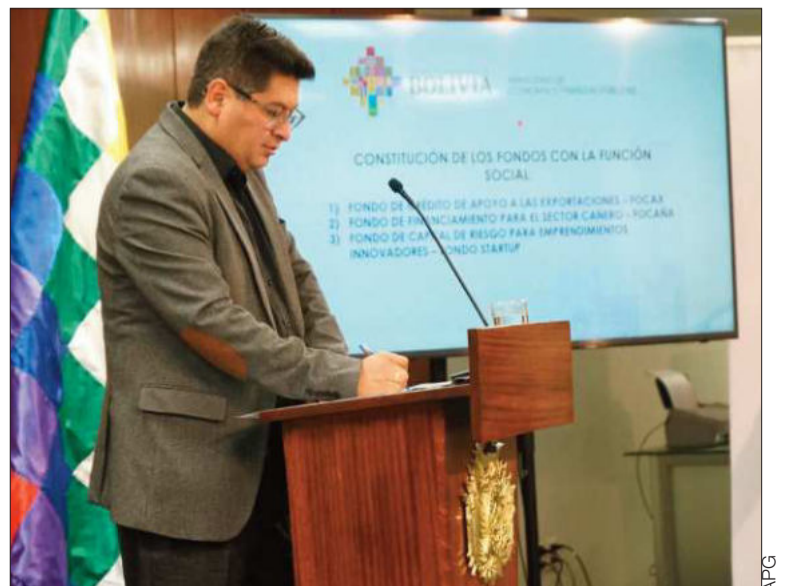
DEFENSA. El ministro de Economía respondió a los cuestionamientos.

‘Hoy ganó Bolivia’: el Gobierno saluda la aprobación