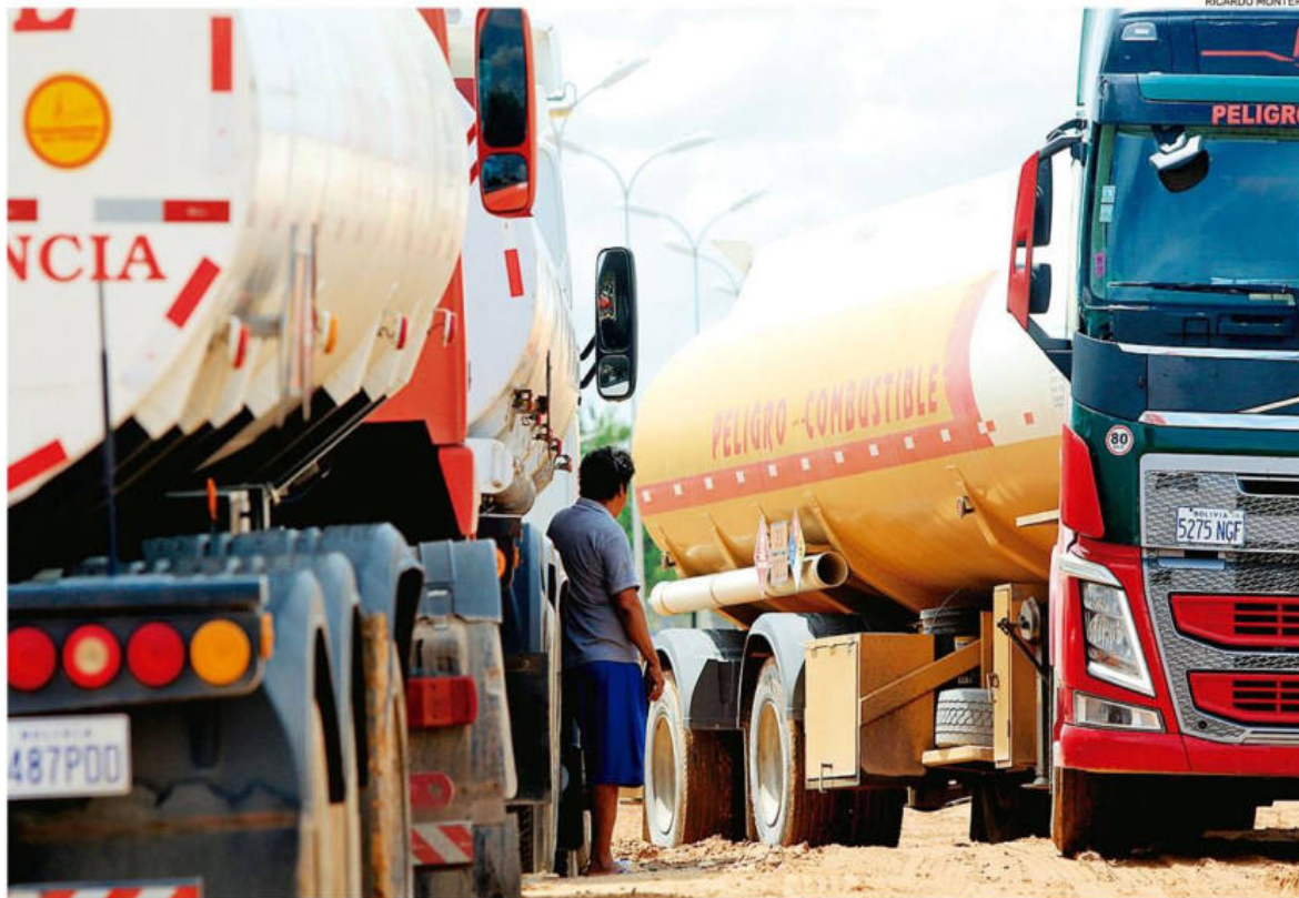
Se pudo constatar que la cantidad de camiones cisternas parqueados en Palmasola es menor en comparación con la semana pasada