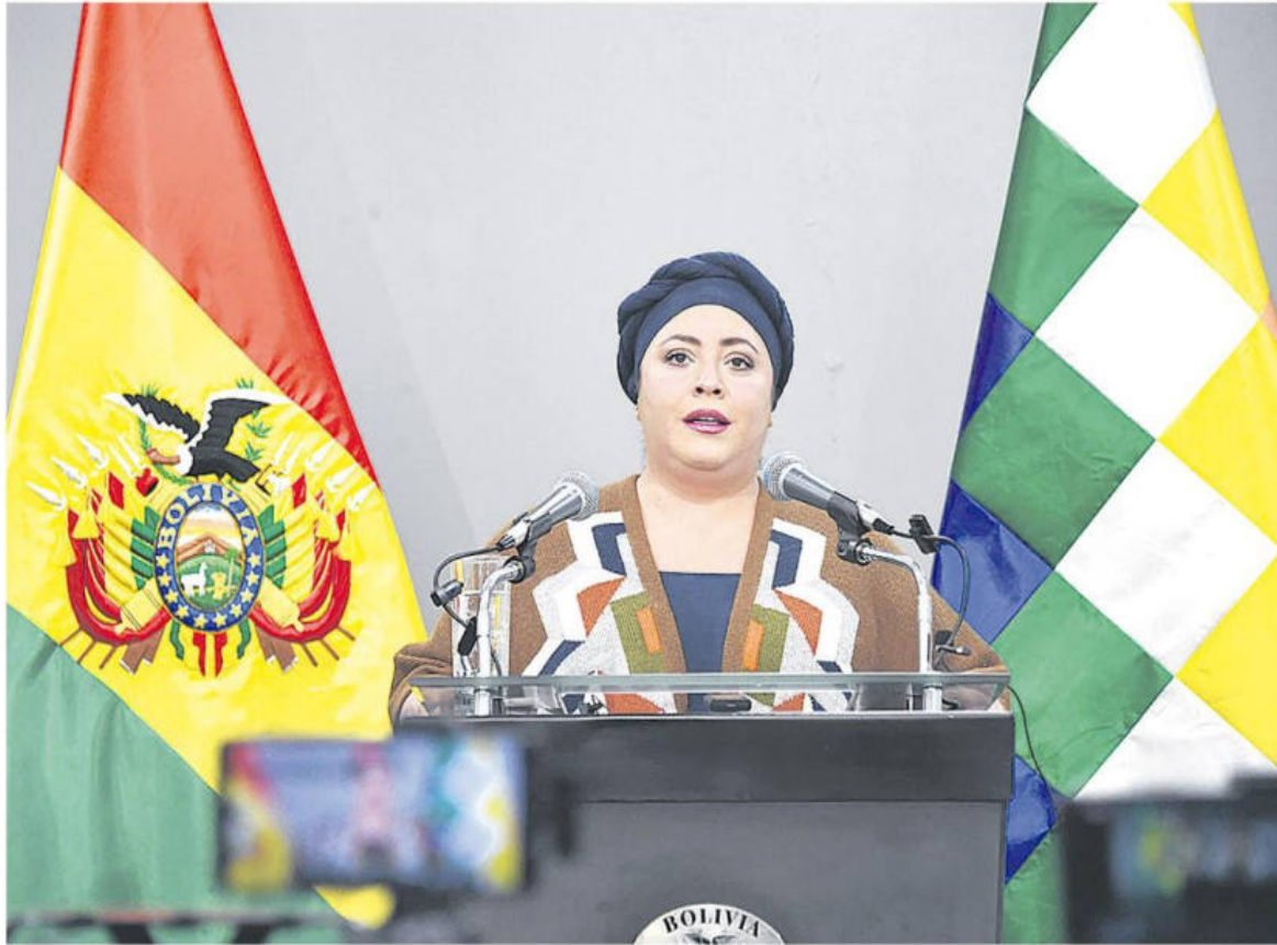
María Nela Prada, ministra de la Presidencia, lanzó la convocatoria al encuentro por la democracia en La Paz.