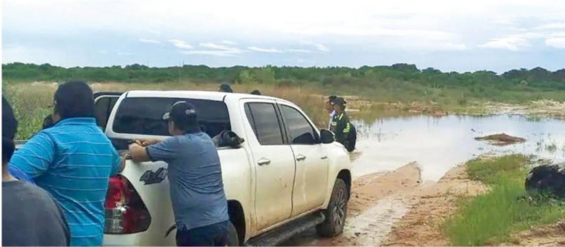
La Policía llegó hasta las orillas del río Pirá para levantar los cuerpos de las víctimas que fueron enterrados envueltos en sábanas

INVESTIGACIONES DE LA POLICIA Y LA FISCALÍA