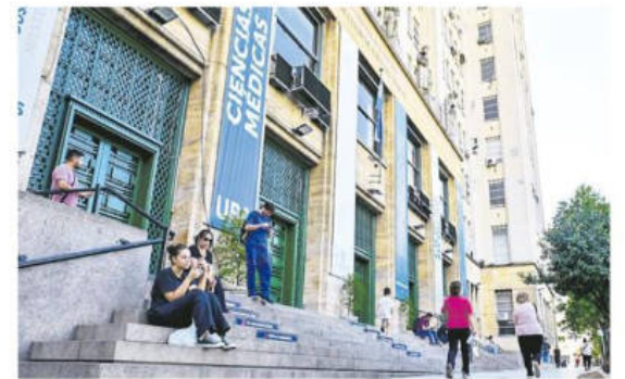
Estudiantes en las afueras de la Universidad de Buenos Aires

La marcha de los jubilados del pasado miércoles, a los que se sumaron sindicatos, movimientos sociales e hinchas de los clubes de fútbol, fue reprimida por la policía, con casi cincuenta heridos -uno de gravedad- y más de un centenar de detenidos.