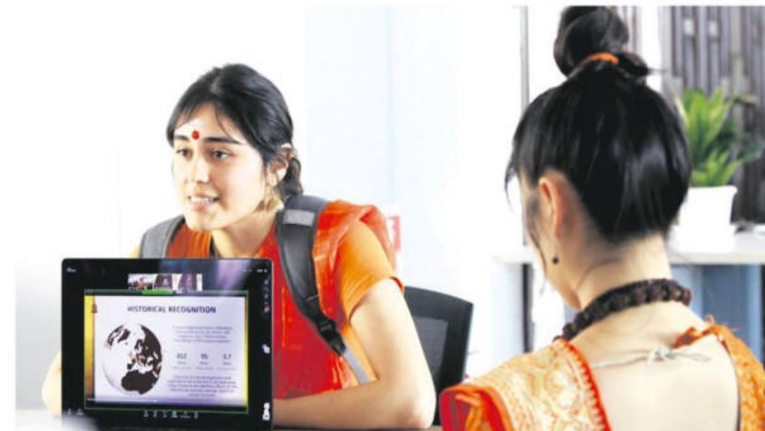
Dicen ser monjas de Kailasa, se presentaron ayer en EL DEBER para hablar del trabajo que realizan

Otro punto fue la consulta previa para que se ejecute el arrendamiento de las tierras de