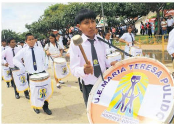
Los actos por el aniversario comenzaron ayer