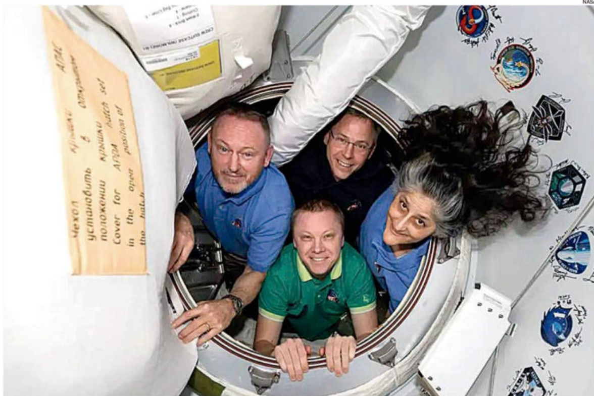
Los astronautas Butch Wilmore (izq.), Nick Hague, Suni Williams y el cosmonauta Aleksandr Gorbunov retornan este martes desde la EEI