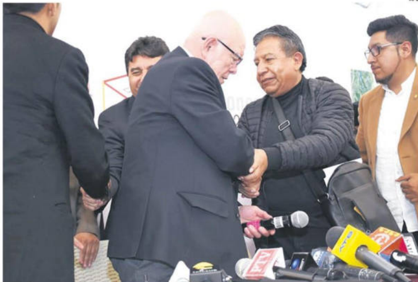
Oscar Hassenteufel y David Choquehuanca se saludan en un encuentro de 2024

No obstante, Hassenteufel instó a Choquehuanca realizar las "gestiones para el tratamiento y aprobación de ambos proyectos" y a nombre del TSE "deja constancia del riesgo que representa que no se asuma la responsabilidad del tratamiento legislativo de los proyectos de ley" que fueron remitidos al Legislativo entre el 18 y 20 de febrero, luego del Tercer Encuentro Multipartidario e Interinstitucional por la Democracia.