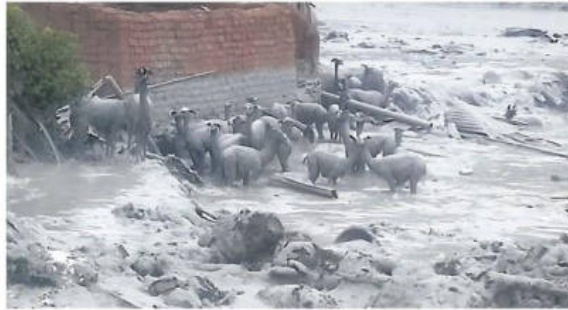
Los animales que lograron sobrevivir. La gente lo auxilió de inmediato

En la jornada se registrarán lluvias de moderadas a fuertes en Santa Cruz.