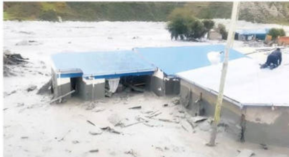
Calles y viviendas de la comunidad desaparecieron en medio del lodo