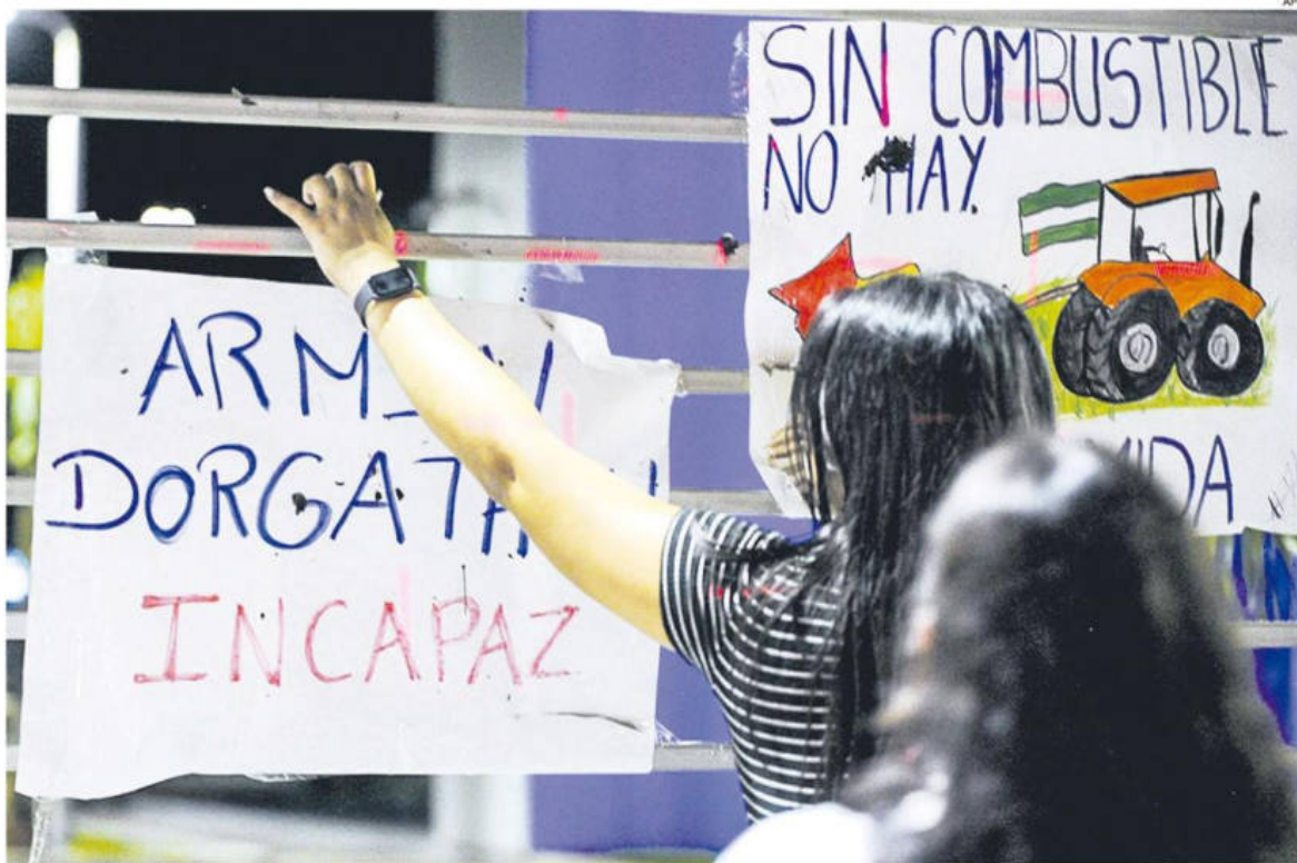
Las medidas de protestas iniciarán este miércoles 19 de marzo y estarán concentradas en la ciudad de La Paz.

Gremialistas, transportistas, mineros de Potosí y de La Paz se movilizarán a partir del 19 de marzo si el Gobierno no responde a la demanda de escasez de combustibles y si al menos dos ministros no son despedidos.