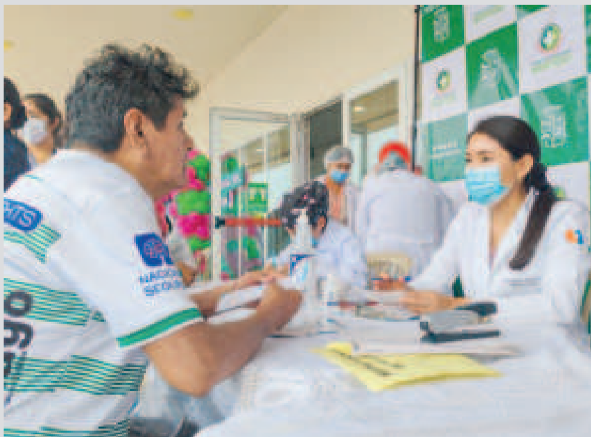
Una persona recibe diagnóstico, recomendación médica y tratamiento en el hospital de tercer nivel de Montero.

En los próximos meses, el hospital también implementará la primera brigada especializada en psiquiatría, reumatología y fonología en centros de primer nivel, con el objetivo de captar de manera temprana pacientes con enfermedades crónicas.