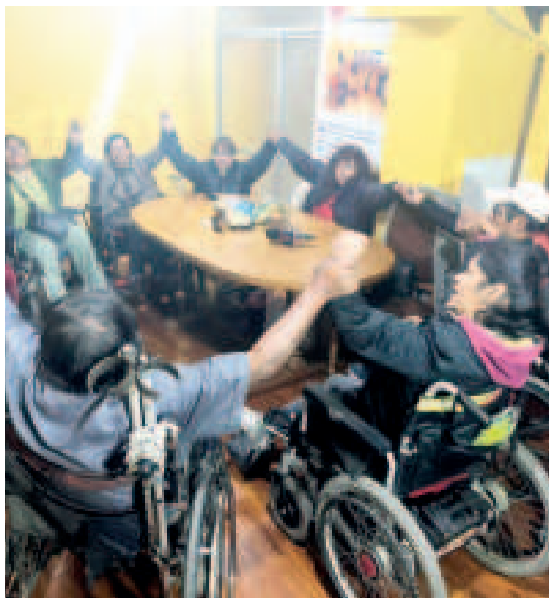
Integrante de la Red de Vida Independiente Bolivia.