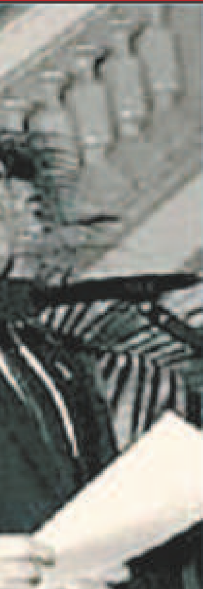
El expresidente del MNR, Víctor Paz Estenssoro en 1985.