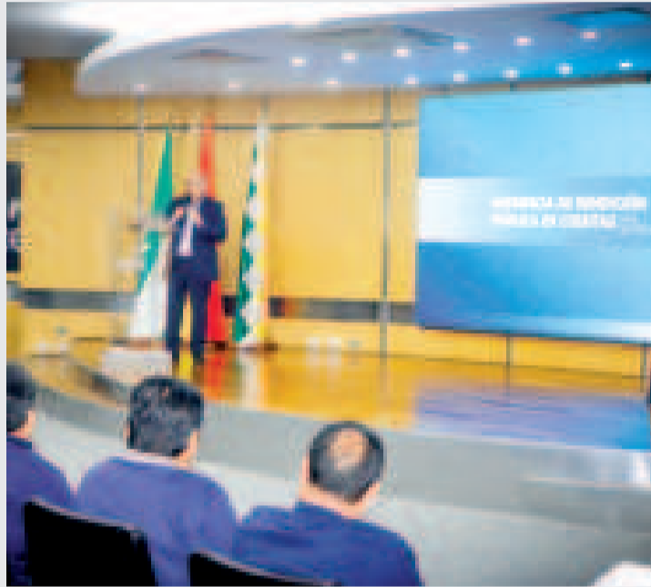
Audiencia de rendición pública de cuentas final gestión 2024.

Este logro fue presentado durante la Rendición Pública de Cuentas Final 2024, celebrada en Santa Cruz de la Sierra.