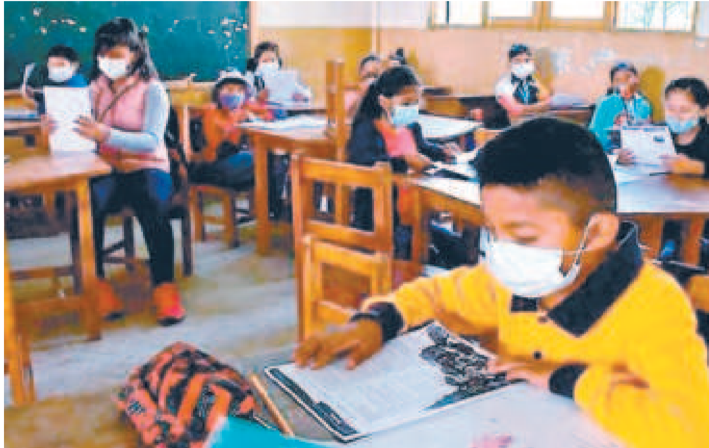
Aunque algunos colegios han flexibilizado sus horarios de ingreso o han adoptado temporalmente la modalidad semipresencial o a distancia, varios continúan con la modalidad presencial.

Un caso se presenta en Santa Cruz, donde cuatro de los 54 distritos educativos decidieron aplicar la educación a distancia,