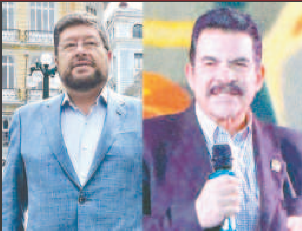
Los precandidatos de derecha Samuel Doria Medina y Manfred Reyes Villa.