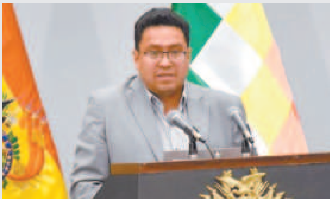
Ministro de Justicia, César Siles.

Esta propuesta surge por la indignación generalizada por un caso que conmocionó a la ciudadanía: un adolescente de 16 años recibió una condena de apenas seis años por violar y asesinar a una bebé de un año en el Plan Tres Mil.