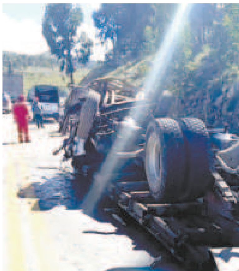
Efectivos de la Policía llegaron al lugar para socorrer a los heridos.

La Policía recomendó a los conductores extremar precauciones en la zona, ya que el sector de la subida a San Isidro es conocido por su alta siniestralidad debido a las pendientes.