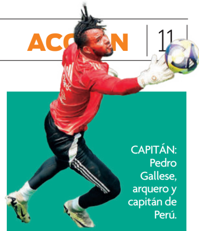
CAPITÁN: Pedro Gallese, arquero y capitán de Perú.