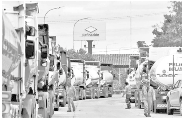
Cisternas importan combustible para YPFB. EL DEBER

una primera etapa de prueba, entre 3 y 5 millones de litros de diésel utilizando criptoactivos. Esta medida, respaldada por el Decreto Supremo 5348, estará dirigida exclusivamente a sectores productivos que generan divisas, como la agricultura y la minería, sin beneficiar al consumidor común.