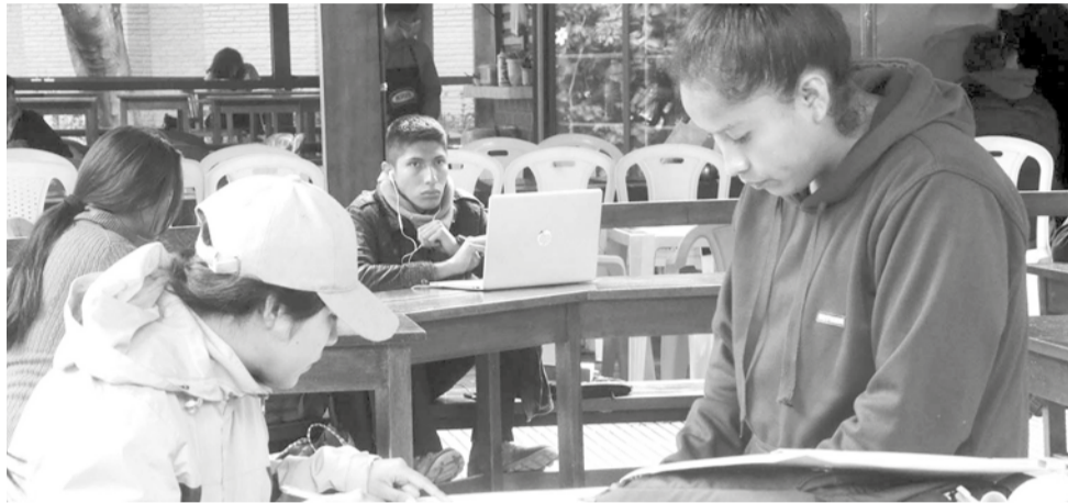
La poca afluencia de estudiantes al campus de la UMSS, ayer. HERNAN ANDIA

Veizaga resaltó que los maestros tienen experiencia en la modalidad virtual, la cual fue aplicada durante varios meses en el auge de la pandemia por la Covid-19. Enfatizó que no sólo se re-