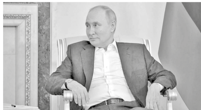
El presidente de Rusia, Vladimir Putin.

Tratativas. El presidente ruso ha dejado entreabierto la posibilidad de una tregua inicial de 30 días, pero supeditada a sus cláusulas