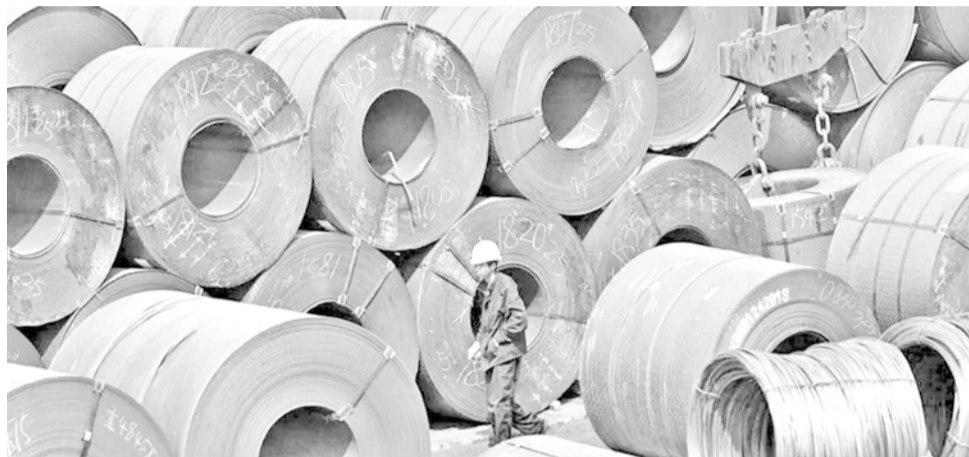
Un trabajador rodeado por carretes de acero.

Preguntado por la Unión Europea (UE), a la que se re-