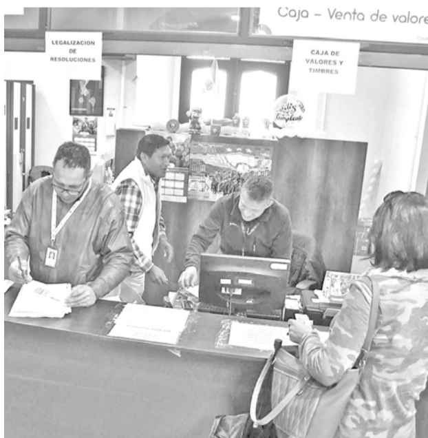
La atención al público en la Alcaldía.