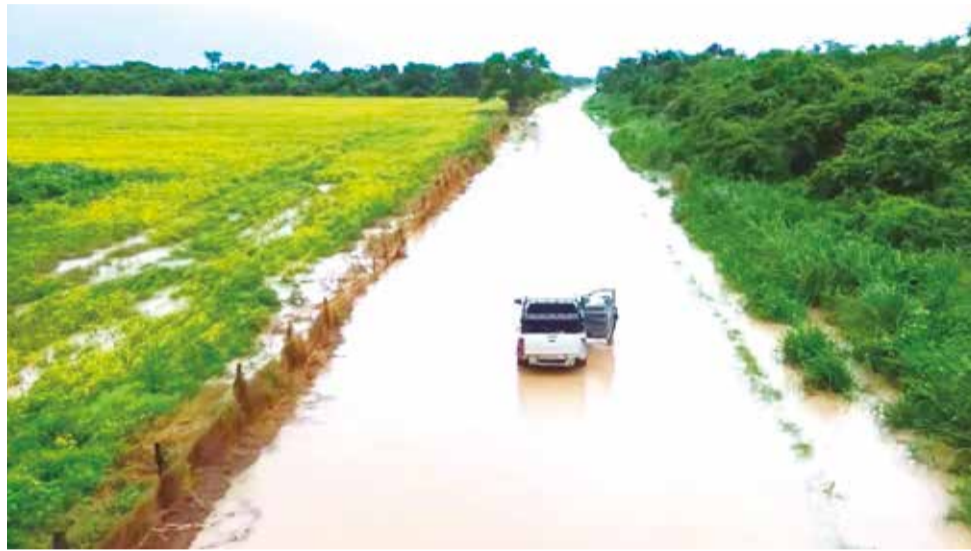
Desborde del río Grande en Santa Cruz.

El Servicio Nacional de Meteorología e Hidrología (Senamhi) ha emitido una alerta roja que afecta a cinco departamentos del país. Esta alerta estará vigente desde el 11 de marzo hasta el 25 de este mes. Autoridades piden a la población que tome las debidas precauciones tras las alertas.