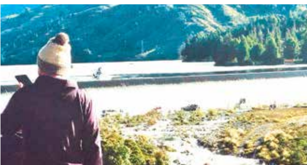
El rebalse de la represa Corani ayer.