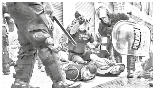
Miembros de la policía argentina detienen a manifestantes.

Poco después, Volodimir Zelenski reaccionó a las declaraciones del líder ruso, calificándolas de “muy predecibles y manipuladoras”.