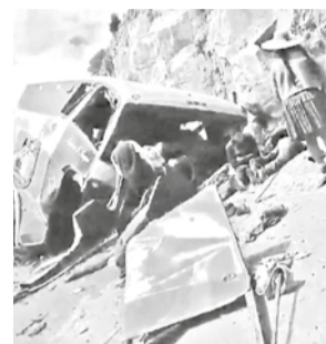
El accidente en la vía Diagonal Jaime Mendoza.

Ayer al menos 13 personas resultaron heridas después que un minibus reple-