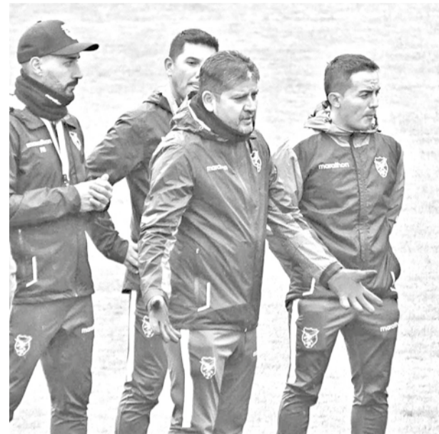
El estratega Óscar Villegas en práctica de la Verde.

Eliminatorias. El estratega de la Verde, Óscar Villegas, podrá contar con todo el plantel recién el martes en territorio peruano