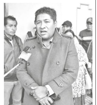
Algunos dirigentes de K'ara K'ara. JOSE ROCHA

“Este acuerdo es notariado y tiene el compromiso de las autoridades municipales y no pueden hacerse la burla de algo que ya se quedó. No hemos visto que alguno de la Alcaldía trabaje en esas miras”, remarcó.