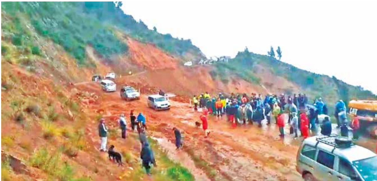
El paso provisional habilitado para vehículos livianos en un sentido en la ruta a occidente, ayer.