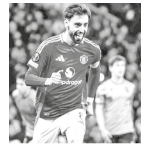
Bruno Fernandes festeja uno de sus tres goles, ayer.