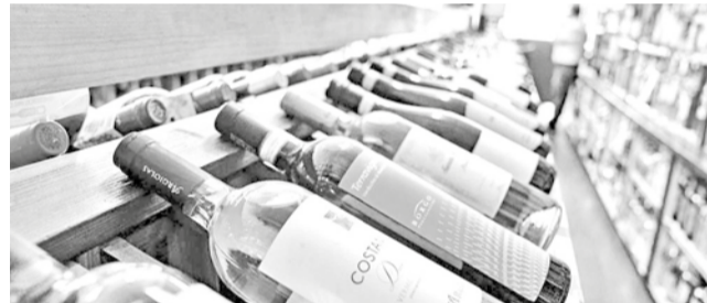
Trump amenaza con aranceles del 200 % al vino y otras bebidas alcohólicas de la UE.

firió como “muy desagradable”, el presidente lamentó que no pudieran vender coches allí. “No se nos permite vender coches en Europa. Está prohibido debido a sus políticas y también a sus aranceles no monetarios”, declaró. Trump siguió denunciando que desde la UE denuncian a sus empresas, como Apple o Google,