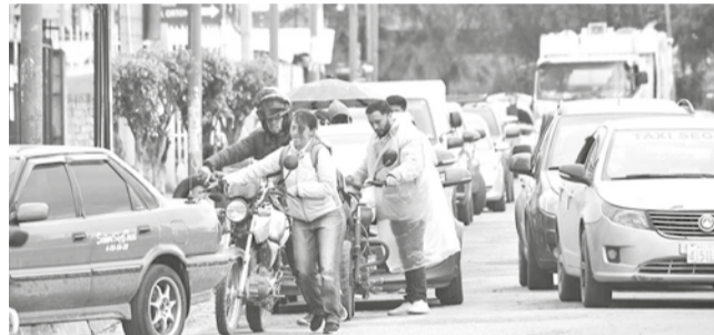
Las filas para cargar combustible. CARLOS LÓPEZ

El miércoles, el presidente Luis Arce dio a conocer 10 medidas “para mejorar la organización de la sociedad” ante la falta de combustible