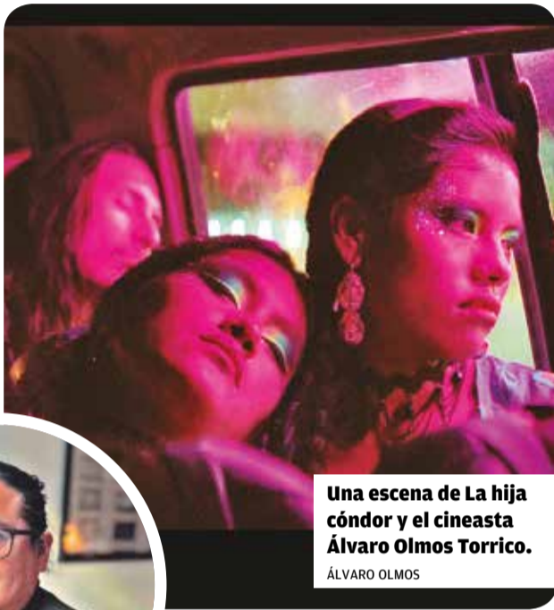
Una escena de La hija del cóndor y el cineasta Álvaro Olmos Torrico.

En el caso de La hija cóndor , está en fase de producción y su estreno aún no tiene fecha definida, pero se prevé que