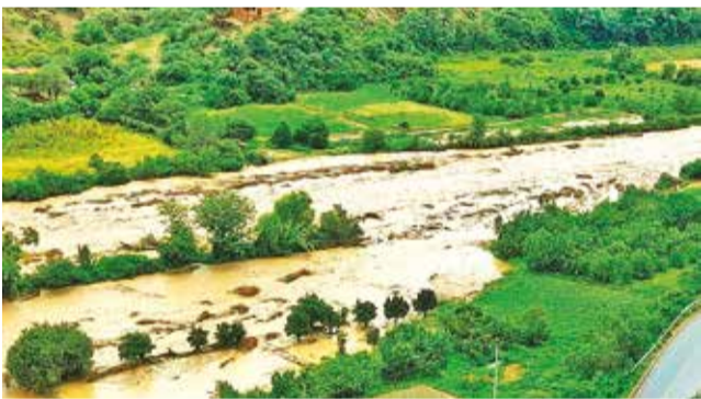
Cultivos afectados por una riada en Mizque.

Precaución. Desde la ABC piden a los conductores circular con cuidado por las carreteras por los derrumbes que provocan las lluvias. En Cochabamba hay 20 municipios afectados por las inundaciones