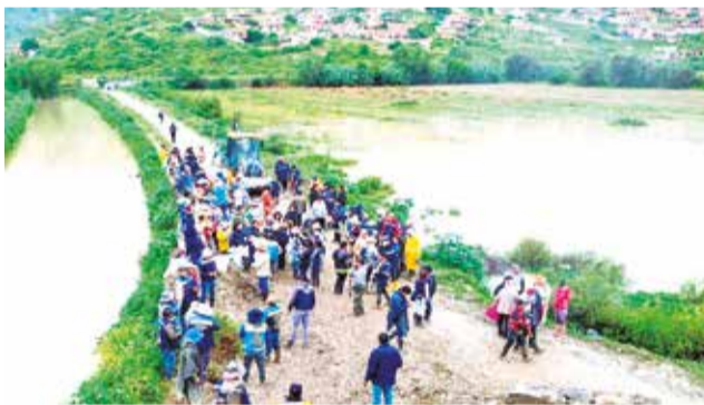
Los trabajos de emergencia en Quillacollo. GAMQ