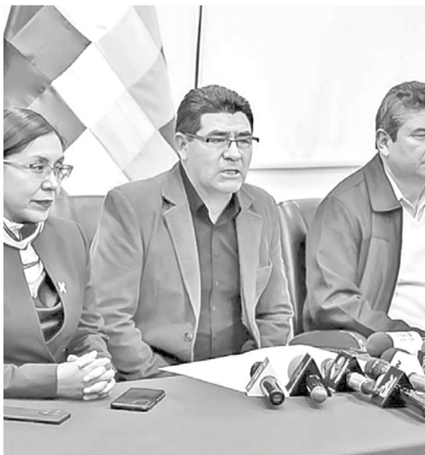
Ministro de Educación, Omar Veliz. MINISTERIO DE EDUCACIÓN

Los estudiantes de colegios y escuelas de Santa Cruz de la Sierra pasarán clases virtuales hasta hoy debido a la disminución de de vehículos de transporte público por