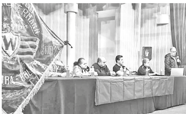
Directorio de Wilstermann en la Asamblea de Socios, ayer. D.J.

Según el informe que se presentó ayer, la actual directiva recibió al club con una