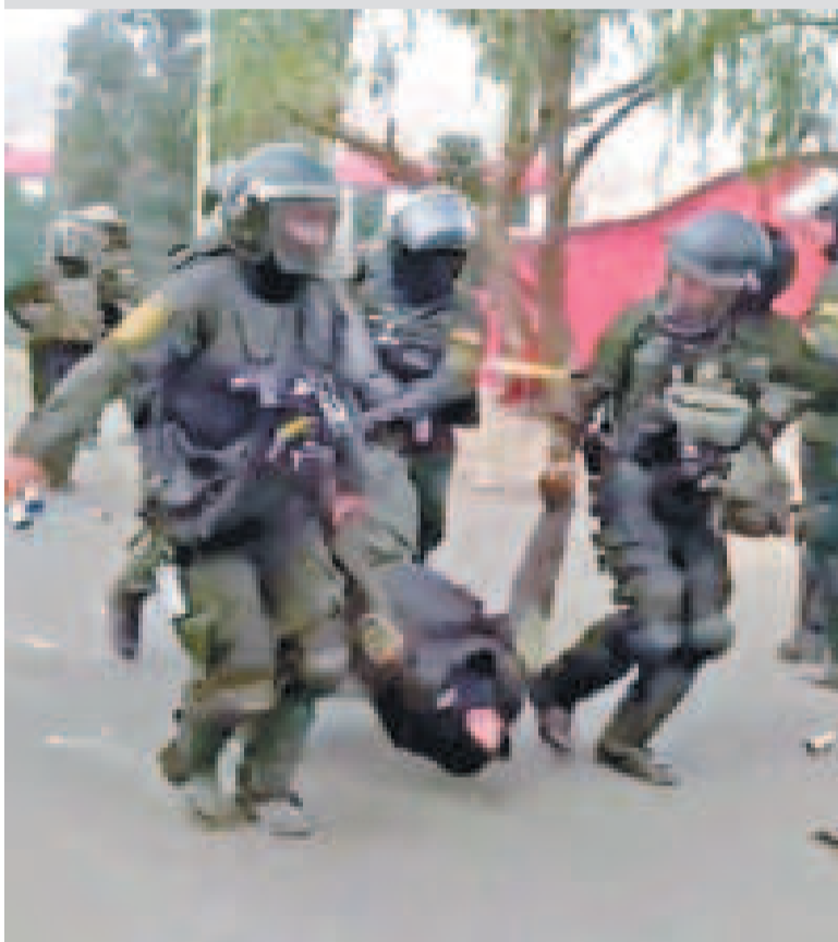
Policía herido en el bloqueo del evismo en Parotani.