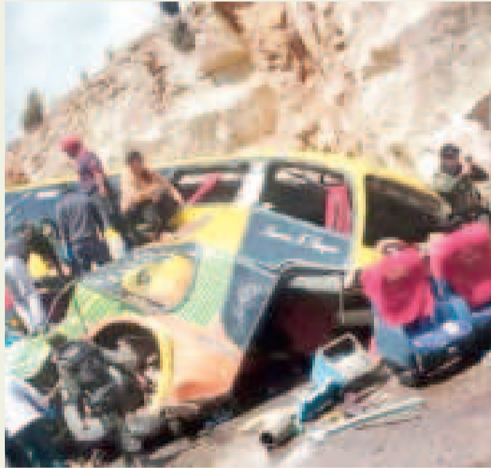
El bus tomaba una ruta alterna debido a los derrumbes en la carretera principal.

alrededor de 29 personas heridas y 14 fallecidas”, informó la autoridad.