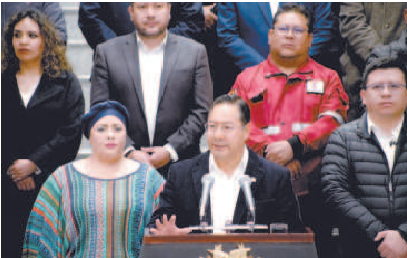
El presidente Luis Arce junto al gabinete de ministros en la Casa Grande del Pueblo.

En un mensaje al pueblo boliviano, el mandatario dijo que tampoco devaluará la moneda, como sugieren algunos analistas y opositores.