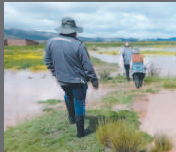
Cultivos afectados en un municipio de La Paz.

A esto se suman 411 viviendas destruidas; unas 42 personas fallecidas y siete desaparecidas, de acuerdo con el último informe del Viceministerio de Defensa Civil sobre afectaciones en el país por lluvias, inundaciones y deslizamientos en todo el país.