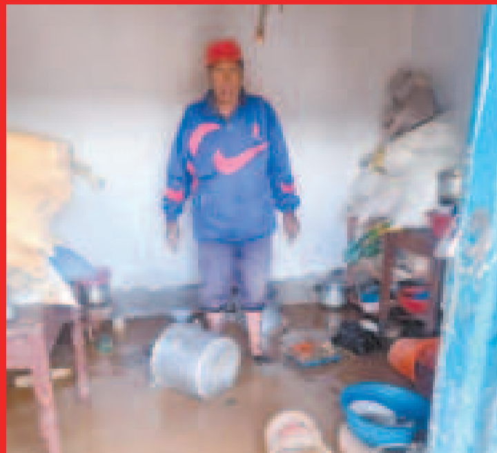
Pobladores de Sica Sica, La Paz muestran sus casas inundadas.

A esto se suman derrumbes y mazamoras en vías del norte paceño, como en la ruta hacia Mapiří, lo que dificulta la transitable de vehículos.