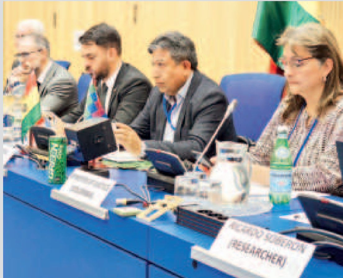
El vicepresidente David Choquehuanca participa en el evento internacional en Viena, Austria.

El vicepresidente David Choquehuanca aseguró que la Convención de Viena de 1961 cometió un error histórico.