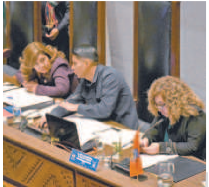
El presidente de la Cámara de Senadores, Andrónico Rodríguez (centro), en una anterior sesión.