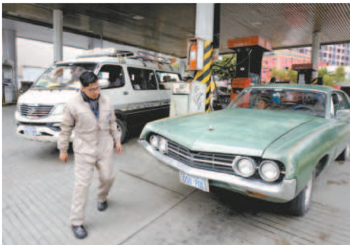
Una estación de servicio en La Paz.

El Ministerio de Hidrocarburos explicó que si los grandes consumidores importan el producto, se liberará un 20% de las plantas de almacenaje.