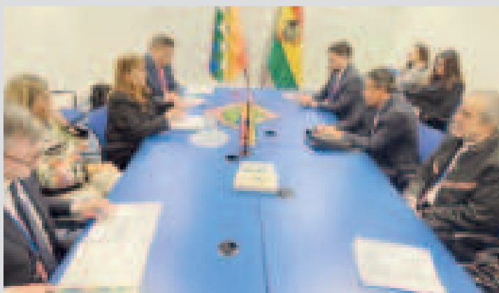
La delegación boliviana reunida con la Ministra de Justicia de Colombia.

La plaza ahora alberga un ícono que no pasa desapercibido: una cabina telefónica roja, clásica y elegante, como aquellas que adornan las calles londinenses, un detalle que recordará que la amistad entre naciones también se construye a través de gestos simbólicos y espacios compartidos.