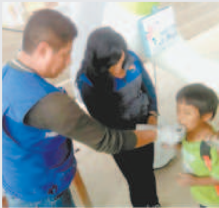
Campaña contra la fasciolosis desarrollada anteriormente en La Paz.