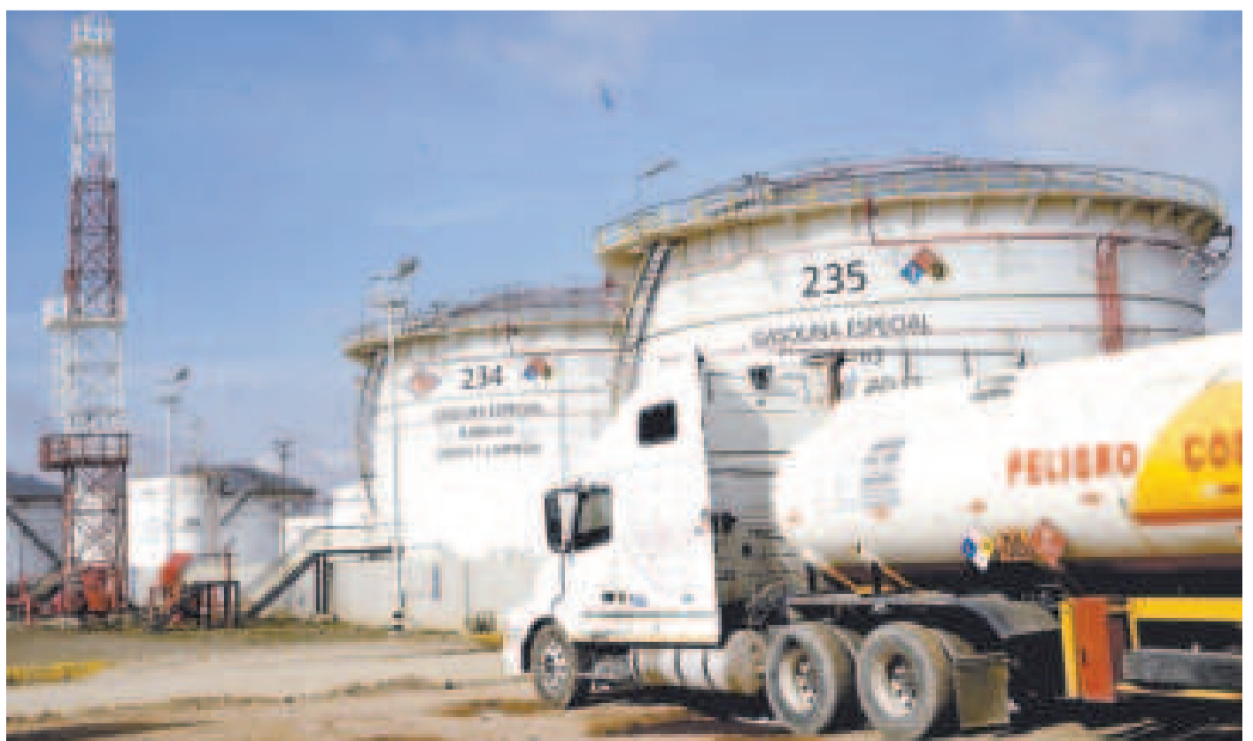
Una planta de almacenaje de YPFB.

SE ALCANZARÁ EN LOS DESPACHOS de combustibles desde las plantas de almacenaje para las estaciones de servicio de país.