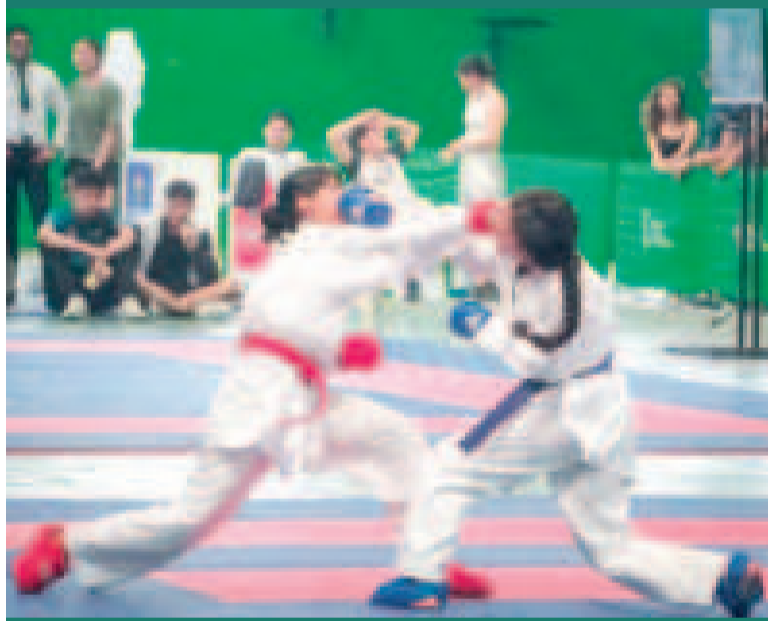
Las karatecas se darán cita en el torneo nacional en Cochabamba.

Entre el sábado y domingo las pruebas arrancarán desde las 08.00 para cada una de las categorías habilitadas.