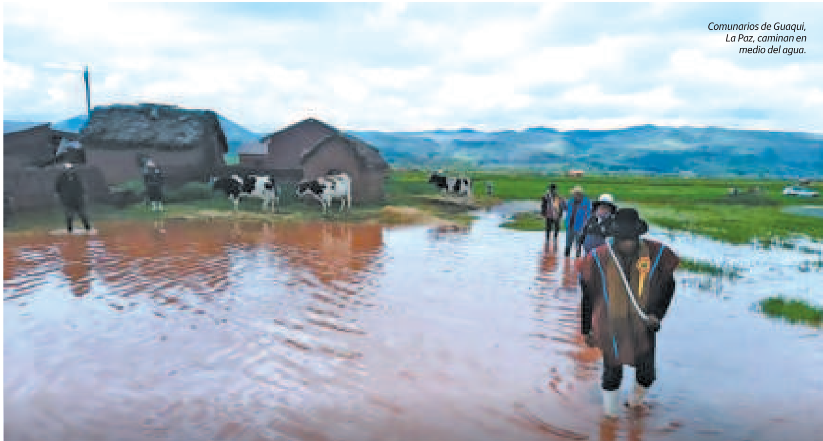
Comunarios de Guaqui, La Paz, caminan en medio del agua.

Debido a esta situación, más de 340 municipios asociados en la FAM-Bolivia se declararon en estado de emergencia nacional por los desastres naturales y dieron 15 días de plazo a senadores y diputados para atender el clamor y aprobar los más de $us 1.600