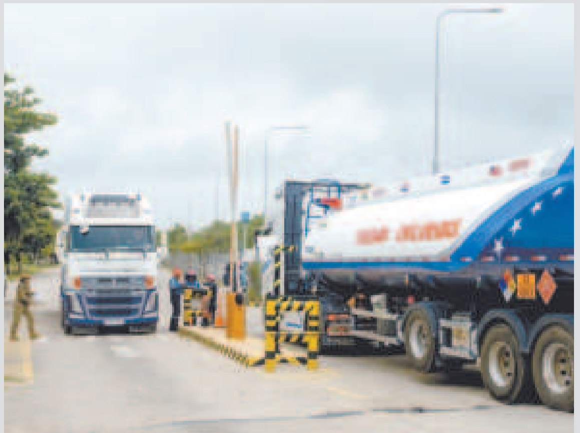
Los camiones cisterna descargan en la Planta de Palmasola.

Indicó además que se hace la carga en camiones cisterna con 10 millones de litros de diésel en Paraguay, Argentina y Chile, volumen que próximamente ingresará al país.