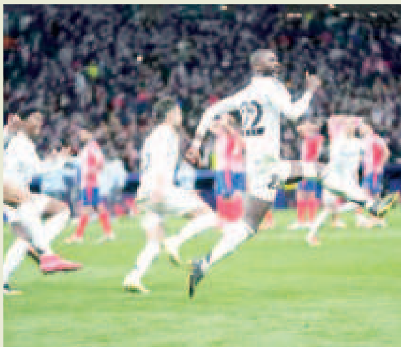
Jugadores del Real Madrid celebran la clasificación a los cuartos de final de la Liga de Campeones.

También lograron sus boletos a cuartos el Borussia Dortmund al derrotar 2-1 al Lille, y el Aston Villa, verdugo 3-0 de Brujas.