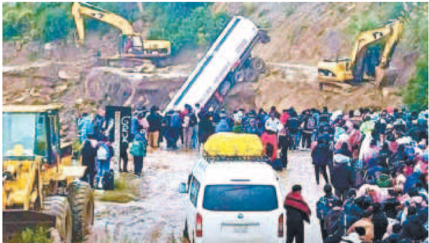
En el sector de Llavini, en Cochabamba, se perdió la plataforma y cayó una cisterna.

Se atenderán principalmente tres puntos: Llavini (Cochabamba), puente Palcoco (La Paz), y la ruta Santa Bárbara-Caranavi (La Paz).