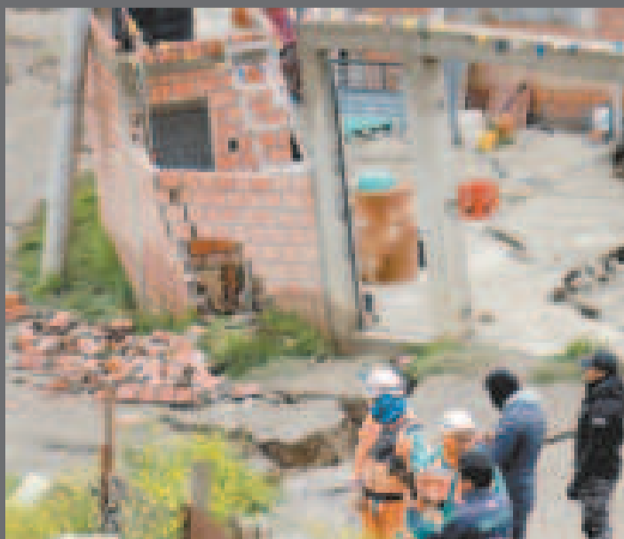
Una casa destruida en Codevisa, La Paz.