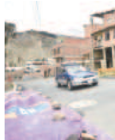
Avenida Francisco Bedregal, en Sopocachi.

“Recordemos que la forma de prevenir es hervir el agua y lavar adecuadamente los alimentos”, recomendó la autoridad en salud.