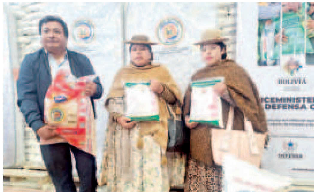
Familias afectadas de Viacha reciben ayuda humanitaria.