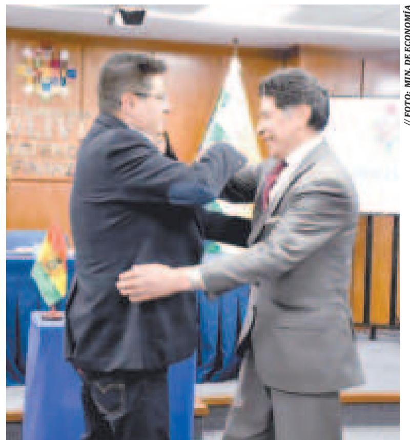
Acto de posesión del nuevo Viceministro de Pensiones y Servicios Financieros.