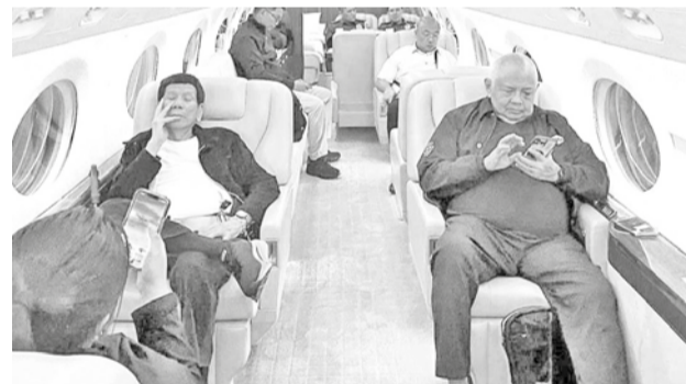
El presidente de Filipinas Rodrigo Duterte espera en un avión alquilado el vuelo hacia La Haya.

La medida suspendida ahora temporalmente iba a permitir a Ontario recaudar entre 207 mil y 277 mil dólares adicionales al día y Ford explicó que podría aumentar más el precio si Trump incrementa los aranceles contra Canadá.