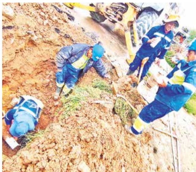
Los trabajos paliativos que realiza Semapa. D. JAMES