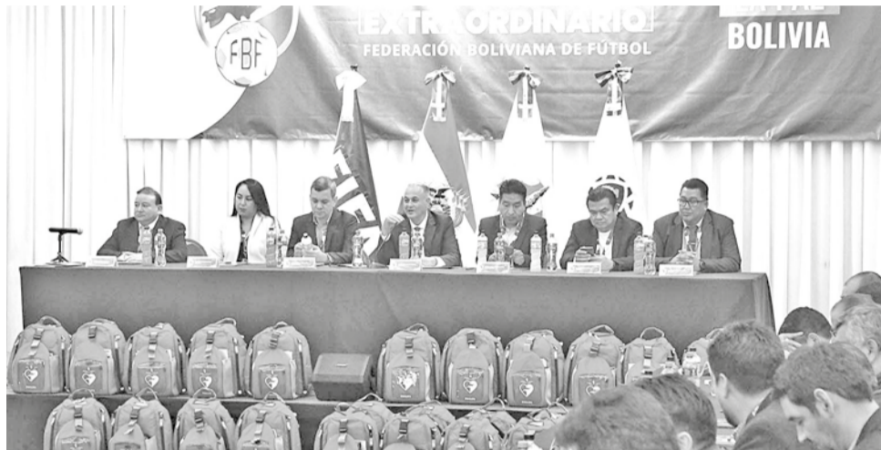
Miembros de la FBF en congreso extraordinario.