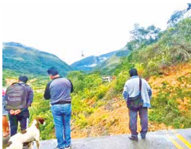
Lluvias dejan destrozadas las carreteras.

Tragedia. Un vecino de Chasquipampa murió aplastado cuando cedió un talud. El riesgo por deslizamientos continúa en la ciudad de La Paz.