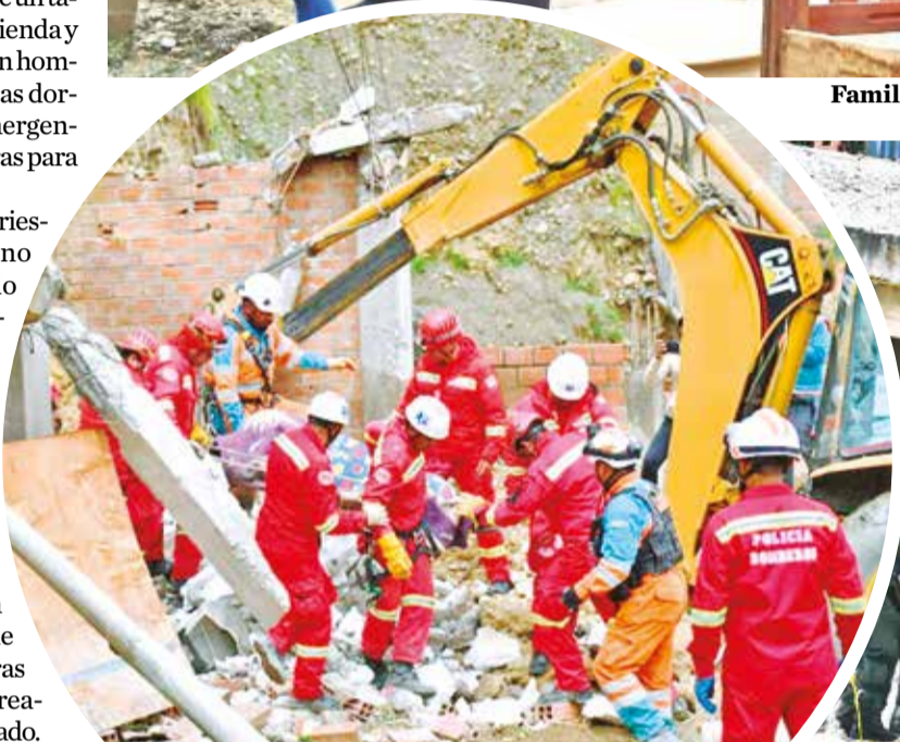
Rescatan sin vida víctima de derrumbe, en Chasquipampa