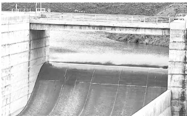
El rebalse de la represa de Misicuni en el Tunari.

Rebalse. La represa almacena 180 millones de metros cúbicos de agua, garantizando la provisión para riego, electricidad y consumo