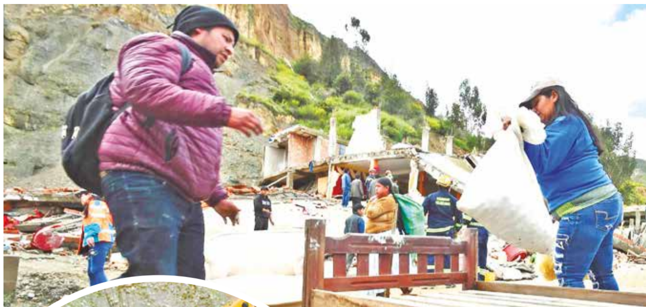
Familias rescatan sus muebles, ayer.

La Alcaldía activó una campaña de donación para recolectar alimentos, bebidas, ropa, artículos de higiene personal, así como medicamentos básicos.