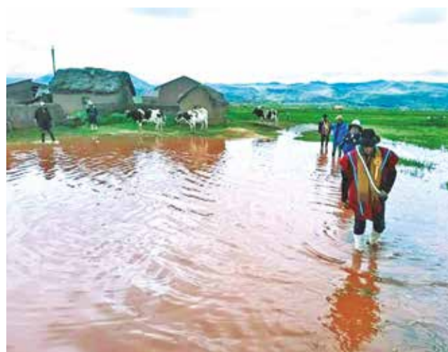
Desborde del río en Guaqui afecta cultivos. RRSS