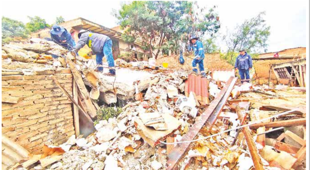
Una de las casas que se derrumbó por el deslizamiento en la OTB Nuevo Amanecer de Cercado, ayer.

Mientras tanto, la circulación de vehículos en la carretera hacia Oruro y Potosí se mantiene restringida por los trabajos que realiza personal de la Administradora Boliviana de Carreteras (ABC) ante los deslizamientos. Los viajes se hacen por rutas alternas.