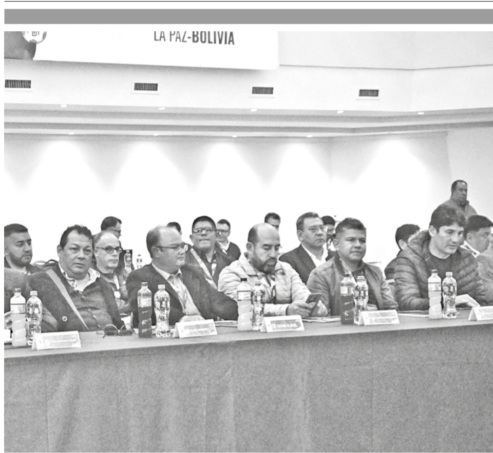
Presidente de los clubes profesionales de la Federación Boliviana de Fútbol. APG