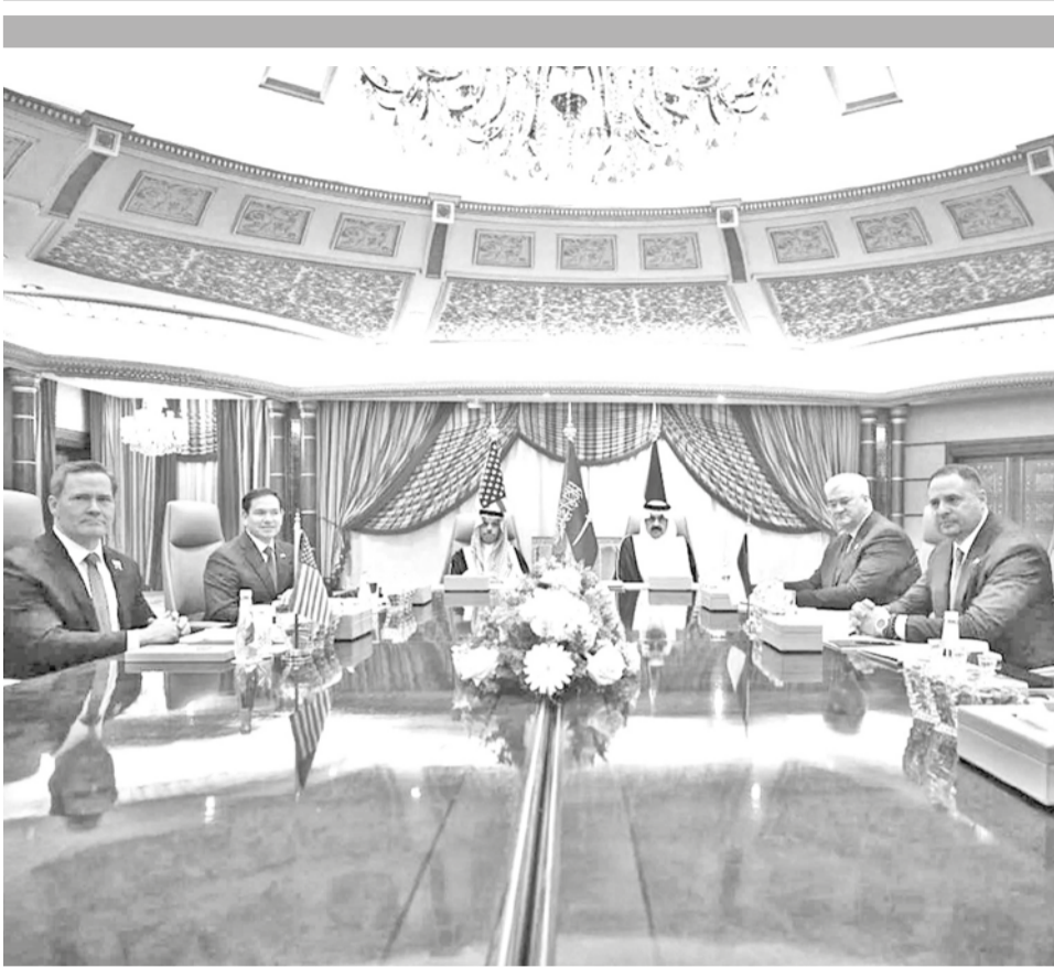
Representantes de Estados Unidos y Ucrania durante la reunión en Riad.