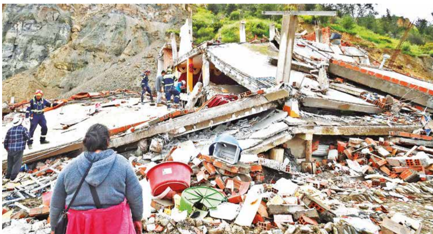
El daño y la evacuación de toda la urbanización en La Paz por el riesgo de deslizamientos de toneladas de tierra, ayer.