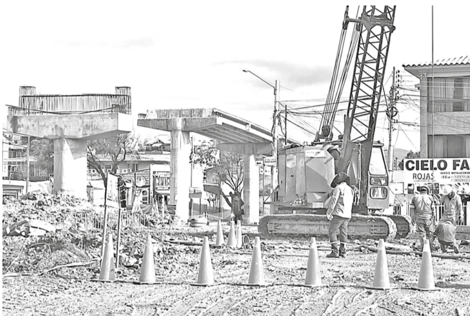
La falta de diésel afecta los trabajos del distribuidor de la av. Perú, ayer. DANIEL JAMES

Entre las vías que se intervendrán se encuentran: la avenida América, luego la Melchor Urquidi, Circunvalación, Beijing entre otras. El bacheado se hará en diferentes horarios por lo que se recomienda a los transportistas tomar sus provisiones por los cierres.