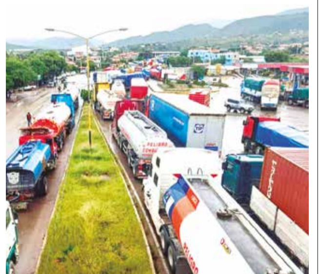
La restricción vehicular en la vía al occidente.