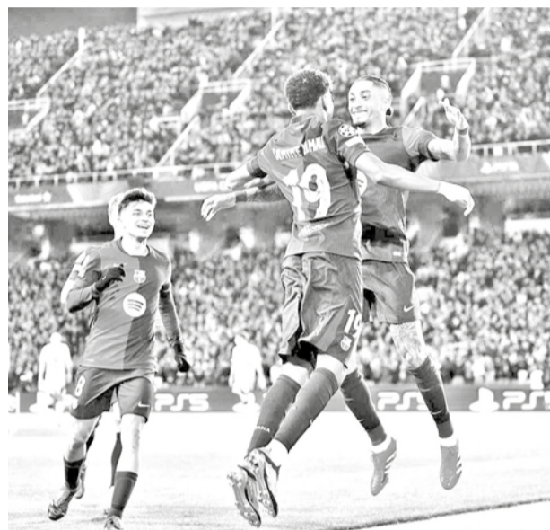
Jugadores del Barcelona festejan la clasificación. UEFA CHAMPIONS LEAGUE

Fútbol. Hoy Real Madrid buscará asegurar su cupo ante un Atlético de Madrid confiado en poder revertir la llave en su casa