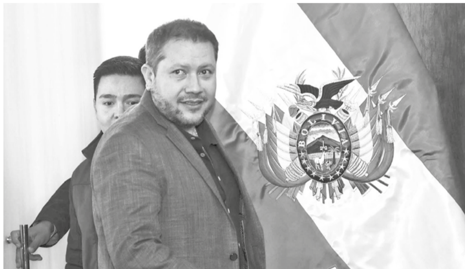
Alejandro Gallardo ministro de Hidrocarburos y Energías.

La decisión se da en un contexto crítico para YPFB, que enfrenta dificultades para importar combustibles debido a la falta de divisas y la aprobación de créditos externos por parte de la Asamblea Legislativa. Según Ga-