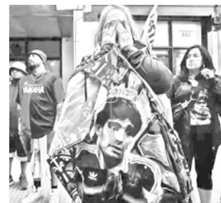
Hinchas de Maradona en puertas del tribunal.

lante en el Tribunal de lo Criminal N°3 de San Isidro, provincia de Buenos Aires. A la