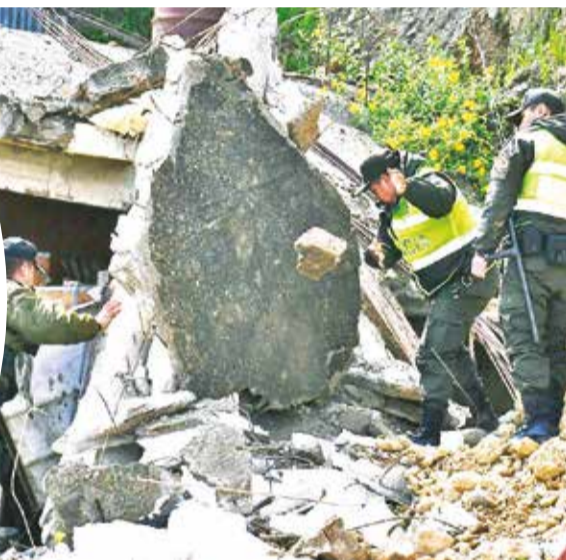
Codavisa sigue en riesgo de deslizamiento.