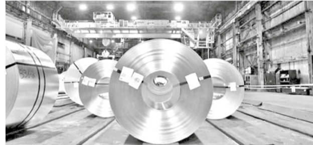
Bobinas de acero en un taller de galvanizado en Hamilton, Ontario.

Guerra comercial. La medida surge después de que Ontario suspendiera el impuesto a la electricidad a EEUU