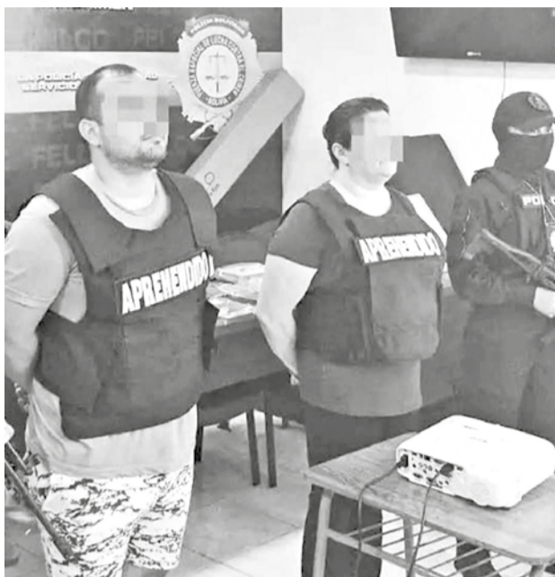
Los implicados en el presunto asesinato.