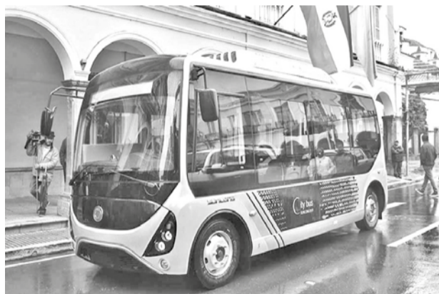
El bus eléctrico que llegó a Cochabamba. CARLOS LÓPEZ

Mencionó que se hace el monitoreo de diferentes cuencas para apoyar con maquinaria pesada en caso de emergencias.