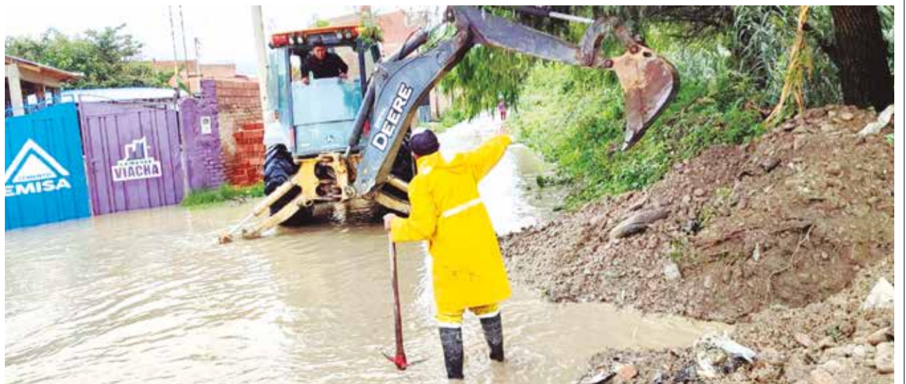
Las inundaciones que afectaron a barrios en la zona sur del municipio de Vinto, ayer.