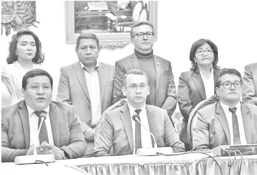
Magistrados y consejeros en conferencia de prensa, ayer.