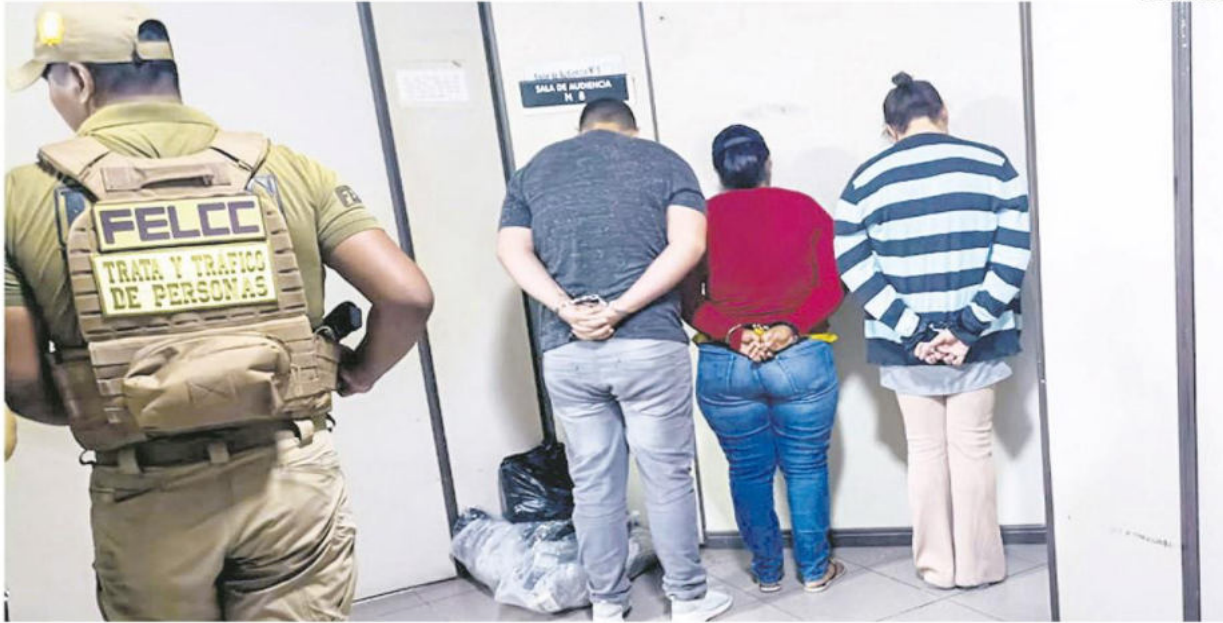
Las personas que son señaladas de ayudar a hacer desaparecer evidencias en la escena del crimen, pero no dicen dónde están los cuerpos