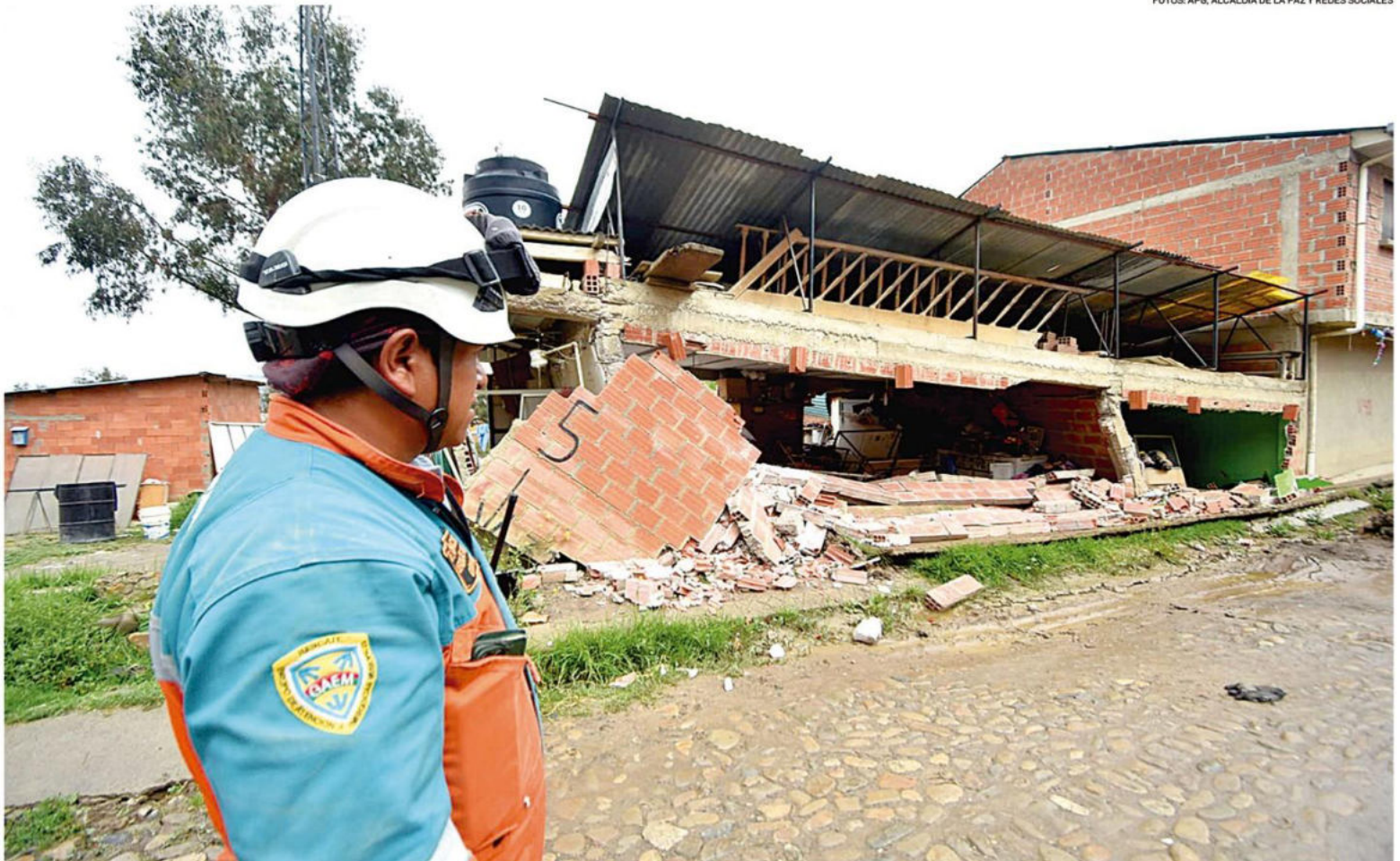
Las brigadas de auxilio llegaron a la zona de Codavisa, en la ciudad de La Paz, donde se registraron daños en las viviendas lo que obligó a las familias a buscar otro refugio