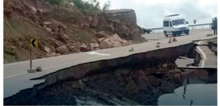
La vía sufrió daños, entre Cochabamba y Toro Toro

gencia, donde hay 6.606 familias afectadas en 284 comunidades y 2.713 hectáreas de cultivos perjudicadas. Además, el municipio de Culpina sumó una nueva víctima de 57 años, con lo que hace un total de cuatro fallecidos a causa de estos eventos adversos.