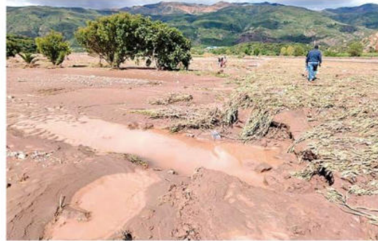
En Sicaya se registraron daños en los cultivos