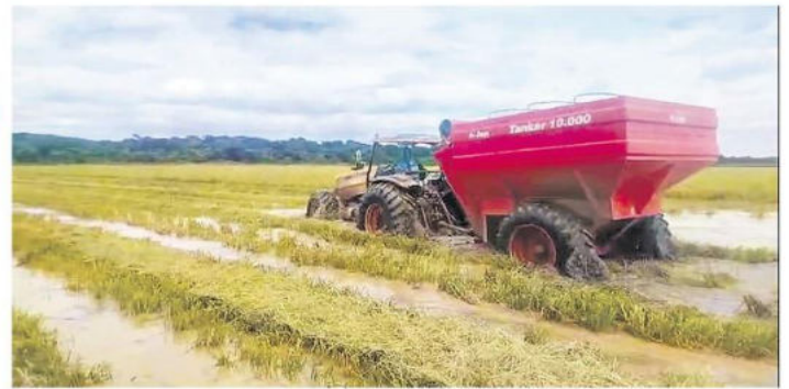
En el norte cruceño, en San Pedro se afectaron los sembradíos de arroz