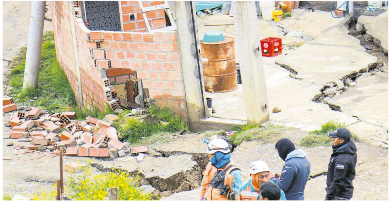
Los daños son visibles en las casas, donde hasta el suelo tiene rajaduras profundas y persisten las precipitaciones

También las intensas lluvias y granizadas azotan a Chuquisaca. Tiene a 18 municipios en emer-