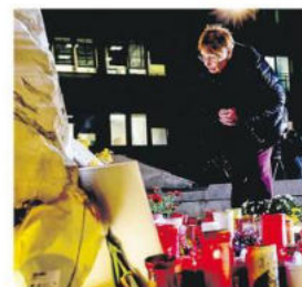
Rezos por el sumo pontífice

En noviembre pasado, Milei ordenó el retiro de la delegación argentina de la Conferencia de las Naciones Unidas sobre el Cambio Climático de 2024 (COP 29), que se celebraba en Bakú, y meses después, admitió que estaba analizando salir del Acuerdo de París, un día después de haber anunciado el retiro del país de la Organización Mundial de la Salud (OMS).