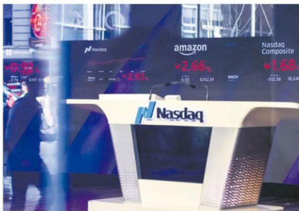
Mercados mundiales se han visto afectados por la guerra comercial

Bajo este escenario, la sesión bursátil en EEUU ha registrado fuertes pérdidas, y particularmente en el sector tecnológico; el Nasdaq baja un 4% al cierre de los mercados, con caídas lideradas por las siete magníficas: Tesla se deja el 15,4%, Apple el 4,8%,