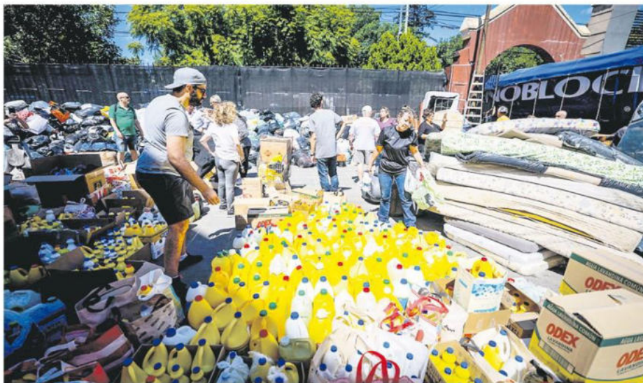
En diversos barrios de Buenos Aires se han realizado colectas para los damnificados de Bahía Blanca

"Bahía Blanca es una muestra más de cómo el cambio climático está alterando el patrón de los fenómenos climáticos. La infraestructura de la ciudad no estuvo preparada para manejar los niveles de agua. Esto puso en evidencia la falta de una