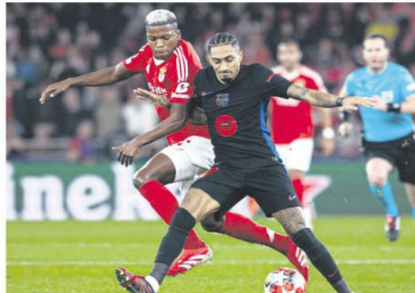
El equipo catalán buscará su pase a cuartos de final en Montjuïc

A las 16:00, el duelo alemán, el Bayer Leverkusen se enfrenta al Bayern Múnich en el BayArena. El Bayern lleva una ventaja de 3-0 tras el primer encuentro, lo que lo coloca como favorito para avanzar. Sin embargo, el equipo de Xabi Alonso luchará por revertir la situación.