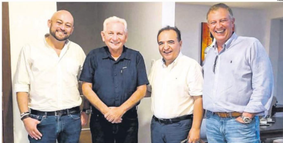
La reunión de los líderes cruceños se dio el jueves en la casa del exgobernador de Santa Cruz