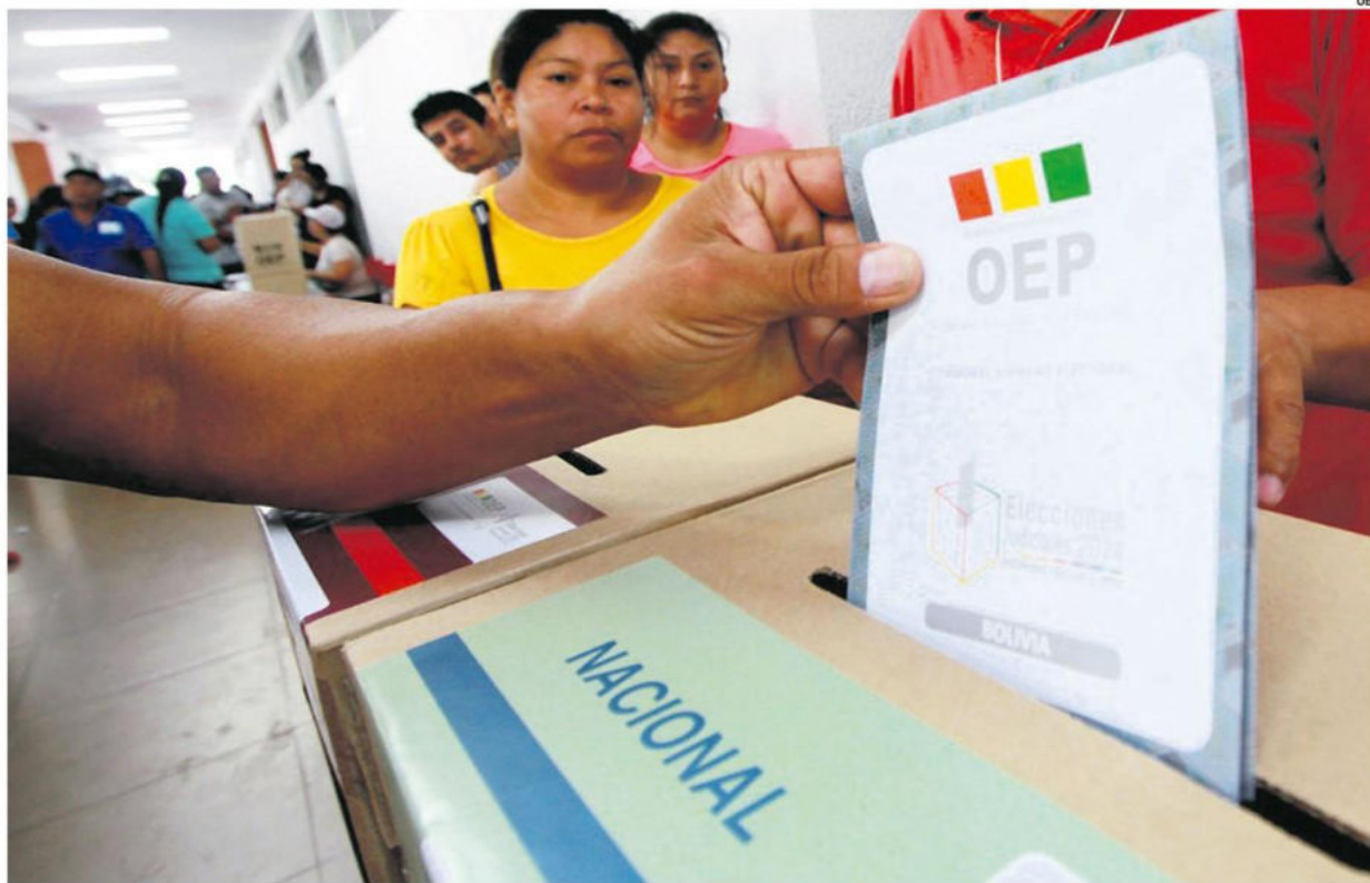
Las elecciones del 17 de agosto tendrán un sistema de transmisión de resultados preliminares, según el proyecto del TSE

Eso sí, esta fase podría fluir si la Asamblea Legislativa finalmente valida la normativa que se se presentó hace varios meses.