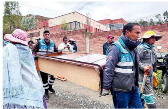
La gente se dio modos para sacar todas sus pertenencias