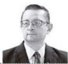
Oscar Ortiz EX SENADOR Y EX MINISTRO

"Carnaval en los surtidores" fue el titular de un noticiero que describía a cabalidad las penurias que sufrieron, y continúan, los ciudadanos durante los feriados mas festivos del calendario nacional. La escasez de combustibles refleja la carencia de divisas que experimenta la economía boliviana debido al carácter insostenible de la subvención de los precios de los hidrocarburos, los cuales ya no pueden ser asumidos por el Tesoro General de la Nación por el desbalance que este confronta debido al déficit crónico que padece desde que inició la caída de los volúmenes de producción y los precios internacionales de las principales materias primas que exporta Bolivia.