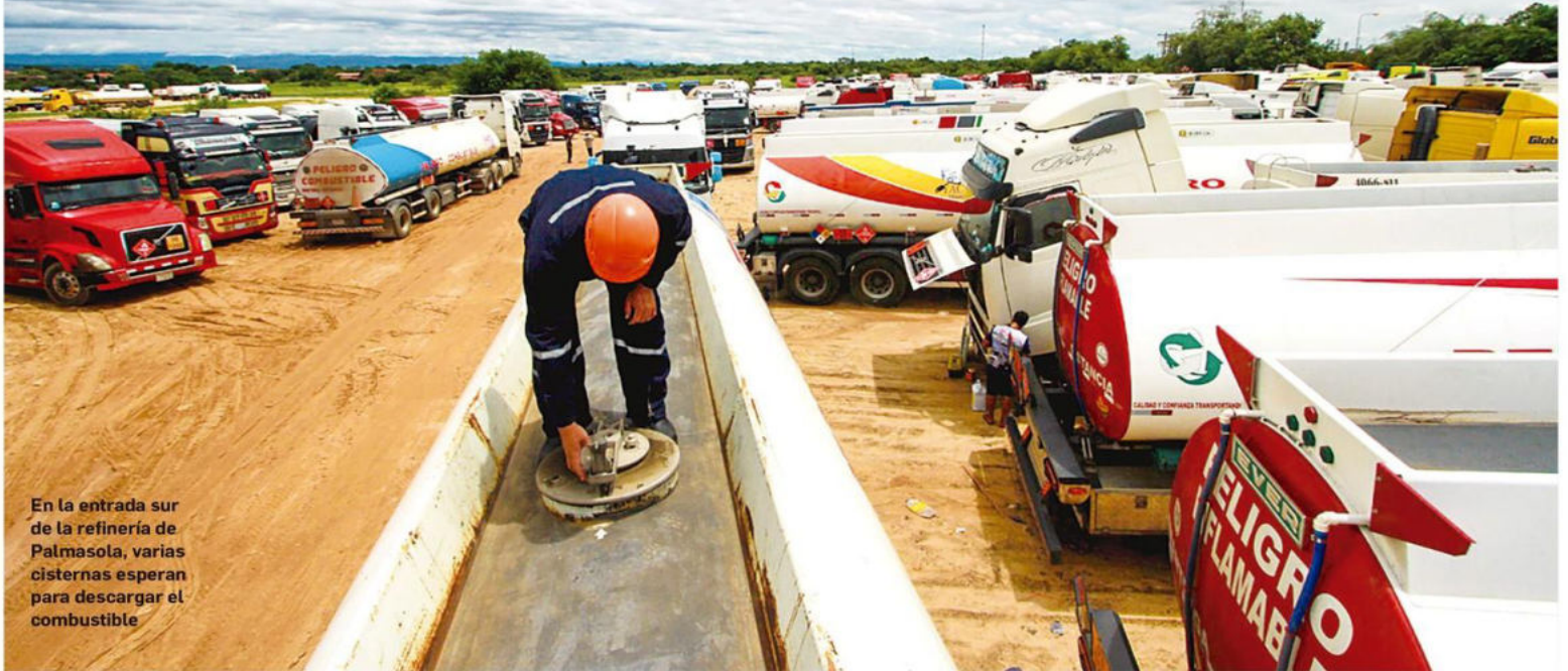
En la entrada sur de la refinería de Palmasola, varias cisternas esperan para descargar el combustible

El ministro de Hidrocarburos admitió que no puede atender el mercado interno. Planteó que YPFB intermedie en la compra de carburantes para el agro y minería, sectores rechazan esta propuesta