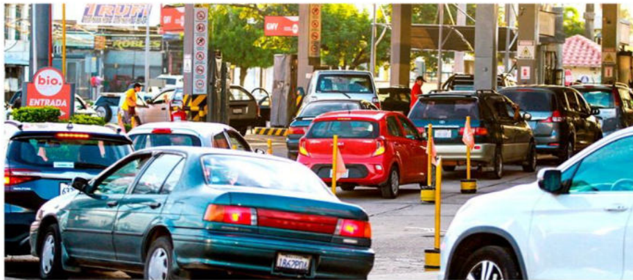
Largas filas de vehículos en surtidor en el tercer anillo de la avenida Roca y Coronado de la ciudad

cial para el sector pecuario, ya que sus derivados son utilizados por avicultores y ganaderos, quienes proveen a los bolivianos de pollo, carne de res y cerdo.