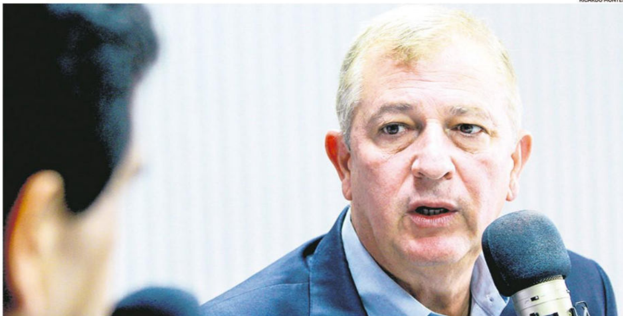
El empresario y político ha sido crítico con el bloque de unidad y asegura que su único objetivo es que el MAS salga del Gobierno