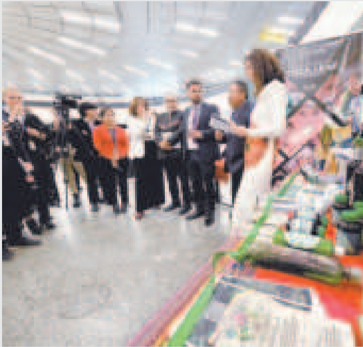
El Vicepresidente expone los productos y beneficios de la hoja de coca en Viena.

una nueva política basada en el “culto de la vida”, el respeto a la naturaleza y el reconocimiento a los saberes ancestrales.