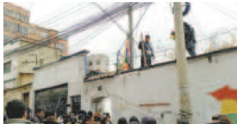
Evistas armados con palos.