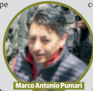
Marco Antonio Pumari

La violencia escaló a niveles en los que las fuerzas de seguridad del Estado dispararon contra civiles desarmados en El Alto y Sacaba, provocando una veintena de fallecidos, cientos de heridos y miles de perseguidos en la amplia geografía nacional.