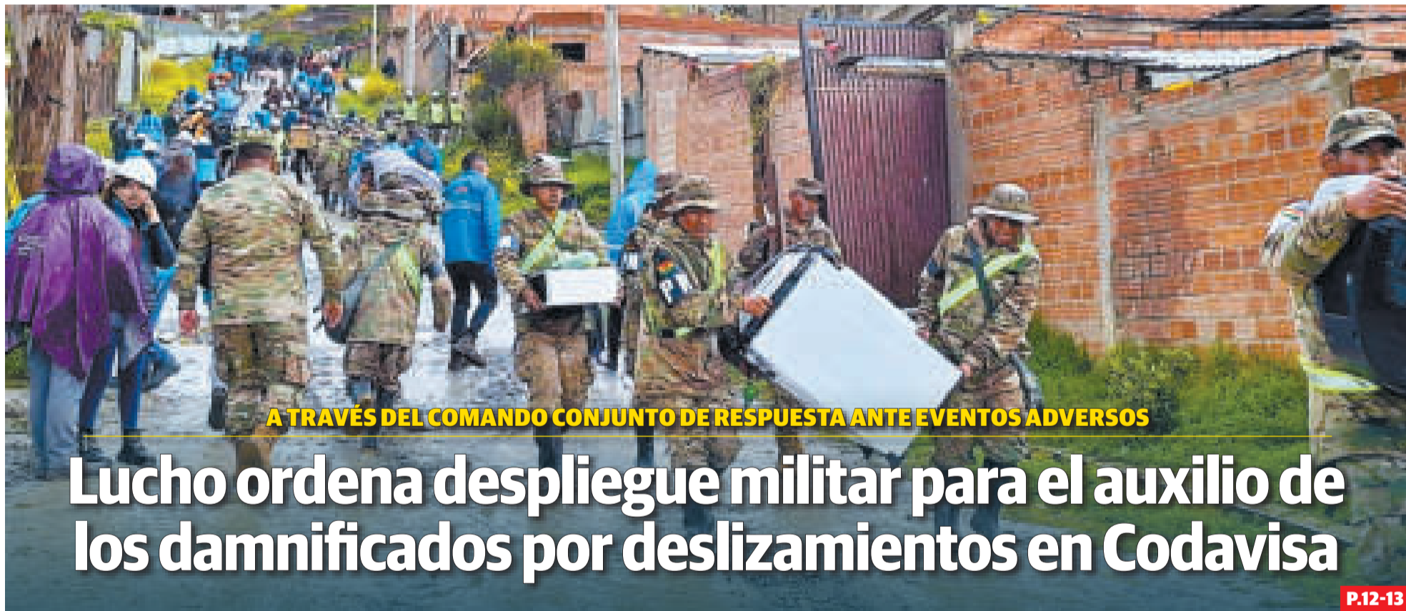
A TRAVÉS DEL COMANDO CONJUNTO DE RESPUESTA ANTE EVENTOS ADVERSOS