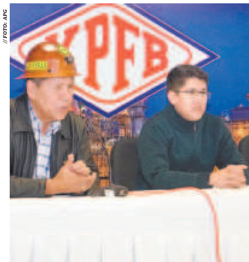
Autoridades de Hidrocarburos y un dirigente de Ferrec.

“De manera posterior también nos vamos a reunir con todos los diferentes sectores productivos con el fin de generar que la economía siga siendo activa y de evitar perjudicar a los sectores productivos de la economía a nivel general”, señaló el titular del área.