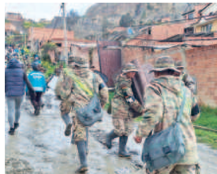
Efectivos militares coadyuvan en los eventos adversos por intensas lluvias.

410 viviendas destruidas y 40 fallecidos oficial del Viceministerio de Defensa Civil.