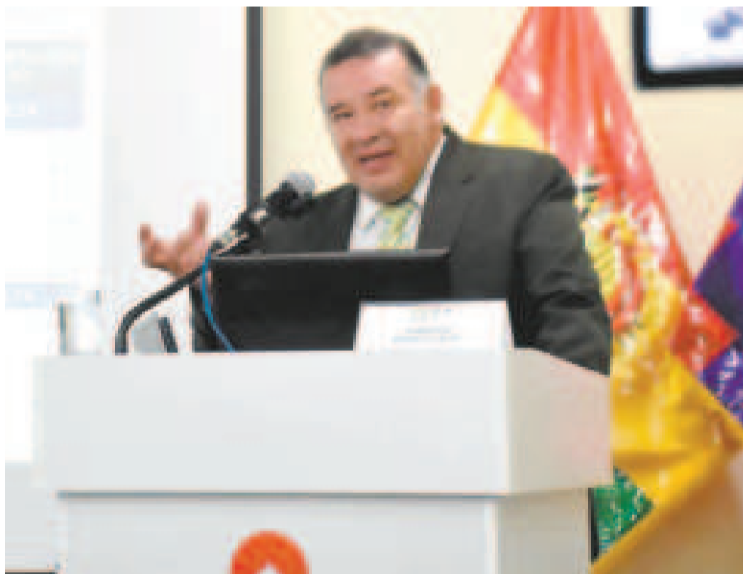
El director del Instituto Nacional de Estadística, Humberto Arandia, en conferencia de prensa.

Uno de los sectores que también vio un alza fue el transporte, específicamente el servicio de minibuses o colectivos en la ciudad de La Paz, que experimentaron un incremento en sus tarifas. Sin embargo, el transporte interdepartamental, en particular los buses, experimentó una caída del 24% en sus precios debido a la ausencia de feriados durante el mes de febrero, lo que permitió una estabilización de los costos.