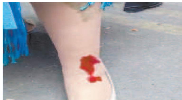
La mujer de pollera que fue herida con un vidrio por los evistas.

Cuando la víctima intenta huir por el muro, porque los evistas sentenciaban que los iban a “moler a palos”, dos mujeres y un hombre la agarraron de las polleras y la hicieron caer al suelo. La mujer tiene fuertes lesiones en ambas piernas.