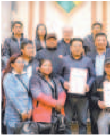
Reconocimiento a las instituciones estatales.