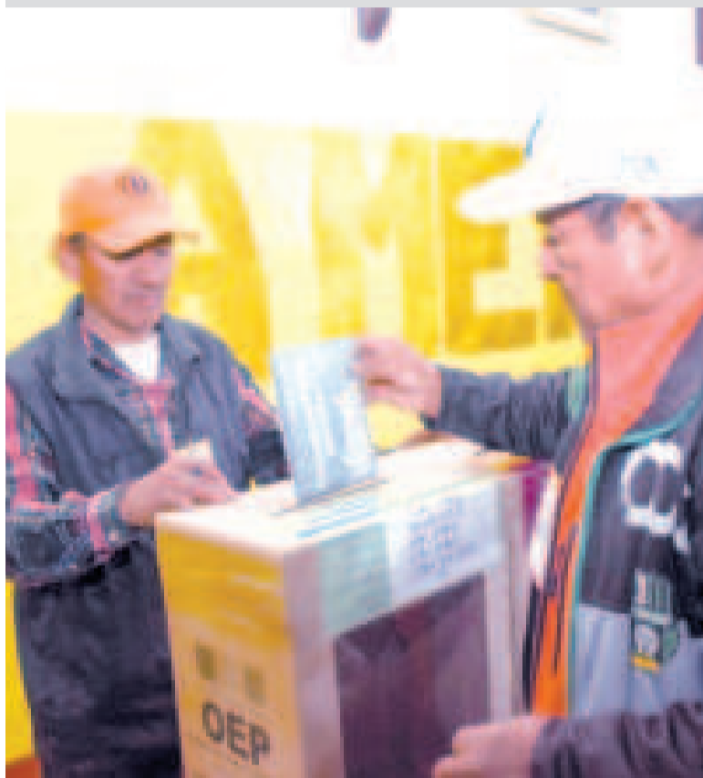
Una persona emite su voto en un ánfora electoral.