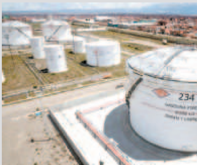
Una planta de almacenaje de YPFB.

Asimismo, se avanza con las medidas estructurales, como el Plan de Reactivación del