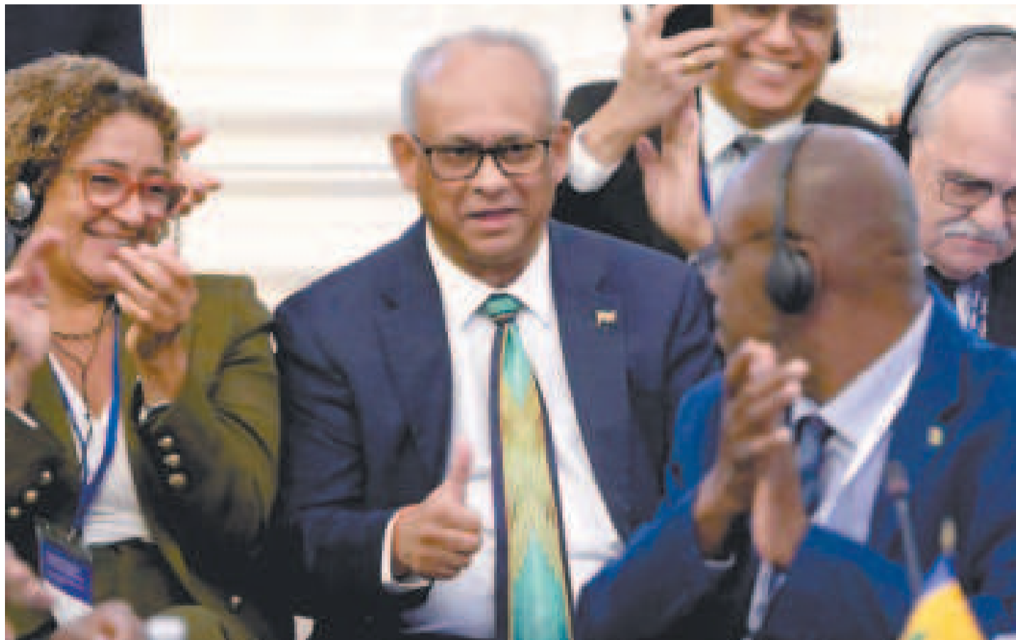
El nuevo secretario general de la OEA es el canciller de Surinam, Albert Ramdin.

“ En 2019 sufrimos una grave injerencia del secretario general a nuestra democracia. Esperamos que esta injerencia no se repita más en Bolivia ni en los demás Estados miembros de la OEA”.