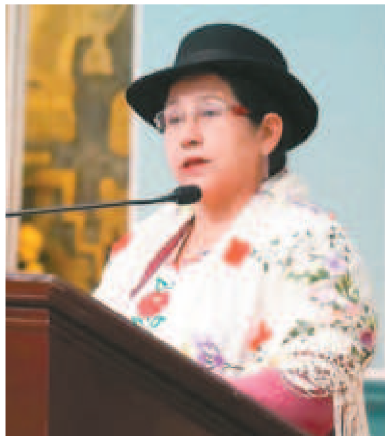
La ministra de Relaciones Exteriores, Celinda Sosa.

La canciller finalizó su intervención expresando la esperanza en que, al mando de Ramdin, la OEA tenga una visión de inclusión de los pueblos de Latinoamérica y el Caribe, e invitó abiertamente al organismo a ser observador de las elecciones generales de agosto en Bolivia.