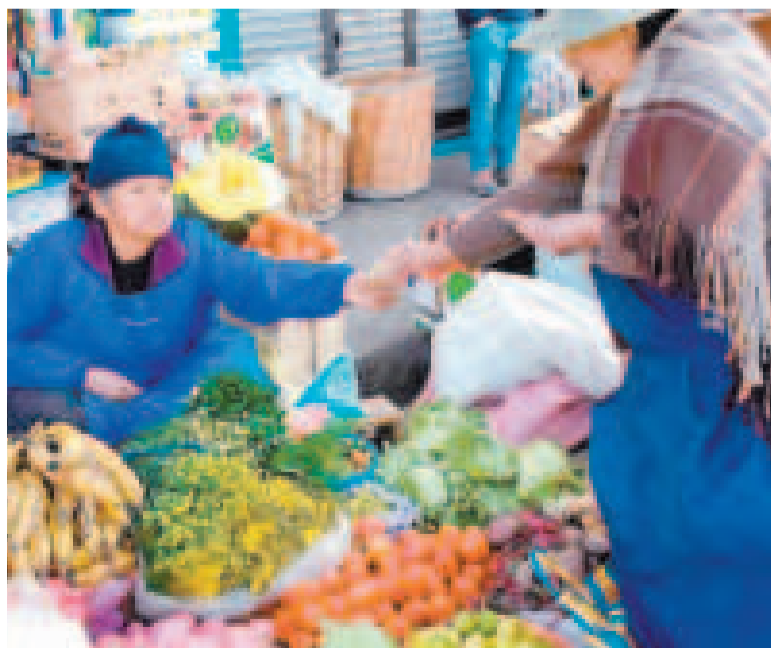
Los precios en los mercados se mantuvieron relativamente estables.