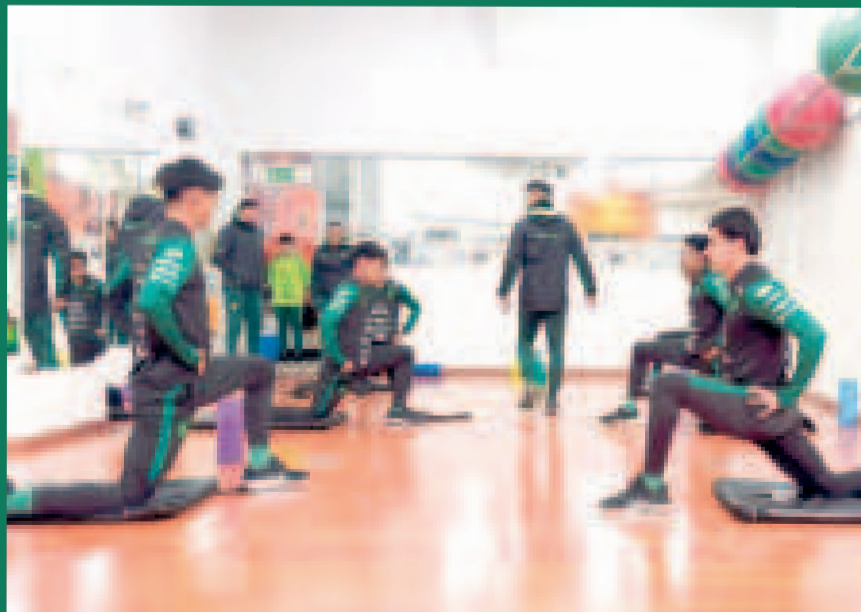
La Selección hizo ayer un trabajo regenerativo con una sesión de gimnasio.