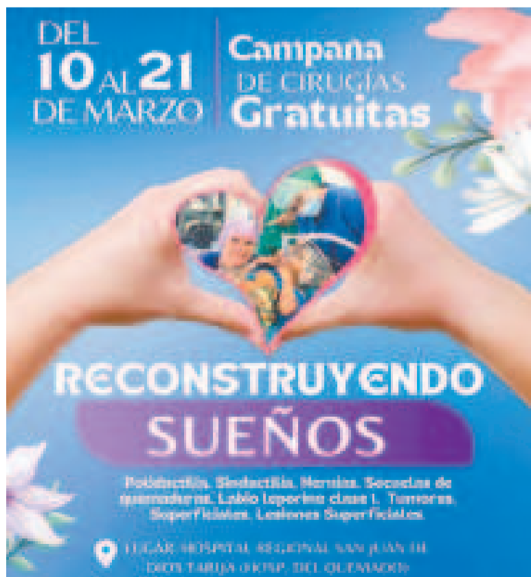
Campaña de cirugías en el Hospital Regional San Juan de Dios, en Tarija.