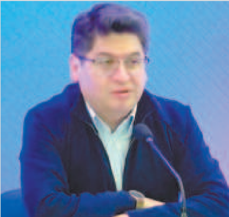
El ministro de Economía y Finanzas Públicas, Marcelo Montenegro.