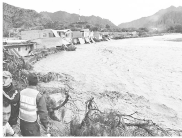
Inundaciones por desborde el río Pilcomayo.

En Beni, se reportó la crecida de varios ríos, y en Chuquisaca, el río Saucos se desbordó, dejando una vía cortada.