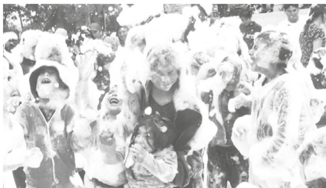
Niños se divierten con espuma en el parque ayer.

Diversión. Pese a las lluvias intermitentes, decenas de niños acompañados de sus padres se concentraron para disfrutar del show.