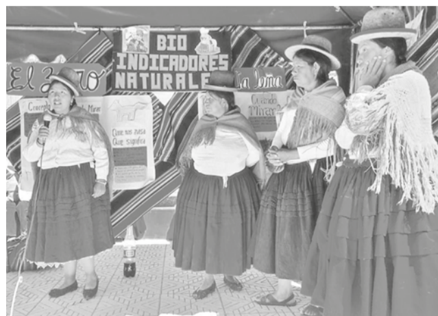
Indígenas de tierras altas. CIPCA