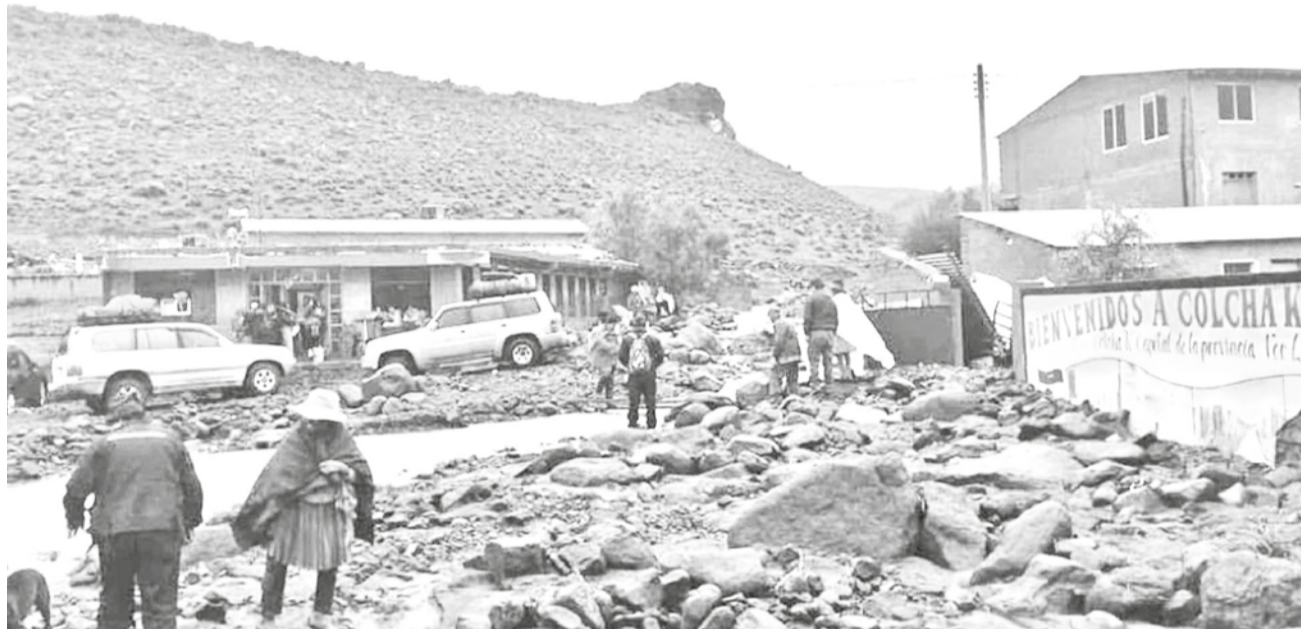
Viviendas derrumbadas en Colcha K, en el departamento de Potosí.

Calvimontes explicó que, aunque las precipitaciones fueron de corta duración, su intensidad saturó los sistemas de drenaje, provocando inundaciones en varias regiones. "Las afectaciones superan por