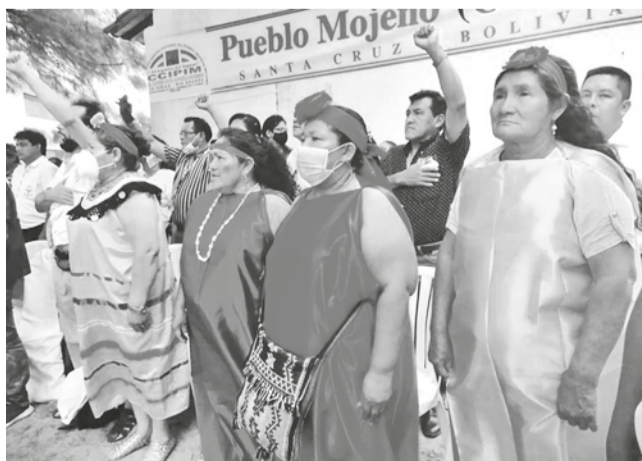
Mujeres de la Amazonía boliviana. APG