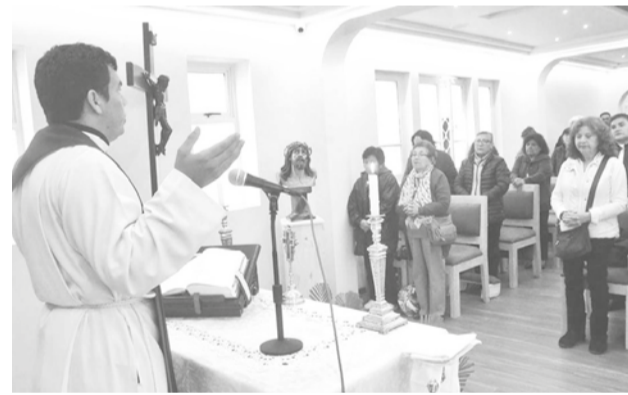
La misa en la capilla del Cristo de las Lágrimas. H. ANDÍA

En el marco del programa de las actividades del Carnaval de la Concordia se prevé que el próximo fin de semana se llevará a cabo el Corso de la zona sur.