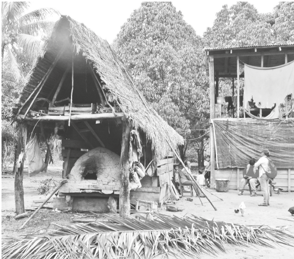
Representantes de pueblos indígenas de Bolivia. GERARDO BRAVO