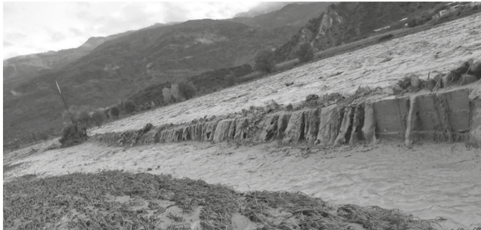
La afectación de vías y cultivos por el desborde del río Arque ayer.

la existencia de viviendas anegadas u otras emergencias.