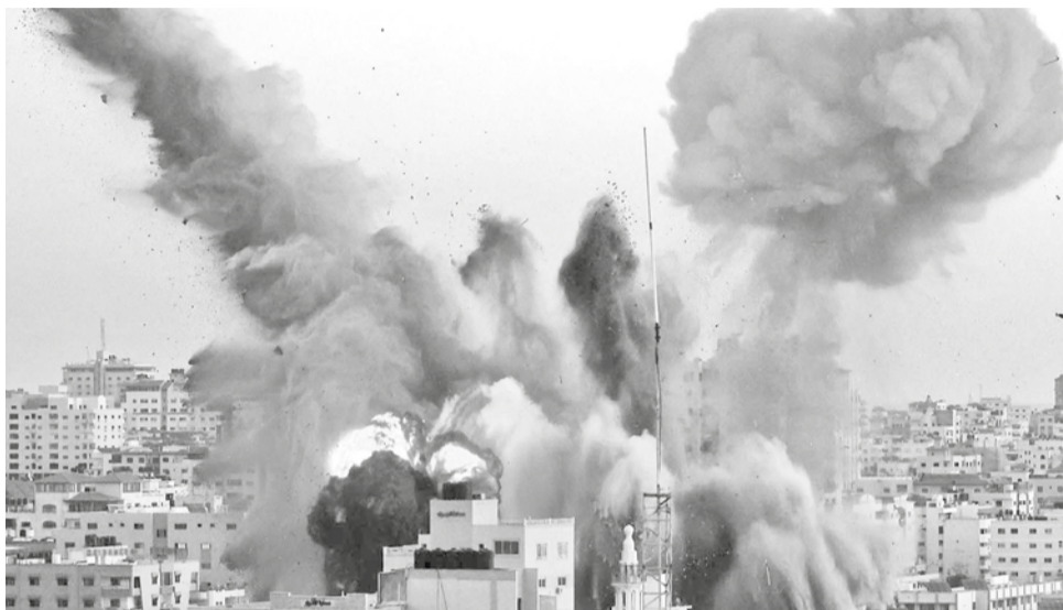
Bombardeos de Israel en Gaza.

La tregua en el conflicto puso fin a 15 meses de combates en Gaza