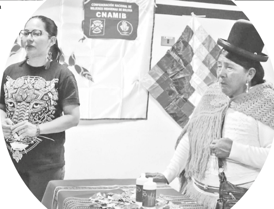
Mujeres elaboran su agenda para 2025. HERNÁN ANDÍA

Economía del cuidado Demandan el reconocimiento del trabajo de cuidado realizado por las mujeres y la implementación de medidas de corresponsabilidad para evitar la recarga sobre las mujeres.