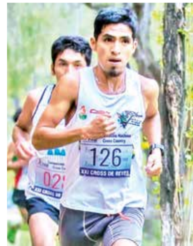
Arando, en el Torneo Nacional de Cross Country.