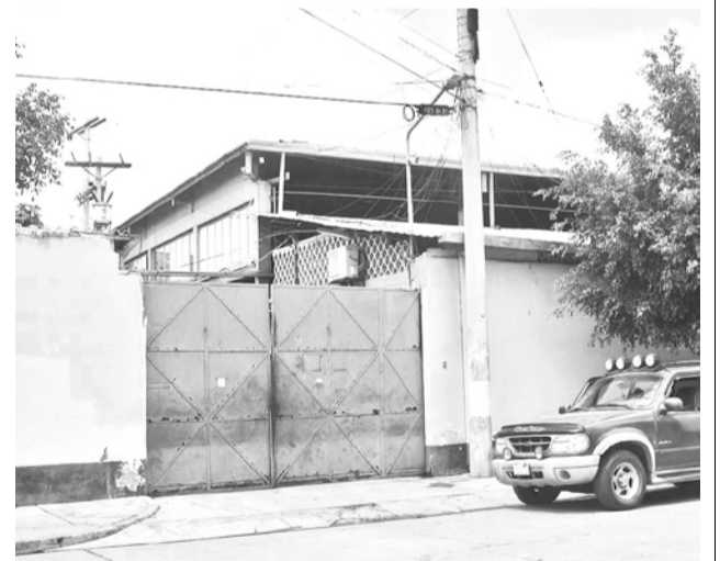
Fachada de la curtiembre en la zona mixta.