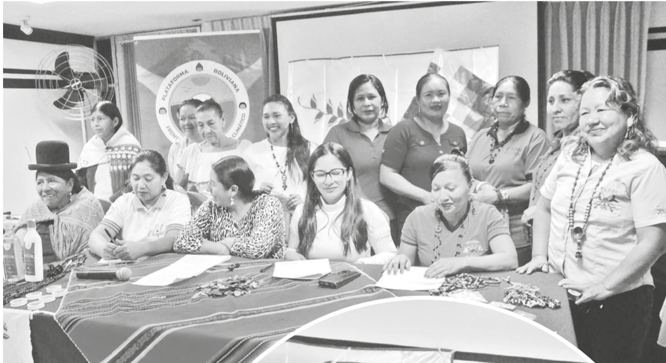
Líderes indígenas reunidas en Cochabamba. HERNÁN ANDÍA

Al respecto, las indígenas demandan la consulta libre e informada en sus territorios y que reconozca el papel de las indígenas de guardianas de sus territorios porque son las directas afectadas por la contaminación de sus ríos y la depredación de sus bosques poniendo en riesgo su seguridad alimentaria.