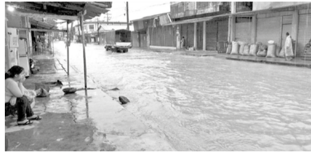
Las inundaciones en el municipio de Puerto Villarroel.

Puntualizó que Santiviáñez presentó inundaciones