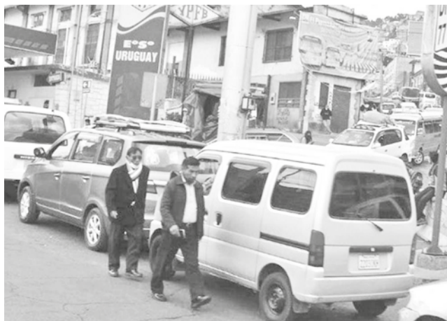
Filas de coches en una estación de servicio.

Similar medida, asumirá desde este lunes la Federación de Comunidades Interculturales Agropecuarias de Yapacaní, que convocó a sus afiliados para iniciar un bloqueo de caminos porque el Ejecutivo incumplió