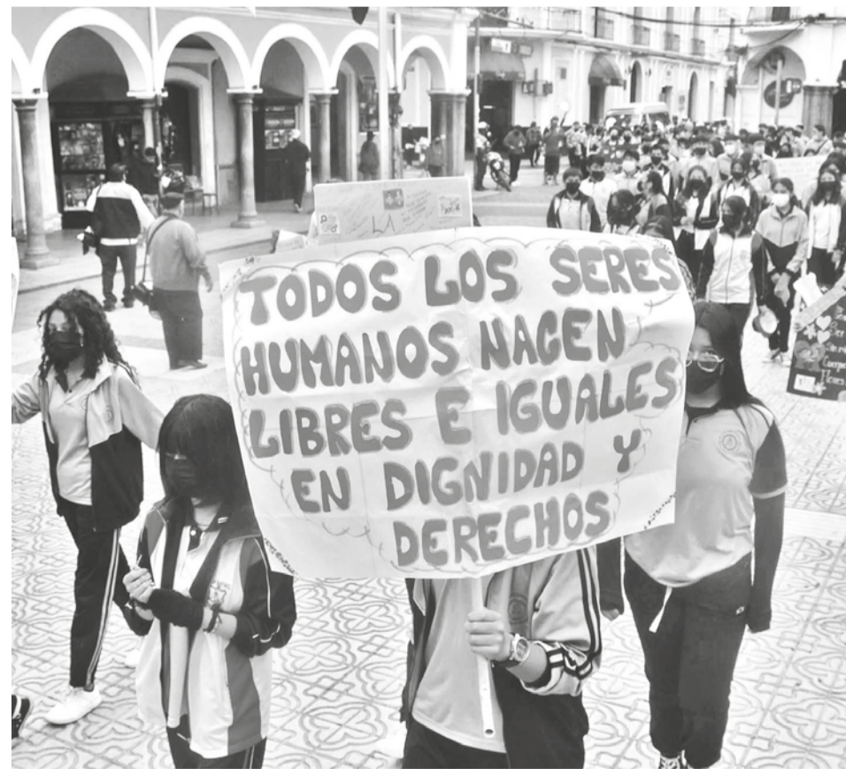
Marcha de mujeres bolivianas en reclamo por sus derechos. JOSE ROCHA

mayores transformaciones en cuanto a equidad de género en Bolivia fueron realizadas por la fuerza de las nuevas generaciones, “y los cambios en