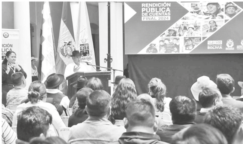
El gobernador Humberto Sánchez durante su Rendición Pública de Cuentas. JOSÉ ROCHA

“Es un proyecto bastante anhelado por los cochabambinos, estamos haciendo seguimiento. En el aniversario de Cochabamba hemos entregado el proyecto al Senado y para el oncológico de Tolata; también, se están reiniciando todas las gestiones”, sostuvo.