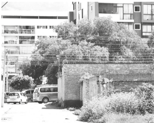
Otra construcción que sobresale a la vía en el barrio.