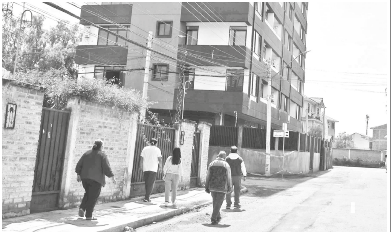
Uno de los edificios que se construyó sin respetar la rasante en la OTB Villa Busch Norte.

Al respecto, Goytia indicó que hace dos meses se notificó a la empresa con una sanción por la presencia de cuero en la calle y anunció que se aplicará multas.