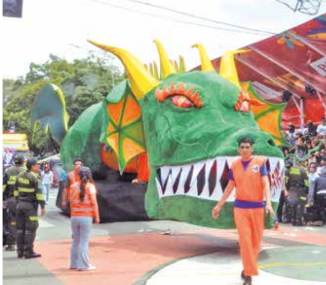
El paso de shenlong, un personaje de un anime.