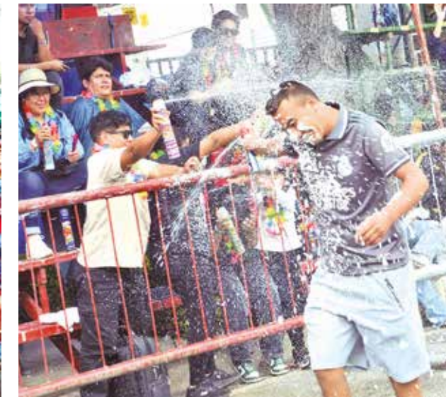
El juego con espuma y agua en la ruta.

más numerosas fueron las de caporal, tinkus, tobas, diablada, morenadas entre otras.