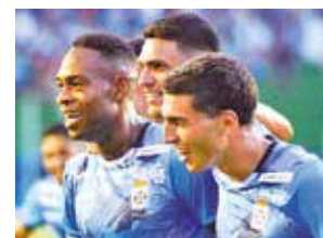
Jugadores de Blooming festejan la victoria, el jueves.