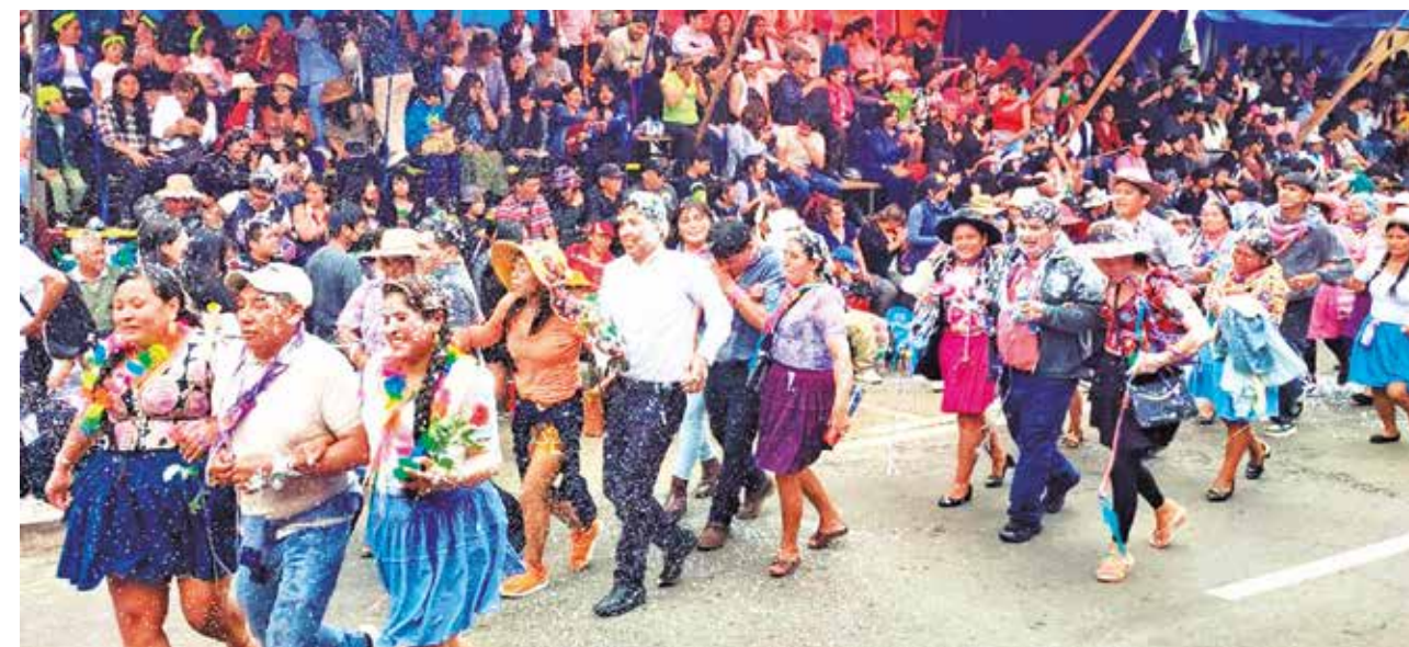
Una de las comparsas que participó en el Corso derrochando alegría y color. DANIEL JAMES

Después de mediodía, las fraternidades comenzaron a incorporarse al festejo. Las