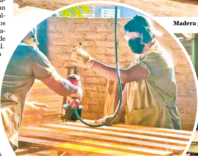
Trabajadores procesan y tratan la madera.