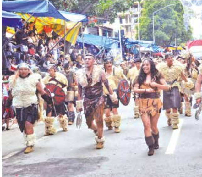
El vestuario y las coreografías de los premilitares.