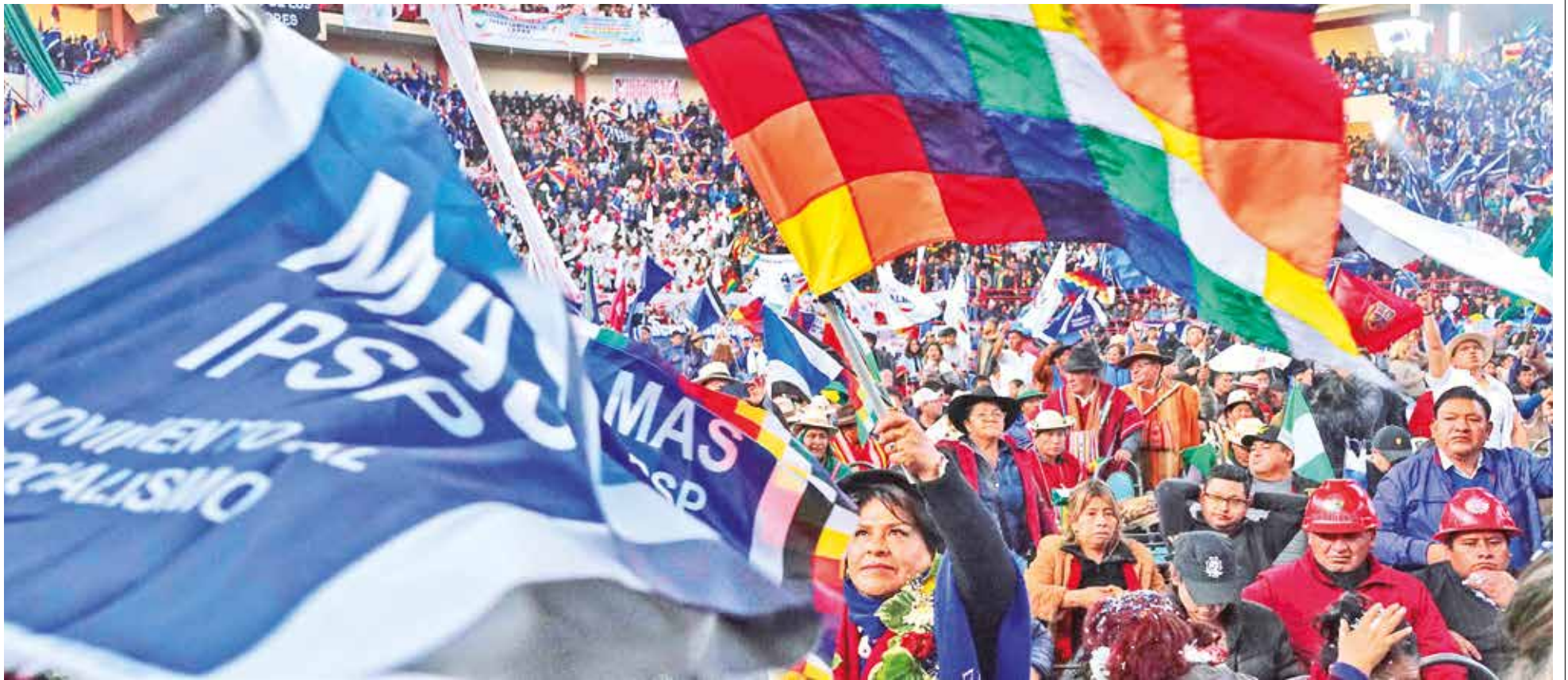
Militantes del Movimiento Al Socialismo (MAS) en el congreso realizado en El Alto.