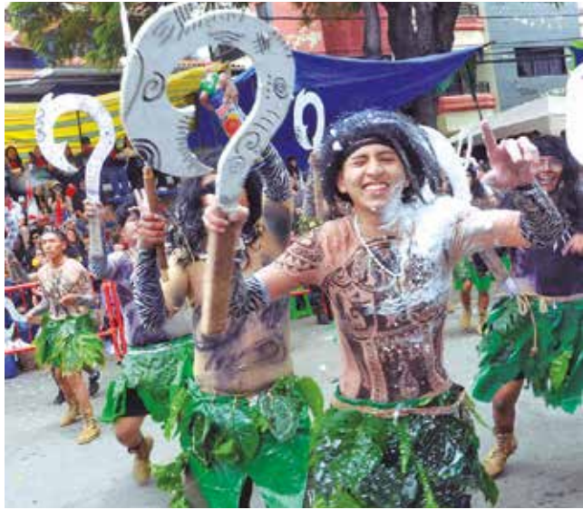
Soldados derrochan picardía y creatividad.