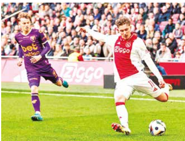
Ajax de Ámsterdam, uno de los equipos más tradicionales de Países Bajos y Europa

llamado Spartans, que alude al carácter aguerrido de sus futbolistas.