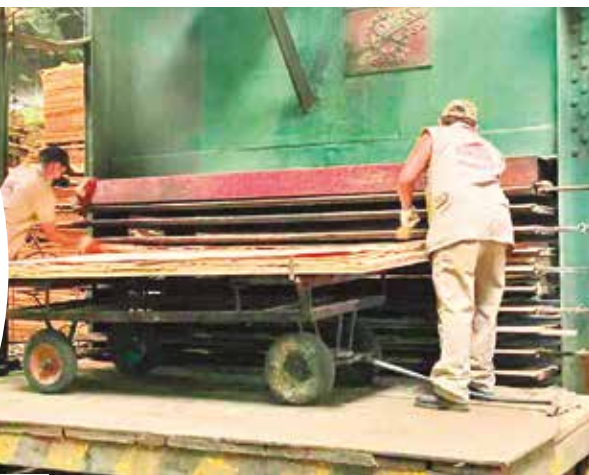
Tablones de madera son procesados en un aserradero.