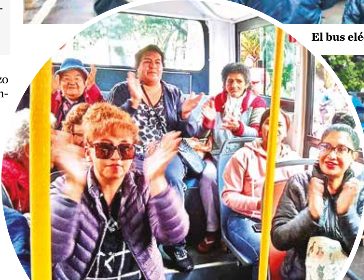
Ciudadanos observan el interior del bus eléctrico.