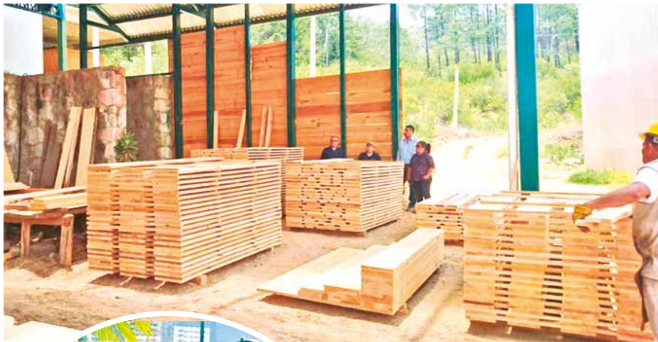
Madera procesada en un aserradero para exportación.

“El impacto de los incendios forestales, la reversión de tierras y los conflictos con actores interculturales ha sido devastador”, advirtió Ávila.