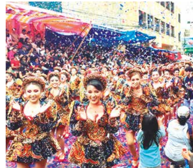
Fraternos realizan la despedida del Carnaval. D. JAMES