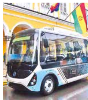
El bus puede transportar hasta 30 personas.