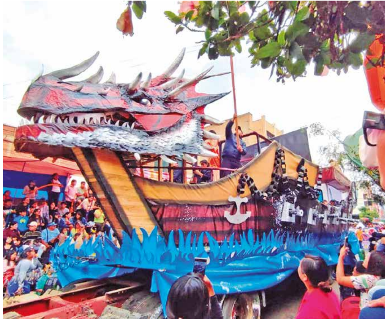
Una de las carrozas elaboradas con creatividad por una de las unidades militares en el Corso de Corsos.