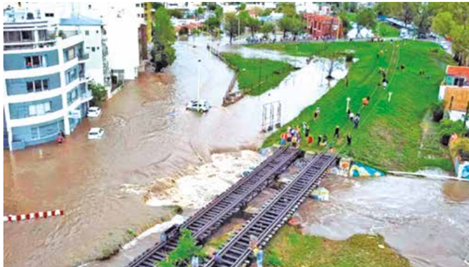
Bahía Blanca sigue anegada tras tormenta.