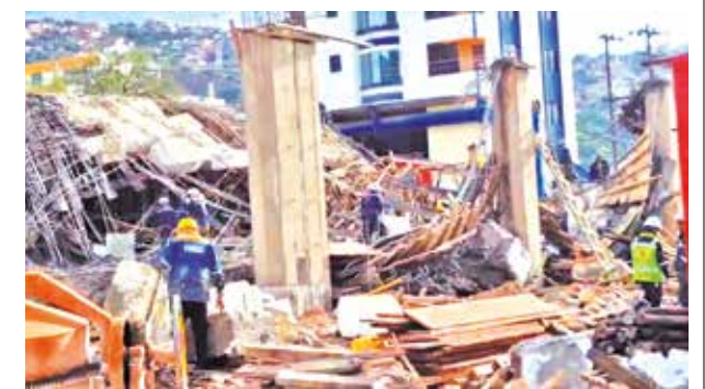
La losa que colapsó en la Fexco el viernes.

Tras el retiro, personal de la UGR procedió a precintar el sector para evitar accidentes de tránsito.