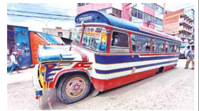
El micro afectado por el hundimiento ayer.

Algunas fraternidades reclamaron por el tiempo de espera para el ingreso, un aspecto a mejorar para la próxima versión.