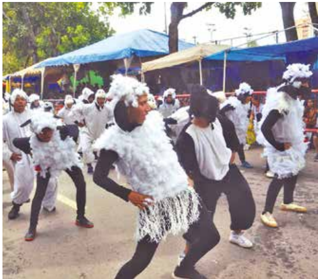
La participación de unidades militares en el Corso.