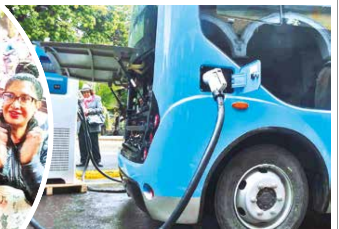
El alcalde muestra el motor y el cargador del vehículo.