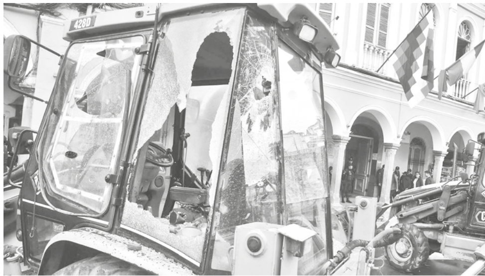
Una parte de la maquinaria pesada dañada tras el ataque de una turba ayer.