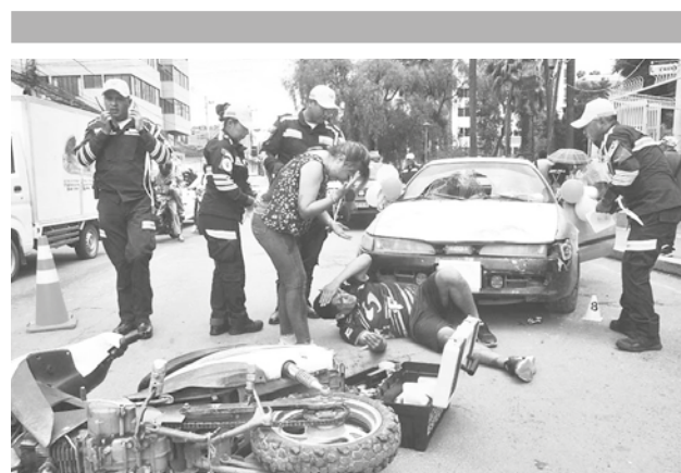
El simulacro de un accidente en la av. Oquendo. J. ROCHA

Ante cualquier sobreprecio, la línea gratuita 800 10 6000 o al WhatsApp 71533208 están habilitadas para denuncias.