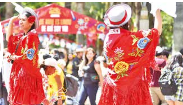
La Entrada de Comadres en Tarija.

Durante la tarde, las comerciantes compartieron un almuerzo y festejaron con mariachis, bandas y grupos musicales en vivo.