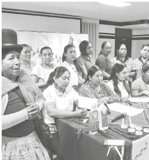
Líderes indígenas en encuentro nacional. HERNÁN ANDÍA

La Alianza de Mujeres Indígenas de Bolivia propuso la