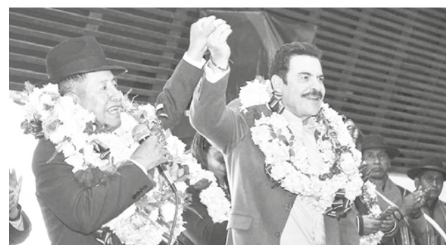
Manfred sella alianza con el “Tata Quispe”.

Análisis. Advirtieron que los ataques entre precandidatos y la persecución crecerá cuando Luis Arce oficialice su candidatura