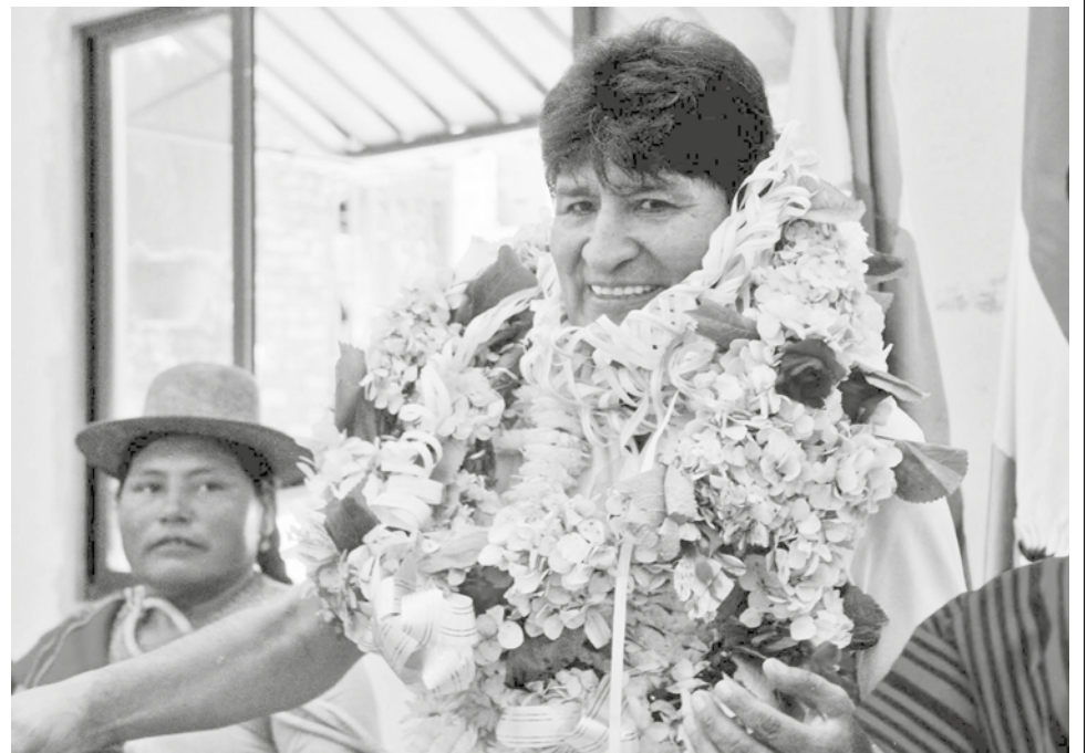
El expresidente Evo Morales, ayer, formalizó su renuncia al MAS. RKC

El exmandatario delegó a un tercero debido a que desde octubre permanece en el trópico de Cochabamba para evitar que se ejecute una orden de aprehensión en su