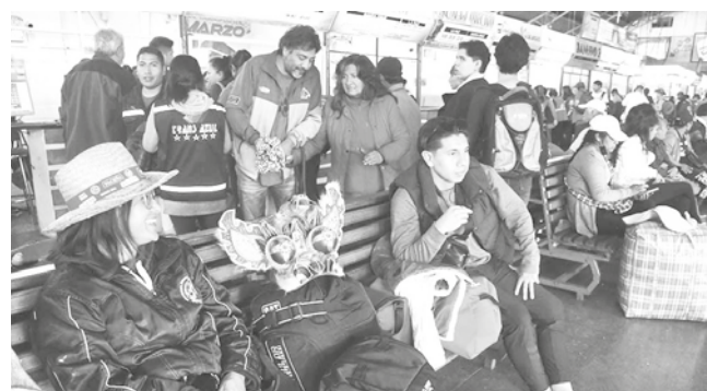
Pasajeros abarrotan la terminal de buses ayer. JOSÉ ROCHA

Viajes. La demanda aumentó en los últimos días. La ATT habilitó la línea 800-10-6000 para atender denuncias de costos excesivos