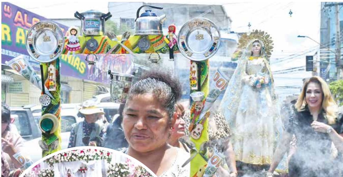
La procesión con la imagen de la Virgen de Lourdes en la ciudad. DANIEL JAMES

Datos. La devoción a la Virgen de Lourdes y la celebración con comida y música en los centros de abasto marcaron la antesala del Carnaval