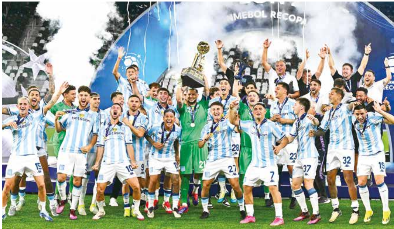
Jugadores de Racing festejan la corona de la Recopa Sudamericana, anoche en Río de Janeiro.

El conjunto argentino convirtió al arquero John en figura, quien ahogó el grito de gol en más de una oportunidad, como cuando desvió en dos oportunidades los remates