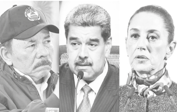
Ortega, Nicaragua; Maduro, Venezuela, y Sheinbaum, México, no estarán mañana en Montevideo.

“Debemos estar articulados para proponer una nueva esperanza al mundo que necesariamente se contrapondrá al miedo”, dijo en X Boric.