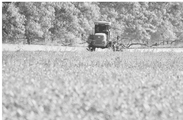
Cultivos de soya en el departamento de Santa Cruz.

tal cruceña. El viceministro de Políticas de Industrialización, Luis Siles, confirmó el avance, aunque advirtió que se ajustarán las normativas para priorizar a los productores primarios. El acuerdo busca desactivar un conflicto que mantenía en tensión al sector agrícola