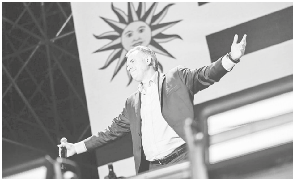
Yamandú Orsi, el tercer presidente izquierdista de Uruguay en los últimos 40 años. RRS5

La mayoría de los líderes izquierdistas, sin embargo, afrontan complejas situaciones internas y la izquierda podría perder poder en el próximo ciclo electoral re-