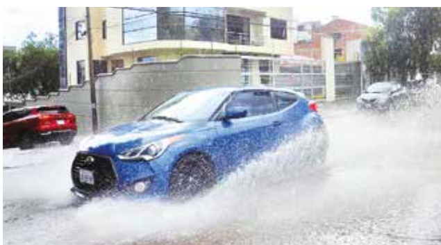
Las lluvias torrenciales en el centro de la ciudad.