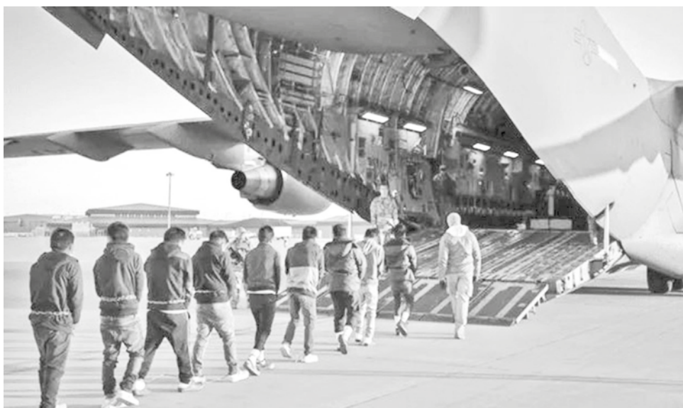
Las redadas y detenciones a inmigrantes se acentúan en EEUU.