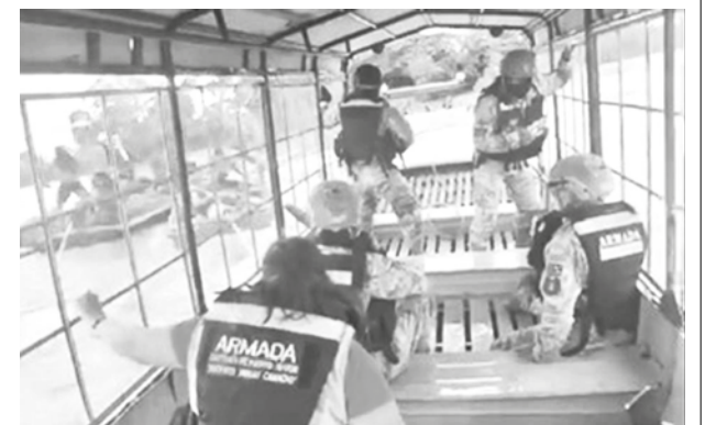
El ataque que sufrieron militares y gente de la ANH. ANH

Las autoridades condenaron la agresión y reafirmaron su compromiso de continuar con los operativos para hacer cumplir la normativa vigente. Asimismo, anunciaron que se iniciarán investigaciones para identificar y sancionar a los responsables del ataque.