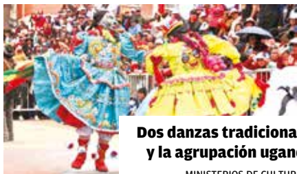
Dos danzas tradicionales en el Festival de Bandas y la agrupación ugandesa Nansana Dance Kids.

MINISTERIOS DE CULTURA Y VICEMINISTERIO DE TURISMO