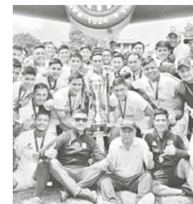
Festejo de Millonarios de Vinto, en la final 2024. AFC