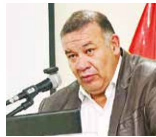
Humberto Arandía, director del INE, ayer. APG

dística (INE). Aunque esta cifra es inferior al 2,58% registrado en el segundo trimestre, representa una recuperación respecto al 1,31% del primer trimestre, evidenciando una reactivación progresiva de la economía.