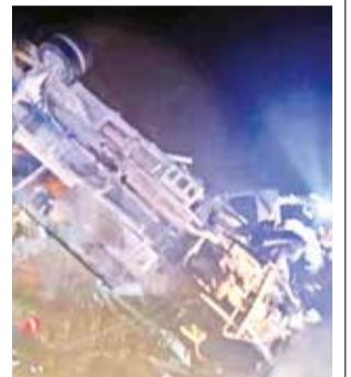
El vehículo que sufrió el accidente en Oruro.

Entre los fallecidos se encuentra el conductor del camión y dos niños. Los heridos fueron trasladados a diferentes centros de salud para recibir aten-