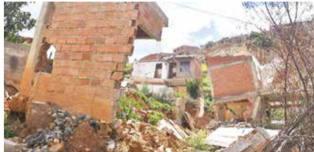
Las casas afectadas por los deslizamientos en Takoloma.

Si bien, al menos 400 familias fueron afectadas, es probable que en algunos ca-