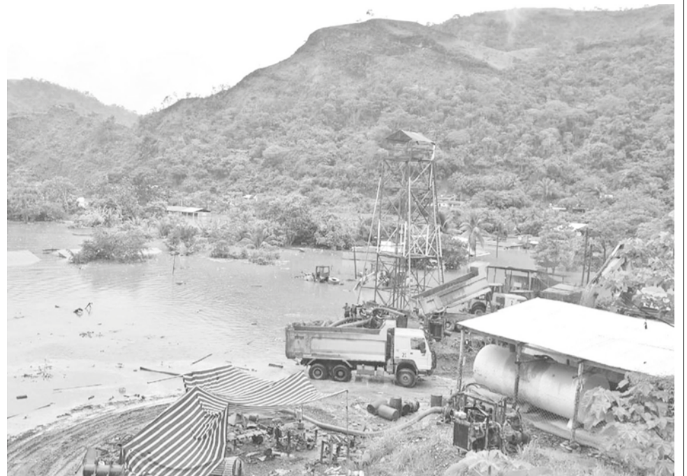
Actividad minera aurífera en Tipuani.