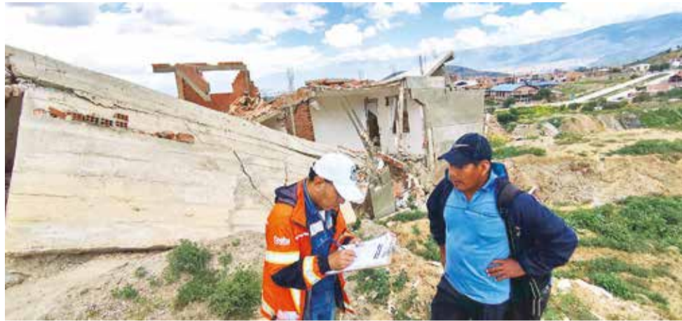
El relevamiento de datos de equipos de la Agencia Estatal de Vivienda.

miércoles se tendrá al menos el 50 por ciento de avance y se prevé concluir la próxima semana con el relevamiento.