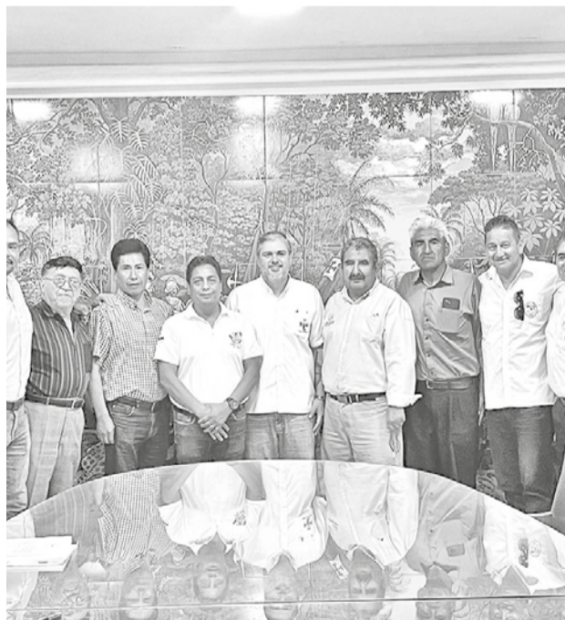
Cívicos del país reunidos en Santa Cruz, ayer.

Sobre la ley de litio, los cívicos determinaron exigir a la ALP el tratamiento inmediato de la norma que “duerme el sueño de los justos tanto en la Cámara de Senadores como de Diputados”, indicó Larach y añadió que exigen a los asambleístas el rechazo a los contratos de explotación del litio por “ser atentatorios