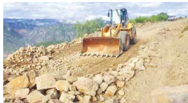
Los trabajos en una vía de la zona andina.

Perjuicios. La Alcaldía y la Gobernación limitan servicios por la escasez de diésel y gasolina. Varios equipos están parados