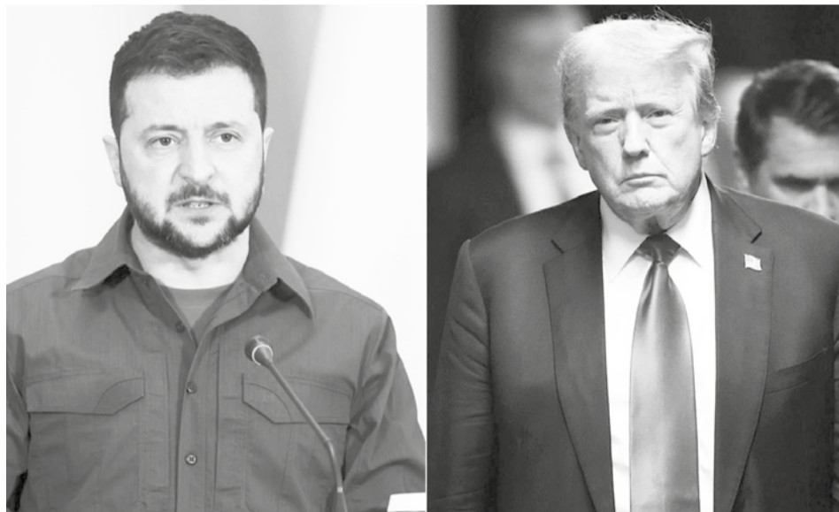
Los presidentes de Ucrania, Volodimir Zelenski, y de EEUU, Donald Trump.

Una de las cláusulas del acuerdo final prohíbe la transferencia de dinero del fondo a terceras partes sin el acuerdo de los dos países titulares.