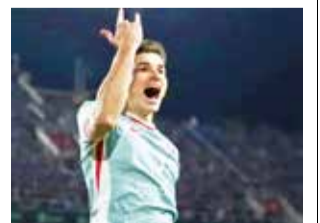
Festejo de Julián Álvarez, para Atlético Madrid.

lético anotaron Julián Álvarez (1'PT), Antoine Griezmann (6'PT), Marcos Llorente (39'ST) y Alexander Sorloth (48'ST).