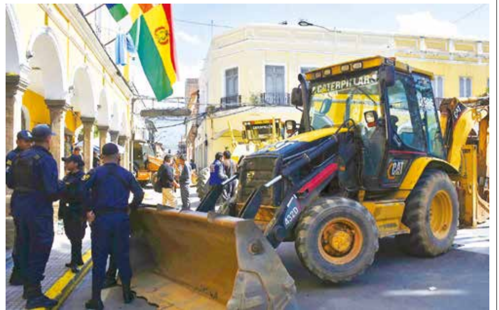
El bloqueo de afiliados de Casdeco en los accesos de la plaza 14 de Septiembre. JOSÉ ROCHA

presentantes de Casdeco, Jhonny Vallejo, dijo que la deuda es de 18 millones de bolivianos por la ejecución de varias obras en diferentes barrios y data desde 2021.