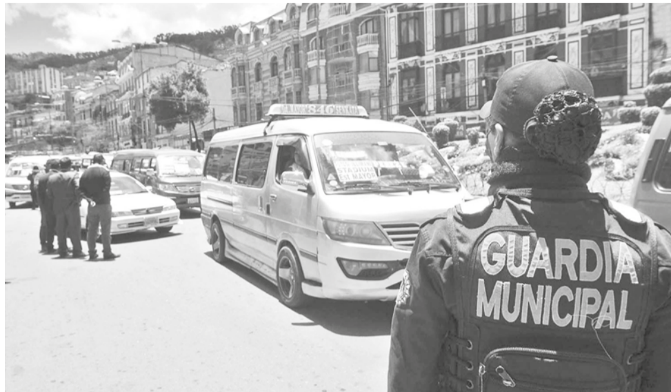
Choferes de La Paz van al paro de 48 horas.