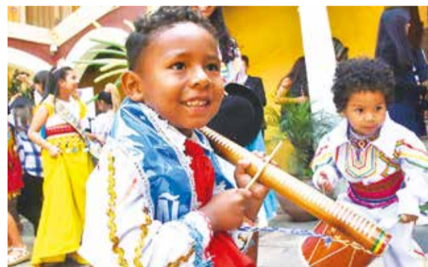
La presentación del Corso Infantil y de Mascotas.

Comentó que sólo se recibe el 50 por ciento de los 170 mil litros de carburantes que se requiere para atender a la población.