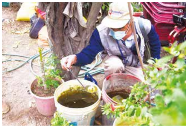
La destrucción de criaderos de Aedes aegypti. DANIEL JAMES

Aseveró que se realiza la vigilancia entomológica en diferentes municipios de Cocha-