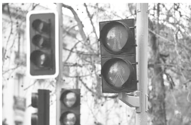
Semáforos apagados en una vía de Santiago, ayer.

El anuncio involucra al norte y sur de Chile, desde la región de Arica hasta la de Los Lagos, respectivamente, donde vive más del 90% de los