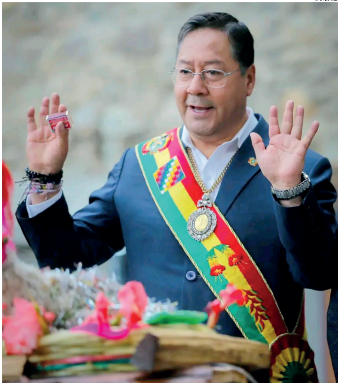
Arce será proclamado en abril y varias de sus organizaciones leales ya están buscando el binomio

Mencionó la industrialización, la diversificación productiva y la producción de biocombustibles como pilares de su administración, argumentando que su continuidad es clave para el desarrollo del país. "No podemos permitir que lo que estamos haciendo, quede trunco", sostuvo, aludiendo a la necesidad de consolidar su modelo económico y político. Uno de los ejemplos más claros es el del sector energético.