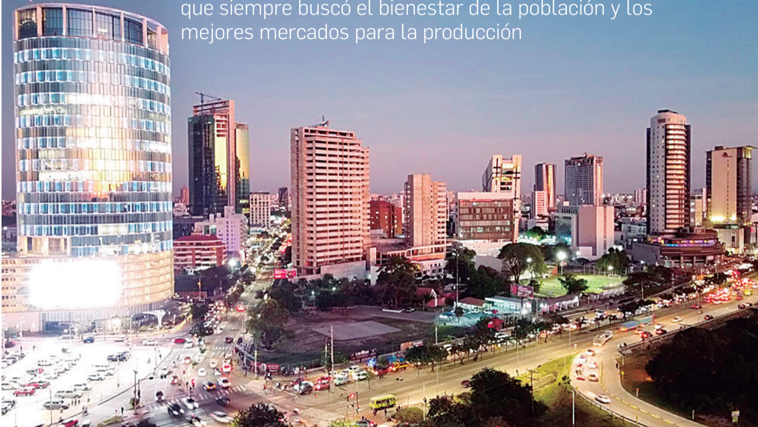
La capital cruceña es un centro de actividad empresarial que acoge a personas de todas las regiones del país y del mundo

Es la ciudad más poblada de Bolivia y la historia demuestra que siempre buscó el bienestar de la población y los mejores mercados para la producción