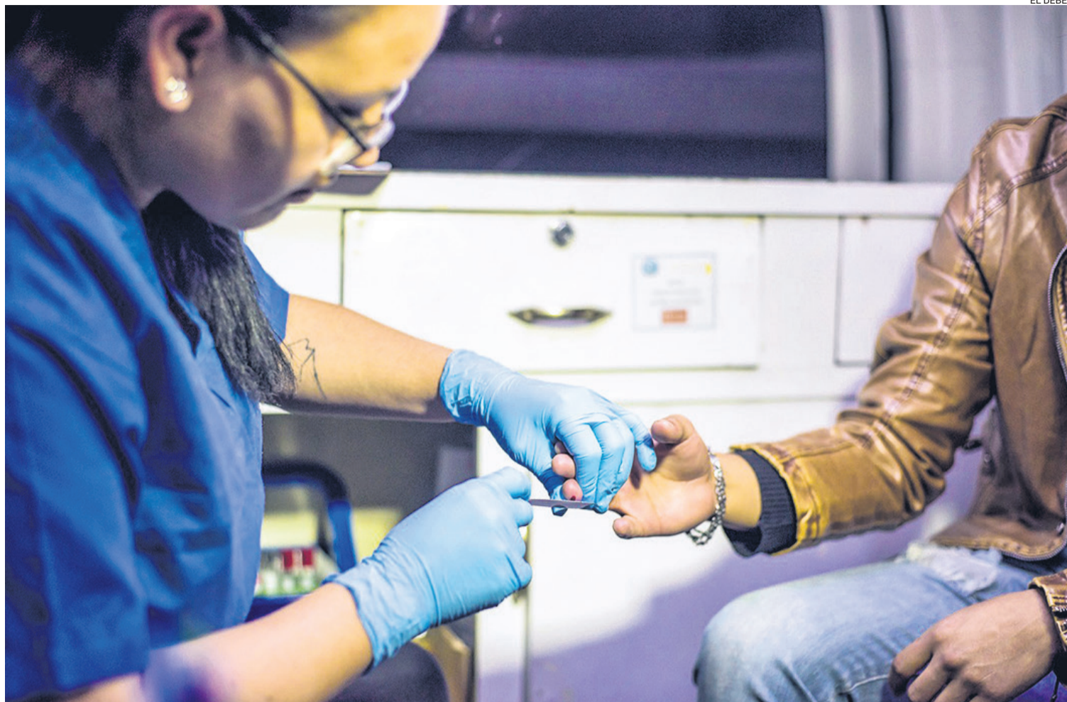
Según los datos, más del 90% de los casos de VIH se da por relaciones sexuales