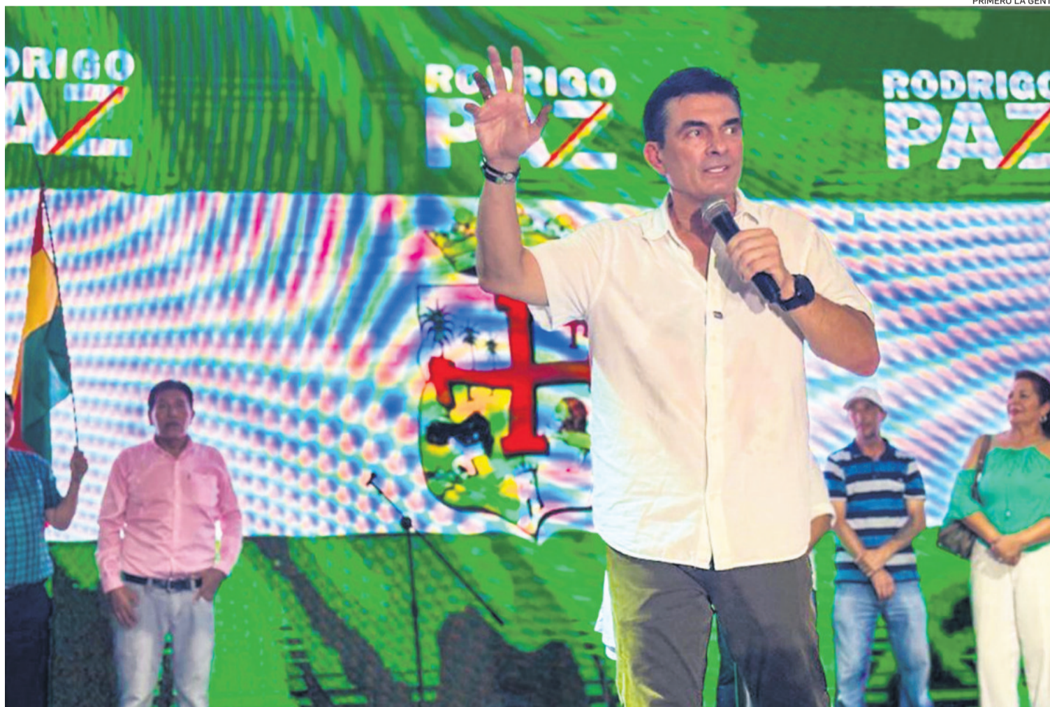
Rodrigo Paz Pereira fue proclamado como candidato presidencial en el Plan Tres Mil de Santa Cruz de la Sierra

Mientras, la alcaldesa Eva Copa aseguró ayer que primero “tendría que ver el programa” de gobierno que plantea Reyes Villa para luego decidir si aceptaría una eventual invitación a acompañarlo como su candidata a la Vicepresidencia. La autoridad acaba de recibir las credenciales de Morena, el partido político con el que terciará en las elecciones.