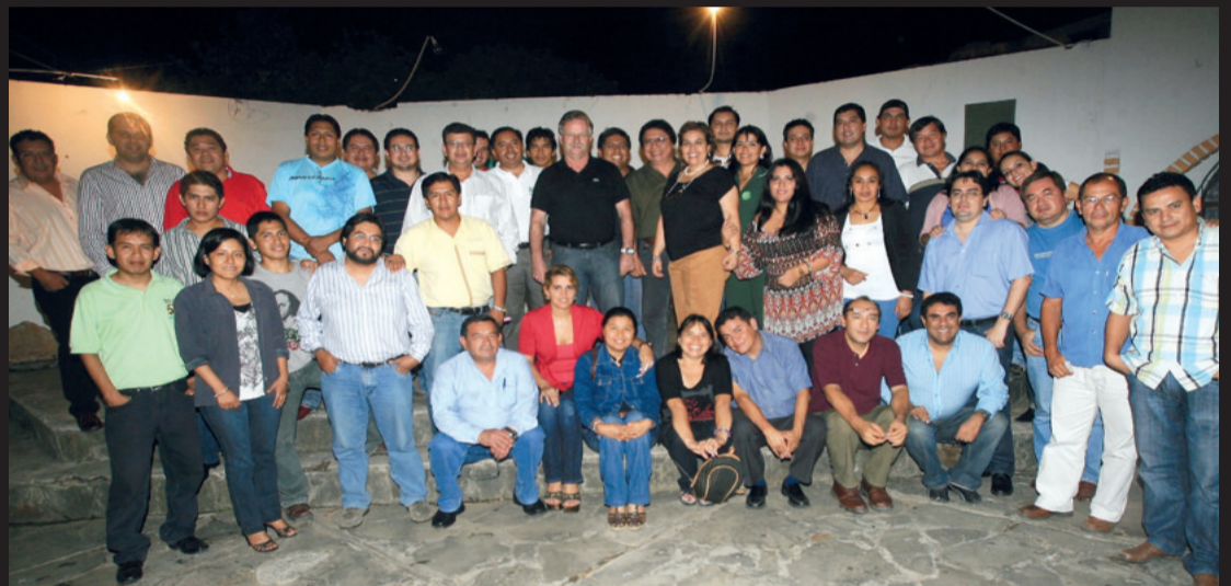
Junto a sus compañeros de EL DEBER, con quienes compartió gran parte de su trayectoria profesional