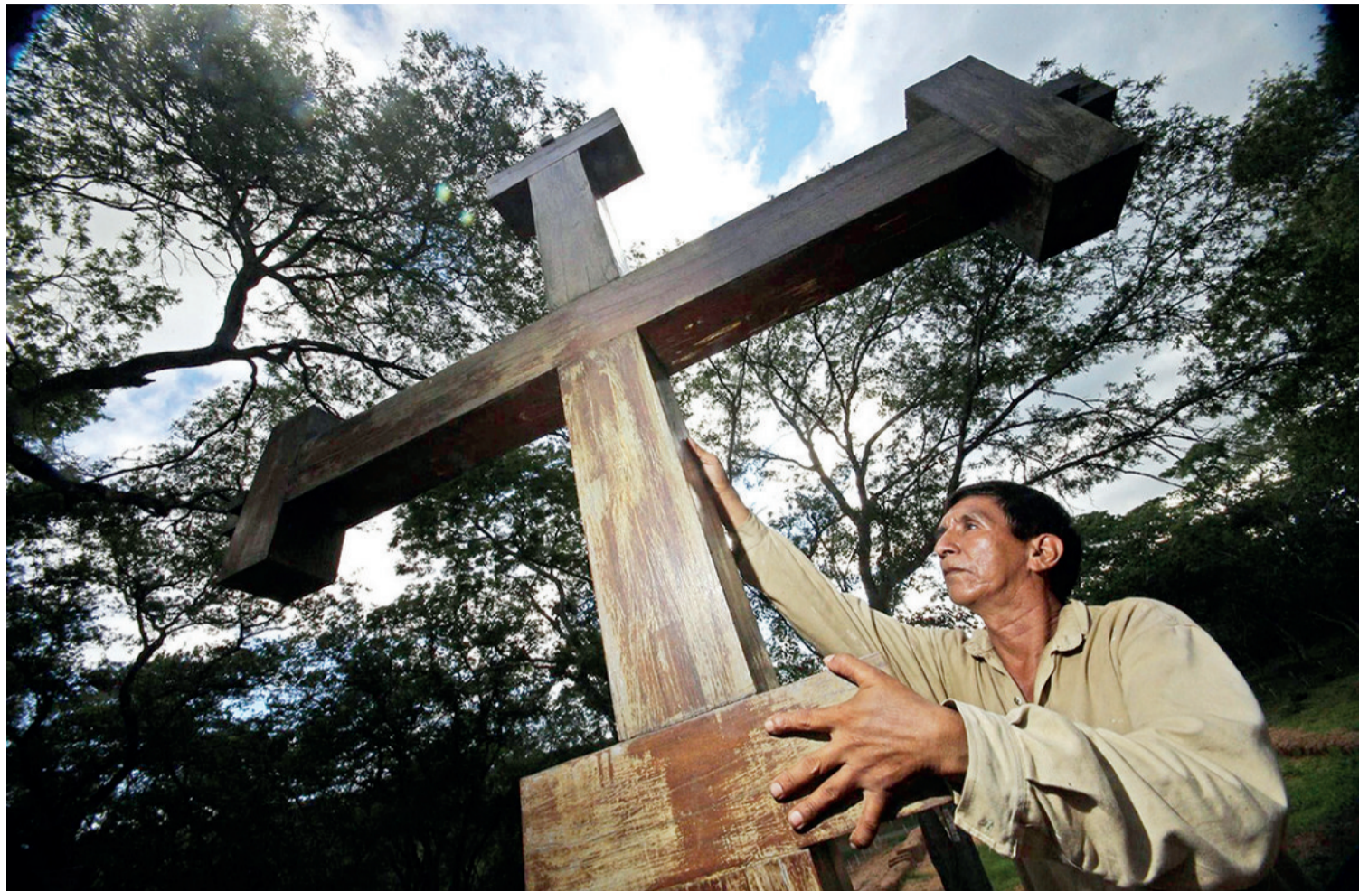
El cambio de mandato en el Comité coincide con el aniversario de Santa Cruz de la Sierra que se fundó originalmente en la Chiquitania

EL MANDATO DURARÁ DOS AÑOS Y DURARA HASTA EL 2027