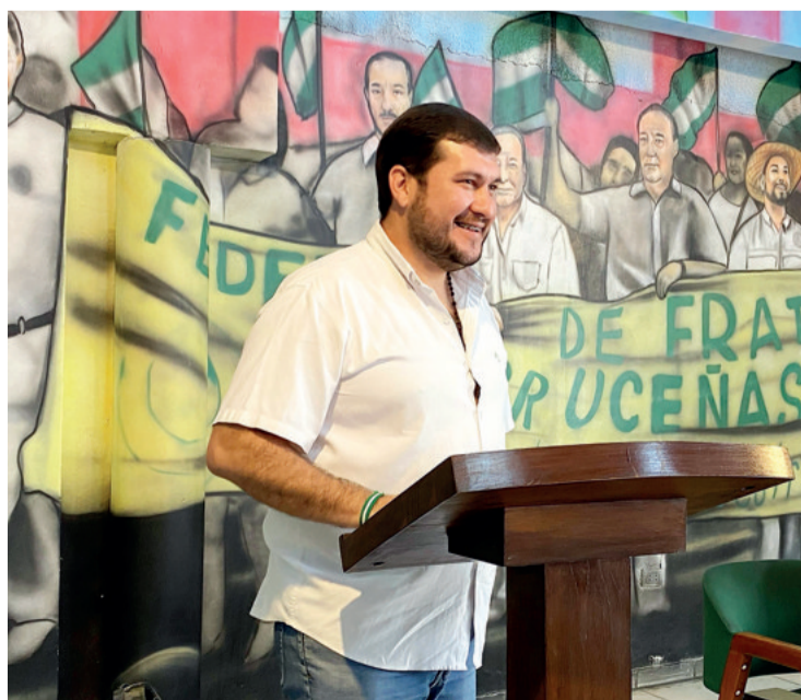
Fue parte de la directiva saliente, pero ahora jurará como timonel

El acto está previsto para las 19:00 de este miércoles en Fexpocruz