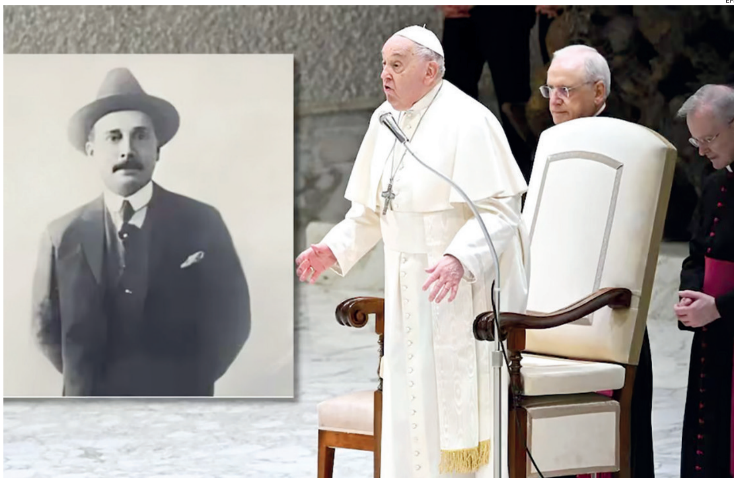
Foto de archivo del papa Francisco, en el inicio de la beatificación del venezolano que ayer fue canonizado

Cardenales, miembros de la curia romana y cientos de fieles continúan rezando cada noche el rosario en la Plaza de san Pedro del Vaticano que ayer fue presidida por el cardenal filipino Luis Anonio Tagle