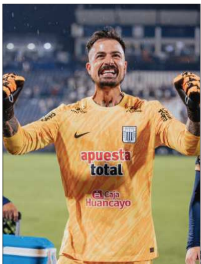
Viscarra y Cavani en sus equipos.