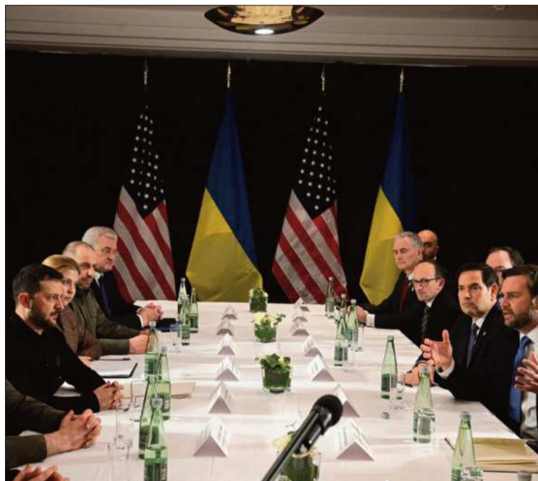
REUNIÓN. Vance y Zelenski analizaron varios escenarios de diálogo

Desde Varsovia, el secretario de Defensa de Estados Unidos, Pete Hegseth, preparó el terreno afirmando que "no se puede dar por sentado que la presencia de Estados Unidos durará para siempre". El ministro de Defensa alemán Boris Pistorius respondió que los europeos no pueden reemplazar militarmente el despliegue estadounidense de la noche a la mañana. El vicepresidente norteamericano trató de tranquilizar igualmente a Kiev, diciendo que Estados Unidos se tomará muy en serio su soberanía a la hora de hablar con Rusia, después de que altos funcionarios dijeran que Ucrania podría tener que renunciar a territorios ocupados por Rusia, empezando por Crimea.