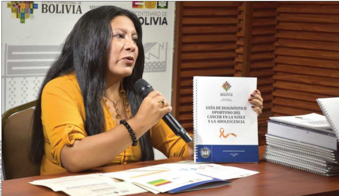
TRABAJO. Copana muestra la guía que será socializada en los próximos días entre el personal de salud.

mas, que afectan el sistema linfático encargado del sistema inmunitario; la retinoblastoma, que es un cáncer ocular que se desarrolla en la retina; y los tumores de Wilms, desarrollados en el riñón”.