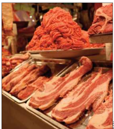
Venta de carne en un mercado.

Contracabol sostiene que la exportación de carne provoca el alza de precios