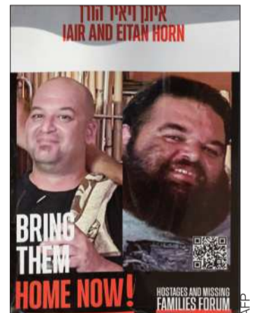
El canje se realizará hoy.

Uno de ellos está retenido por la Yihad Islámica, un aliado del movimiento islamista palestino Hamás y que también participó en el ataque del 7 de octubre de 2023 en Israel.