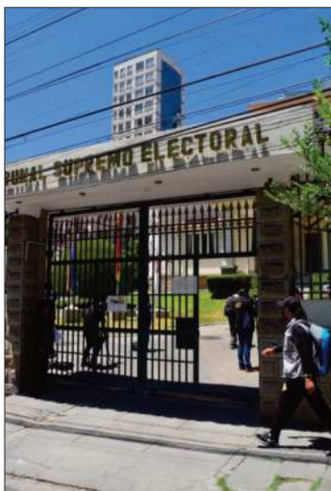
Tribunal Supremo Electoral.

El lunes, el TSE convocó al Encuentro Nacional por la Democracia, donde se espera definir éstas y otras medidas.