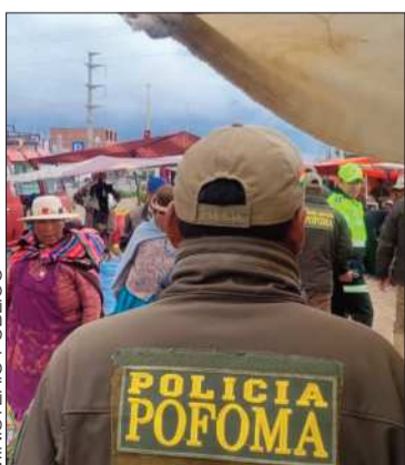
Se hizo un operativo en Tilata.

La Policía y el Ministerio Público realizaron una intervención en una feria