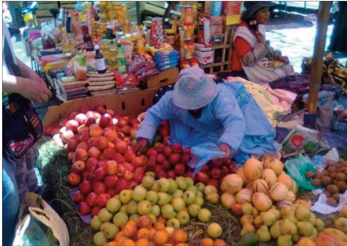
MERCADOS. El alza de precios de varios productos, sobre todo alimentos, elevó el índice de inflación.

“El resultado podría ser mayor especulación, ocultamiento de productos y suba de precios en la canasta básica familiar. Mientras se apliquen políticas económicas coyunturales y no estructurales, los resultados serán efímeros y hasta negativos”. El estudio también re-