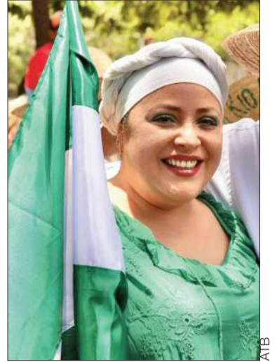
La ministra Prada en Santa Cruz.

Los movilizados por Morales no solo anunciaron la defensa de su líder. El jueves, uno de los dirigentes amenazó con colgar a los “infiltrados” en un palosanto, planta usada para torturas.