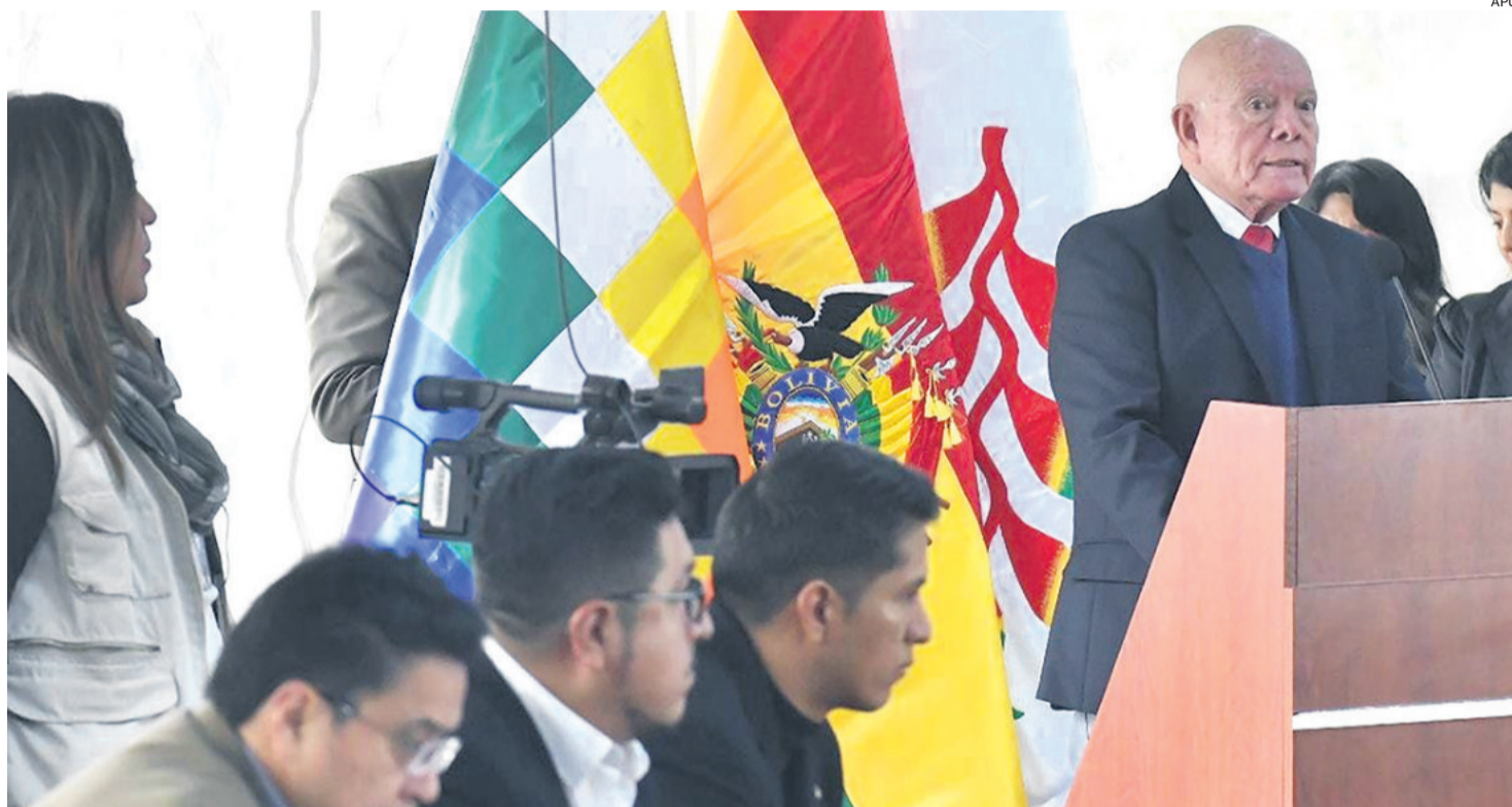
El presidente del TSE, Óscar Hassenteufel, inaugura el encuentro interinstitucional y multipartidario del 17 de febrero.

El Gobierno demanda al Legislativo que apruebe un crédito de Japón que será destinado para garantizar que se realicen las elecciones en el exterior