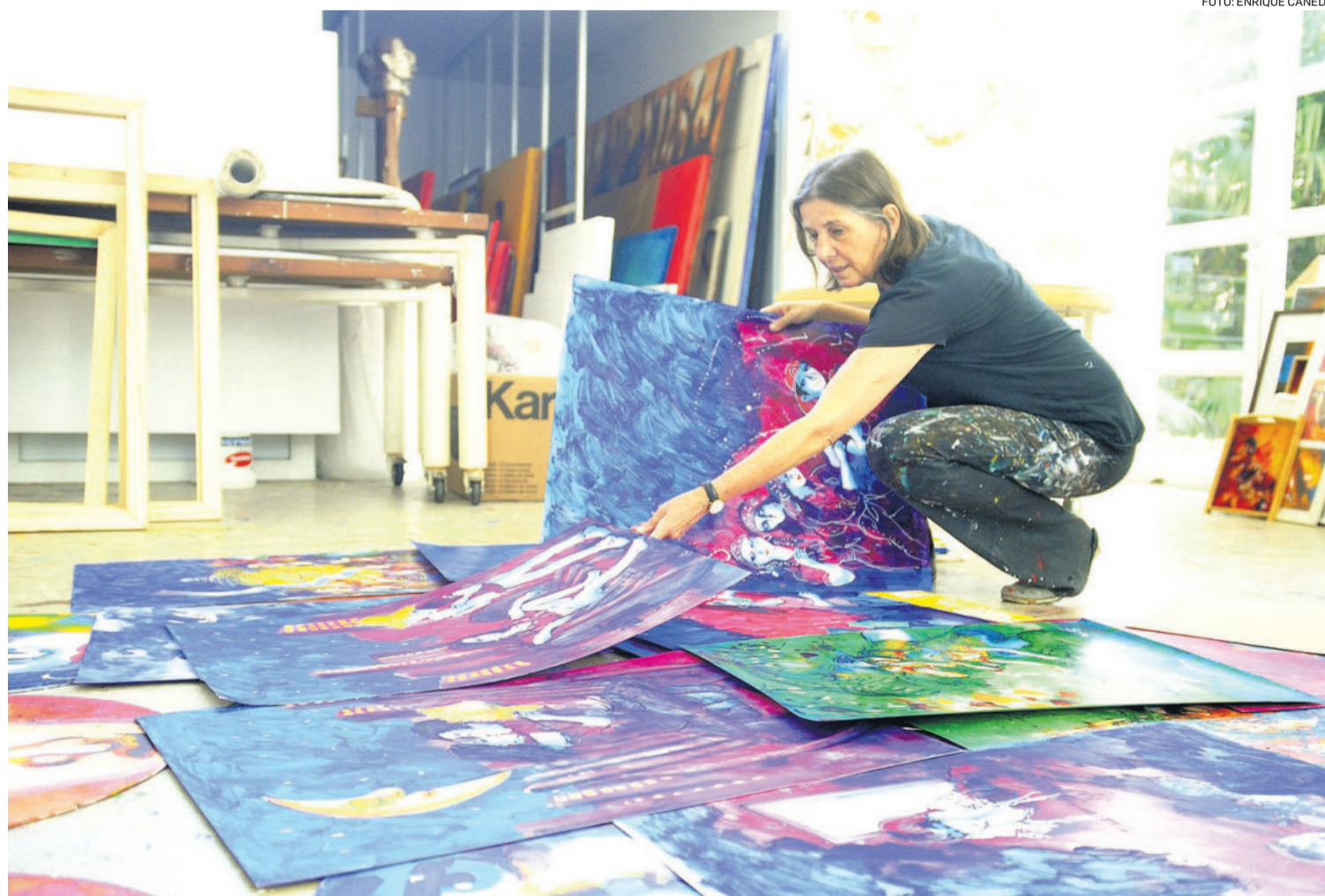
Artistas plásticos plasman su arte en un cuadro, que luego es trasladado a la impresión con la técnica del sublimado. Stih muestra sus obras.