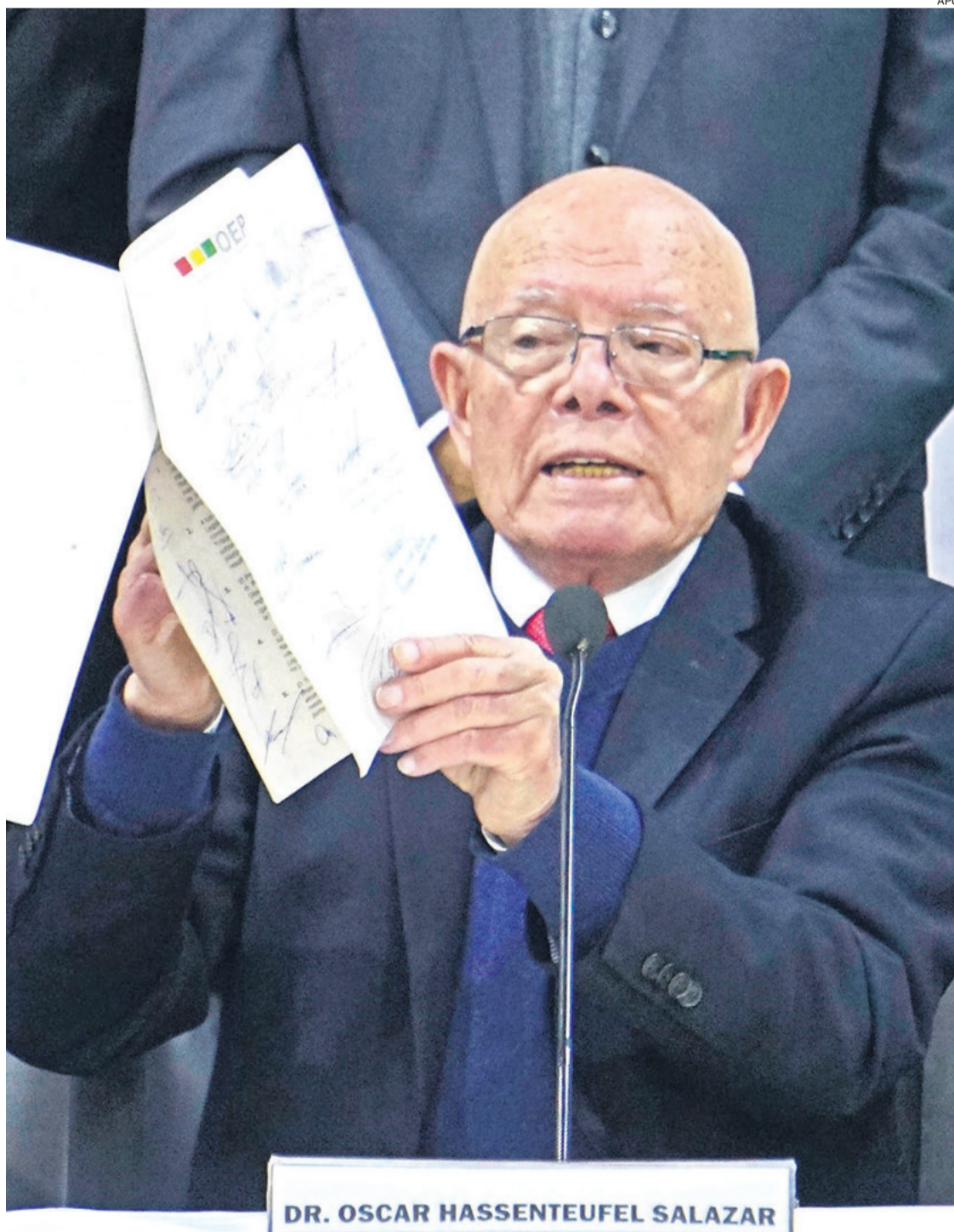
El presidente del TSE, Óscar Hassenteufel, muestra el documento suscrito en la cumbre del 17 de febrero

El registro electoral ha estado en el centro de la atención pública desde 2019 cuando hubo la “manipulación dolosa” a los registros electorales. Las fuerzas políticas y precandidatos exigen que este registro sea lo más confiable posible