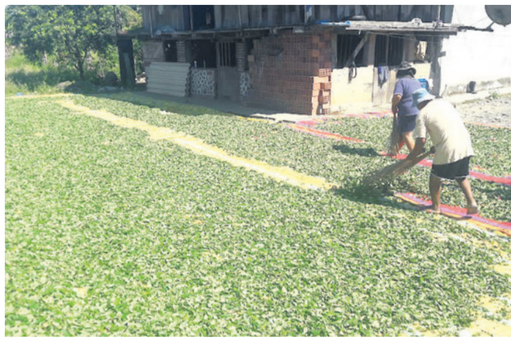
Las plantaciones de coca se incrementaron en la gestión 2023

de las campañas de erradicación, que han logrado eliminar más de 33.000 hectáreas entre 2021 y 2023, el cultivo de coca sigue superando los límites legales establecidos por la ley.