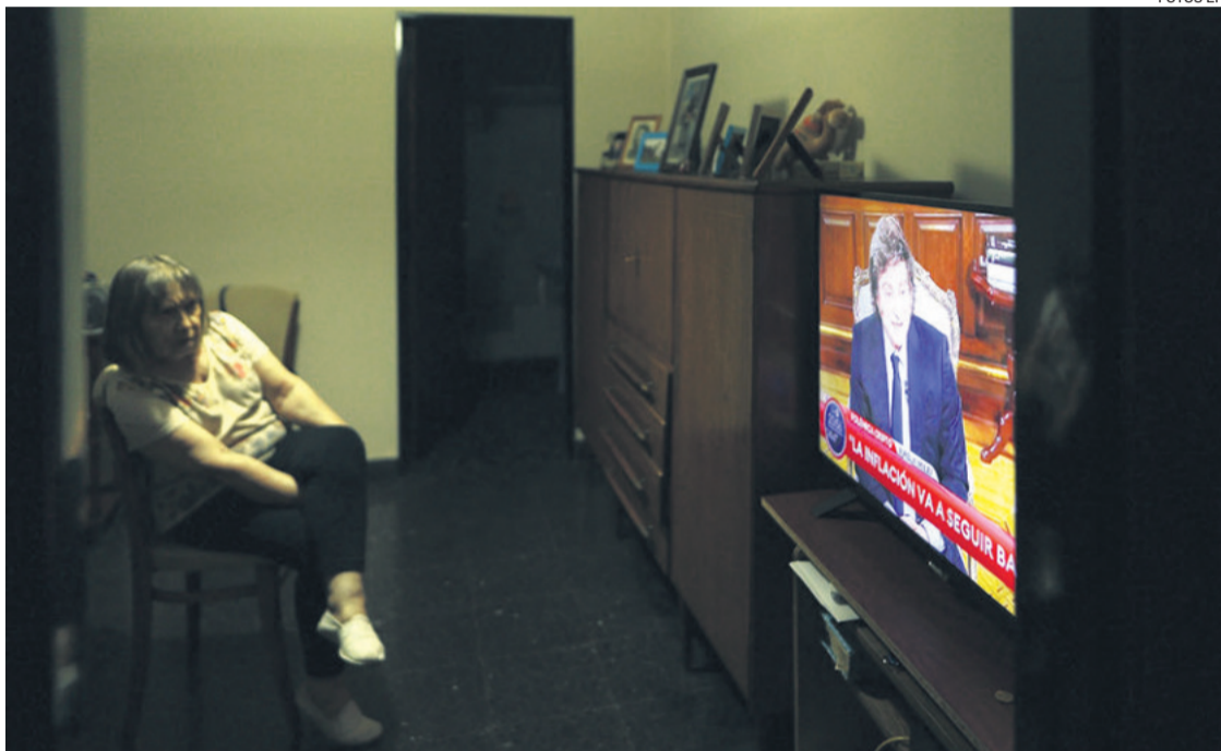
Una mujer observaba anoche, en su televisor, una entrevista al presidente argentino Javier Milei

Adorni se refirió además al rol de la Unidad de Tareas de Investigación (UTI), creada por el presidente "a los efectos de iniciar una investigación" sobre el caso $LIBRA: "Lo que va a hacer la UTI es recolectar la información y presentarla ante la Justicia, no va a investigar. Quien en todo caso investiga a los funcionarios es la