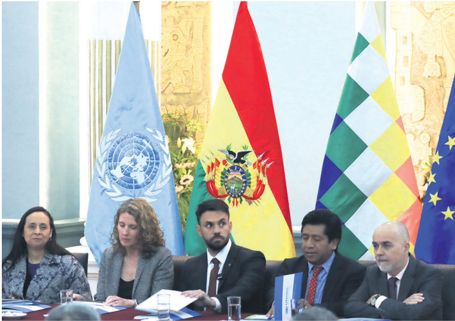
La Unodc presentó ayer el informe de cultivos de hoja de la gestión 2023 en instalaciones de la Cancillería. Existe aumento en las estadísticas