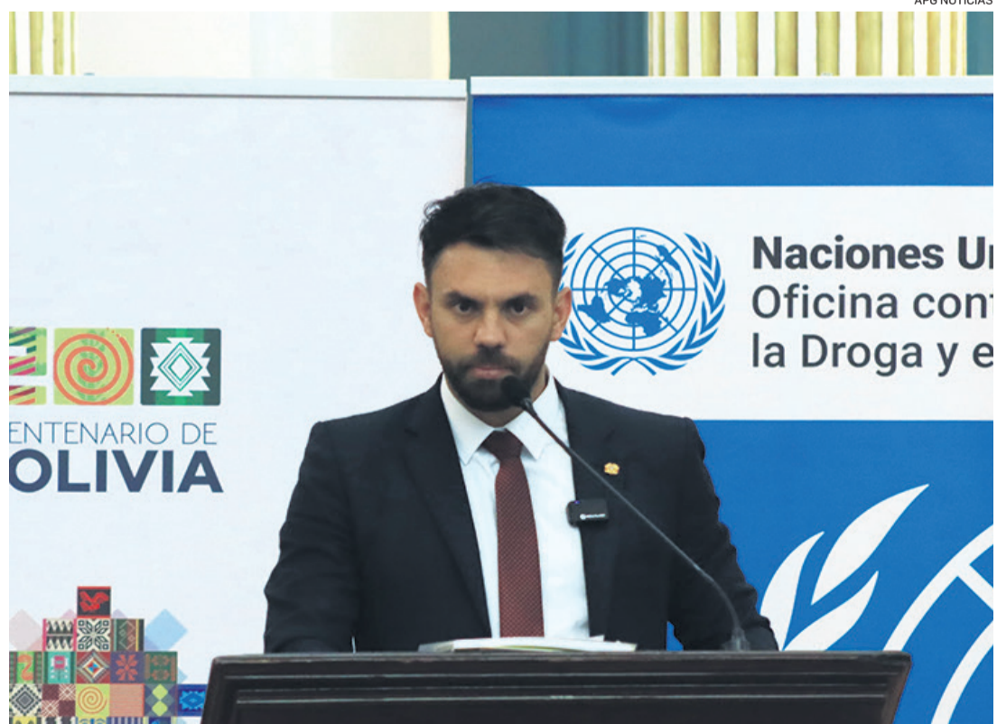
El ministro Eduardo Del Castillo presentó algunos datos del informe de monitoreo de cultivos de coca

La autoridad, que dijo que hoy se presentará este informe, dijo que estos informes servirán para planificar y ejecutar la erradicación de la hoja de coca destinando los mejores cuadros.