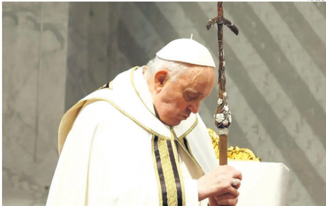
El papa Francisco en una foto de archivo del año pasado durante una celebración eucarística en Roma

destaca que "los exámenes de laboratorio, las radiografías de tórax y las condiciones clínicas continúan presentando un cuadro complejo" para Francisco, que deberá mantener el "reposo absoluto" que ya le prescribieron los médicos hace dos días.