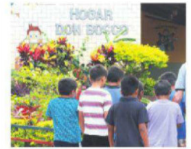
Niños en el Hogar Don Bosco

de más del 30%. El parque Amboró y el Tipnis sobresalen. El Gobierno dice que las plantaciones disminuyeron en 2024. A2-3