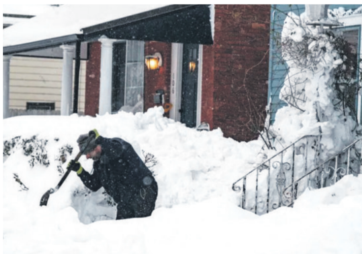
Un hombre retira nieve de la entrada a su domicilio en Louisville

El viernes pasado el gobernador declaró el estado de emergencia y el sábado solicitó al presidente, Donald Trump, la declaración de emergencia por desastre natural