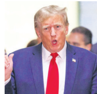
El mandatario estadounidense

Por esta razón, el mandatario ha recibido múltiples denuncias en Argentina e incluso en Estados Unidos, además de un pedido de juicio político por parte de diputados de la oposición.