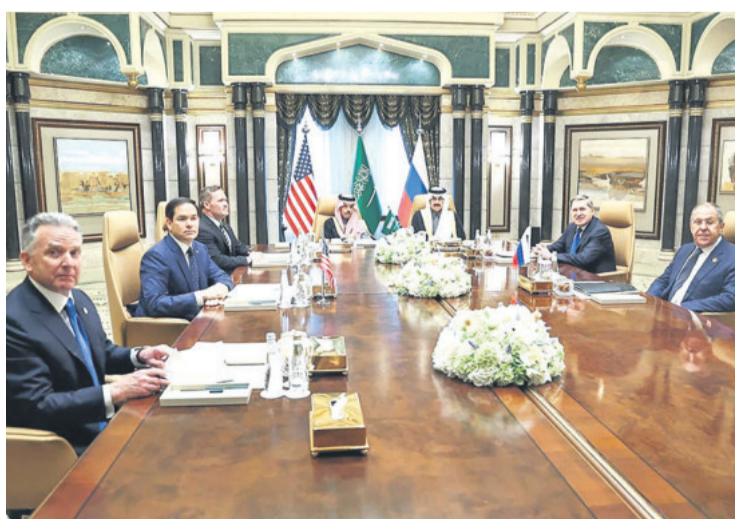
Las delegaciones de EEUU (izq.) y de Rusia en su reunión en Riad

El encuentro fue valorado por ambas partes de "positivo" y se