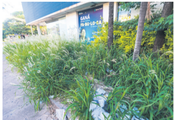
La maleza cubre los alrededores de estas infraestructuras, que antes servían para atender a los clientes

Hasta fines de 2022, la entidad operó con más de 684 puntos de atención en 7 ciudades, la mitad de ellos estaban en Santa Cruz, Potosí y Oruro