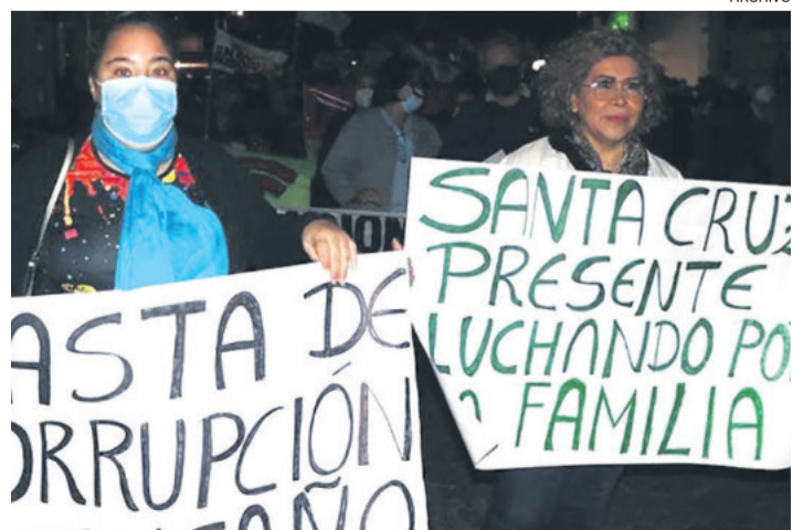
La ciudadanía protesta contra los actos de corrupción pública.

El puntaje más alto que ha tenido Bolivia en el IPC en la última década fue 35 puntos en 2014, y el año pasado repitió la puntuación de 29 obtenida en 2018.