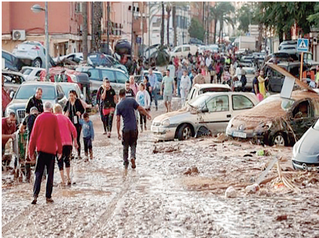
Las lluvias del 29 de octubre del año pasado provocaron inundaciones, principalmente en Valencia

en una situación de irregularidad sobrevenida.