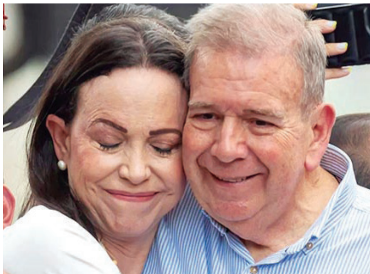
Los opositores venezolanos Corina Machado y Edmundo González

En respuesta al premio, González lo agradeció y sostuvo que "la lucha por la democracia también lo es por los derechos humanos