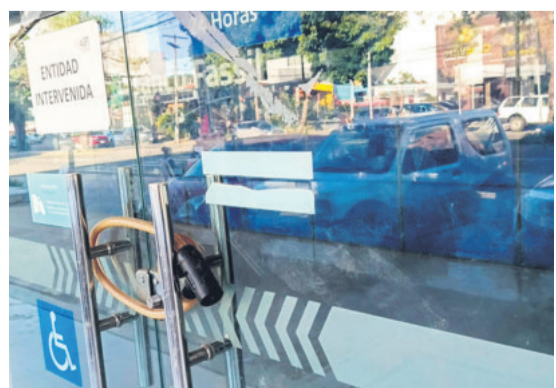
“ENTIDAD INTERVENIDA” El aviso ya no informa nada. El banco fue cerrado en abril de 2023 y desde entonces, las sucursales están cerradas