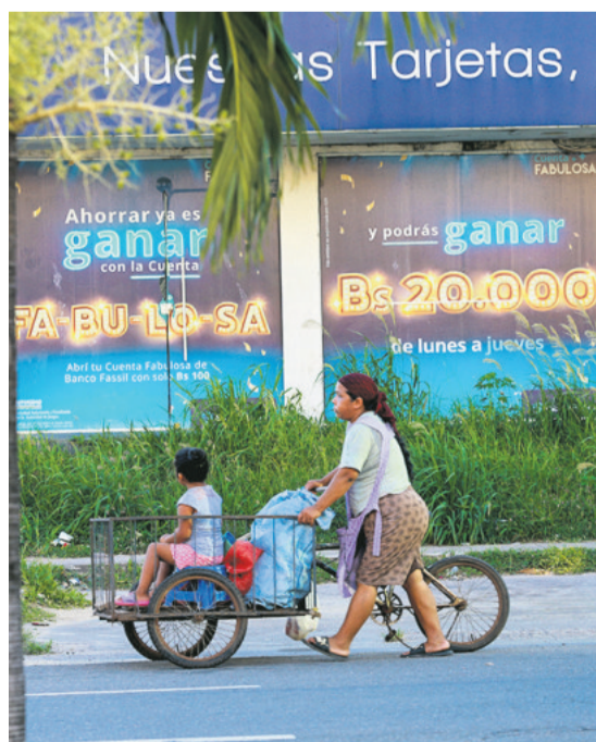
HACE SOLO DOS AÑOS En 2023, justo en estas fechas, las promociones y premios de Fassil estaban entre las más atractivas del mercado