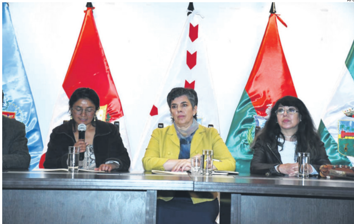
Las personalidades que enviaron el pedido de apertura al bloque de unidad de la oposición.