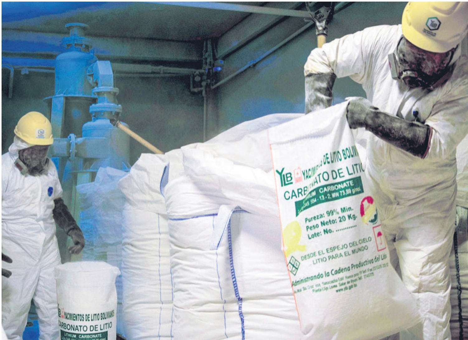
Desde hace más de una década el país intenta, sin éxito, desarrollar la industria de litio. No lo logra pese a tener una de las mayores reservas