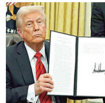
El presidente Donald Trump

La misión de la OEA señaló que los datos de su conteo rápido coinciden con los resultados oficiales parciales presentados por el CNE.