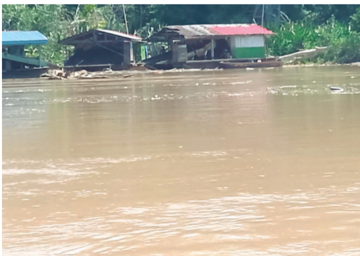
La imagen de los mineros fue tomada en diciembre

Entre los principales cuestionamientos, exigieron la elección del nuevo director de esa área