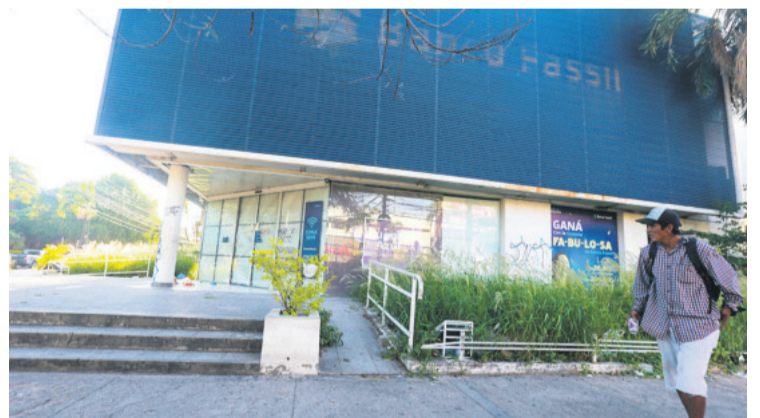
MATERIALES DE PRIMERA Los pasamanos de aluminio rodean a esta sucursal, aunque en varios sectores esa estructura no está completa. El deterioro es gradual