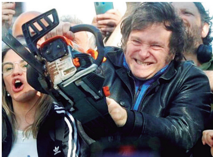
El gobierno de Milei inaugura la "Motosierra 2.0"

"El Decreto 70/25, con firmas de Javier Milei y de (el ministro de Economía) Luis Caputo inaugura una serie de medidas que dimos en llamar la 'Motosierra 2.0', anunció Sturzenegger a través de su perfil de la red social X, donde explicó que esta segunda etapa de los recortes impulsados por el Ejecutivo "consiste, ni más ni menos, en repasar la utilidad de cada área del Estado para discontinuar