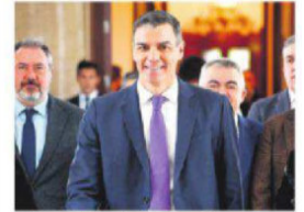
El presidente del gobierno español

tarias del desarrollo de la industria del litio en Bolivia. Además, habrá que pagar intereses y compensación por inflación. A2-3