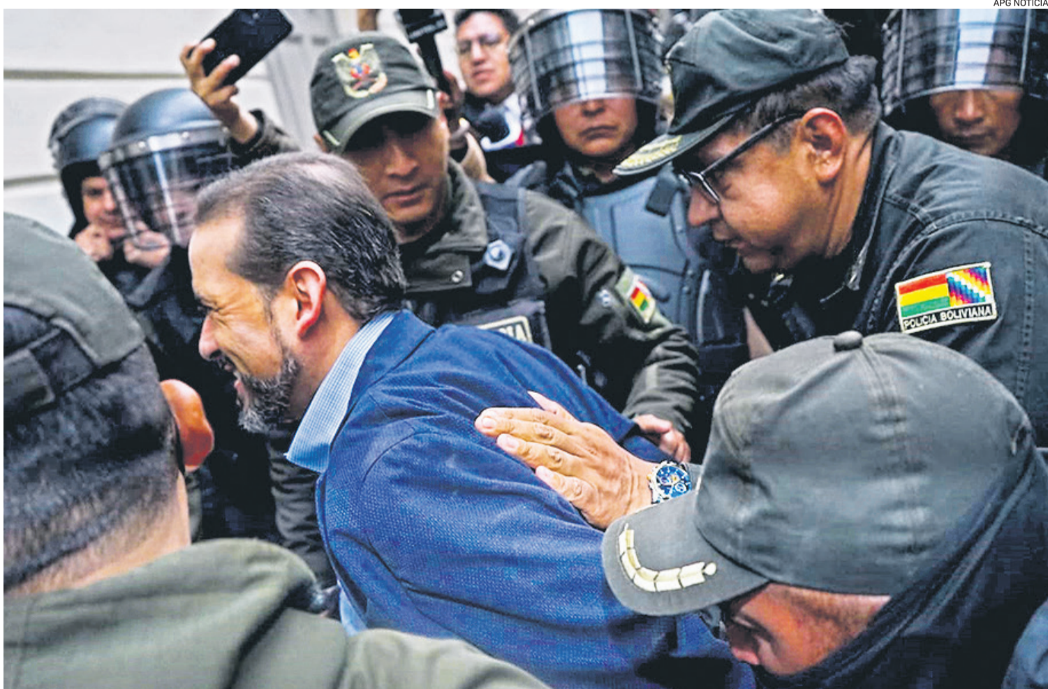
La policía tomó medidas extraordinarias para custodiar al gobernador de Santa Cruz que está detenido en Chonchocoro desde diciembre de 2022

Durante el primer día de audiencia, el gobernador se reunió unos minutos con toda su familia después de dos años.