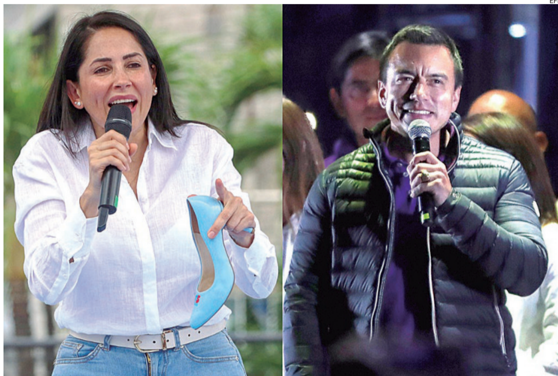
La candidata por el correísmo, Luisa González, y el presidente y candidato a la reelección, Daniel Noboa

Escrutado el 96,6 % de las actas, Noboa tiene el 44,16 % de los votos y González, el 43,94 %, y cuando aún falta por concluir