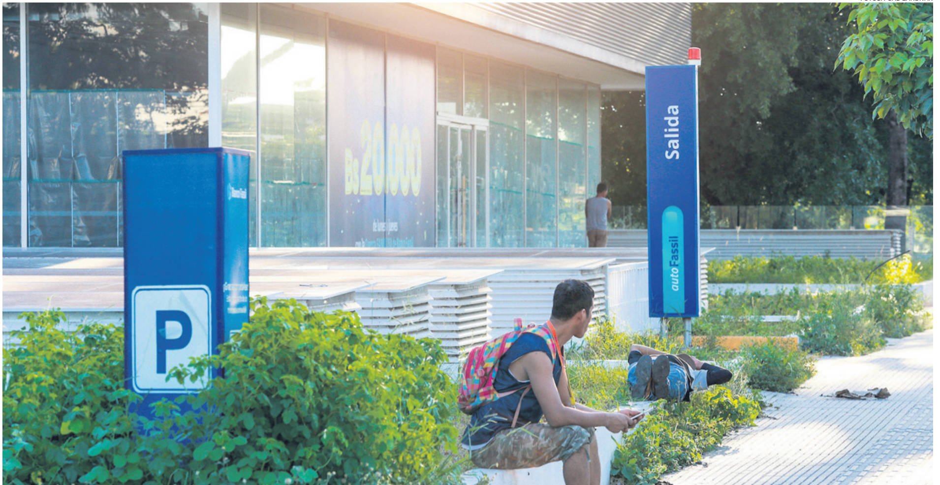
ENTRE LOS MATORRALES Y EL OLVIDO. La sede del banco Fassil, que está cerca del Tribunal Electoral Departamental de Santa Cruz, está siendo invadida por personas en situación de calle