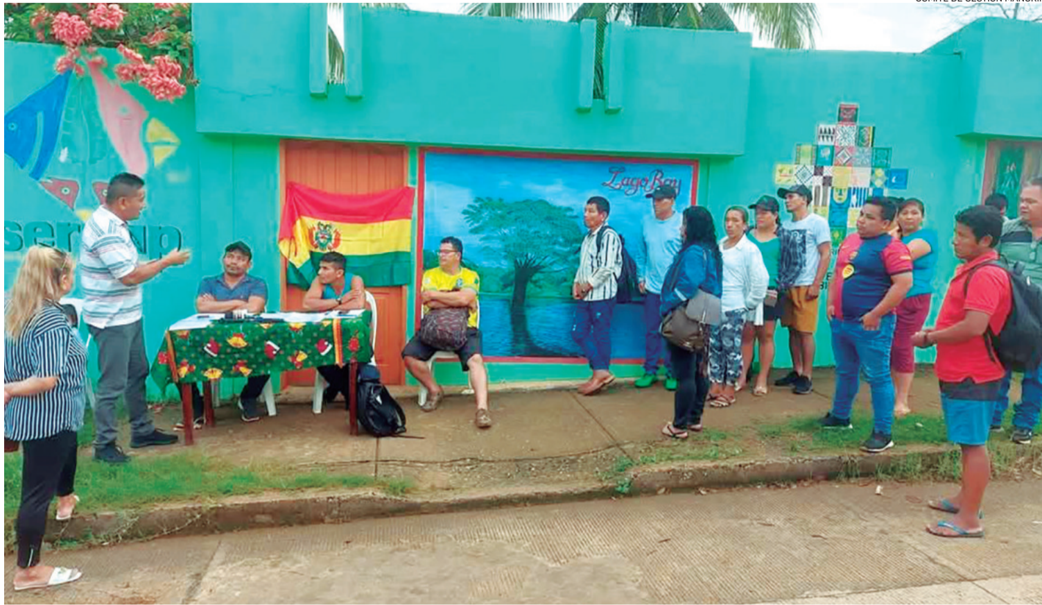
COMITÉ DE GESTIÓN MANURIPÍ

Más de medio centenar de personas se trasladó hasta Cobija para la toma pacífica del Sernap en la capital pandina