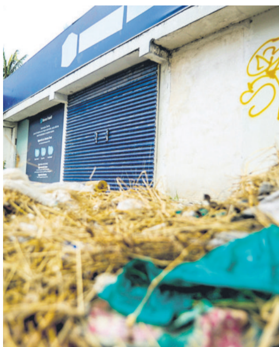
BASURA Y HASTA HECES Las sucursales de la entidad financiera que lucían impecables, hoy anidan desperdicios de todo tipo