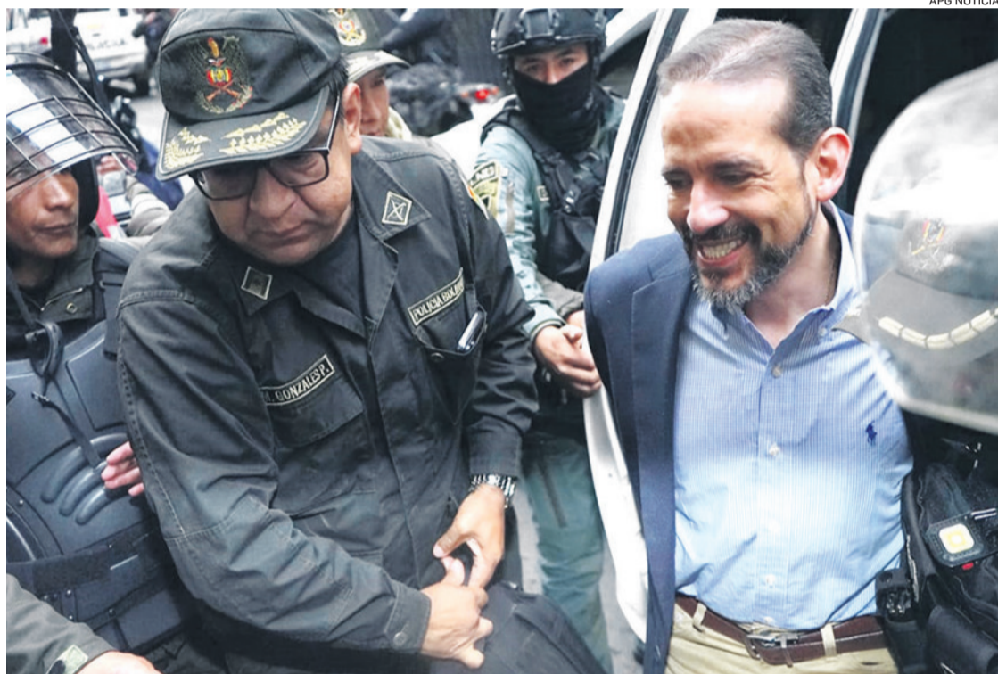
El gobernador Camacho ingresa al edificio del Tribunal Departamental de Justicia de La Paz.

A pesar de las dificultades del proceso, la jornada estuvo marcada por un emotivo momento para Camacho, quien fue trasladado desde el penal de Chonchocoro hasta el Tribunal Departamental de Justicia de La Paz. Sus familiares viajaron desde Santa Cruz y se reencontraron con él en el tribunal. En redes sociales, el gobernador compartió fotografías del encuentro y expresó su gratitud: