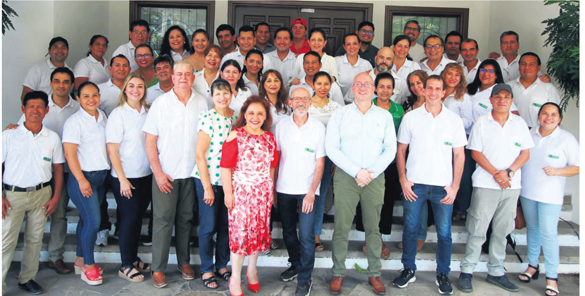
Parte del staff de esta casa periodística que ha visto muchos amaneceres, comprometidos con la verdad en todas las estaciones de este oficio, a veces nubladas y otras soleadas.