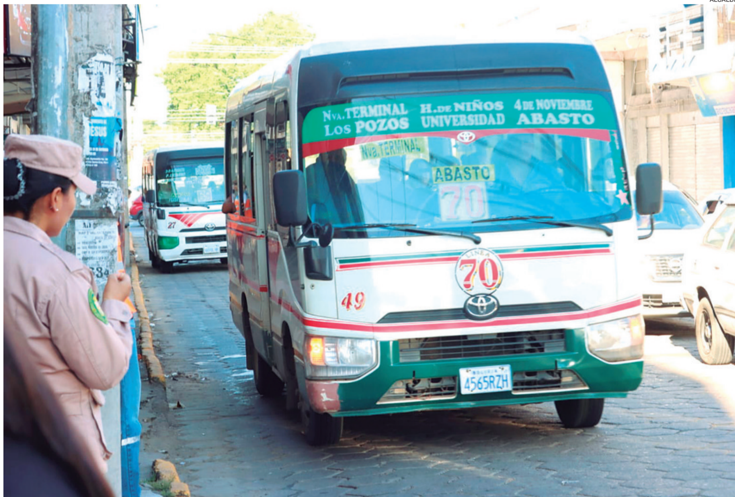
Personal del Municipio se encuentra controlando los canales planificados en el ordenamiento del transporte público desde hace unos días

Vecinos de esa plaza lamentaron que se plantee el paso de buses por una plaza reconocida internacionalmente como el centro de Sudamérica. Los emprendedores de la calle Florida también expresaron su molestia, dicen que la medida afectará sus negocios al no haber parqueos alternativos ante la llegada de micros.