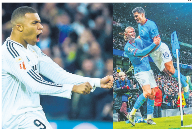
Los goles de Mbappé y Haaland pueden ser claves para decantar la eliminatoria

Los 'citizen' afrontan esta eliminatoria en uno de sus momentos más difíciles de la temporada, con Pep Guardiola cuestionado y con un juego inconsistente. El 5-1 encajado ante el Arsenal en el último partido de la Premier League abrió muchas dudas.