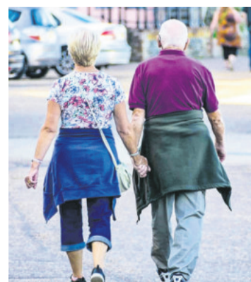
Escenario. Un cambio no es el fin

Chow asesora a otros ejecutivos en sus reconversiones, que según ella pueden ser profundamente