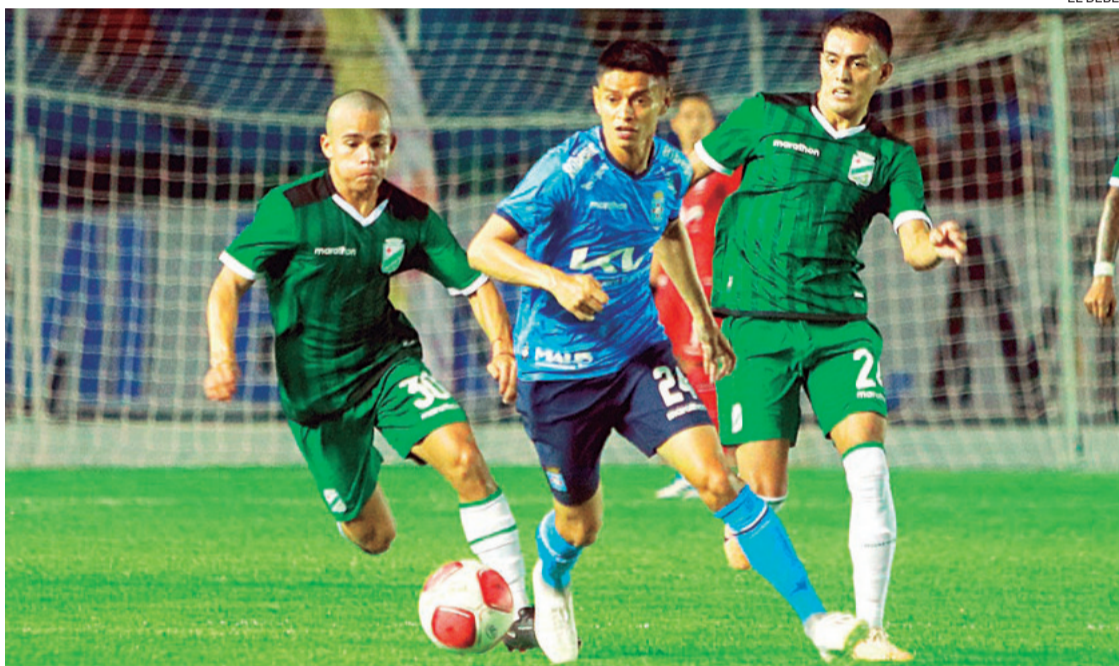
El torneo de verano se iniciará este miércoles con los partidos de play-off antes de ingresar a la ronda de duelos regionalizados

El torneo de Verano es una propuesta emanada desde la FBF para mantener los equipos profesionales en activo mientras se define el inicio oficial del campeonato. En días pasados, el ti-