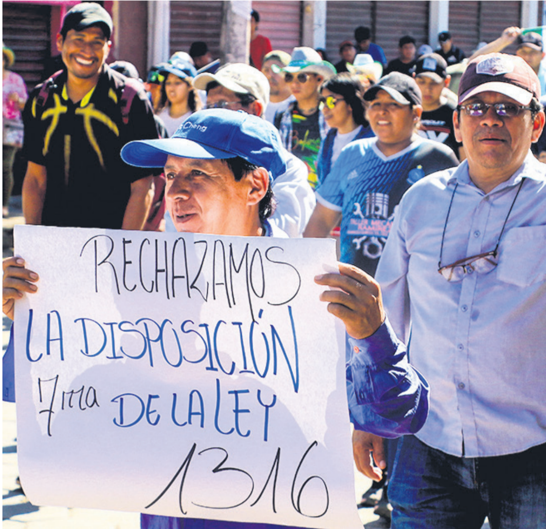
En Santa Cruz de la Sierra, Trinidad y Cochabamba, los sectores se movilizaron con letreros y carteles.