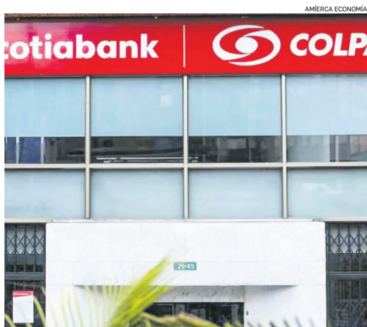
Liquidez. Advisors logran recursos para potenciar su presencia en la región