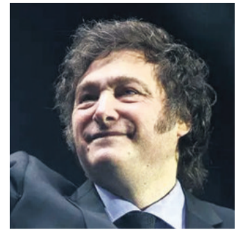
El mandatario argentino

Los cuerpos de socorro continúan con las labores de rescate, informaron las autoridades.