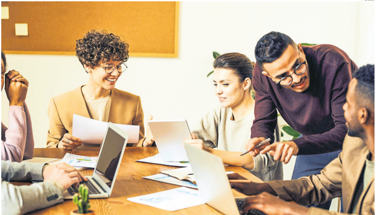
Equipo. Reconocer el logro de los colaboradores genera confianza y un clima laboral más ameno que mejora la productividad y las innovaciones

No se trata de simplemente "retener" al talento. "Lo ideal es crear un ambiente tan positivo y un sentido de pertenencia tan genuino que el trabajador elija quedarse por voluntad propia", explicó Pozzi. Para ello, reco-