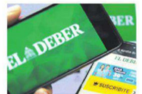
Ahora es una multimedia

medida. Los contratos sobre litio deben ser aprobados por senadores y la oposición asegura que hará cambios. A4-B