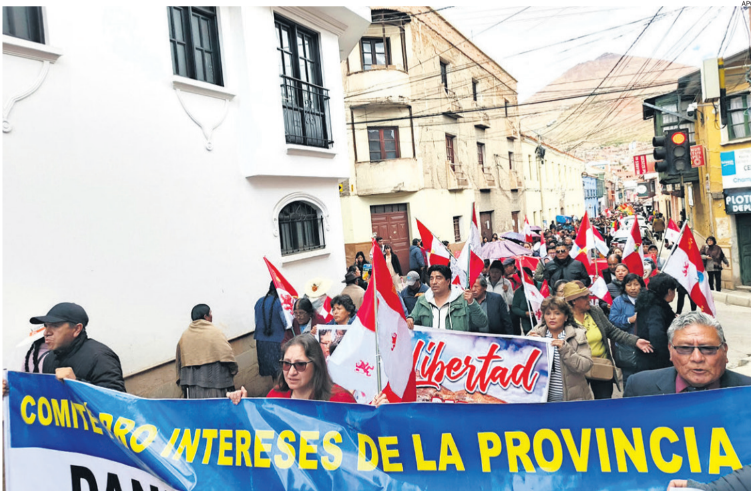
Organizaciones sociales de todo el departamento de Potosí, realizan una marcha de protesta en defensa del litio del Salar de Uyuni.

En la noche, un gran número de residentes potosinos en La Paz realizaron otra protesta frente a la Vicepresidencia.