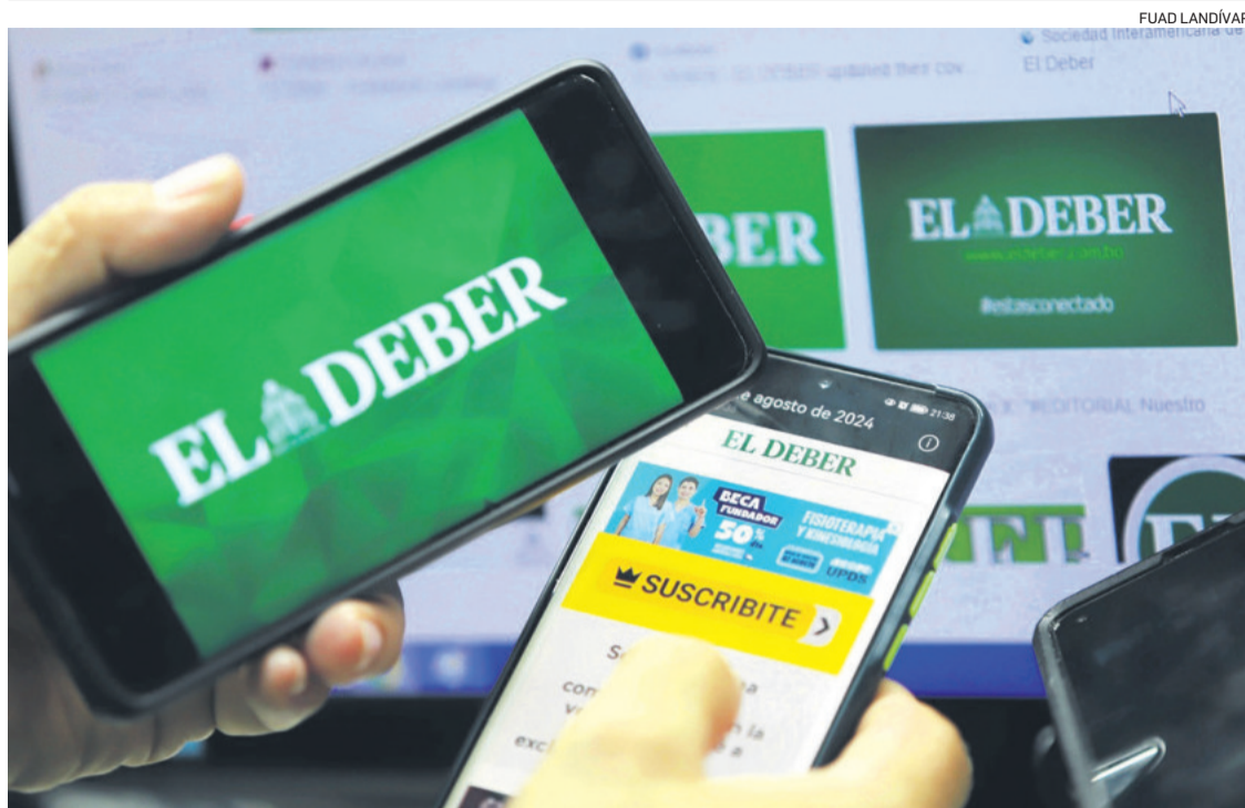
EL DEBER fue el primer medio de Bolivia en migrar a lo digital y tiene presencia en todas las redes sociales.