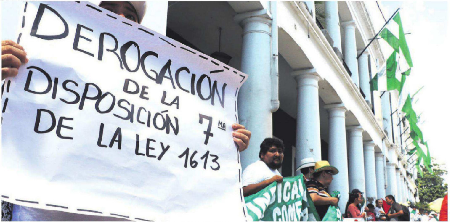
MANIFESTACIONES. Comerciantes, empresarios, transportistas y cívicos hicieron marchas y protestaron frente a instituciones estatales en la jornada de paro

EN LA CALLE. HUBO PARO Y MARCHAS MULTISECTORIALES A ESCALA NACIONAL