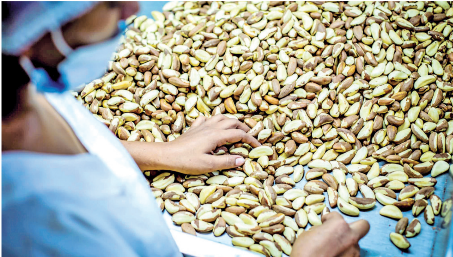
Castaña. Es el segundo producto más exportado a EEUU. Sin embargo, Perú lo exporta a mejores precios, gracias a el TLC e, incluso importa desde Bolivia

El experto aclaró que el cálculo de $us 3,50 por libra corresponde