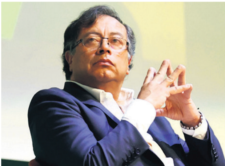
El presidente Gustavo Petro en uno de sus peores momentos

"He solicitado renuncia protocolaria a ministras, ministros y directores de departamentos administrativos. Habrá algunos cambios en el gabinete para lograr mayor cumplimiento en el programa ordenado por el pueblo",