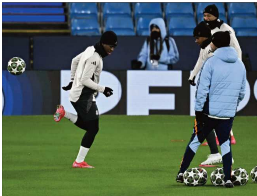
REALISTAS. Jugadores del Real Madrid durante su práctica en Manchester.

Real Madrid, vigente campeón de Europa, se mide hoy (16.00 HB) al Manchester City en el Etihad en la ida del playoff de la competición europea con la defensa en cuadro, lo que fuerce a colocar al uruguayo Fede Valverde como lateral para detener al noruego Erling Haaland.