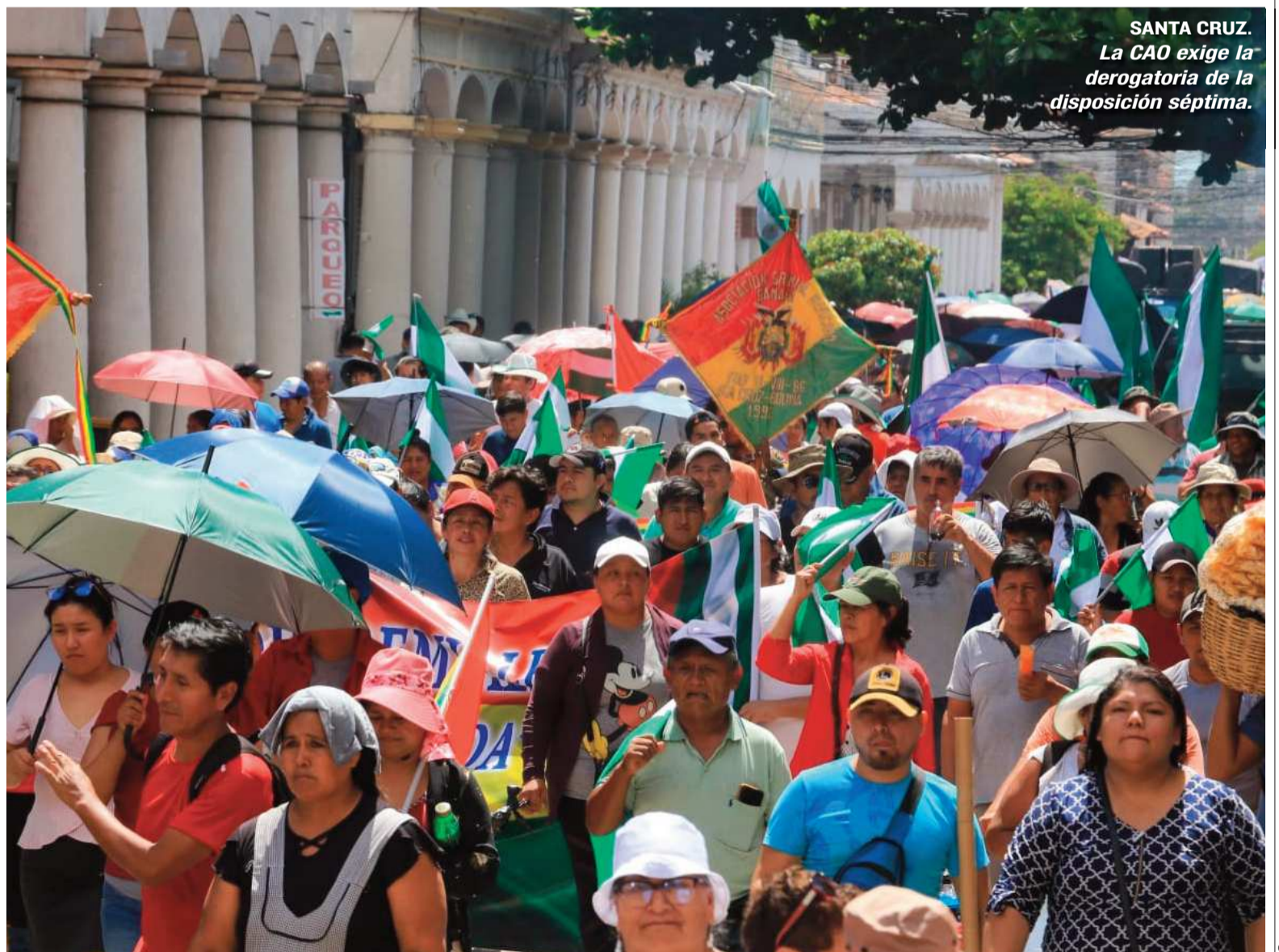
SANTA CRUZ. La CAO exige la derogatoria de la disposición séptima.