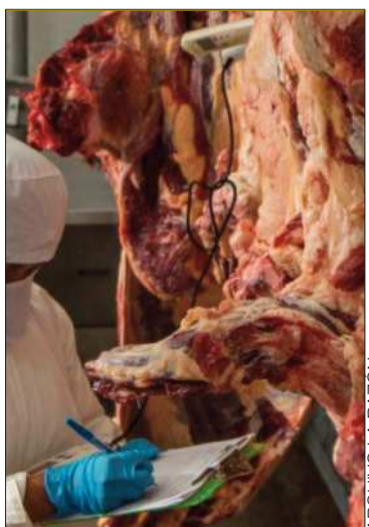
Exportación de carne de res.