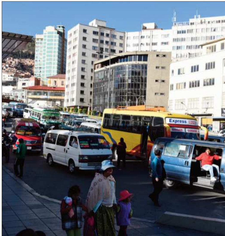
SERVICIO. El transporte público insiste en incrementar las tarifas.

"Vamos a entregar en los plazos acordados este estudio que es