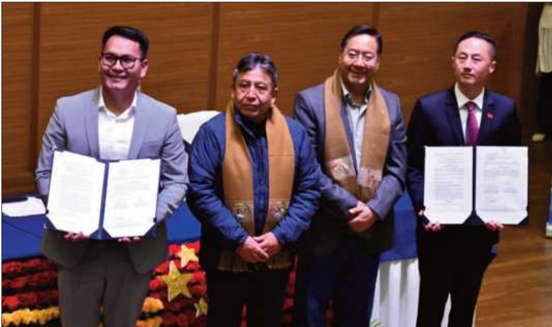
ACTO. Firma de contrato de extracción de litio entre la boliviana YLB y Hong Kong CBC.