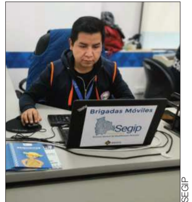
Brigadas se movilizan en el país.

Asimismo, los equipos móviles completan agendas de tareas intensas. Para esta semana, se tiene programada la visita a Sorata, Combaya, Curva, Waldo Ballivián, Chua Cocani, Licoma, Huarina y Copacabana, en el departamento de La Paz; Roboré, Mairana, Samaipata, Okinawa Uno y Buena Vista, en Santa Cruz; San Pedro de Buena Vista y Cotagaita, Potosí; y Padilla y Zudáñez de Chuquisaca.