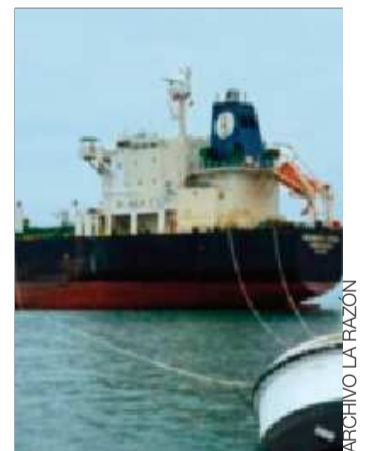
Buques con combustibles.

De acuerdo con el funcionario, la estatal trabaja de manera ininterrumpida en todas sus plantas de almacenaje, operando 24 horas al día para atender cualquier alerta de combustible o sobredemanda en las estaciones de servicio a lo largo del territorio nacional.