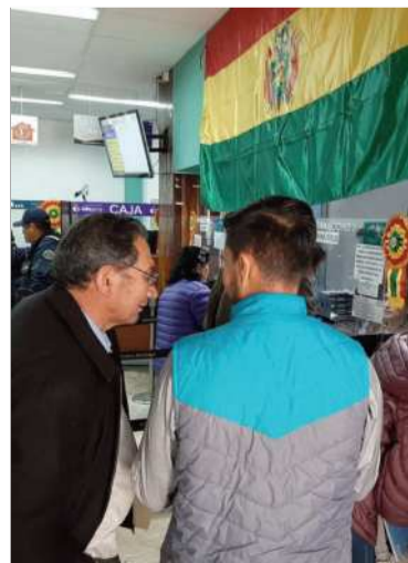
Dan información en la ATM.

La mayoría de los pagos se hicieron por impuestos de bienes inmuebles