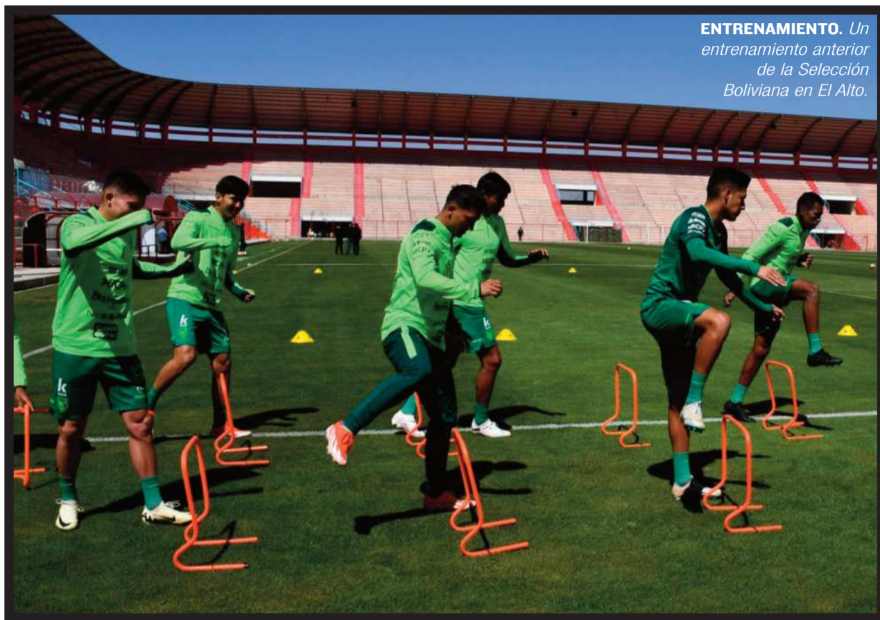
ENTRENAMIENTO. Un entrenamiento anterior de la Selección Boliviana en El Alto.

► La Selección Boliviana irá a Lima el 18 en charter para jugar con Perú por eliminatoria