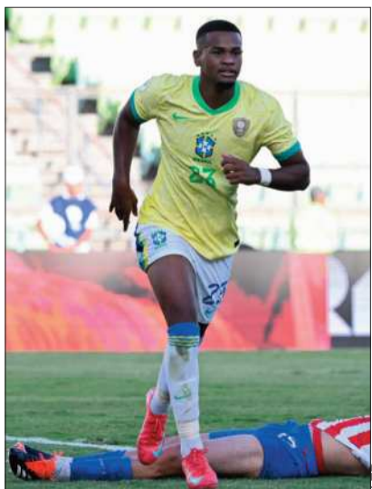
Los brasileños celebran su pase.