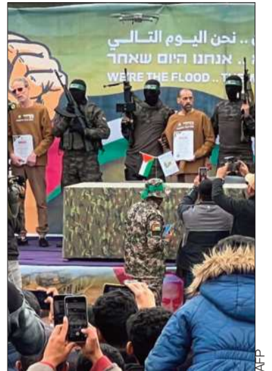
El último canje fue el sábado

Washington. "Egipto mantiene su posición de rechazar cualquier compromiso sobre los derechos (de los palestinos), inclusive su derecho a la autodeterminación, a seguir en su tierra y a la independencia", añadió. Con la tregua en riesgo de desmoronarse, el presidente de Estados Unidos, Donald Trump, calificó de 'terrible' la amenaza de Hamás de aplazar la próxima liberación de rehenes y dijo que se desatará un 'infierno' si no "los traen a todos de vuelta antes del mediodía del sábado".