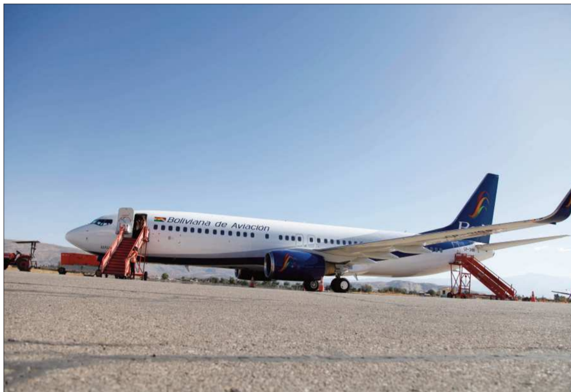
EMPRESA. Un avión de la estatal Boliviana de Aviación (BoA) en el aeropuerto de Cochabamba.

"A la fecha tenemos acciones sanciones, procesos primordialmente por brindar información falsa o incompleta al usuario. Están habiendo diferentes hechos en los que tiene que ver la seguridad aeronáutica u otros factores y lamentablemente el operador aéreo no informa", dijo Ríos a los medios de comunicación.